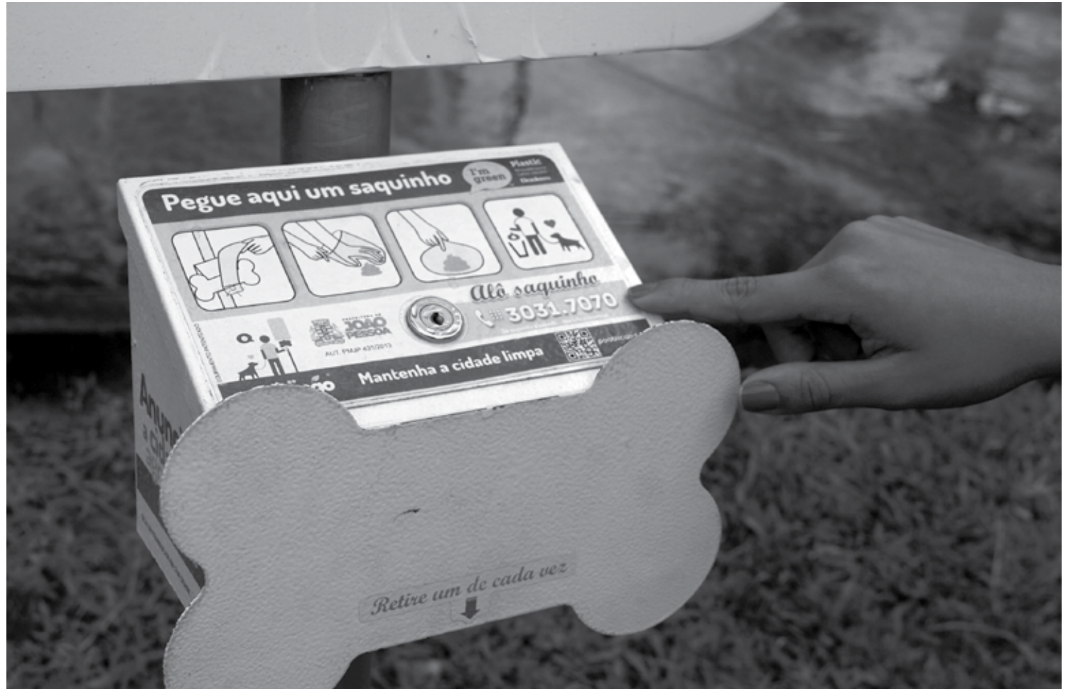
Encontrar coletores sem o saquinho para recolher as fezes dos cães é comum, mas as pessoas têm como solicitar o reabastecimento pelo telefone