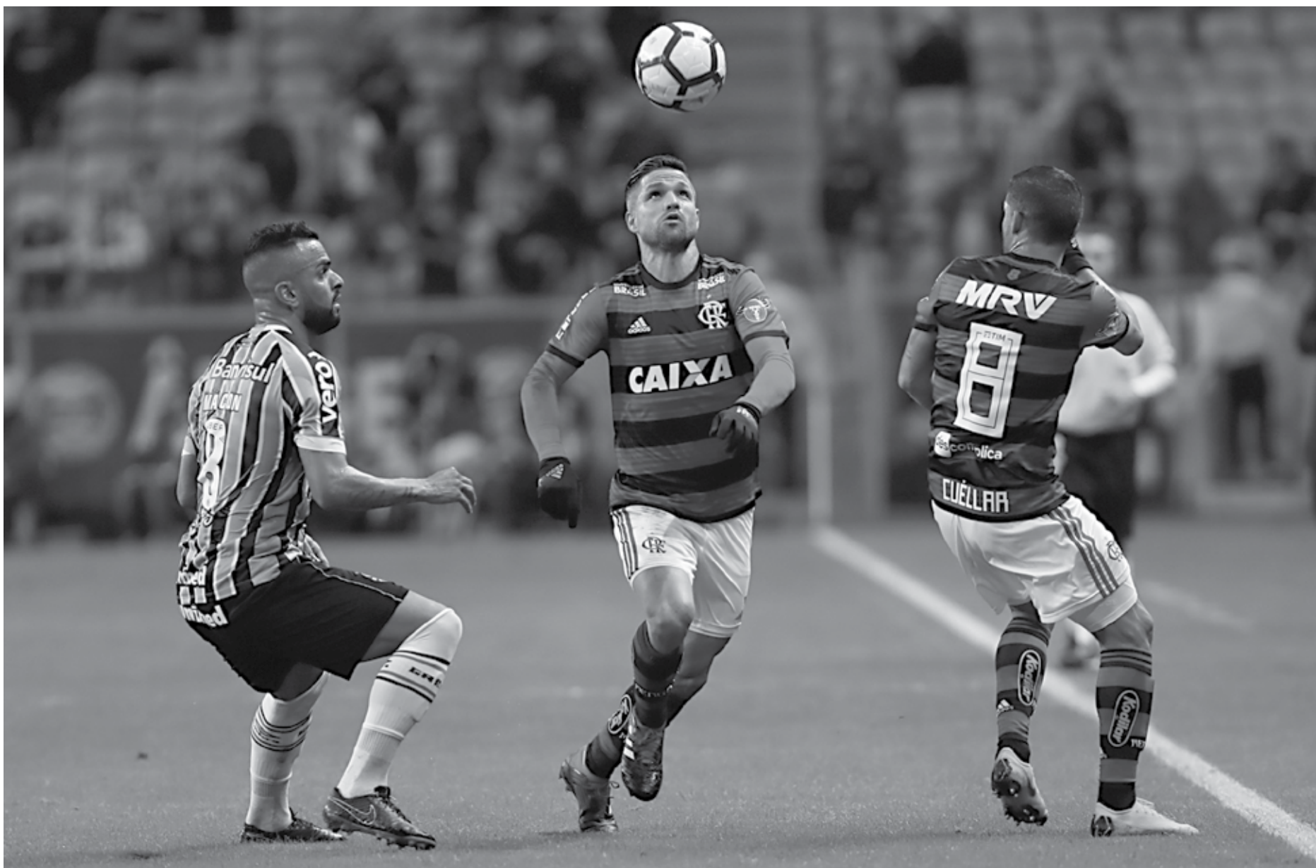
Depois de se enfrentarem no meio de semana pela Copa do Brasil, Grêmio e Flamengo prometem outro jogão hoje em Porto Alegre, desta vez pelo Campeonato Brasileiro da Série A

Enquanto o Corinthians é o 7º lugar com 25 pontos, o Furacão tem apenas 13 pontos e está na zona de rebaixamento, na 18ª posição.