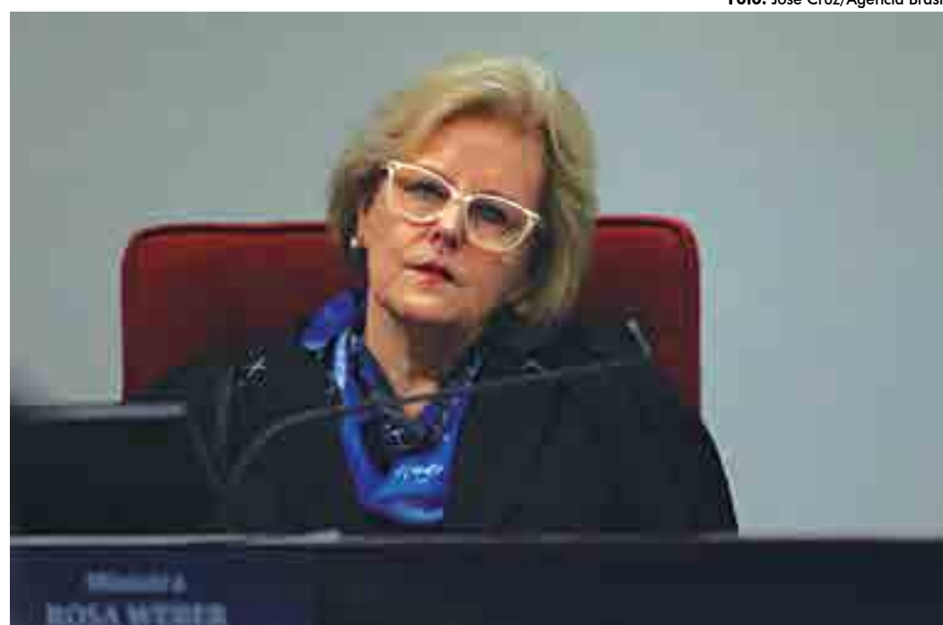
A relatora da ação no STF, ministra Rosa Weber, decidiu marcar audiência pública para ouvir especialistas

Na primeira parte da audiência, 14 convidados falaram favoravelmente à descriminalização do procedimento, destacando direitos da mulher como dignidade e cidadania e alertando para casos de violência doméstica, gravidez indesejada na adolescência, entre outros relatos que levam milhares de mulheres a buscar métodos clandestinos de aborto. A principal preocupação desses especialistas são as complicações e mortes ocasionadas, de certa forma, pelas dificuldades devidas à criminalização do ato. Eles argumentam que, deixando