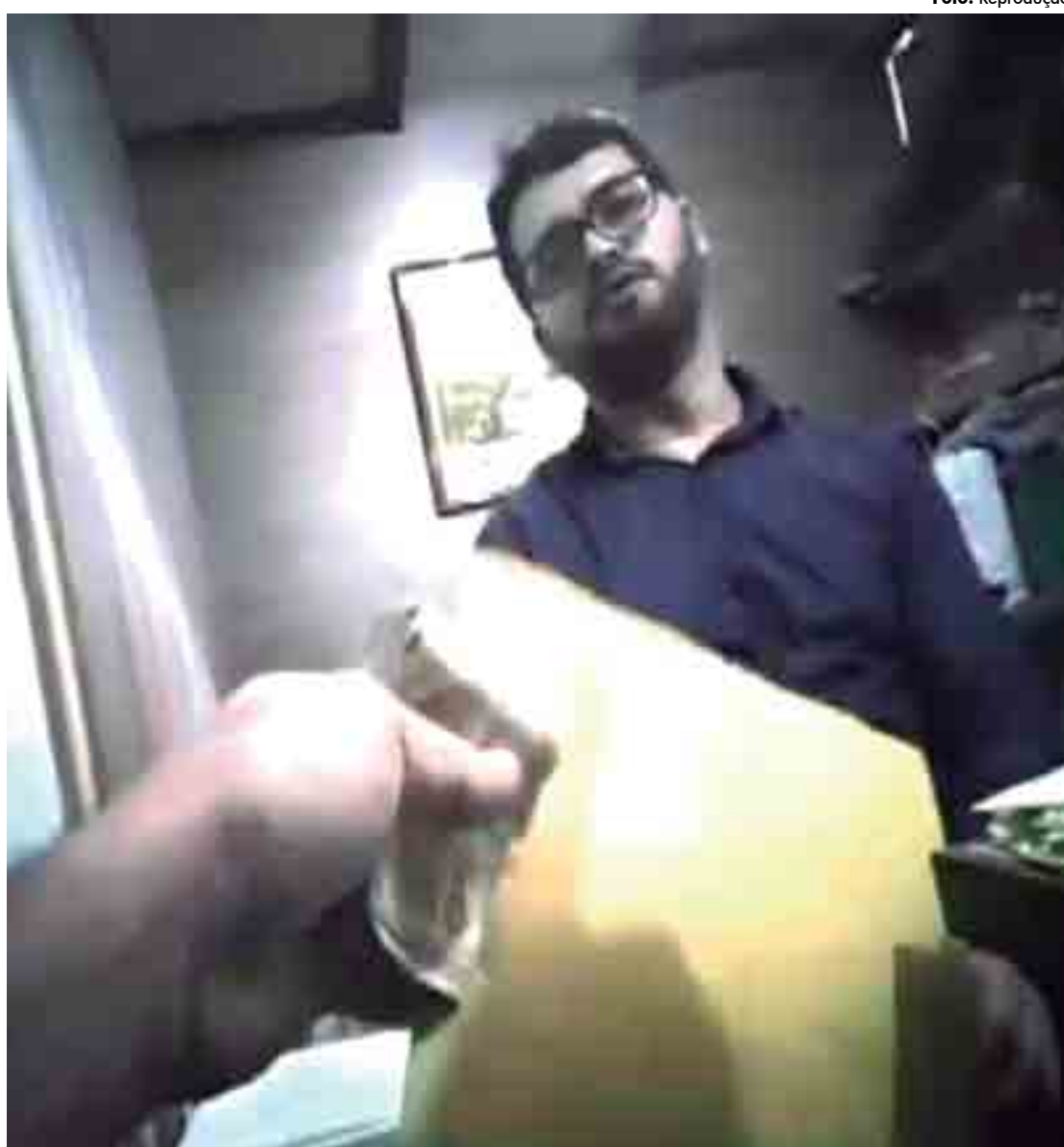
O prefeito afastado foi preso em flagrante no dia 5 de abril de 2017, em uma ação conjunta do MP e da Polícia Civil

O órgão ministerial solicitou, na denúncia, a perda do cargo de prefeito de Berg Lima, além do emprego, função ou mandato eletivo e fixação do valor mínimo de reparação por danos morais e materiais. A acusação foi resultado de procedimento investigatório criminal nº 007/2017/GAECO/PB, realizado em conjunto com a Polícia Civil do Estado.