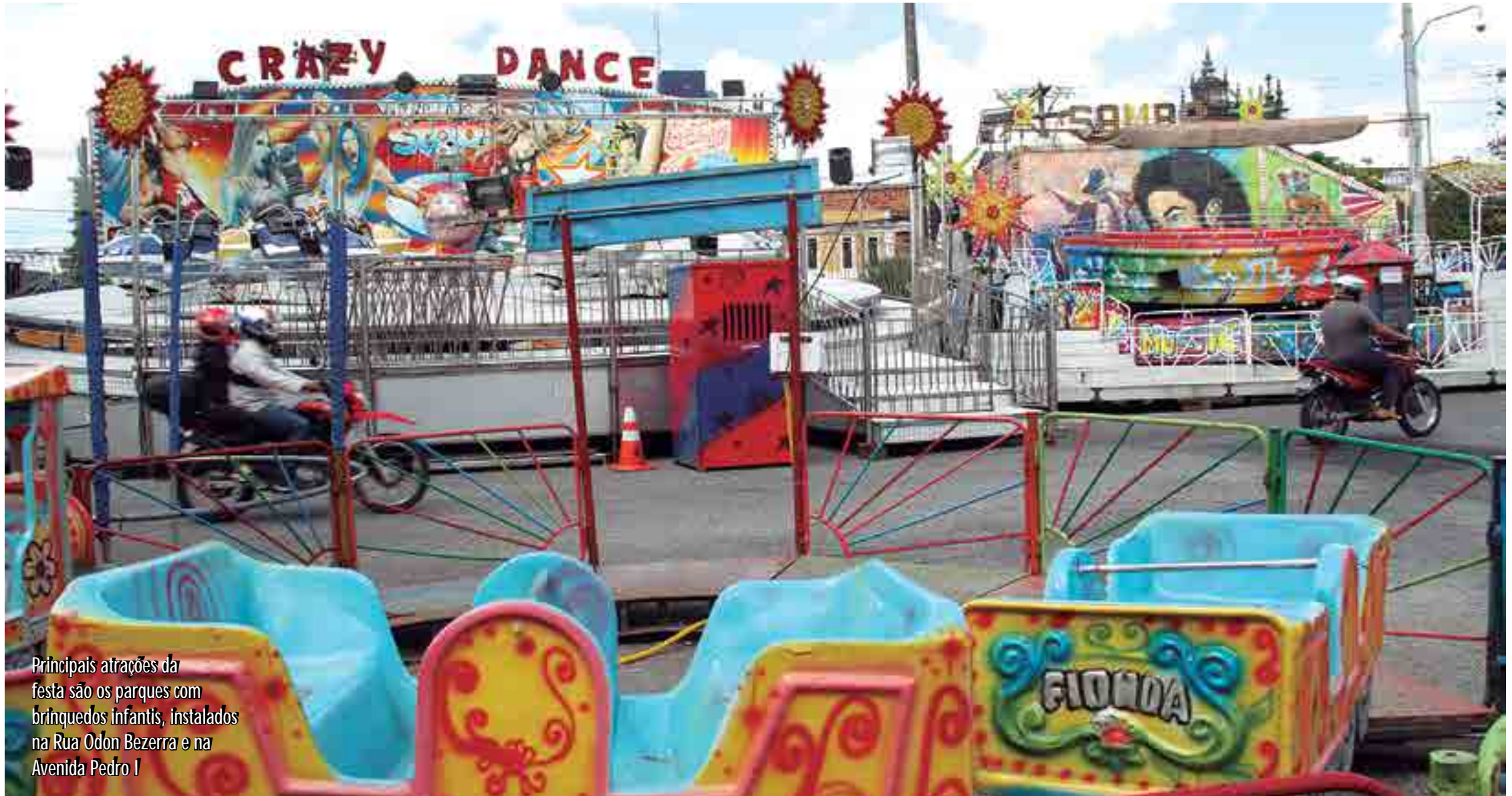
Principais atrações da festa são os parques com brinquedos infantis, instalados na Rua Odon Bezerra e na Avenida Pedro I