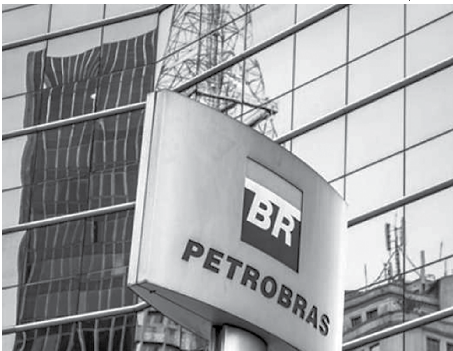
No mesmo período, o endividamento líquido caiu 13% em relação a dezembro de 2017, indo para US$ 73,66 bilhões, o menor desde 2012

O edital publicado nessa quinta-feira (2) pela estatal fixou para o dia 31 a realização do segundo leilão de petróleo da União na área do pré-sal, abrindo a possibilidade de comercialização do óleo produzido para contratos de 36 meses. A ampliação do prazo resultou de sugestão aceita pela Pré-Sal Petróleo durante consulta pública realizada entre os dias 17 e 25 de julho, que recebeu 34 comentários.