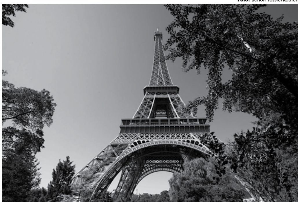
A Torre Eiffel, monumento francês dos mais visitados no mundo, voltou a receber todos os turistas