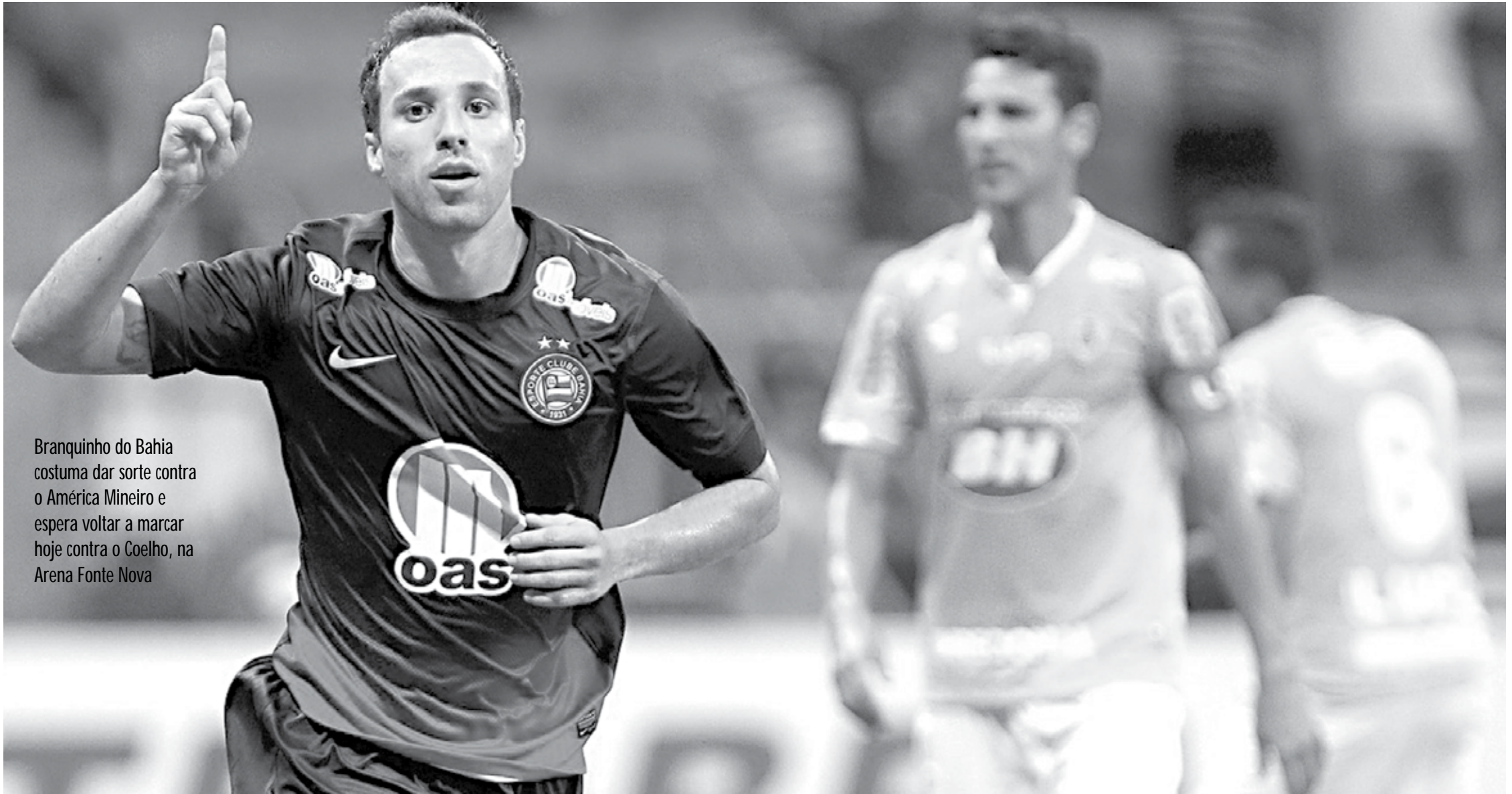
Branquinho do Bahia costuma dar sorte contra o América Mineiro e espera voltar a marcar hoje contra o Coelho, na Arena Fonte Nova