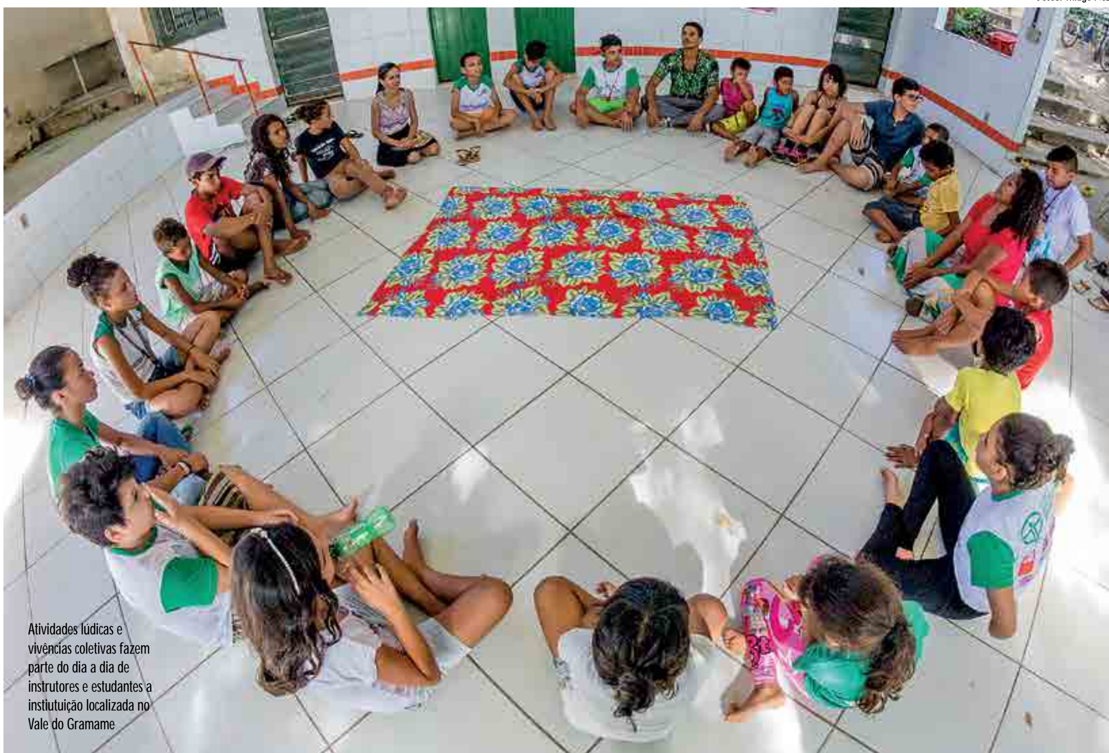
Atividades lúdicas e vivências coletivas fazem parte do dia a dia de instrutores e estudantes a instituição localizada no Vale do Gramame