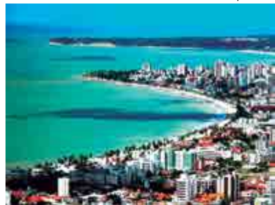
Foto aérea de João Pessoa/PB.