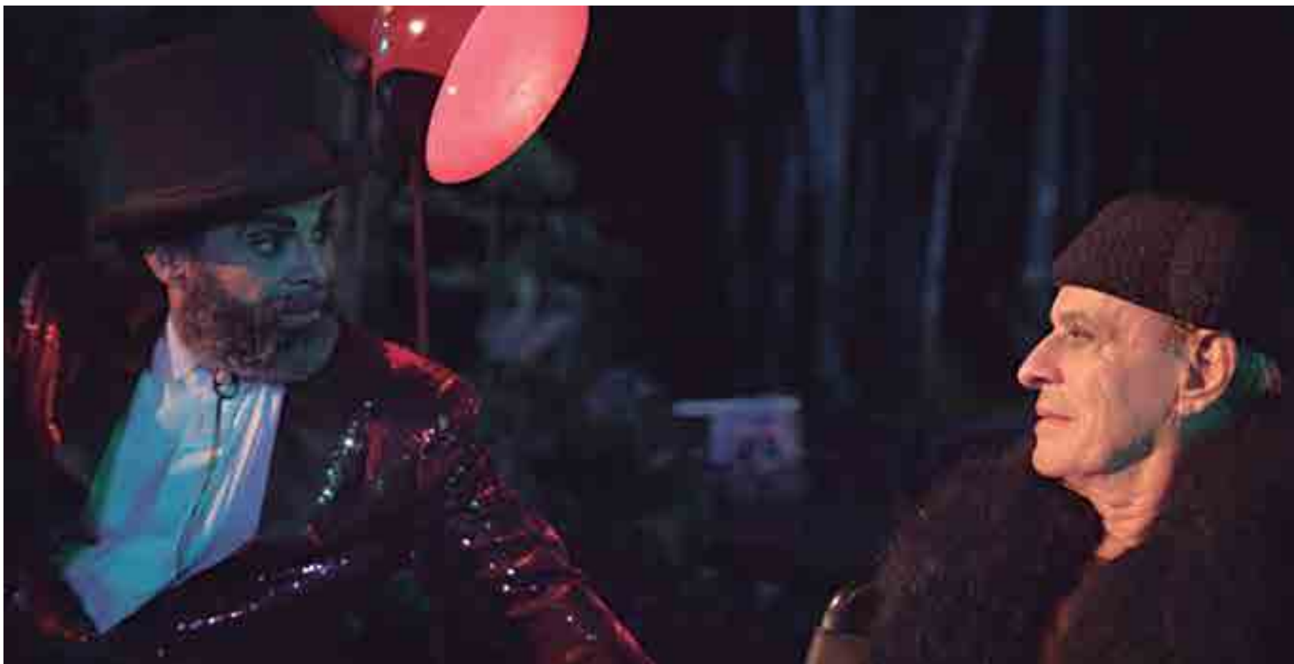
Cena de 'Sol Alegria', dirigido por Tavinho Teixeira e Mariah Teixeira e que é uma obra de ficção cuja história se passa em uma remota nação conflagrada por causa de turbulências políticas

A curadoria do evento priorizou, para esta edição de 2018, filmes que sejam capazes de gerar uma discussão que ultrapasse o ambiente da sala de cinema