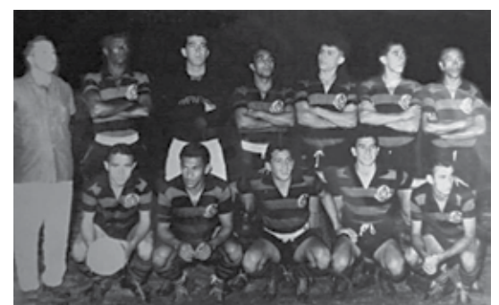
SPORTING DE PORTUGAL DE 66/67