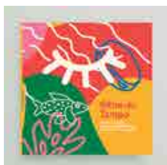
Mestra Doci ladeada pelas crianças atendidas na unidade (destaque), a capa da publicação e fotos que registram as diferentes atividades educativas realizadas na EVOT