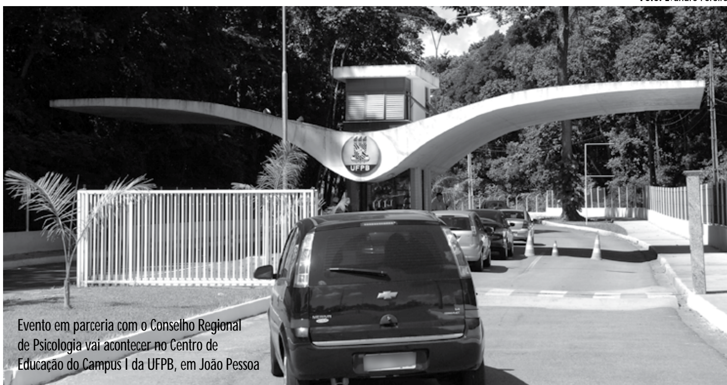
Evento em parceria com o Conselho Regional de Psicologia vai acontecer no Centro de Educação do Campus I da UFPB, em João Pessoa