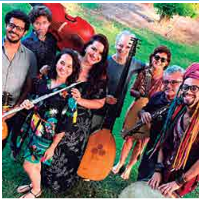
Grupo Camena se apresenta no Centro Cultural São Francisco