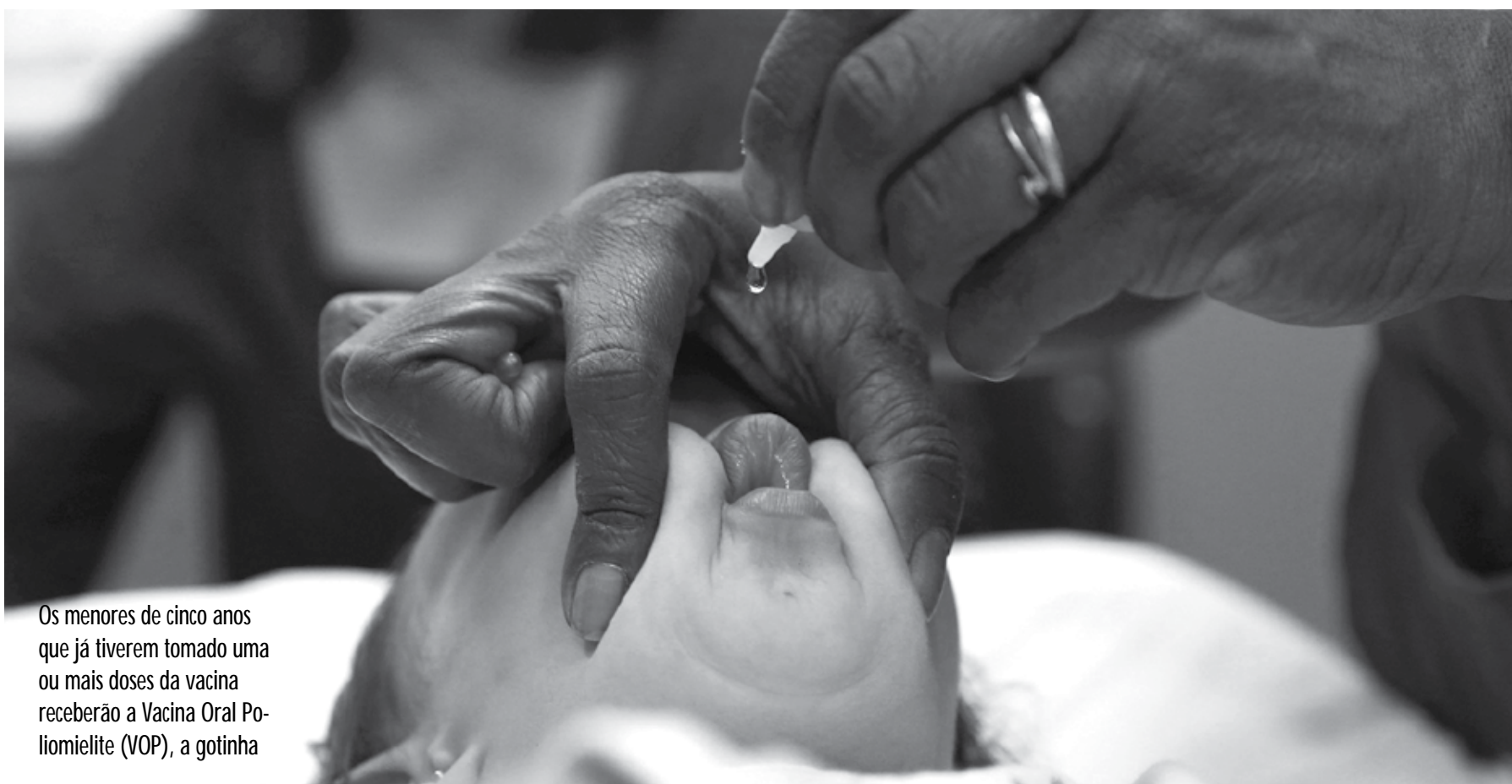
Os menores de cinco anos que já tiverem tomado uma ou mais doses da vacina receberão a Vacina Oral Poliomielite (VOP), a gotinha