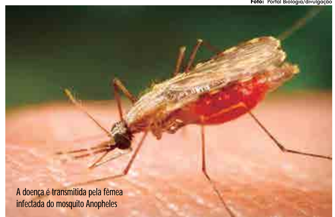
A doença é transmitida pela fêmea infectada do mosquito Anopheles

No Brasil, a maioria dos casos se concentra na região amazônica, nos estados do Acre, Amapá, Amazonas, Maranhão, Pará, Mato Grosso, Pará, Rondônia, Roraima e Tocantins. Nas demais re-