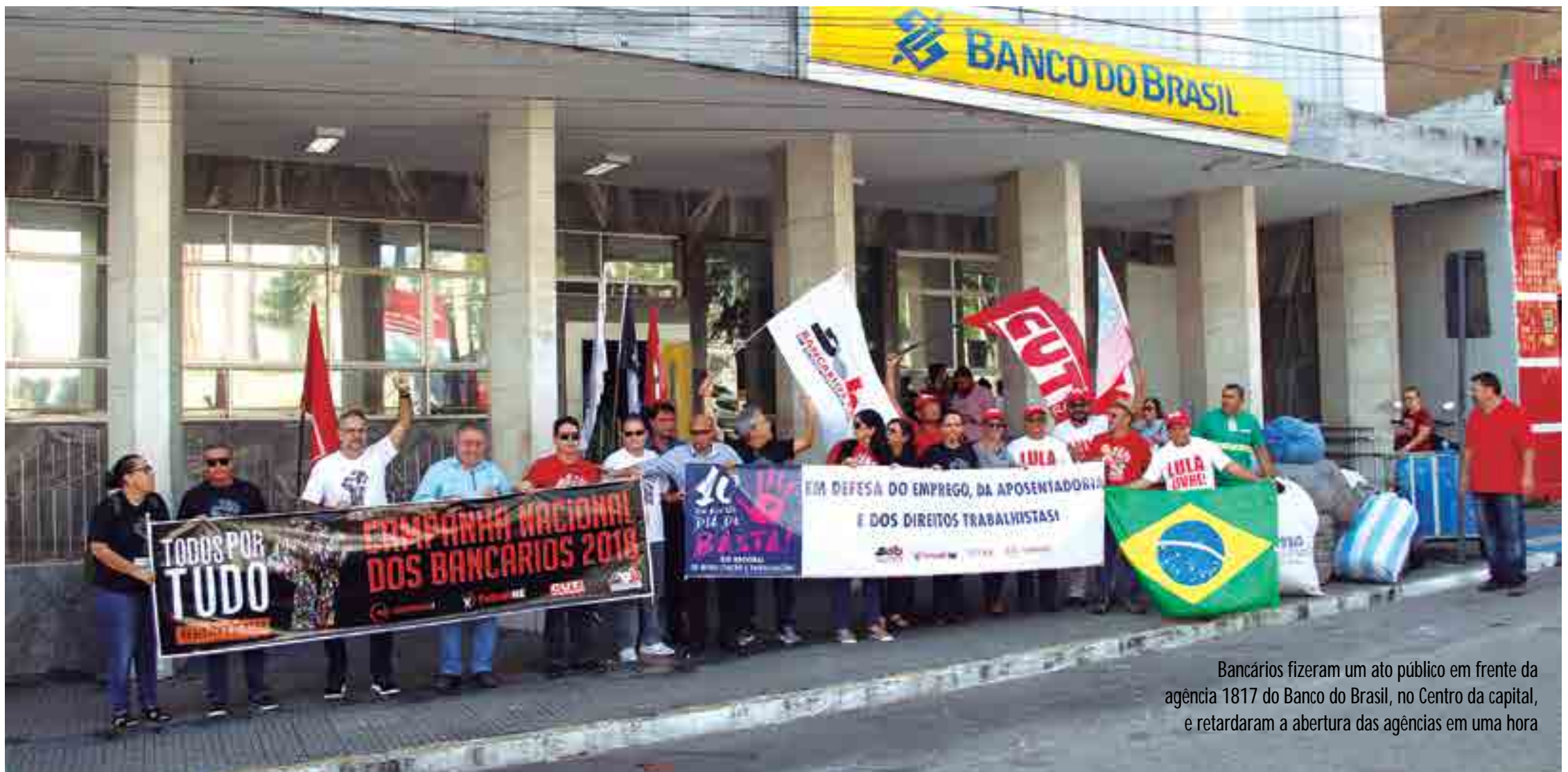
Bancários fizeram um ato público em frente da agência 1817 do Banco do Brasil, no Centro da capital, e retardaram a abertura das agências em uma hora