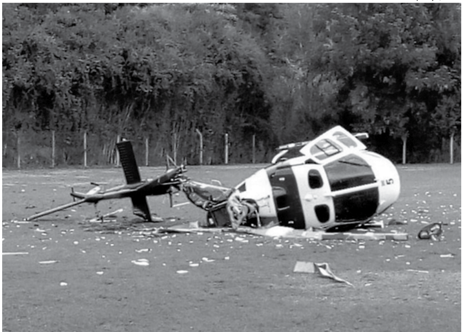
De acordo com a assessoria do governo estadual, Hartung e os demais passageiros que estavam no helicóptero não sofreram ferimentos e passam bem

O acidente foi na fazenda do Instituto Capixaba de Pesquisa, Assistência Técnica e Extensão Rural (Incaper), órgão vinculado ao Governo do Estado