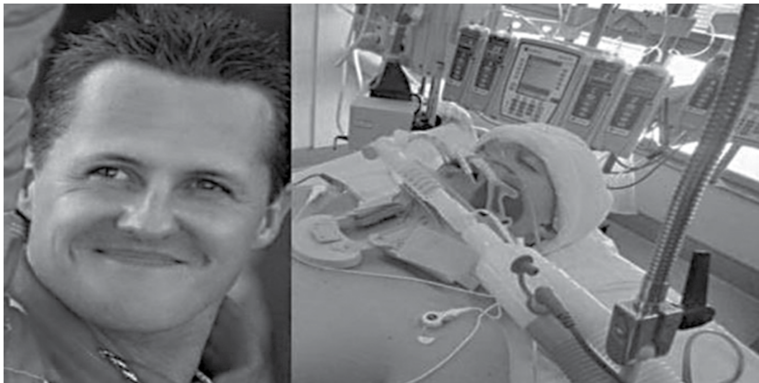
O ex-piloto de Fórmula-1 segue o seu tratamento depois do acidente com esqui na França, mas as informações sobre estado de saúde seguem misteriosas