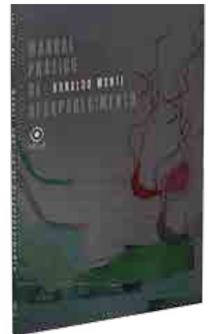
Último livro lançado por Ronaldo Monte foi o 'Manual Prático de Desaparecimento & Outros Poemas'