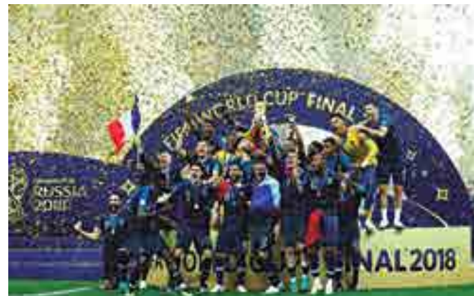
O título mundial foi decisivo para a seleção francesa alcançar o topo

Os anfitriões da Copa, aliás, foram os que mais subiram: 21 colocações, aparecendo agora em 49º. São quatro as novas seleções no Top 10: a vice-campeã mundial Croácia (4º), Uruguai (5º), Inglaterra (6º) e Dinamarca (9º). Saíram desse grupo, Argentina (11º), Polônia (18º) e Chile (12º) e quem mais chama a atenção pela queda, a ex-primeira colocada Alemanha. A defen-