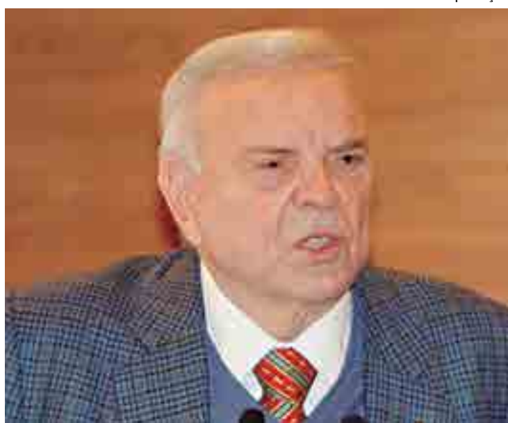
A sentença da condenação sai no dia 22, mas deve ficar em 10 anos de prisão