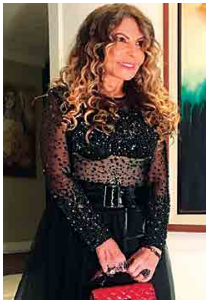
Elba Ramalho comemora mais uma primavera nesta sexta