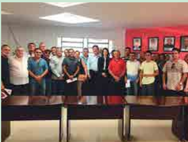
Clubes amadores e ligas participaram de reunião com o interventor