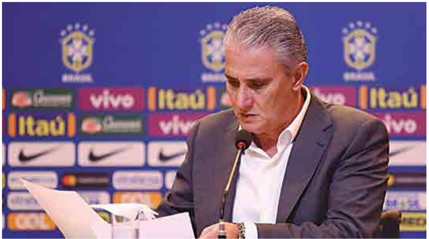
Tite vai mostrar a lista dos jogadores que vão disputar dois amistosos no mês de setembro e expectativa é que muitas novidades sejam anunciadas