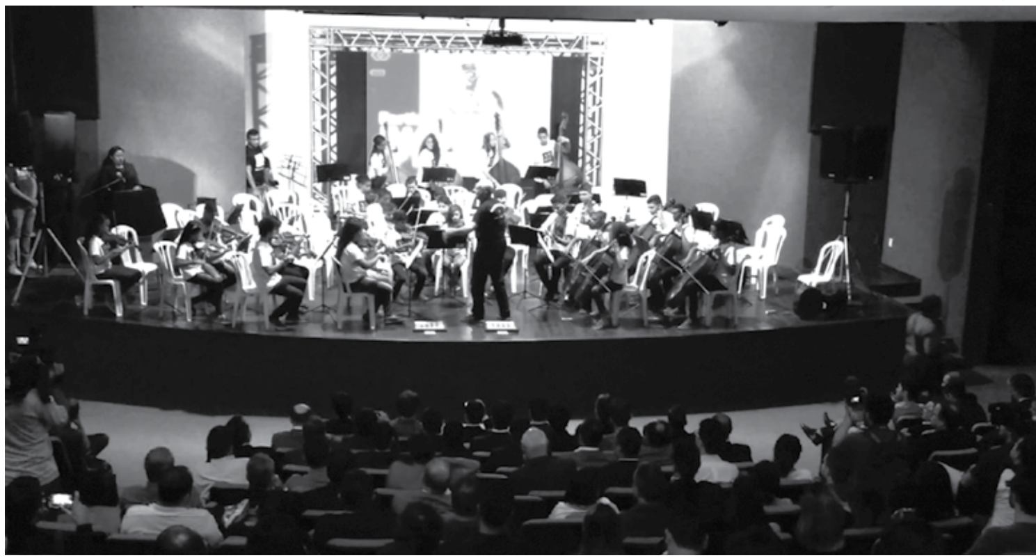
A importância da tecnologia e da participação social no combate à corrupção foi destaque na abertura do 'IV HackFest + Virada Legislativa – Por uma sociedade Politicamente Participativa'