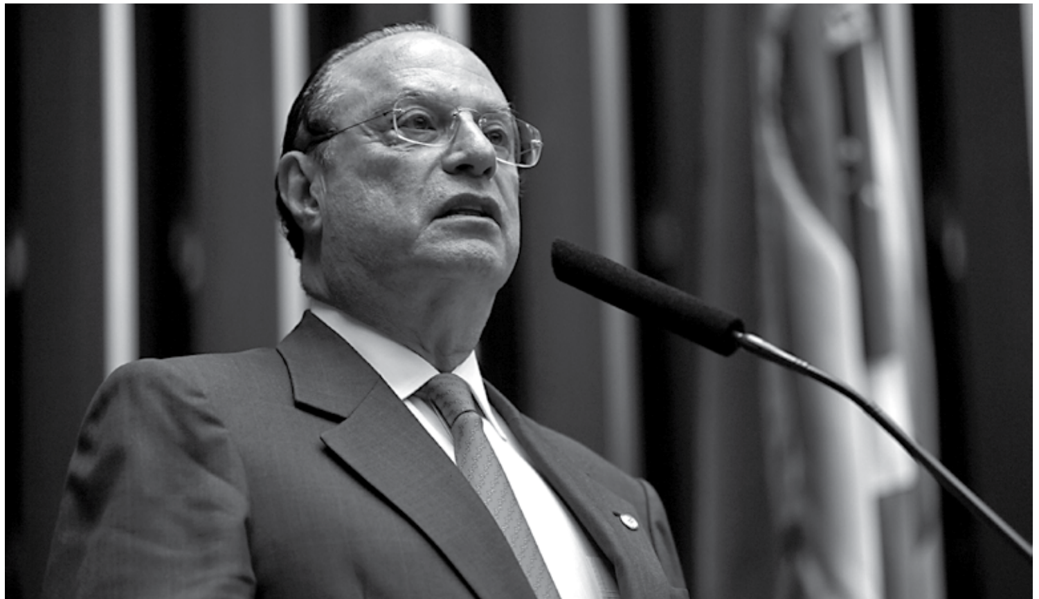
Maluf cumpre pena de 7 anos e 9 meses de reclusão em casa, após condenação por desvios de recursos em obras quando foi prefeito da capital paulista

No mês de maio, o parlamentar afastado foi novamente condenado, por unanimidade, pela Primeira Turma STF por falsidade ideológica com fins eleitorais devido a fraudes na prestação de contas de sua campanha eleitoral de 2010. A pena é de 2 anos e 9 meses de prisão em regime semiaberto, convertido para domiciliar.