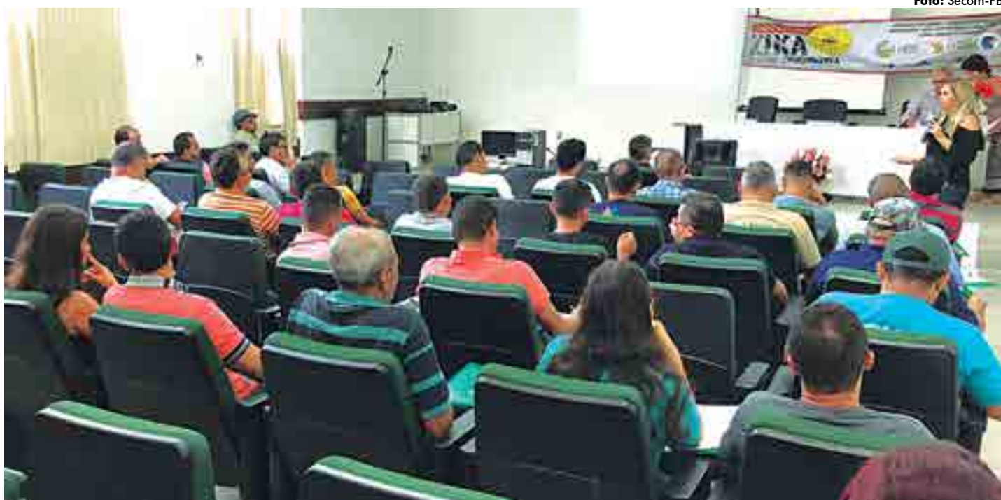
Profissionais dos 25 municípios da 1ª GRS que trabalham no controle do calazar, dengue, zika e chikungunya participaram do evento no Cefor-PB

Os inseticidas são fornecidos pelo Ministério da Saúde e administrados pelo Estado, que tem a competência de gerenciar todos os insumos e dar suporte