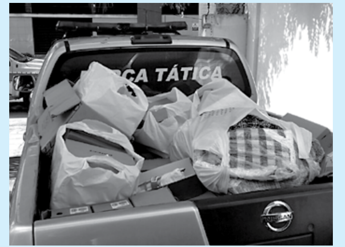
Além de roupas e calçados, a polícia apreendeu munições de fuzil