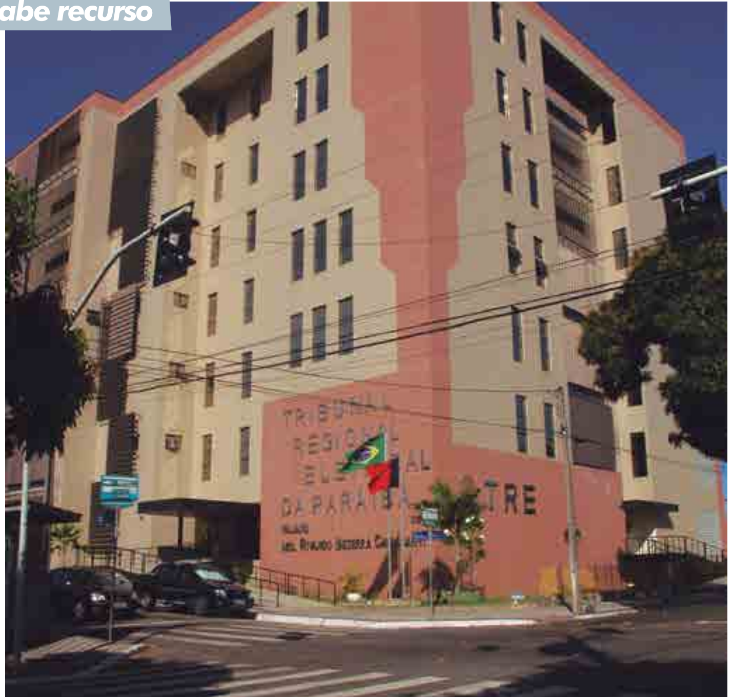
Os 36 pedidos de impugnação às candidaturas divulgados pelo Tribunal Regional Eleitoral da Paraíba foram feitos até a tarde dessa terça-feira (21)