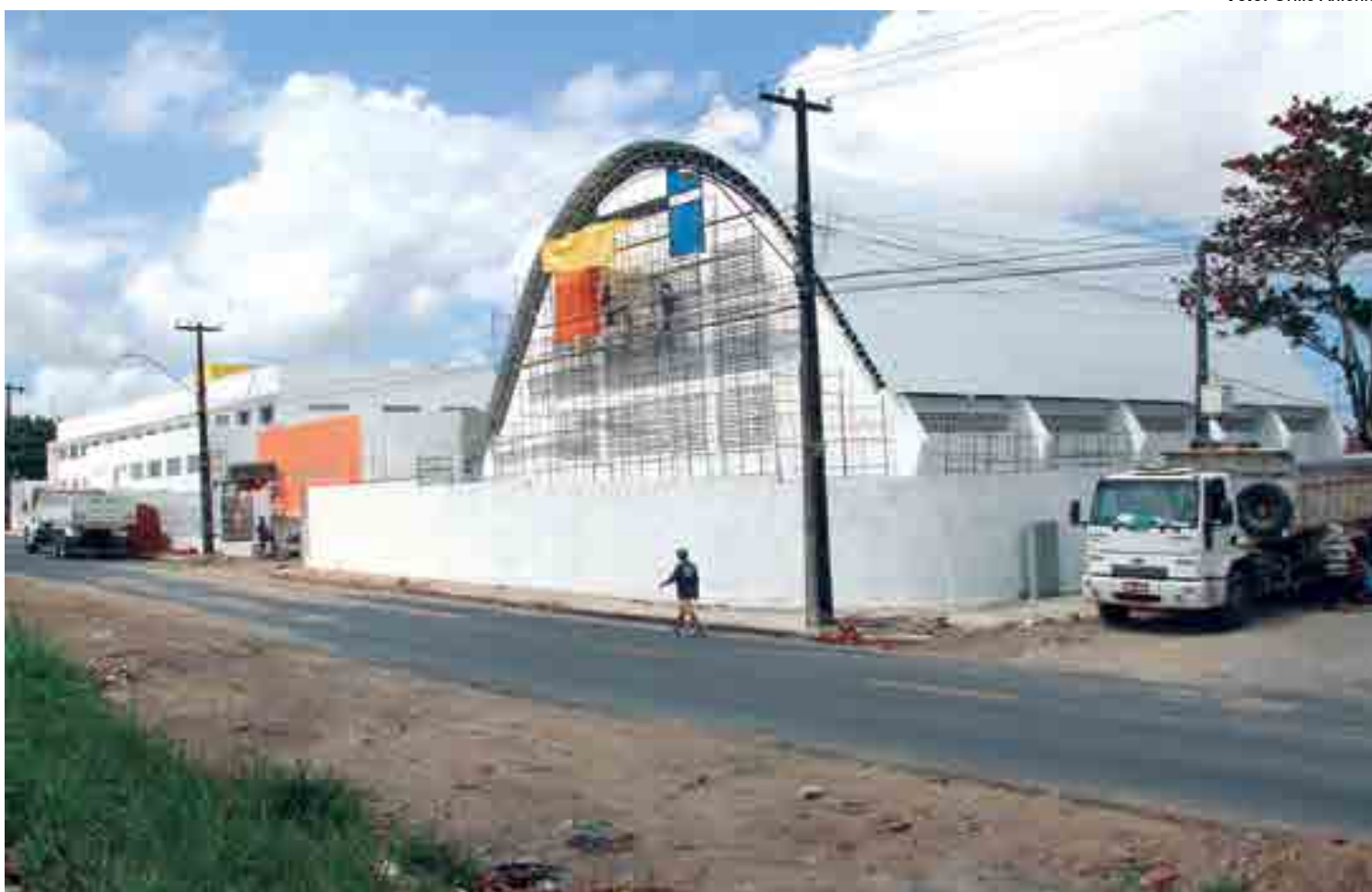
Construção da nova escola do bairro Costa e Silva, em João Pessoa, é um dos exemplos de investimentos que se destacam na área educacional da Paraíba

balho foi realizado através de ações de reestruturação da rede educacional da Paraíba. "Tinha muita escola que não era escola, tinha escolas em casas, que o primeiro andar era Ensino Médio, o térreo era Ensino Fundamental. Tinha poucos alunos e pouca aprendizagem na escola. Isso consome recursos que não