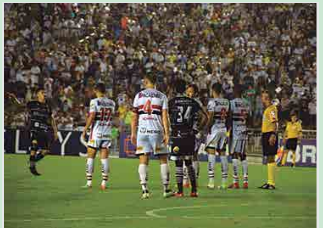
Depois de vencer o Botafogo de Ribeirão Preto, o Belo toma as suas precauções para o jogo de volta