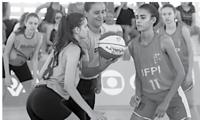
A cidade de Joinville, em Santa Catarina, sediará os jogos de basquete

Estamos no processo final de escolha dos locais de competição e estamos satisfeitos. Alguns locais estão sendo readequados às necessidades dos Jogos Escolares da Juventude e estamos jun-