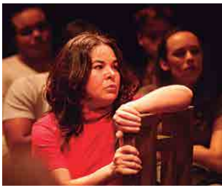
'Mercedes', da Companhia Galharufas, será encenada amanhã em Sousa

Os 17 dias de programação do Paraíba EnCena envolvem debates, conversações, mais de 30 oficinas e apresentações dos grupos. O projeto é aberto ao público e abriga diversas linguagens artísticas, como a dança, o circo e o teatro. Todos os grupos citados também realizam, além das apresentações, as oficinas do projeto.