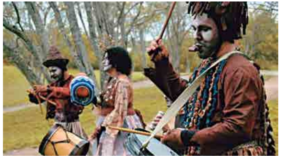
A peça 'Troca-se histórias por brincadeiras', do grupo Arretado Produções, será encenada amanhã, em Patos; enquanto a apresentação de 'Palavra de rei', da Companhia Café com Pão, acontece hoje no Distrito de Jenipapo, em Campina Grande