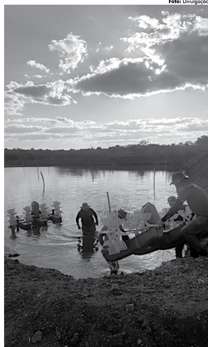
A criação de camarão em cativeiros também chegou na região do Cariri

"A criação de camarão no Cariri e Sertão paraibano é um negócio não apenas viável, mas também inovador e criativo. Com o diferencial da Transposição, agora a região poderá desenvolver outros potenciais econômicos, incluindo novas plantações de palma forrageira", afirmou o analista do Sebrae, Jucieux Palmeira.