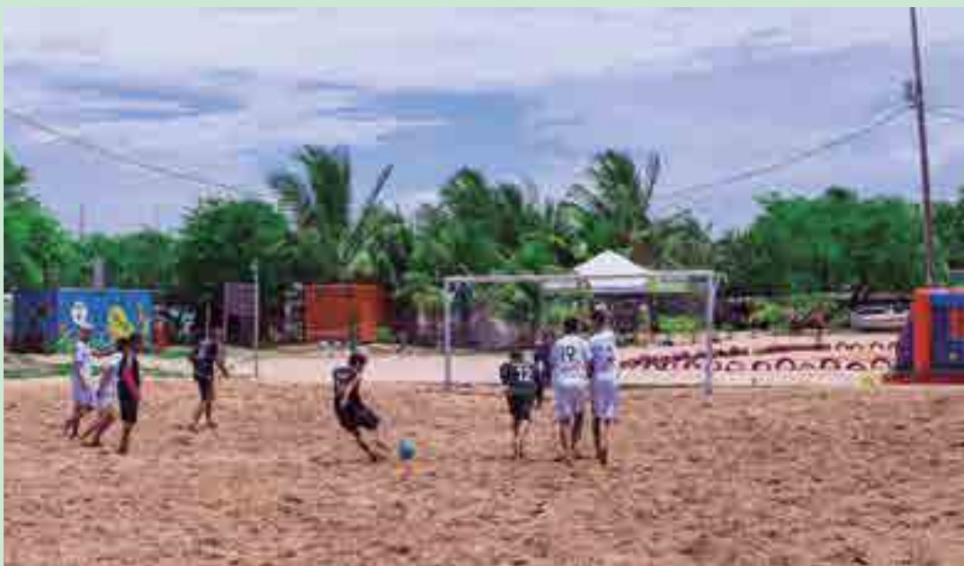
Várias atividades esportivas foram realizadas durante o aniversário da cidade de Cabedelo no fim de semana