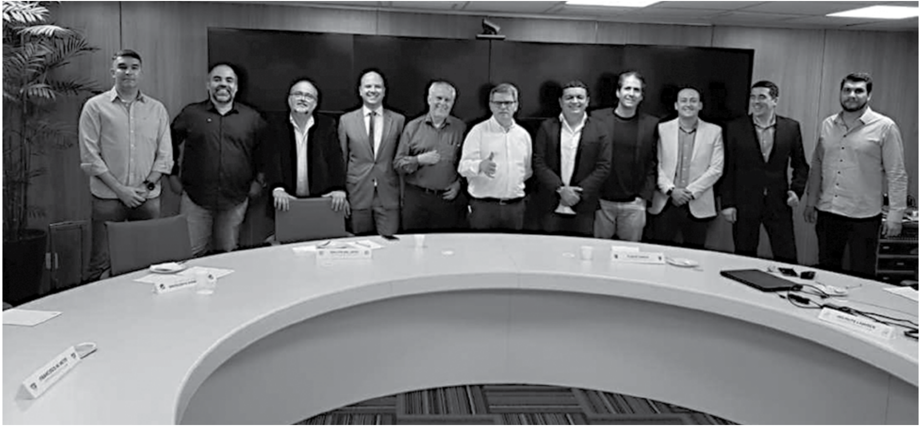
Dirigentes dos clubes integrantes da Série C do Campeonato Brasileiro se reuniram na sede da CBF discutindo o planejamento, bem como a logística dos clubes, principalmente as equipes do Grupo B

Os clubes presentes na reunião, acataram a ideia da CBF e, também, se colocaram à disposição para ajudar em busca de novos contratos, já que todas as demais propriedades poderão ser comercializadas pelos clubes, exceto os direitos de transmissão. Ex: Placas de Campo e Na-