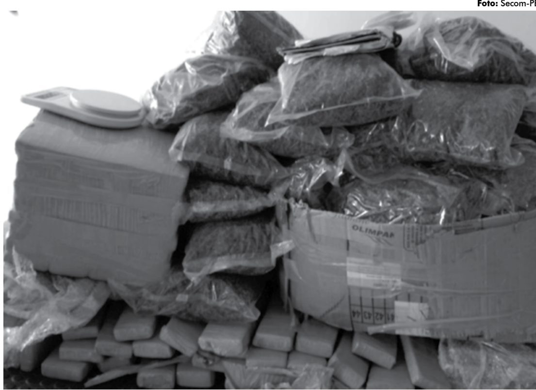
Carregamento de maconha estava sendo entregue na comunidade Bola na Rede, no Bairro dos Novais, em João Pessoa

Todo o material foi levado para a sede da Polícia Federal, em Cabedelo.