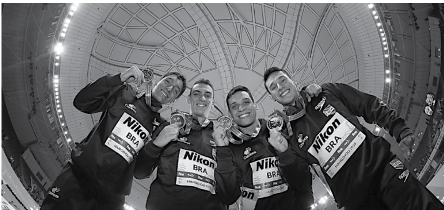
A nova geração da natação brasileira brilhou no Mundial da China, abrindo boas perspectivas para as disputas dos Jogos Olímpicos de Tóquio em 2020