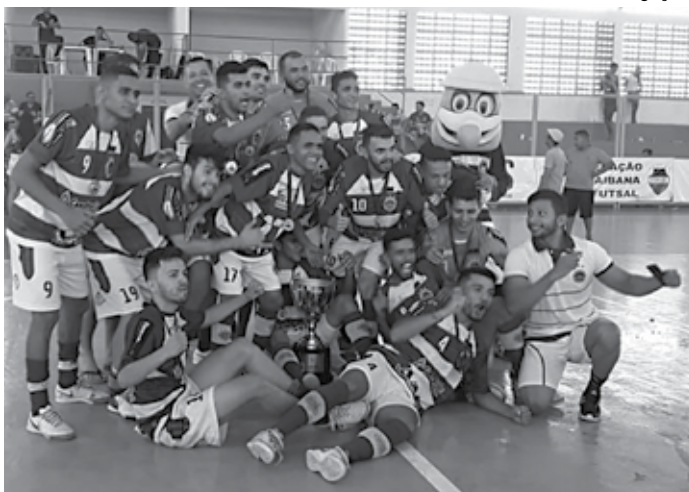
Jogadores do Brejo do Cruz comemoram mais uma conquista no futsal

Os donos da casa precisavam reverter o placar do jogo de ida, que aconteceu em terras pernambucanas, quando o Tamandaré venceu por 5 a