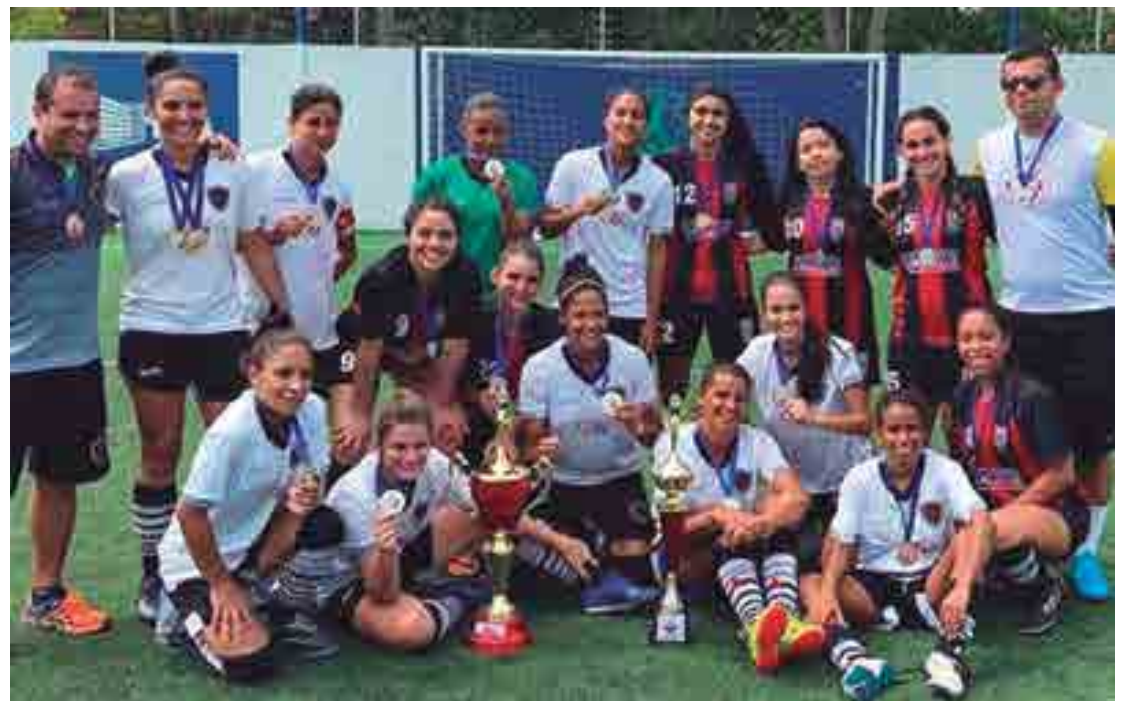
As Belas do Belo seguem imbatíveis no futebol feminino e conquistaram mais um troféu para a sua coleção