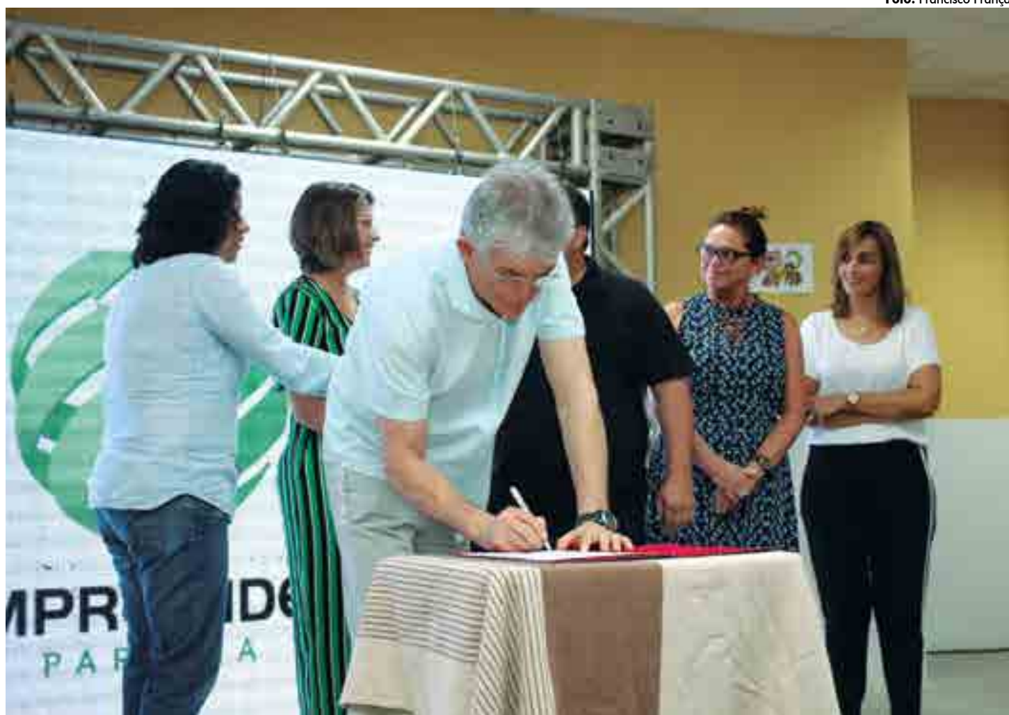
Assinatura dos contratos atende empreendedores de 10 municípios; na solenidade, foram entregues 11 motos da linha Empreender Motociclista