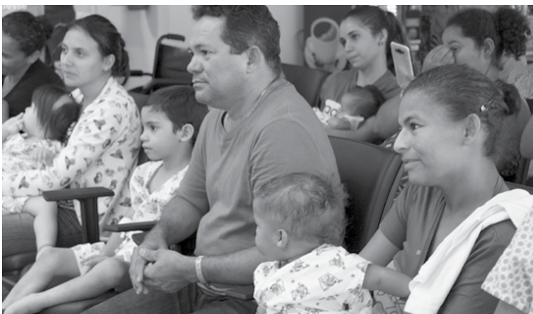
Pacientes, acompanhantes e funcionários assistiram à apresentação, que foi marcada por muita emoção

19h30, o coral de A Igreja de Jesus Cristo dos Santos dos Últimos Dias Estaca Torre, cantará um repertório de hinos natalinos, na recepção principal. Já na quinta-feira (20), às 10h, os colaboradores do hospital, que integram o grupo de voluntariado Bate-Coração, trarão o Papai Noel para alegrar os pacientes da unidade de saúde.