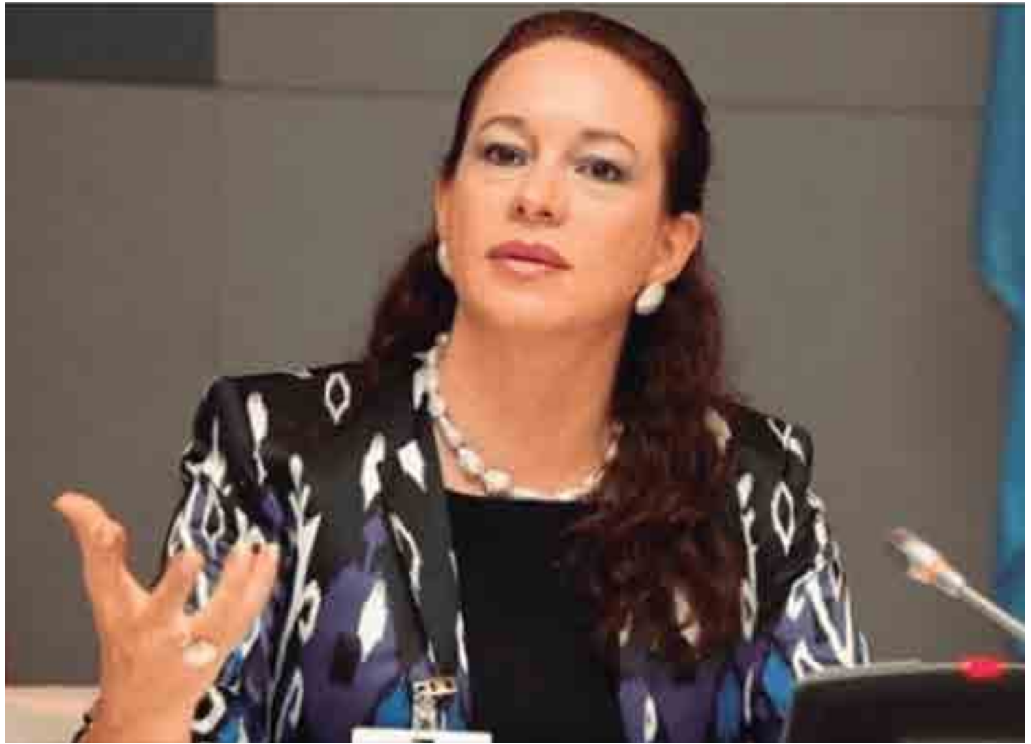
A equatoriana Maria Fernanda Espinosa presidiu a Assembleia Geral das Nações Unidas, que aprovou a adoção o Pacto Global sobre Refugiados

O pacto tem como principal objetivo fornecer diretrizes para a gestão de movimentos de massa de refugiados no mundo