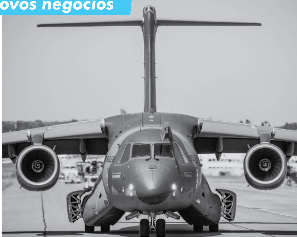
KC-390 é um avião de transporte tático desenvolvido para estabelecer novos padrões em sua categoria