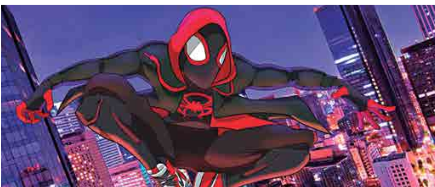
Animação Homem-Aranha no Aranhaverso arrecadou US$ 35 milhões na estreia e bateu com folga os números de WiFi Ralph, líder da semana anterior