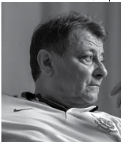
Cesare Battisti, ativista de esquerda italiano

produzidos no exercício do poder soberano a sua revisibilidade a qualquer tempo, visto que amparados em juízo estritamente político e sujeito às conjunturas sociais, tanto internas quanto externas", escreveu Fux.