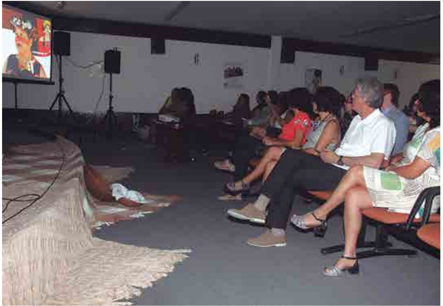
Governador Ricardo Coutinho participou do lançamento do documentário institucional "Caminhos pela Igualdade na Paraíba", no auditório da PBTur

Com depoimentos de indígenas, quilombolas, mulheres, negros, o documentário traz histórias