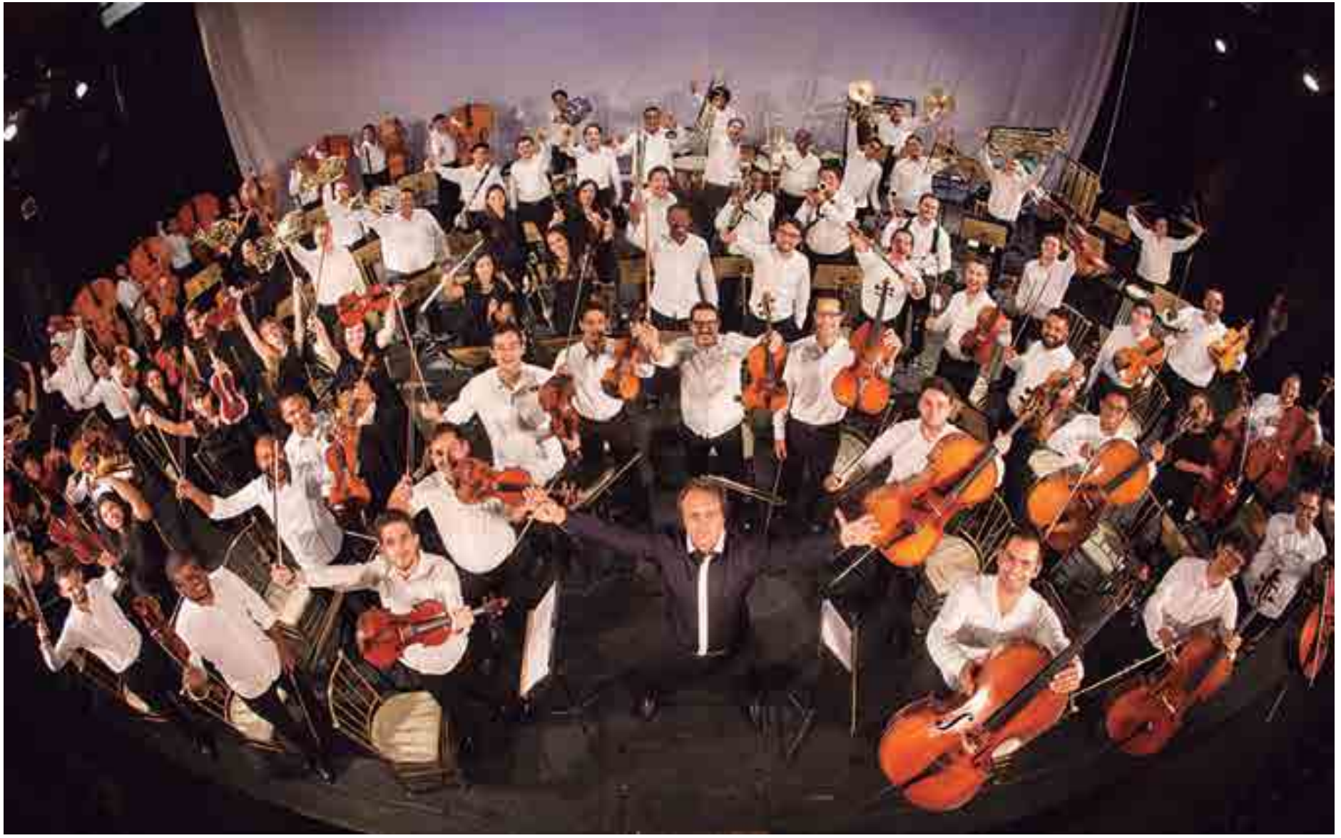
Os novos integrantes da Orquestra Acadêmica Mozarteum Brasileiro (OAMB) terão a oportunidade de tocar na oitava edição do evento 'Música em Trancoso', que acontece em março de 2019

A programação de 2019 começa no sul da Bahia, com a participação em dois concertos no 8º Música em Trancoso. No dia 29/3, regido pelo alemão Raoul Grüneis, o grupo interpretará a complexa peça Réquiem, de Verdi. Já no dia 30/3, no encerramento, a OAMB será regida por Carlos Moreno em um concerto sinfônico com peças de Heitor Villa-Lobos, Antônio Carlos Gomes e composições estrangeiras que remetem ao Brasil. Em São Paulo, sob regência