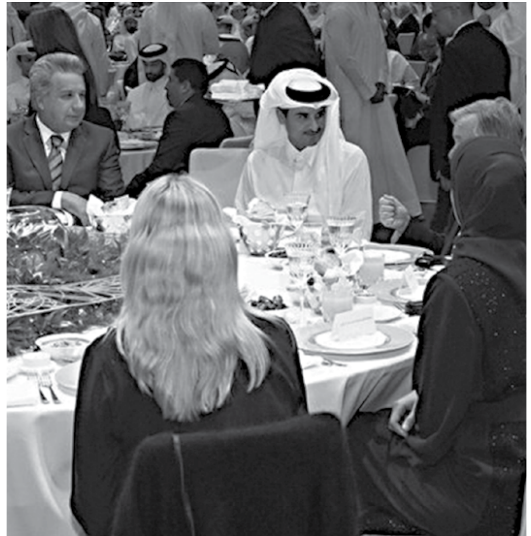
Autoridades do Catar e organizadores da Copa durante cerimônia de apresentação do estádio palco da abertura