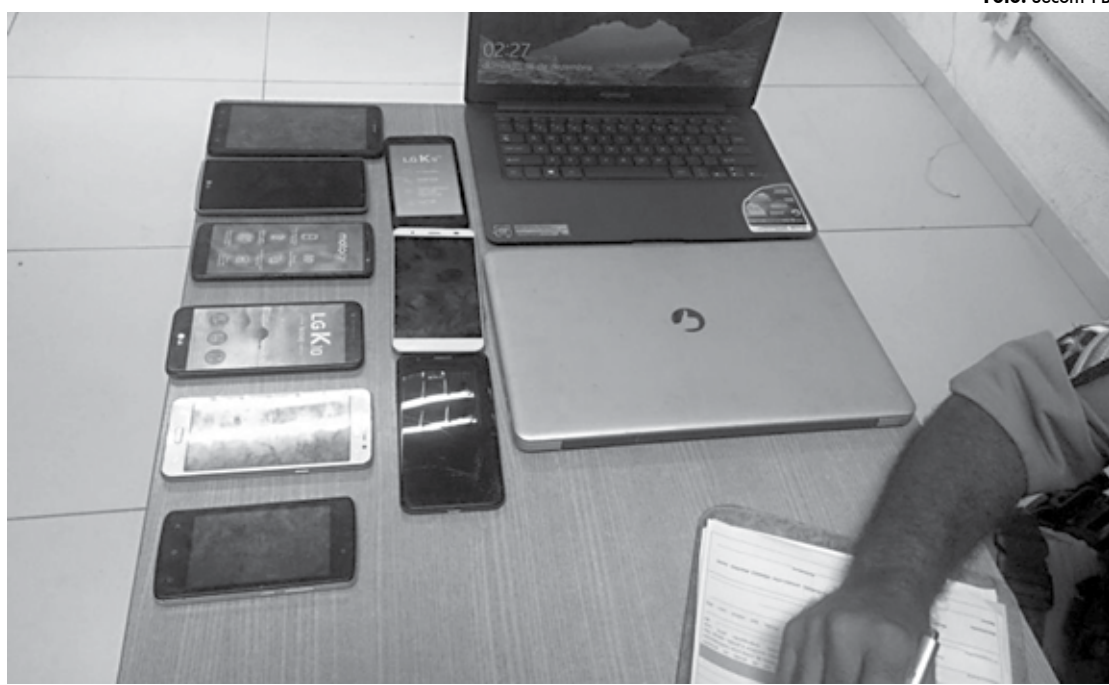
Notebooks e celulares foram recuperados com o suspeito, que foi preso durante reforço do policiamento no Centro

Segundo os policiais que efetuaram a prisão e apreensão, a dupla é suspeita de cometer vários roubos nas cidades de Pilar, São Miguel de Taipu, Cajá (distrito de Caldas Brandão), Mari e Sapé. Os dois foram conduzidos para a delegacia de Sapé.