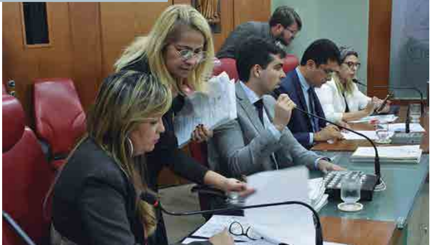
Os vereadores apreciaram, ao todo, 20 matérias legislativas na votação de ontem, dentre elas alguns vetos, dois deles foram mantidos