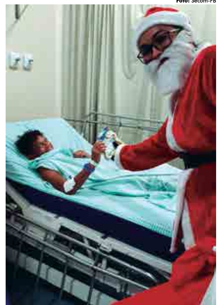
Crianças internas receberam brinquedos ao som de músicas natalinas