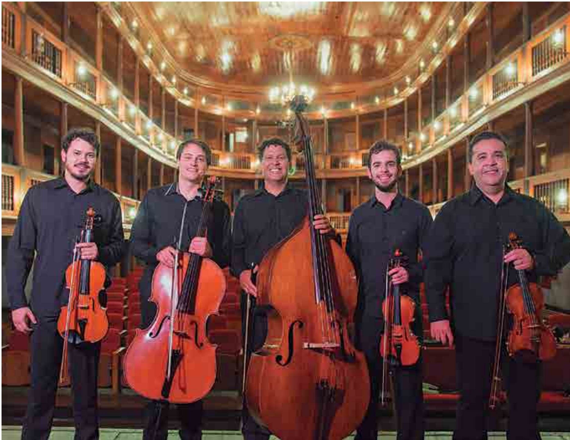
Quinteto de Cordas prima por um repertório brasileiro, dando ênfase a novos compositores, além de composições próprias, e é composto por músicos de formação acadêmica com larga experiência

O Ninho Uirapuru está dentro do projeto Palco Aberto, que acontece toda semana no Café da Usina. Os ingressos são limitados e custam R$ 20,00.