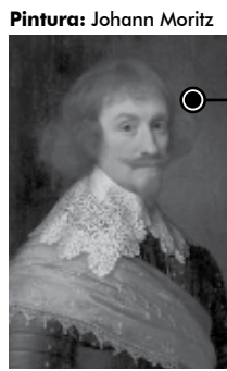
Pintura: Johann Moritz

Governador do Brasil Holandês e cognominado "O Brasileiro", foi conde e, após 1674, príncipe de Nassau-Siegen, um Estado do Sacro Império Romano-Germânico, localizado nas cercanias das cidades de Wiesbaden e Coblentz