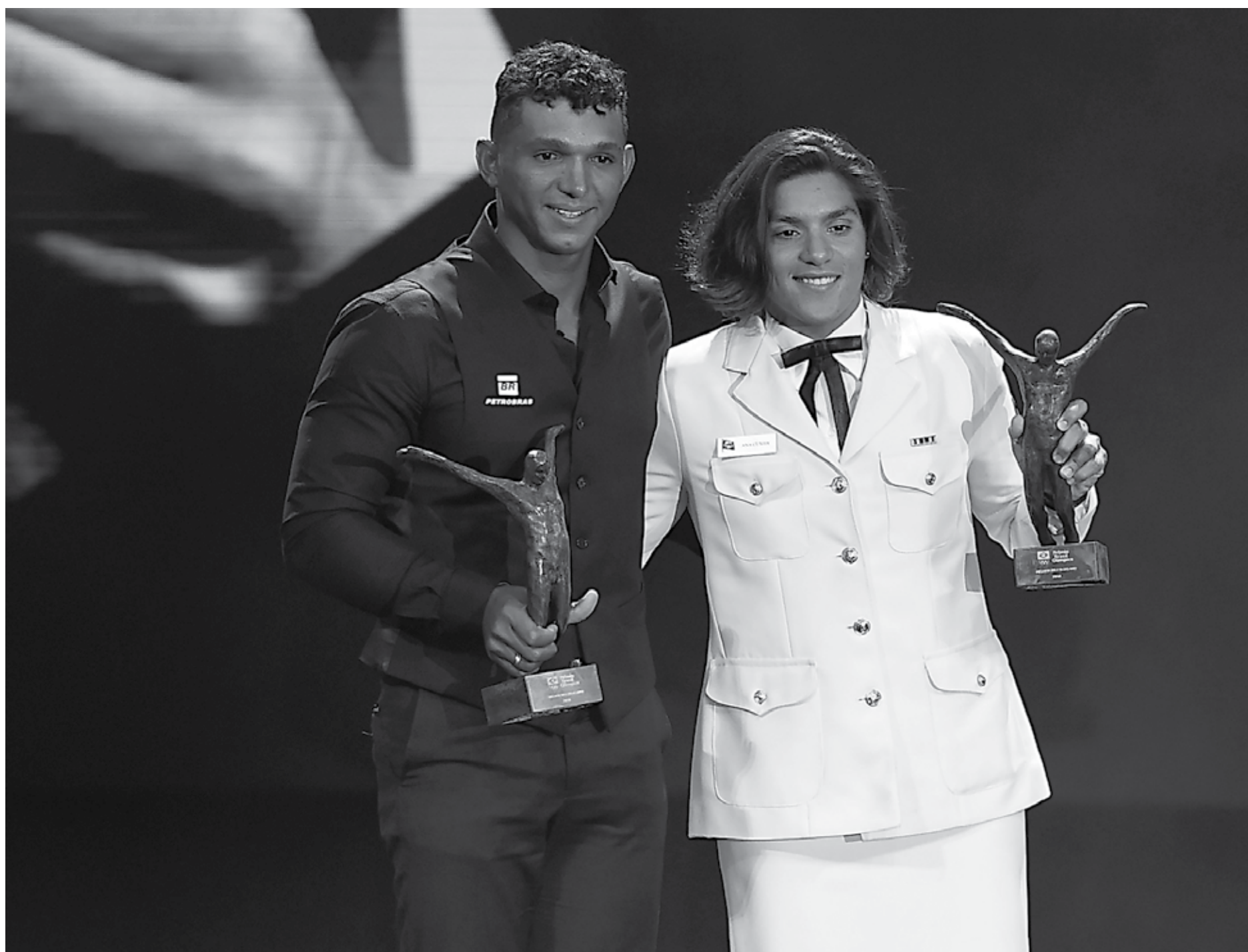
Isaquias Queiroz e a maratonista Ana Marcela com os prêmios de melhores atletas da temporada de 2018. O canoísta conquistou o Prêmio Brasil Olímpico pela terceira vez (2015, 2016 e 2018)

“Esse ano, pudemos ir ao Campeonato Mundial juntos, foi o último dele. E, lá, conse-