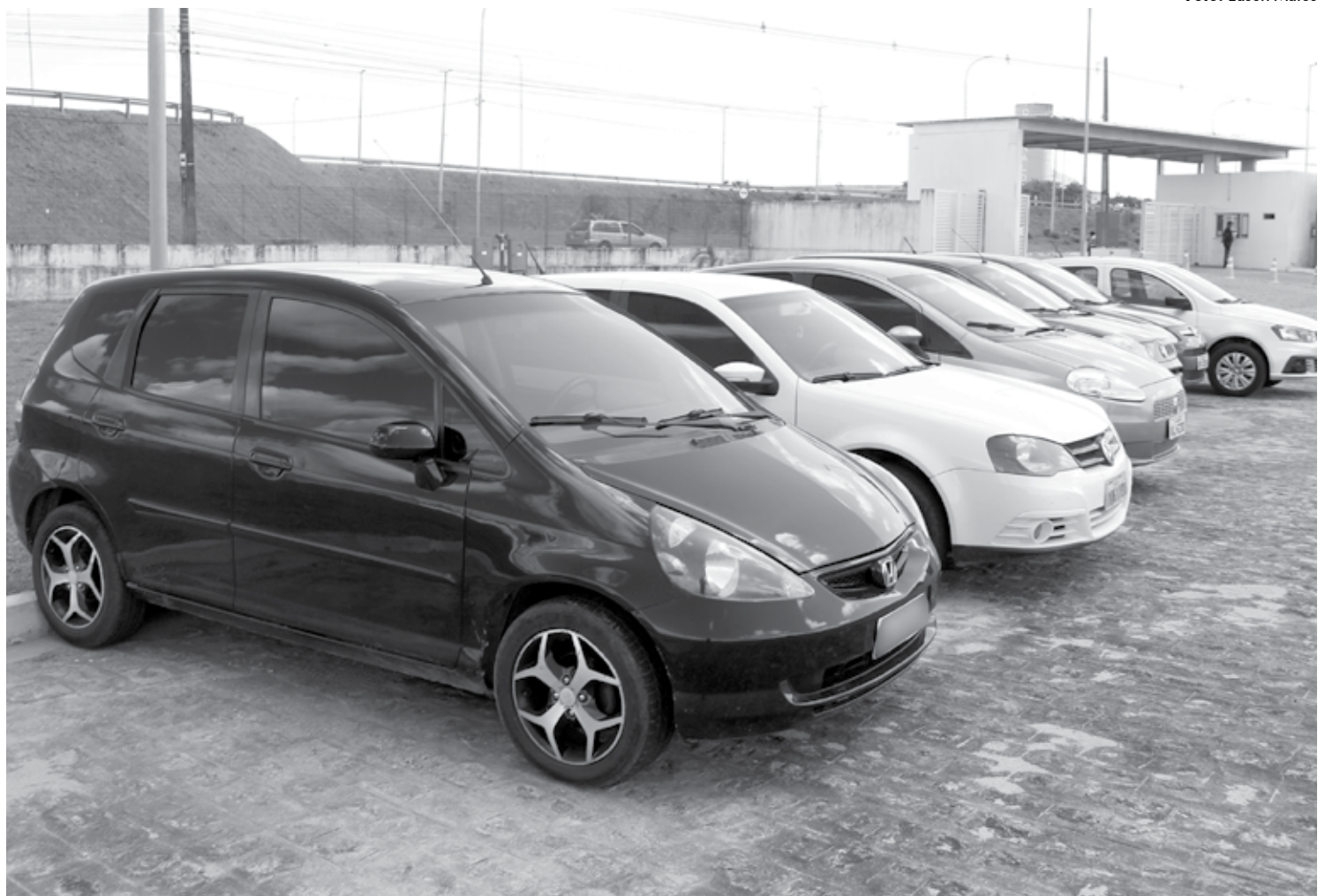
Seis veículos apreendidos com os integrantes da organização criminosa que agia na Paraíba, Pernambuco e Rio Grande do Norte estão na Central de Polícia