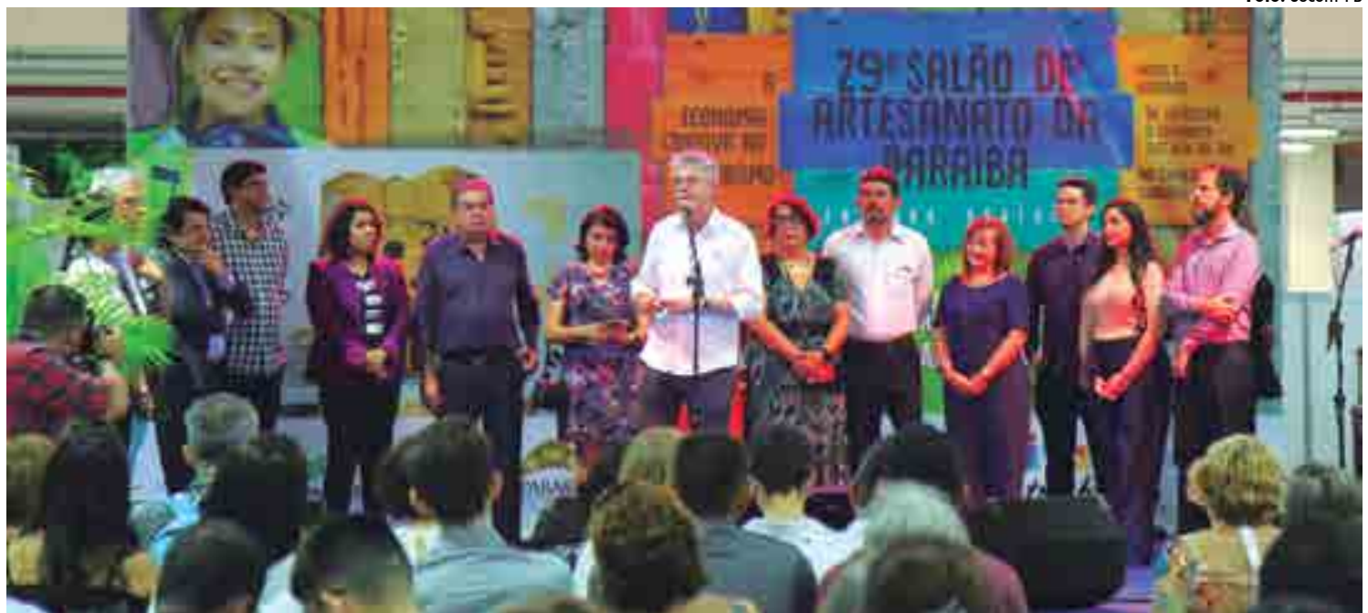
Na solenidade de abertura, o governador destacou os avanços realizados no âmbito do artesanato enquanto esteve à frente do Governo da Paraíba