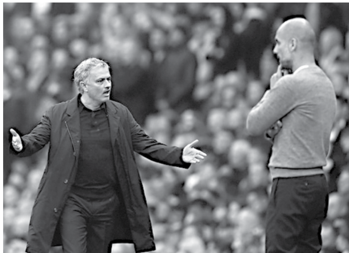
José Mourinho em jogo contra o Manchester City de Guardiola. O técnico teve uma fraca participação no United

Após a coletiva, uma das patrocinadoras do clube entregou alguns presentes ao argentino e, entre eles, um liquidificador.