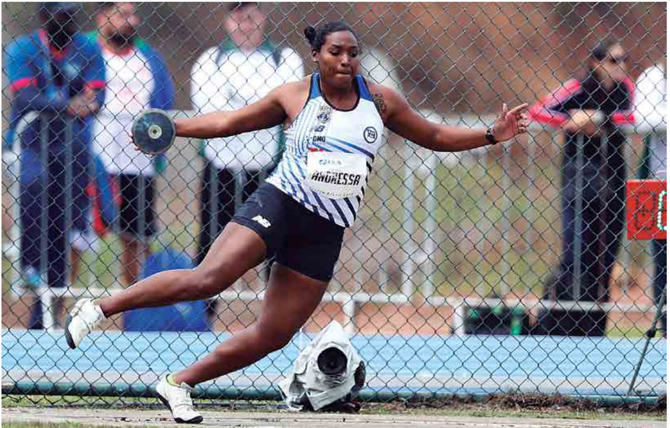
Andressa Moraes é atleta do Pinheiros de São Paulo e tem a sétima marca mundial no lançamento de disco. Ela tornou-se recordista sul-americana ao superar a barreira dos 65 metros no Grande Prêmio Brasil Caixa de Atletismo