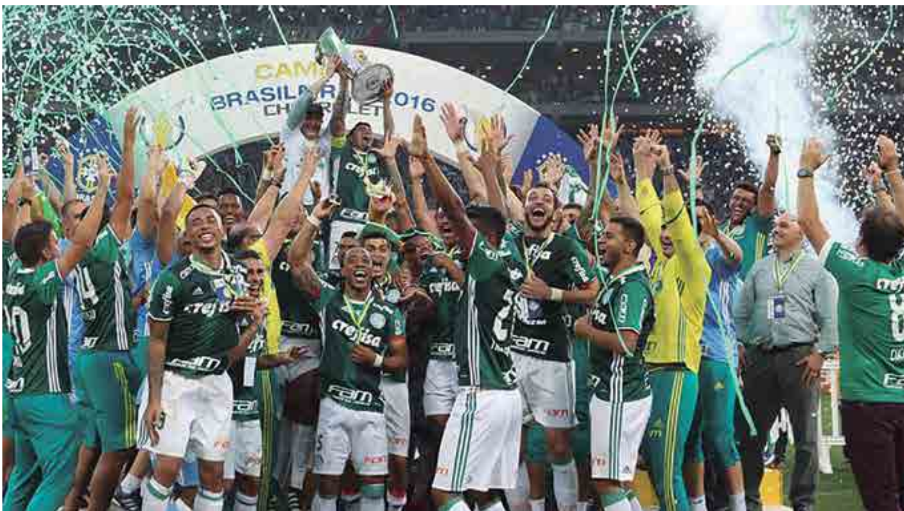
Os campeões brasileiros estão supervalorizados e alguns devem deixar o clube, como o meia Dudu, que ainda negocia a sua saída para o futebol chinês e cuja decisão ainda sai este ano

Todos os outros brasileiros garantidos na fase de grupos estreiam como visitantes. O Flamengo, contra o representante 2 da Bolívia, o Athletico Paranaense, contra o Tolima, na Colômbia, o Grêmio, frente ao Rosario Central e o Cruzeiro, diante do Huracán, ambos na Argentina.