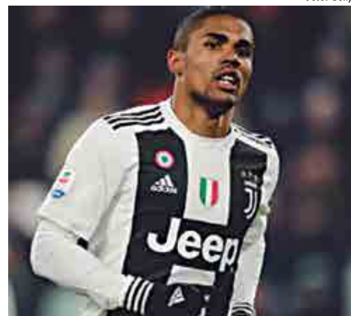
Douglas Costa em ação pela Juventus contra a Roma pelo Italiano

Contratado em definitivo pela Juve, Douglas Costa perdeu espaço após a chegada de Cristiano Ronaldo: foi titular em apenas três jogos no Calcio (saiu do banco em nove oportunidades) e um na Champions League (foi reserva utilizado em três partidas). Pior, não fez gol algum na atual temporada europeia.