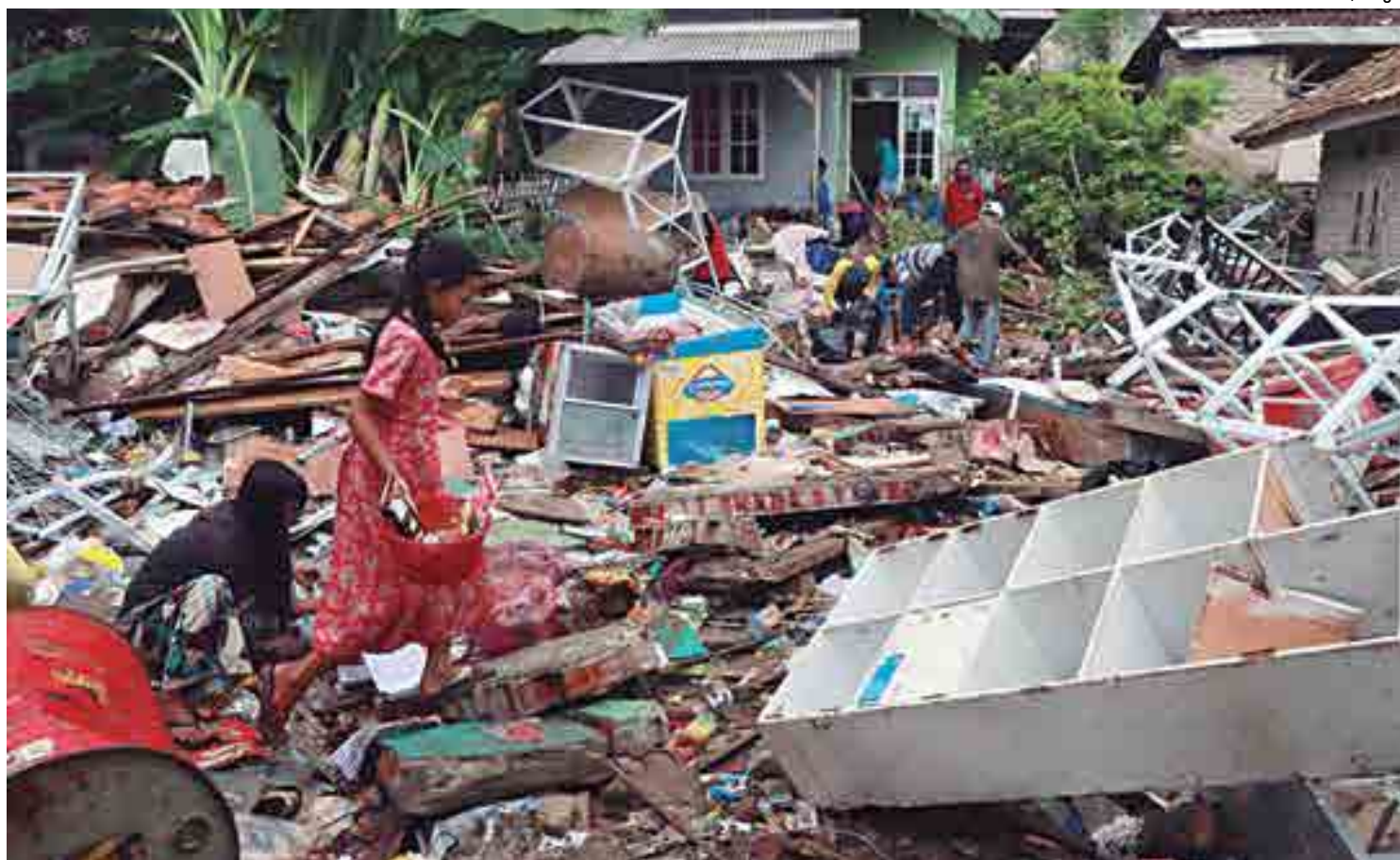
Fenômeno desencadeado após erupção do vulcão Anak Krakatau, na região costeira da Indonésia, registrado há quatro dias, destruiu 882 casas, 73 hotéis, vilas e edifícios localizados no Litoral

Em 26 de dezembro de 2004, um enorme tsunami desencadeado por um poderoso terremoto atingiu países ao longo do Oceano Índico, matando 226 mil pessoas, incluindo 170 mil na província de Aceh, na ponta Norte da ilha de Sumatra, na Indonésia.