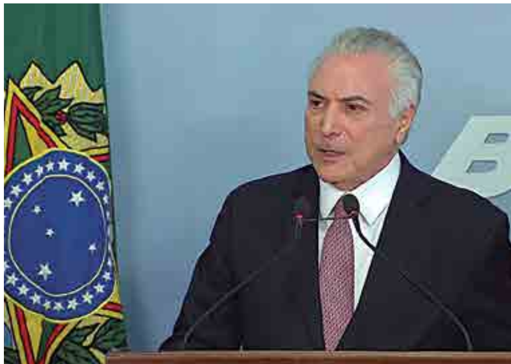
Em 2017 o indulto assinado por Temer foi questionado pela Procuradoria-Geral da República, no STF

Em sessão no dia 29 de novembro, o julgamento foi adiado porque o ministro