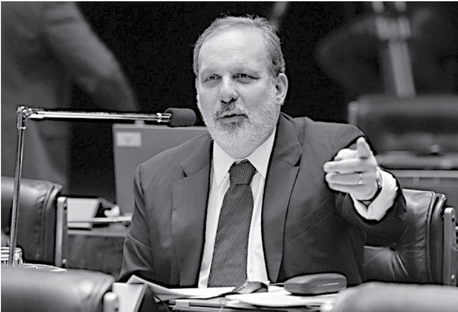
Senador Armando Monteiro, PTB-PE, é o autor da proposição que será votada no próximo ano na Comissão de Assuntos Sociais sob relatoria de Jorge Viana, PT-AC

No momento em que a legislação cria dificuldades para se alocar mão de obra nos projetos no exterior, isso cria dificuldades para a própria operação das empresas. Portanto, esse projeto vai representar um avanço no sentido de estimular esse movimento de internacionalização das empresas brasileiras e, o que é mais importante, sem que isso signifique nenhum sacrifício, nenhum comprometimento dos direitos do trabalhador. Aplica-se o princípio da territorialidade, ou seja, aplicar a legislação trabalhista do país