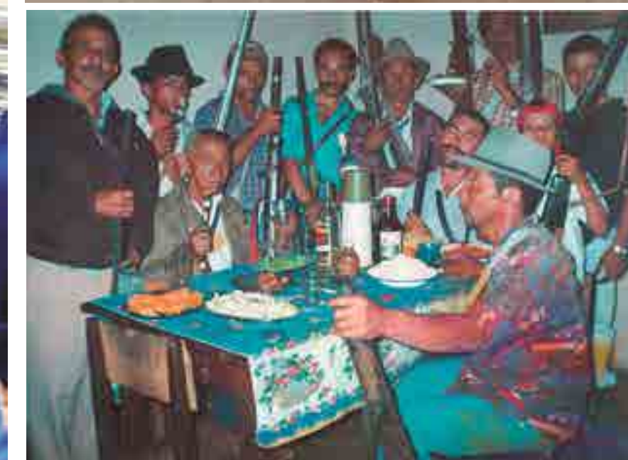
Em sentido horário: Bacamarteiros de Serra Grande; Grupo formado por bacamarteiro, aboiador e rezadeira, no Sítio Aguiar, no mesmo município e registro do folgado na década de 1990, também em Serra Grande

prefeituras de Juru e Serra Grande. O objetivo era diagnosticar a situação do folgado na região do sertão.