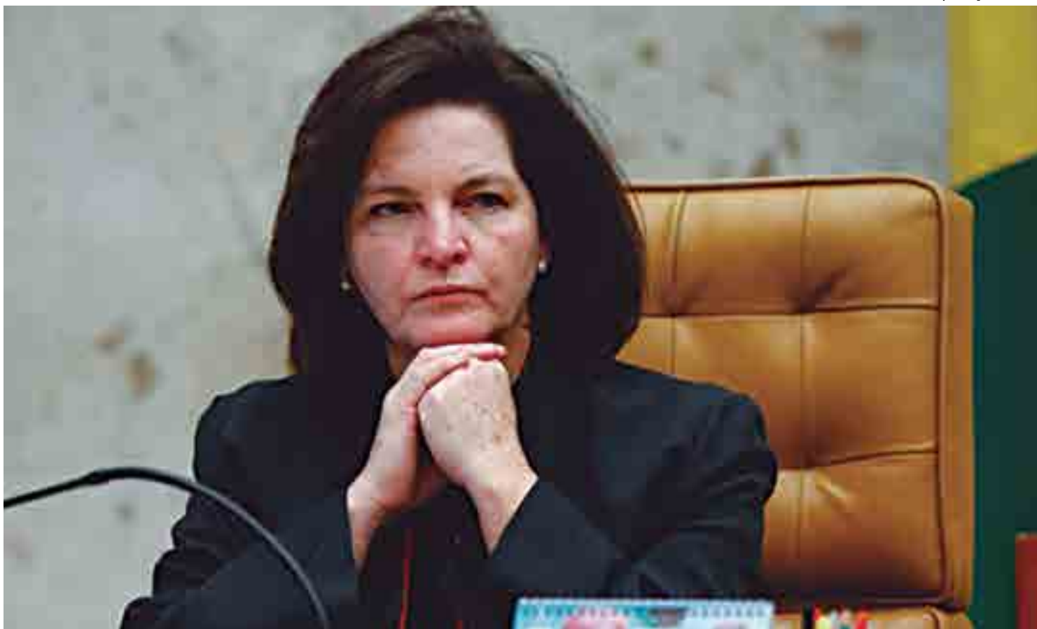
Dodge também é contra a fixação de indenização por dano moral atrelada ao salário e diz que novas regras são discriminatórias e afetam o direito da personalidade

O texto da procuradora diz: "a inovação trazida pela Lei 13.467 [reforma trabalhista], com adoção do índice da caderneta de poupança para a atualização monetária, foi positivada com ofensa aos estírios constitucionais, sendo imperiosa a utilização de outro índice".