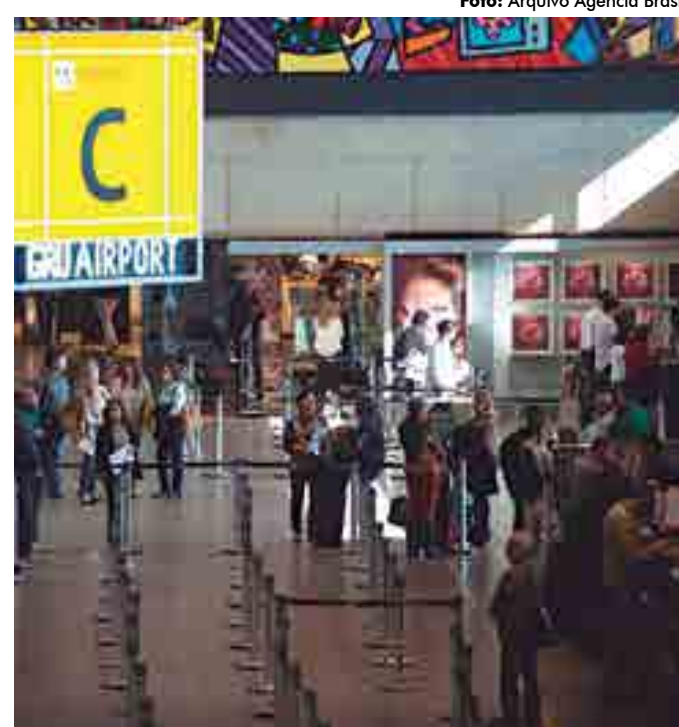
Os passageiros com destino a Paris tiveram os voos remarcados

Um outro problema envolvendo um voo da Latam está sendo investigado pelo Centro de Investigação e Prevenção de Acidentes Aeronáuticos (Cenipa). Na madrugada da última quinta-feira (20), um avião que havia decolado do Ae-