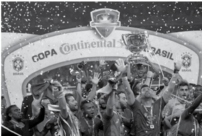
O Cruzeiro repetiu a dose e conquistou de novo a Copa do Brasil, enquanto o Atlético-PR faturou a Copa Sul-Americana na Arena da Baixada