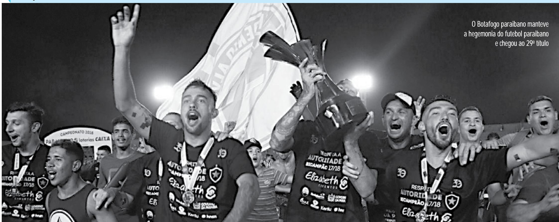
O Botafogo paraibano manteve a hegemonia do futebol paraibano e chegou ao 29º título