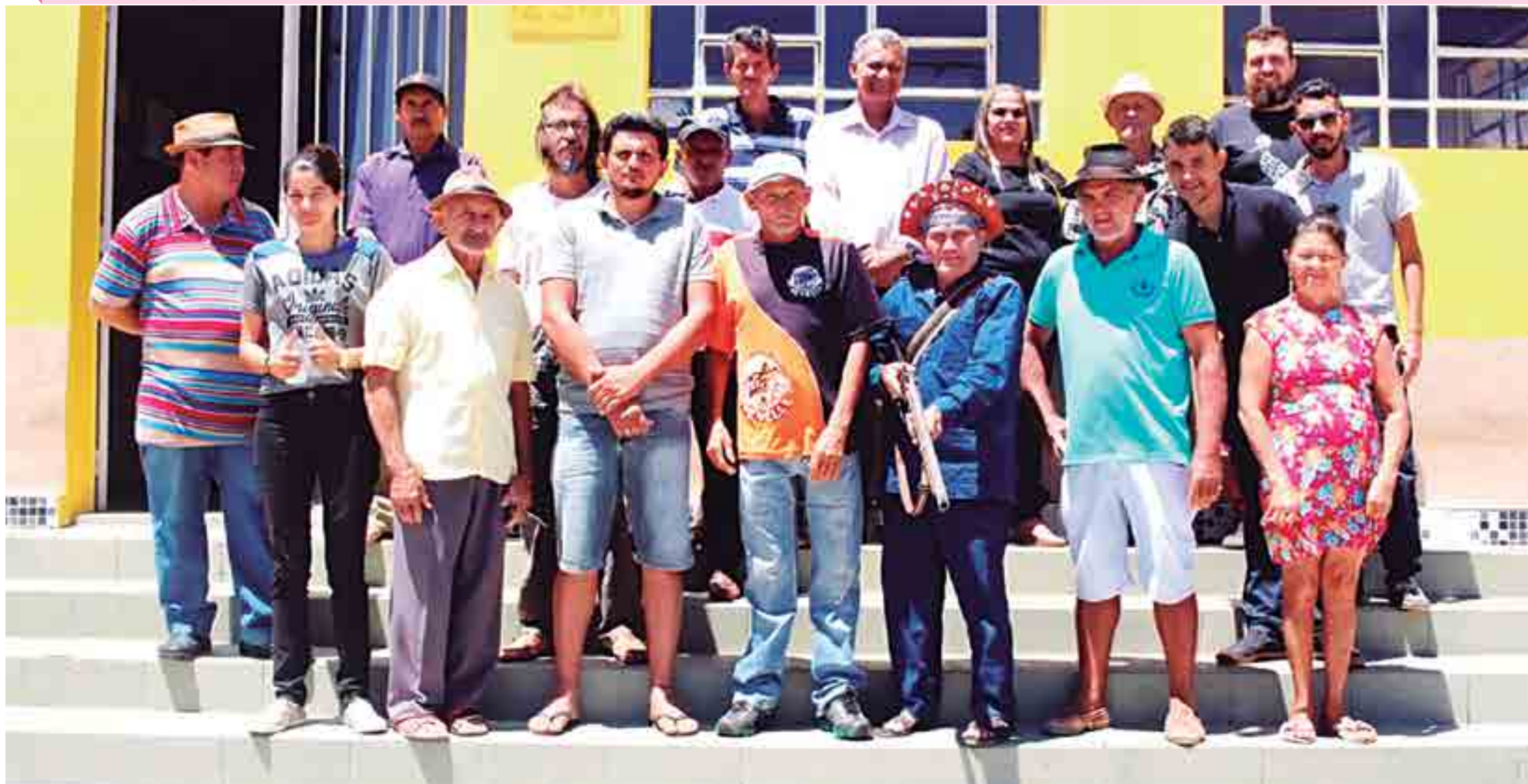
Reunião ocorrida na cidade de Juru, no último dia 15, foi coordenada pela Articulação dos Bacamarteiros da Paraíba e contou com integrantes desta manifestação popular, representantes da Secult-PB e da Prefeitura Municipal da cidade