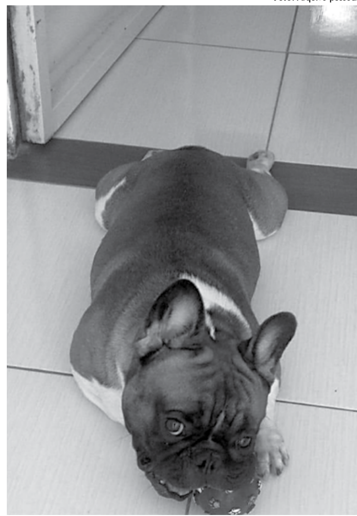
Dona do animal notou que o cachorro estava estranho já em Campina Grande

De acordo com a instrução normativa do Ministério da Agricultura, Pecuária e Abastecimento (Mapa), para o transporte de cães e gatos é necessário o atestado de saúde assinado por veterinário habilitado. A acomodação destes nas viagens é definida pela empresa responsável pelo transporte e o animal pode viajar em qualquer compartimento, desde que seu peso e gaiola sejam compatíveis com o ambiente e com as exigências da transportadora.