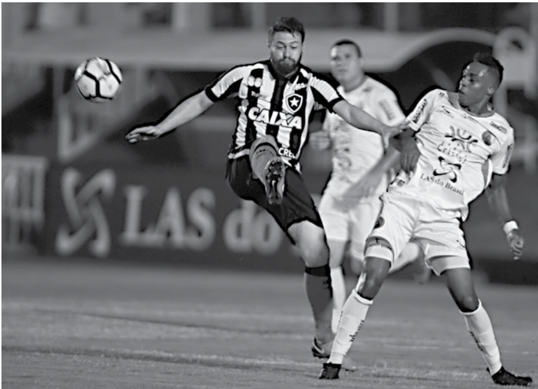
O Botafogo-RJ, é um dos clubes grandes do futebol nacional, aquele que mais foi surpreendido pelos pequenos. Este ano, o Glorioso foi eliminado da competição pelo modesto Aparecidense, de Goiás

Agora o ranking das zebras é dominado por Botafogo-RJ e Atlético-MG com nove. São Paulo, Santos, Flamengo e Grêmio contam com apenas três casos, enquanto o Corinthians segue com nenhum. Entre os menores, o Criciúma é o maior 'carrasco', já tendo eliminado quatro clubes grandes: Atlético-MG, Internacional, São Paulo e Grêmio. No próximo dia 21 vai acontecer no Almeidão o confronto de um clube da Série C, no caso o Botafogo-PB, contra o Atlético Mineiro, da Série A, e a zebra pode novamente pintar em João Pessoa.