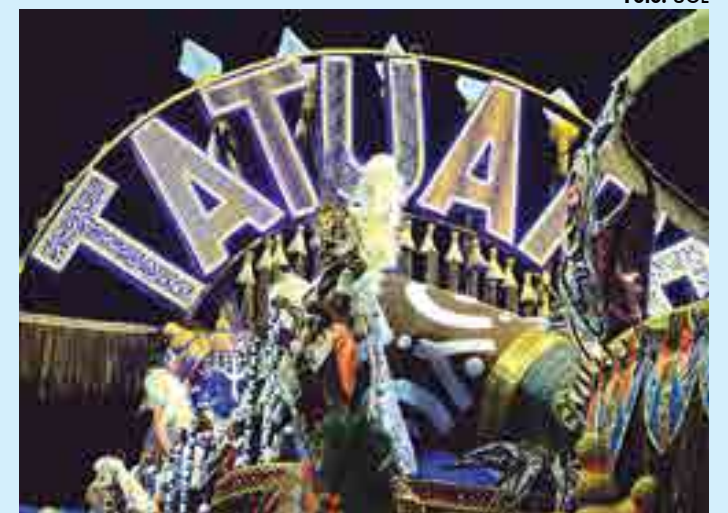
Acadêmicos do Tatuapé homenageou o Maranhão em seu desfile campeão

Em 2017, a agremiação havia vencido o Carnaval paulistano com o enredo Mãe África Conta a Sua História: do Berço Sagrado da Humanidade à Abençoada Terra do Ouro.