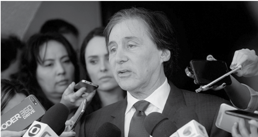
Oliveira: "Temos o Funpen (Fundo Penitenciário Nacional), com recursos que não são alargados, para efeito da sua aplicação"

O presidente do Senado, Eunício Oliveira, agendou para a próxima terça-feira, 20, a sessão deliberativa para a continuação da votação dos projetos da pauta de segurança pública da Casa, anunciada por ele na abertura do ano legislativo. O primeiro item a ser analisado deve ser a Proposta de Emenda à Constituição (PEC) 118/2011, que impede o bloqueio de recursos orçamentários destinados aos fundos de segurança.