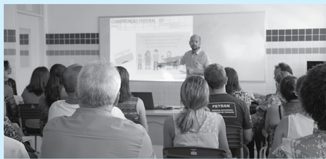
Objetivo da capacitação, ofertada em parceria com a Organização Social Ecos, é auxiliar na compreensão