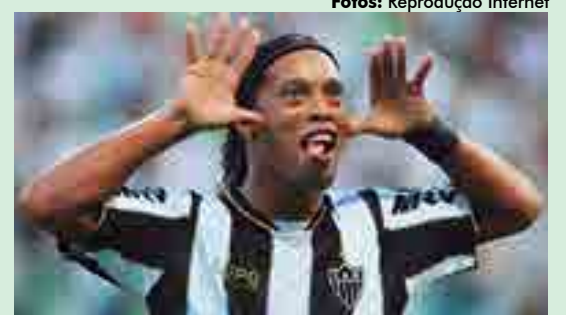
Ronaldinho foi penta pela seleção e fez história também no Grêmio, onde começou a carreira, além de Atlético Mineiro, Flamengo e Fluminense