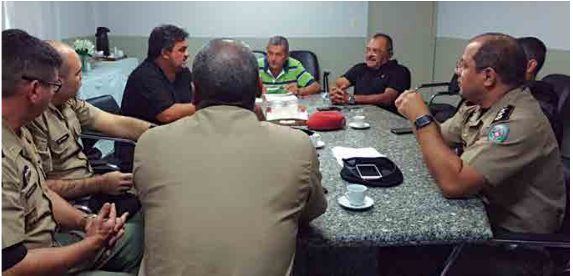
Comando da Polícia Militar traçou as regras para o primeiro clássico do ano no futebol paraibano. Botafogo-PB e Treze entram em campo às 16h de domingo pela 3ª rodada do Estadual

Outra questão que sempre preocupa as autoridades é com relação às torcidas organizadas. A visitante, do Treze, ficará na Arquibancada Sol. Mas, independente de local a ficar no estádio, as torcidas organizadas dos dois clubes terão que informar à PM os locais, horários das con-