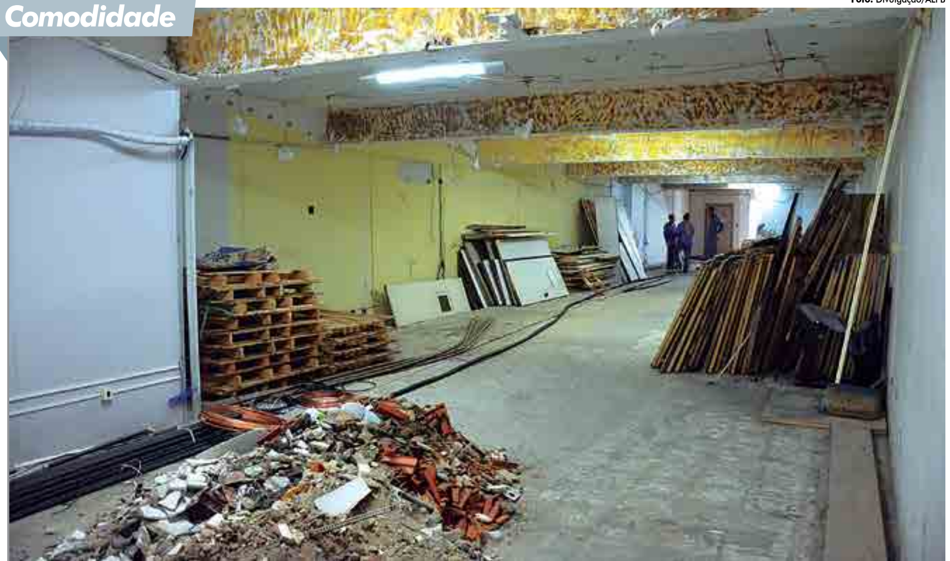
O prédio que está sendo reformado fica localizado na Rua Duque de Caxias, ao lado da Assembleia, e abrigará os setores Médico, Odontológico, Serviço Social e de Apoio ao Idoso