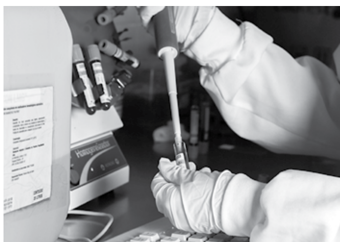
Procedimentos representam uma média mensal próxima de 60 mil

No entanto, a bioquímica e farmacêutica também