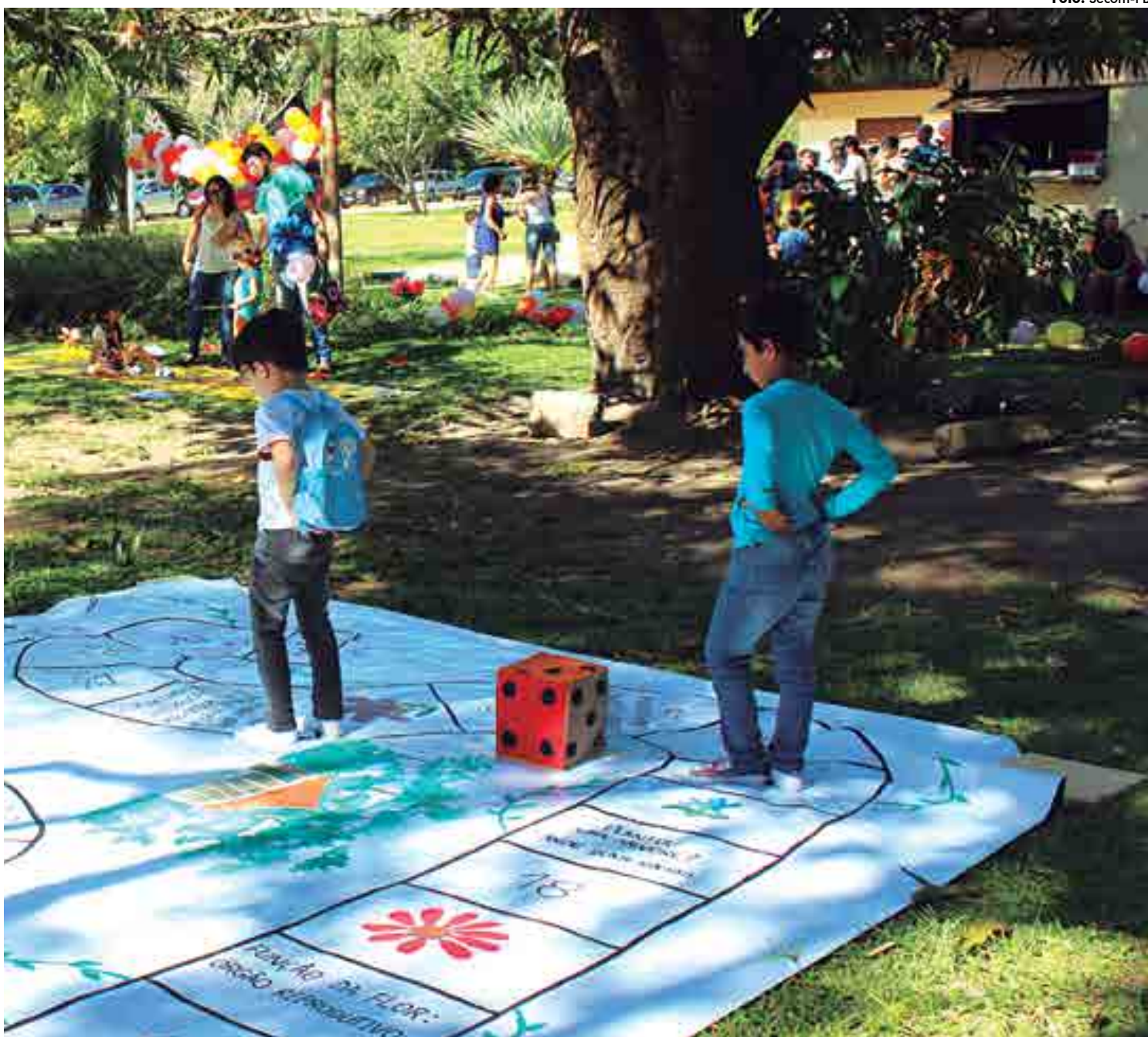
Oficina de amarelinha é uma das atividades disponibilizadas para crianças na faixa etária de 4 a 12 anos hoje e amanhã, no Jardim Botânico

Localizado na Mata do Buraquinho, em João Pessoa, o Jardim é considerado um dos maiores remanescentes de Mata Atlântica em área urbana do país. É uma instituição que mantém coleções documentadas de plantas diversas, possui flora e fauna nativas e tem a finalidade de dar suporte a atividades de pesquisa, fomentar a conservação, promover a educação ambiental e o lazer contemplativo.