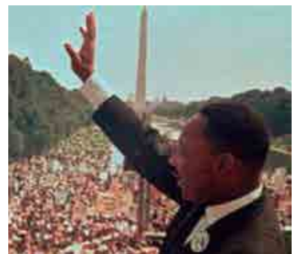
Martin Luther King em Washington numa manifestação em Washington, em abril de 1967, um ano antes de sua morte

Nostalgia é o desejo de voltar a esse ou outro passado.