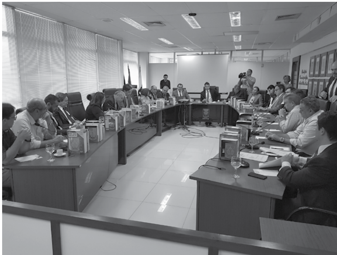
Durante o encontro, Ministério informou que, nos próximos 10 dias, o Eixo Leste vai ampliar o volume de água

Desde março de 2017, o empreendimento já tem garantido o atendimento de quase um milhão de pessoas em 32 municípios dos estados da Paraíba e de Pernam-