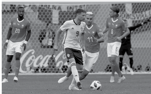
Após a saída de Ibrahimovic, Marcus Berg assumiu a posição de artilheiro nos jogos da seleção da Suécia

"Jogamos muito bem estes dois anos sem ele. É o