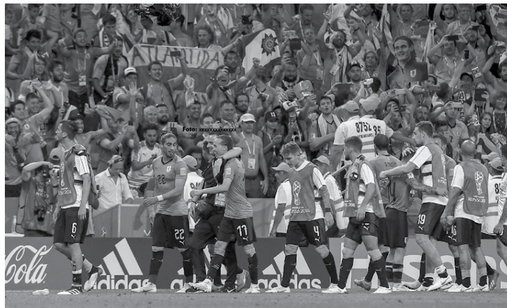
Seleção do Uruguai venceu todos os jogos e ao lado de Croácia e Bélgica, conseguiu comêntos a classificação para as quartas de final da Copa