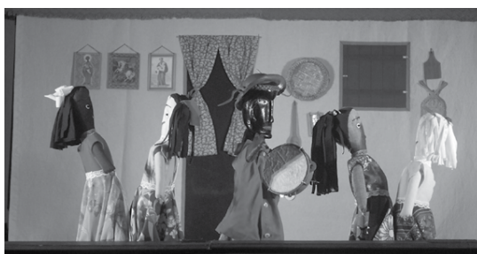
Espectáculo intitulado "Tem Boi no Algodão" tem montagem divertida e é inspirada na cultura popular nordestina

"A partir desse momento tomamos à inicia-