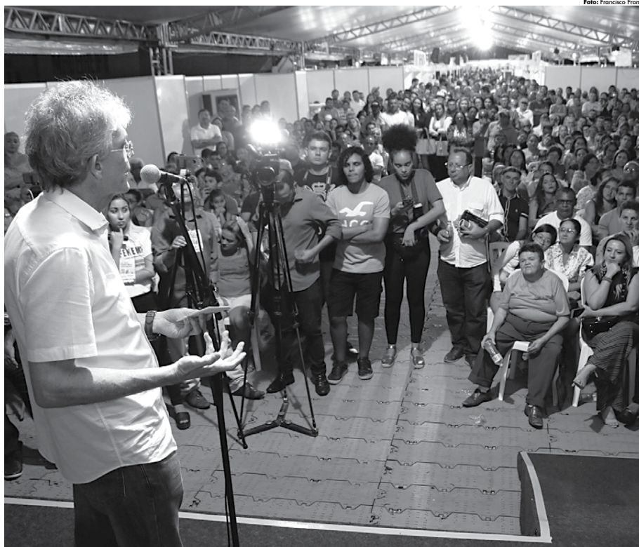
Governador recebeu homenagens de empreendedores e estudantes de Picuí selecionados no Programa Gira Mundo e enfatizou que o Empreender impulsiona a economia paraibana

"O sentimento aqui é de gratidão ao Governo do Estado que promove essa Feira de Negócios tão bonita, bem organizada e com tanta gente participando. A