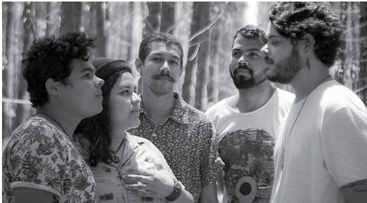
Uma das atrações do evento, a Flotilha em Alta-terra, e a banda-fôrra em uma das músicas de seu álbum de estreia.