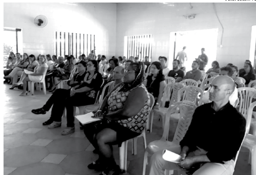
Conferência Municipal de Segurança Alimentar e Nutricional de Cabedelo realizada na última quarta-feira