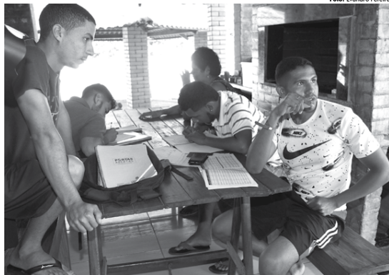
Na Casa do Imigrante, localizada no município de Conde, Litoral Sul da Paraíba, estão 39 venezuelanos