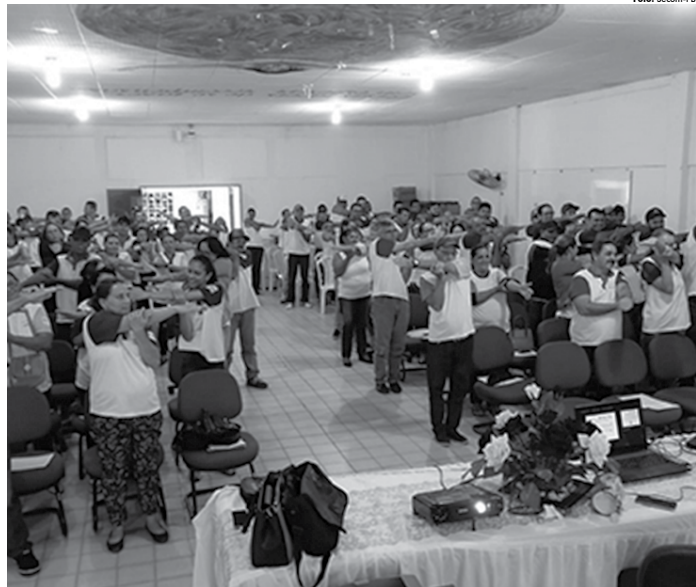
Ciclo de Capacitação Funcional é realizado às equipes de apoio escolar, formadas por porteiros, merendeiras, auxiliares de serviços gerais e cuidadores vigia-assistentes