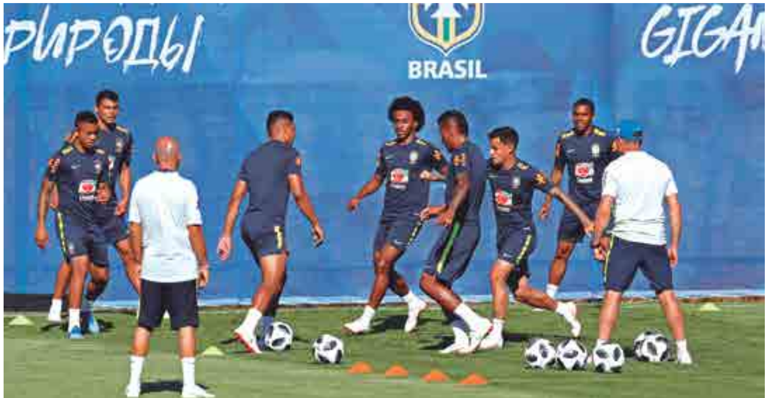
O treino de ontem da Seleção Brasileira não foi aberto à imprensa, mas convidados da CBF filmaram e mostraram a atividade nas redes sociais

"Professor não decidi ainda não, mas independentemente de nomes. O Fernandinho entrou e jogou muito bem. O Coutinho para mim é um craque. O que o professor decidir, única certeza que tenho é que os 11 vão jogar da melhor maneira possível. Mas ele ainda não decidiu. Vejo da seguinte forma: são jogadores obviamente de qualidade diferente, funções diferentes, não é muita ou pouca coisa, são completamente diferentes. Um joga muito bem quando entra, Fernandinho fez excelente partida contra a Alemanha, e Coutinho vem fazendo um excelente trabalho."