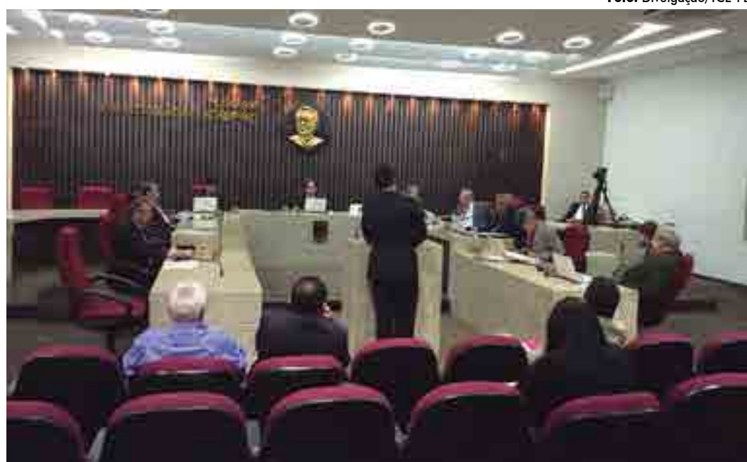
Corte de Contas respondeu consulta formulada pela presidência da Câmara e entendeu os pagamentos como ilegais