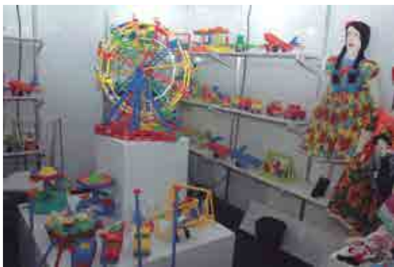
Produtos expostos na Feira do Artesanato atraem turistas que visitam Campina Grande

"Precisamos investir para fugir da crise. E acredito que investindo na microeconomia estamos ajudando a economia da Paraíba a se movimentar. Somente na linha Empreender Artesanato, desde 2011, já foram liberados mais de R$ 2 milhões para 655