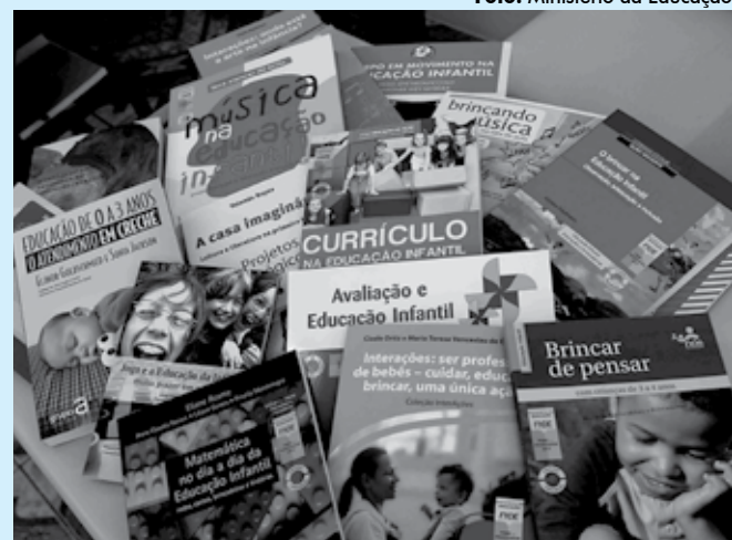
Os livros didáticos são distribuídos de acordo com o censo escolar