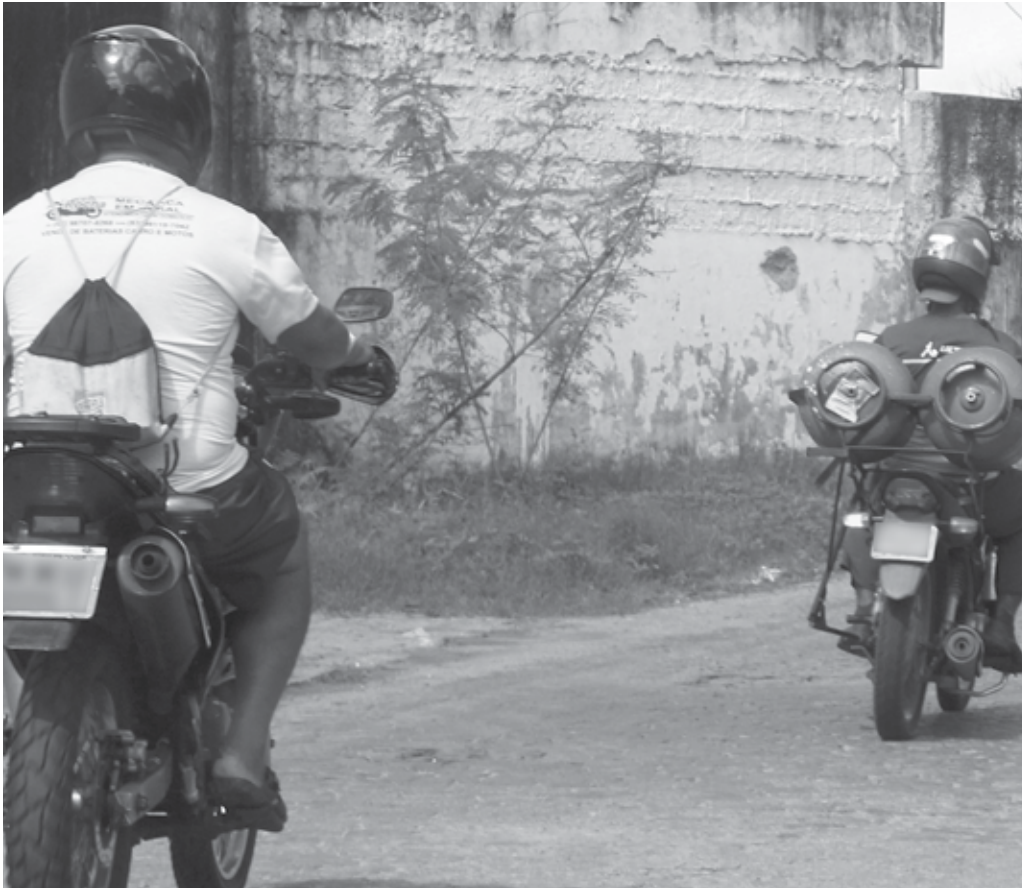
A entrega dos botijões de gás está sendo feita por motoqueiros. Revendedoras do produto alegam que a falta está ocorrendo desde a greve dos caminhoneiros e não tem previsão de regularização

A população vem sofrendo com a tentativa de encontrar gás de cozinha para comprar. Revendedoras reclamam da falta do produto e sindicato da categoria alerta que não há previsão para a normalização do comércio