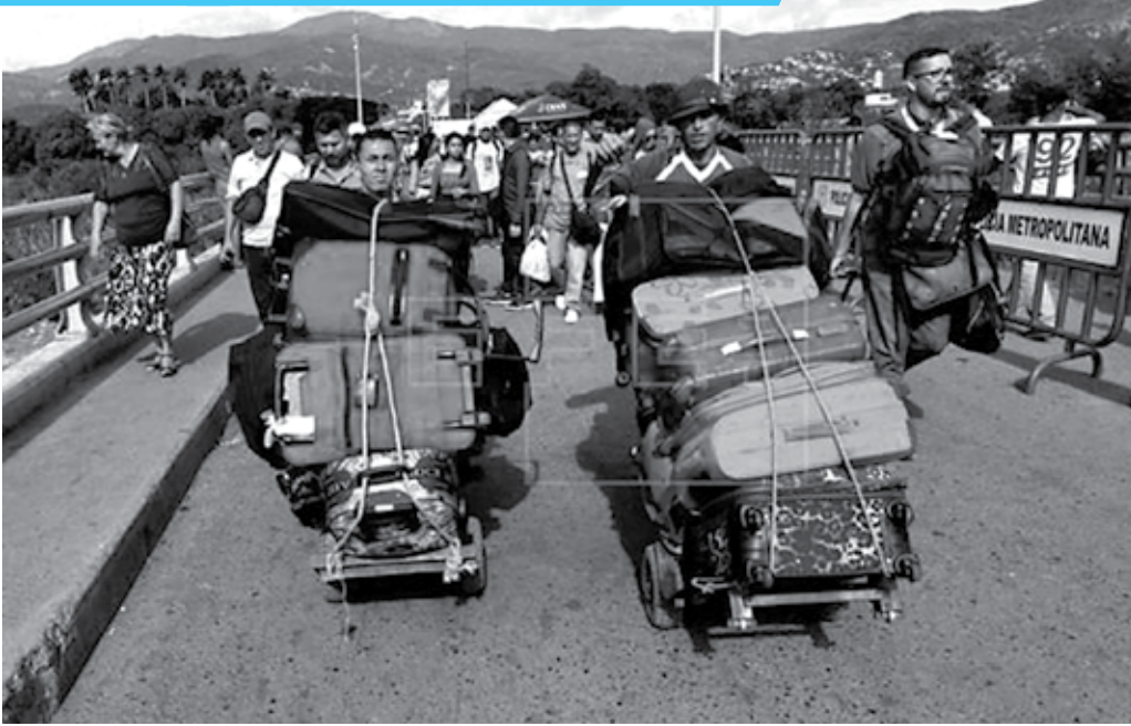
Com a crise político-econômica que enfrenta o país, venezuelanos cruzam as fronteiras em busca de vida melhor