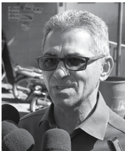
Representante da empresa: "Motorista passou mal"