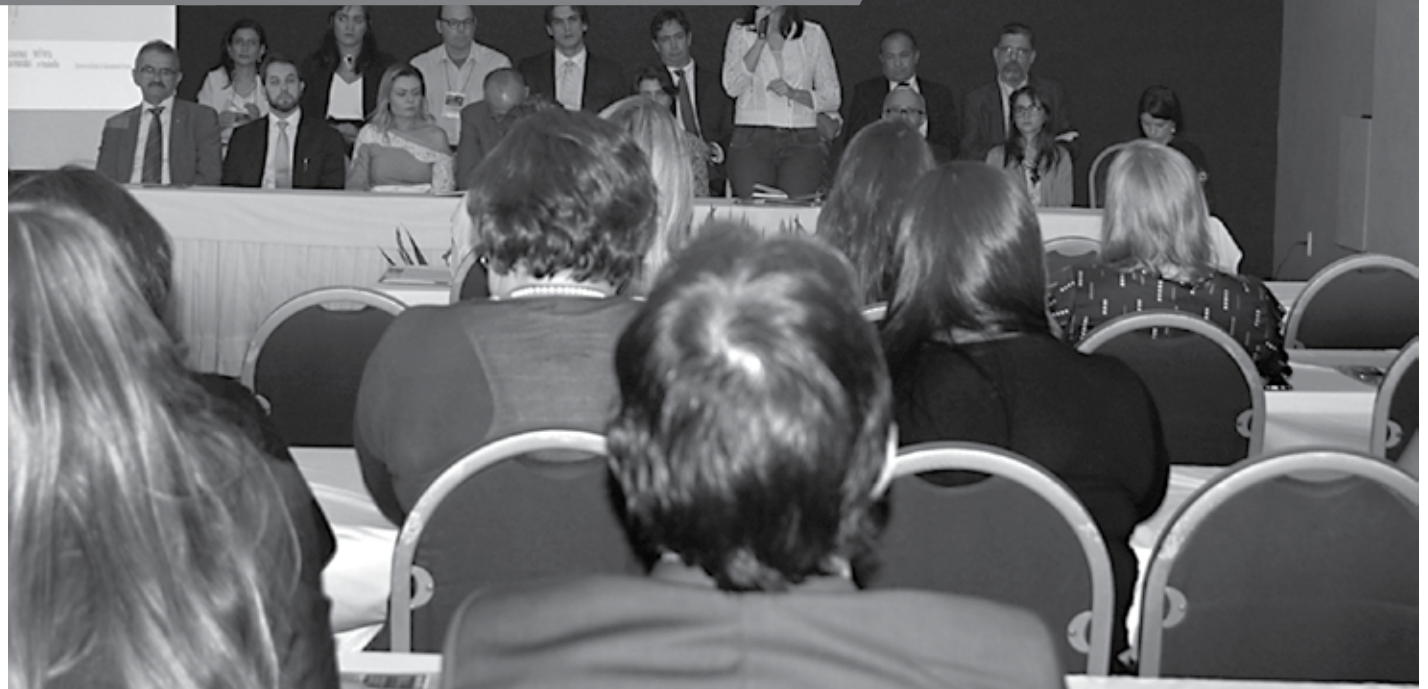
A I Formação Regional Sobre o Enfrentamento ao Tráfego de Crianças e Adolescentes na Paraíba acontece até hoje, no Littoral Hotel, na capital