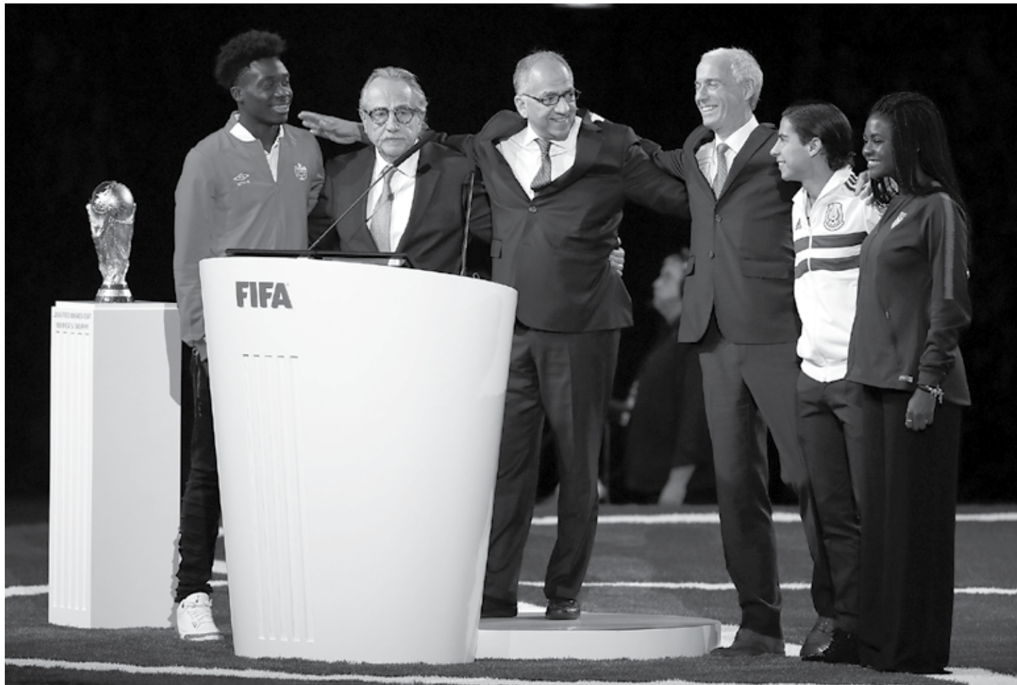
O presidente da Fifa Gianni Infantino, ao lado dos representantes dos países em disputa para sediar a Copa do Mundo de 2026