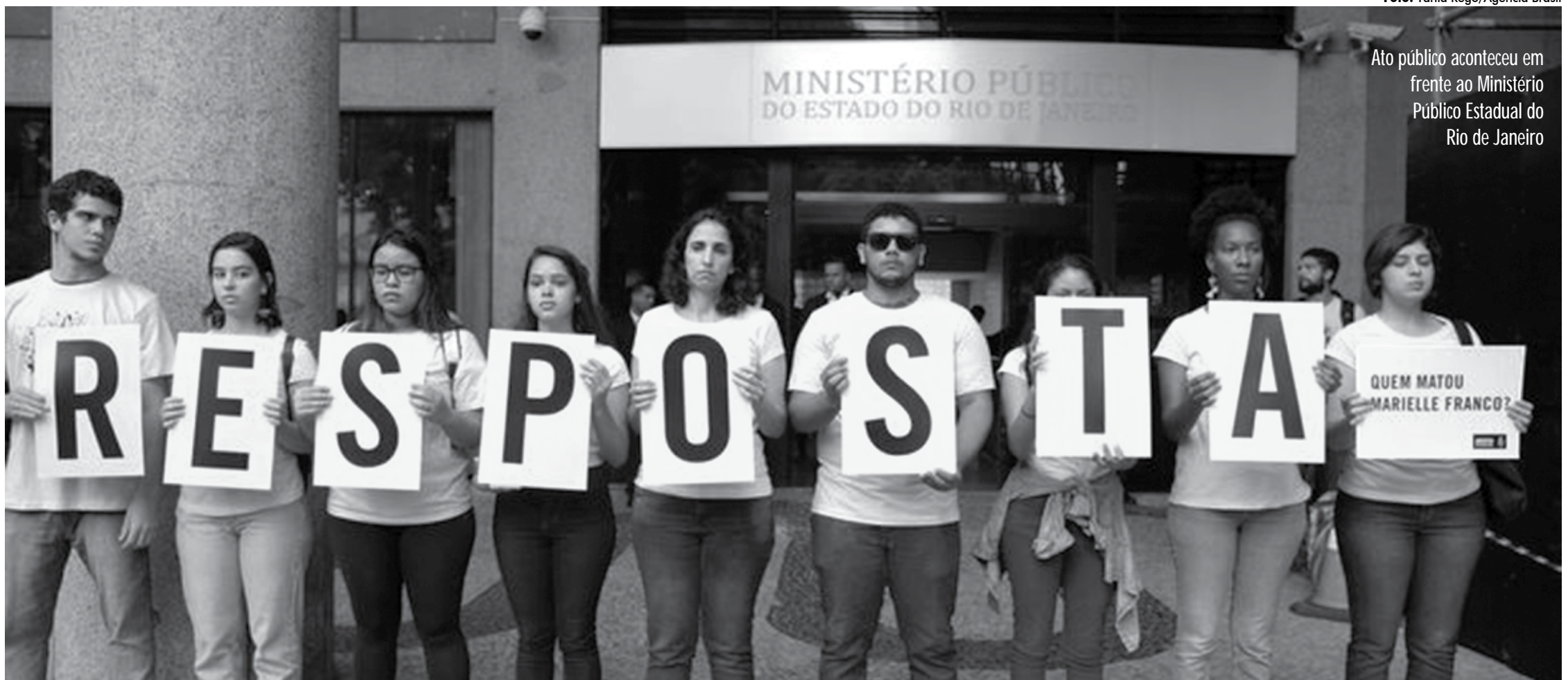
Ato público aconteceu em frente ao Ministério Público Estadual do Rio de Janeiro