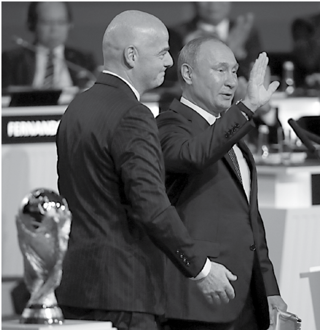
Infantino, ao lado do presidente Putin, faz os maiores elogios ao Mundial da Rússia, convencido de que será o melhor

"Em 26 de fevereiro (2016), a Fifa era uma organização que, do ponto de vista clínico, estava morta. Hoje é uma organização viva, que recuperou a esperança e tem uma visão de futuro. As reformas para uma boa governança foram decisivas para transformá-la em uma federação tão próspera", destacou o mandatário.