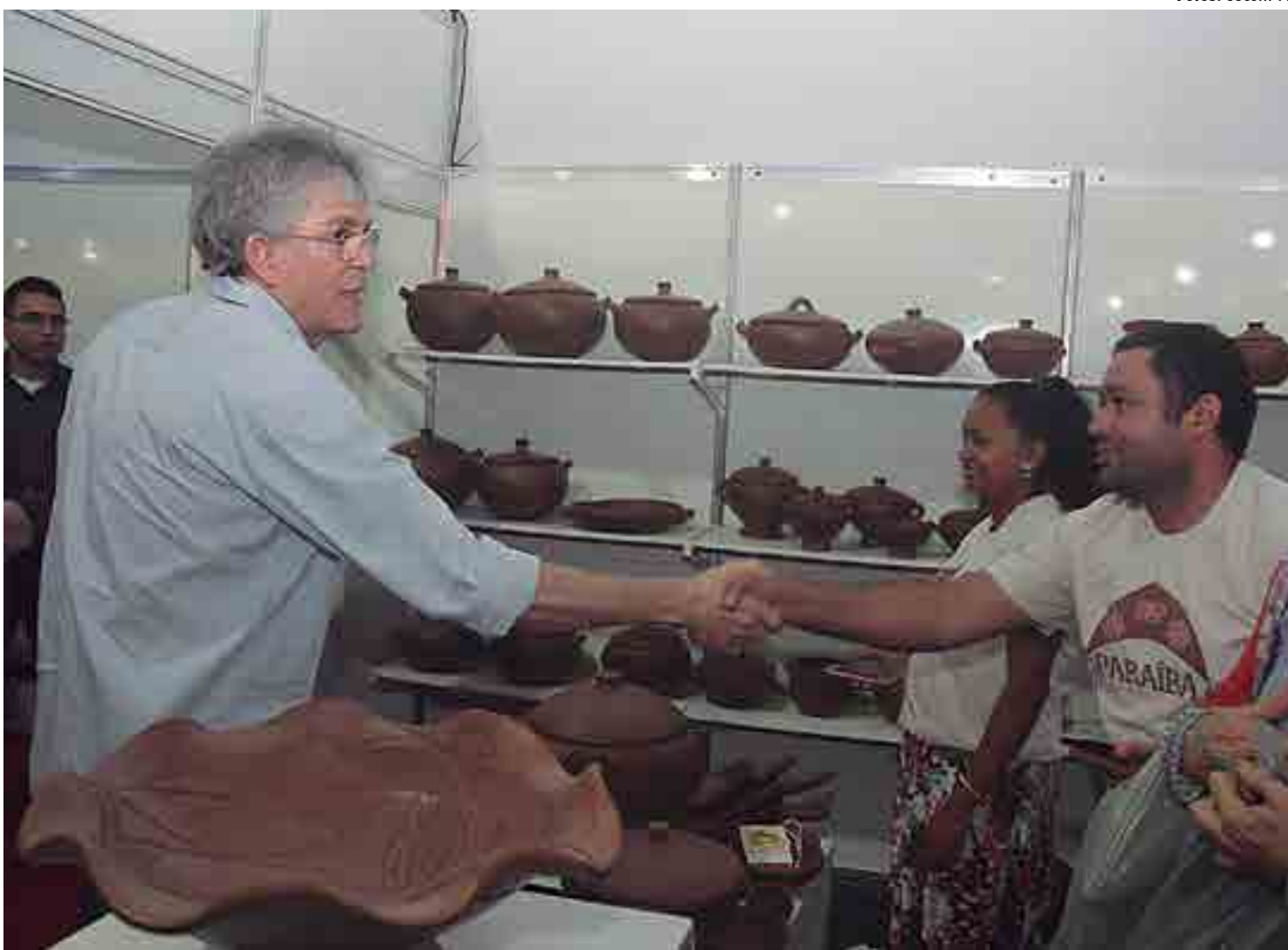
Governador cumprimentou artesãos que estão expondo seus trabalhos no Salão do Artesanato e assinou contratos através do Empreender