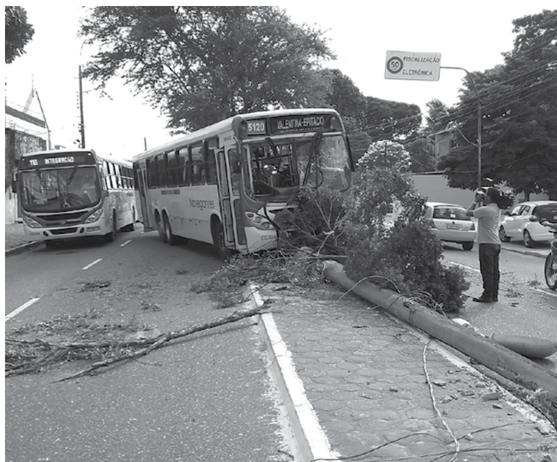
Ônibus desgovernado derrubou um poste e uma árvore na Avenida Cruz das Armas e deixou trânsito engarrafado

Os ônibus envolvidos nos dois acidentes são da empresa Navegantes. O veículo de ontem fazia a linha 5120 - Valentina/Epitácio Pessoa, enquanto o caso da semana passada, fazia a linha 602 - Mandacaru. Logo após o acidente de ontem, a Semob-JP solicitou apoio da manutenção para a troca do poste de iluminação pública que ficou no chão.