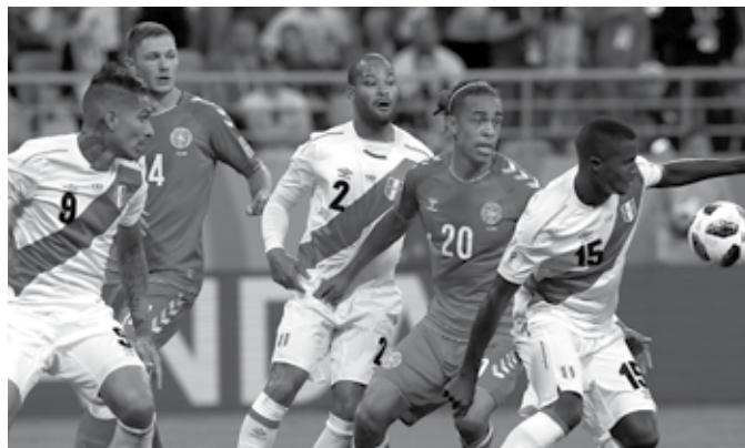
Os peruanos foram surpreendidos e perderam para a Dinamarca

Sem Renato Tapia e André Carrillo, o Peru cumpriu sua última atividade na Arena Khimki, em Moscou. Tapia continua se recuperando depois de uma pancada na cabeça e não deve ter condições contra os franceses. Já Carrillo, que teve uma fadiga muscular, não deve ser problema.