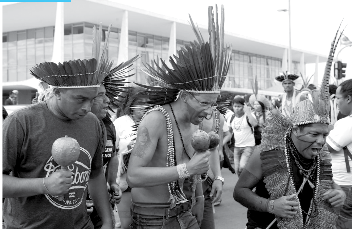
Estudantes, indígenas e quilombolas fazem manifestação em frente ao Palácio do Planalto para reivindicar políticas públicas de acesso ao Ensino Superior