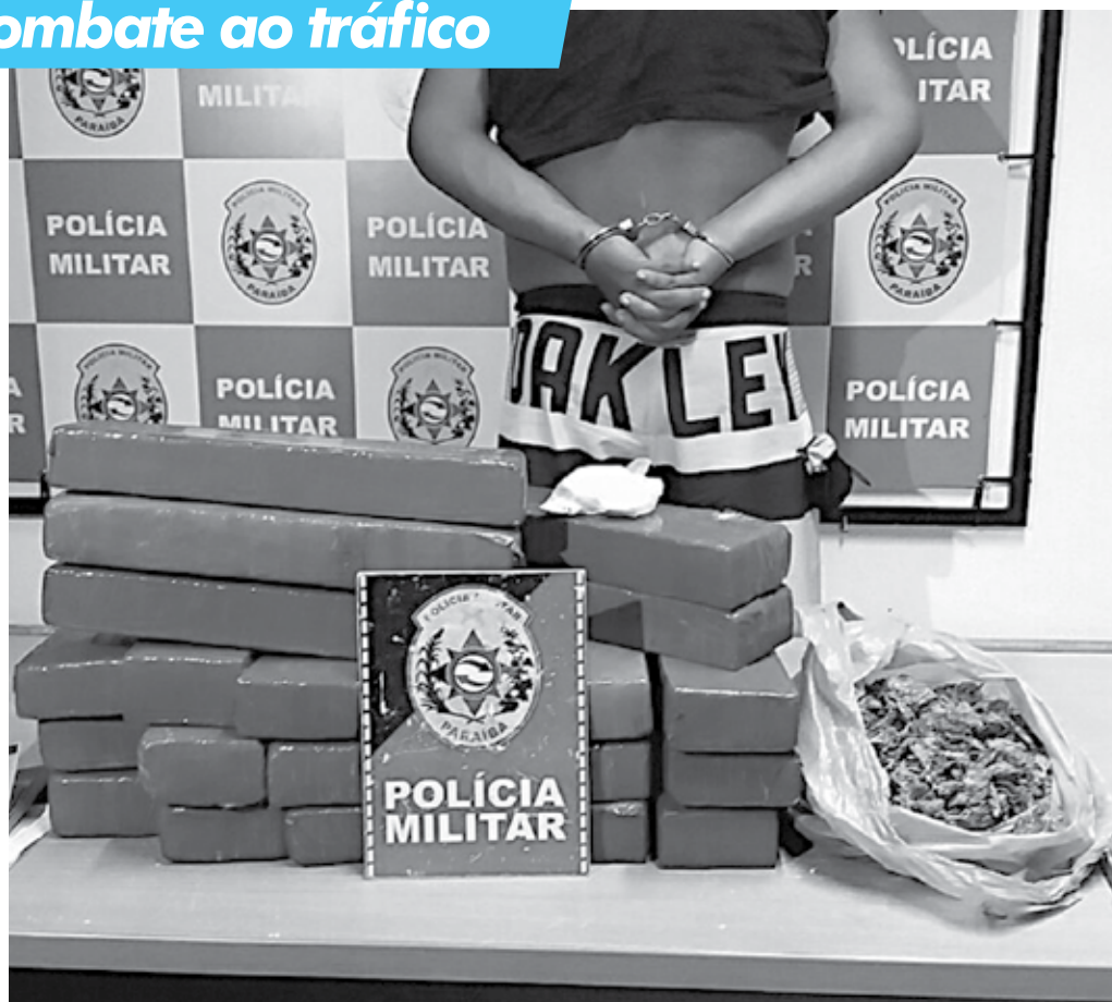
A droga foi apreendida nas proximidades de um shopping na Zona Sul da capital, dentro de um veículo