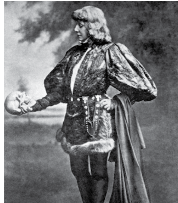
Personagem de Hallett, príncipe da Dinamarca, peça de Shakespeare