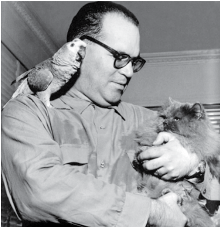
Guimarães Rosa é considerado um dos maiores escritores brasileiros

Considerado um dos maiores escritores brasileiros, o premiado mineiro João Guimarães Rosa (1908 - 1967) completaria, neste mês de junho, 110 anos de idade se estivesse vivo. No intuito de marcar - em tom de homenagem - o transcurso dessa data, acontece hoje, a partir das 19h, na Biblioteca Inspiração Nordestina, instalada no Centro Cultural do Banco do Nordeste (CCBNB) em Sousa, Município localizado no Sertão da Paraíba, uma discussão sobre a bibliografia do saudoso autor e o lançamento do livro intitulado Há Baile no Sertão: Guimarães Rosa em Obras Revisitadas, primeira publicação do Grupo Avançado de Estudos em Literatura (Gael), da cidade de Cajazeiras, entidade responsável por toda a programação especial. A entrada é gratuita para o público.