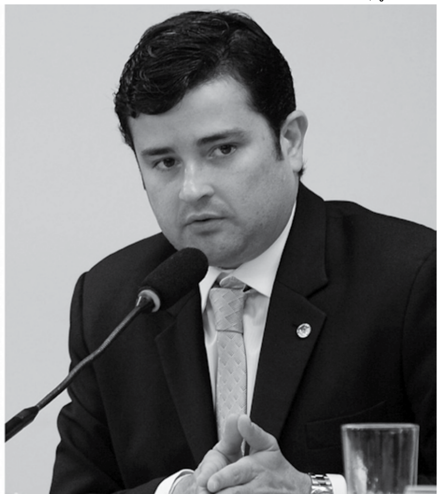
O senador Ciro Nogueira e o deputado federal Eduardo do Fonte são acusados de obstrução à Justiça e foram alvos de busca e apreensão em seus gabinetes pela Polícia Federal