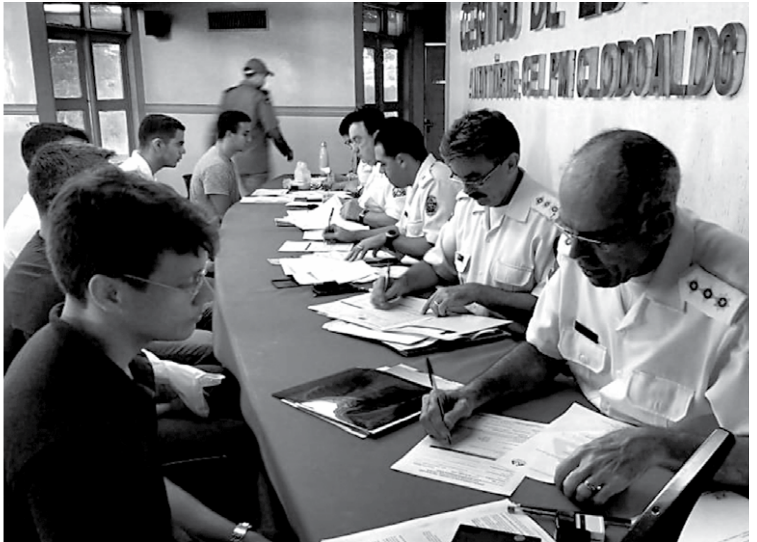
Exame de saúde é eliminatório e quem não estiver dentro das normas estabelecidas é excluído do certame para a Polícia e para o Corpo de Bombeiros

Ontem, no Centro de Educação da PM foram realizados mais uma fase dos exames de saúde com grupos de candidatos pela manhã e à tarde, no Centro de Educação da PM. Os testes de saúde acontecem até o próximo dia 29.