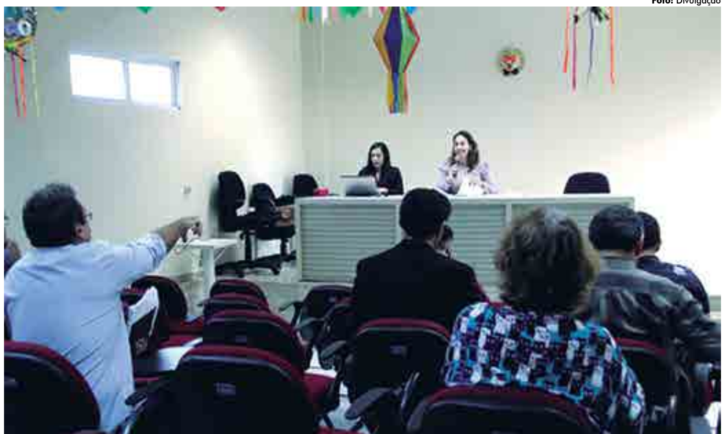
Notificação dos casos da doença em animais foi debatido na última segunda-feira em audiência realizada pela Promotoria da Saúde, na Capital