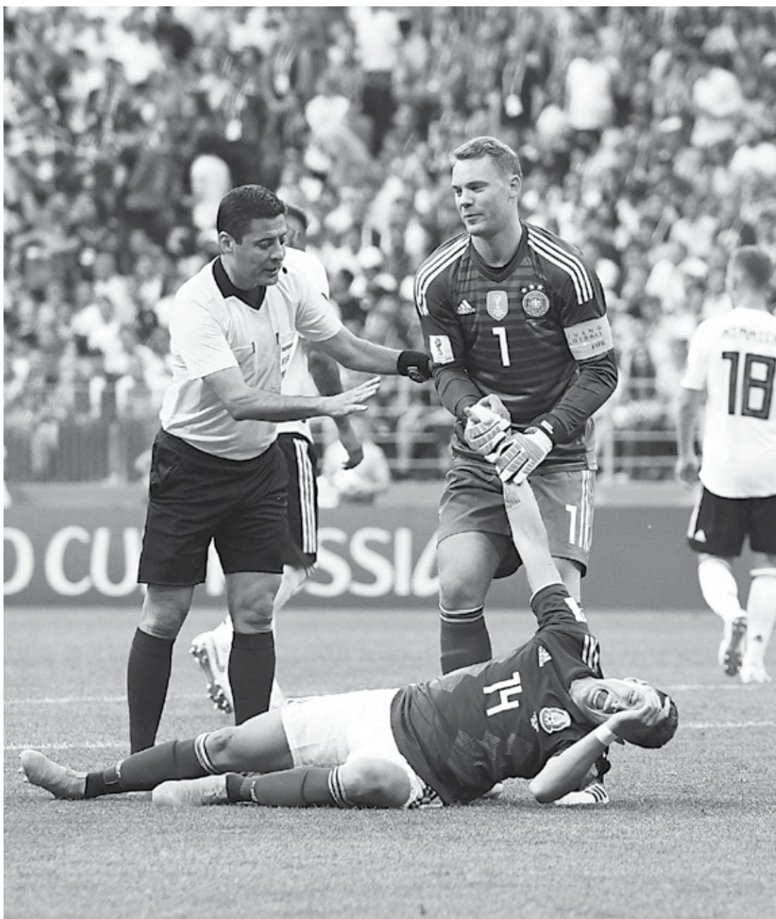
O goleiro alemão Neuer está confiante numa reabilitação depois da derrota de 1 a 0 diante do México

O goleiro Manuel Neuer foi enfático ao negar uma divisão dentro do elenco da seleção da Alemanha após a derrota na estreia da Copa