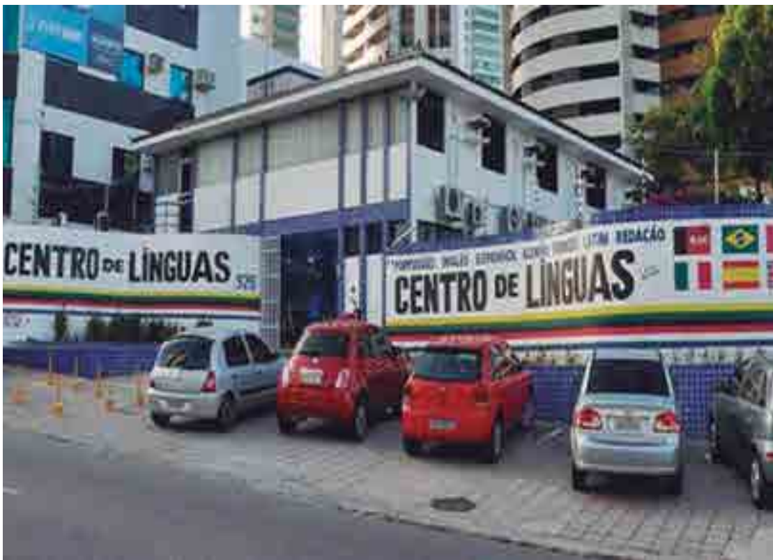
O Centro de Línguas, na Avenida Ruy Carneiro, oferece cursos de Inglês, Francês, Espanhol, Português e Redação

Em caso de dúvidas ou para mais informações os interessados podem entrar em contato com a equipe do Centro de Línguas da Paraíba pelo número (83) 99922-8235 ou pelo e-mail: centrodelinguaspb@gmail.com . A instituição também está nas redes sociais com perfil no Instagram e Facebook pelo @centrodelinguaspb.