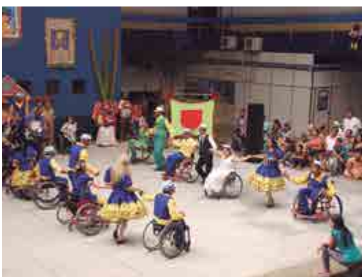
A quadrilha que reúne portadores de deficiência foi a principal atração do evento. Participante elogia a dedicação dos servidores da Funad com os usuários

O Arraial de São João no primeiro momento teve apresentação dos alunos do EJA. Posteriormente, apresentação do Quadrilhando sobre Rodas com sucessos de Luiz Gonzaga (Festa de Mangaio, Morena Bela, Puxada) e Mastruz com Leite (Feira Dançante).