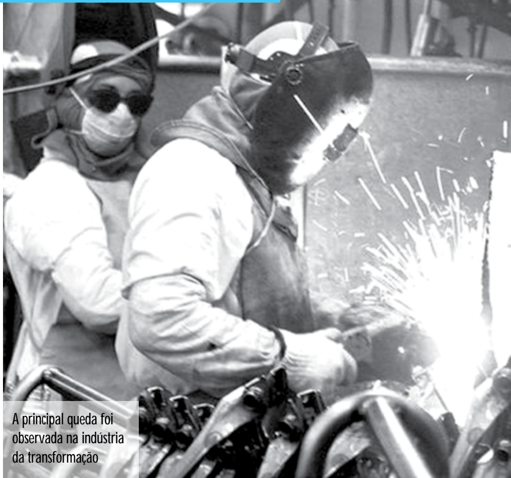
A principal queda foi observada na indústria da transformação