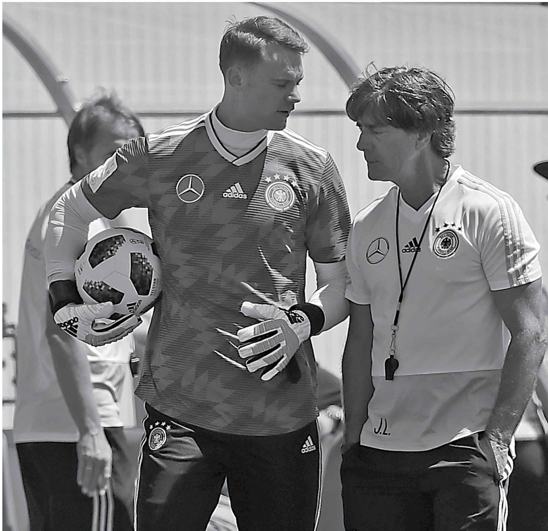
O goleiro Neuer e o técnico Joachim Löw conversam sobre o jogo deste sábado que pode definir a sorte da Alemanha na Copa do Mundo, no jogo diante da Suécia pela segunda rodada

No outro jogo do grupo, o líder México pega a Coréia do Sul mais cedo as 12h.