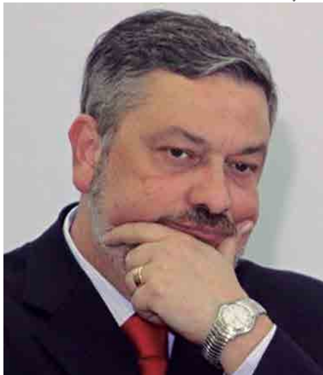
O ex-ministro Antonio Palocci está preso desde setembro de 2016 em função das investigações da Operação Lava Jato