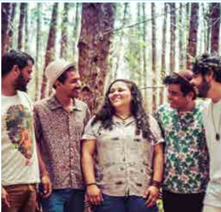
Flotilha em Alta-terra é a nova sensação musical de João Pessoa