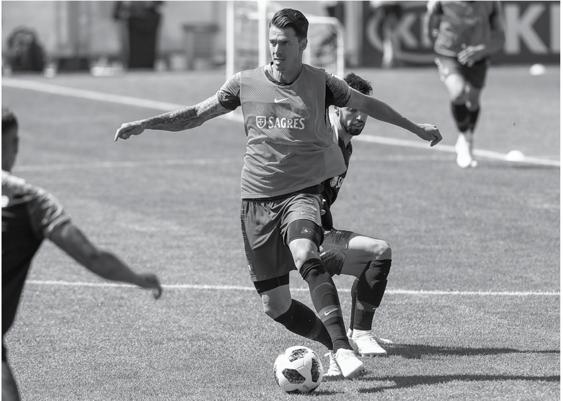
José Fonte reconheceu que a equipe não esteve bem contra o Marrocos, ganhando novamente com gol de Cristiano Ronaldo, e espera muito empenho do grupo pra conseguir a classificação

"Isso se demonstra em campo. Temos sempre a