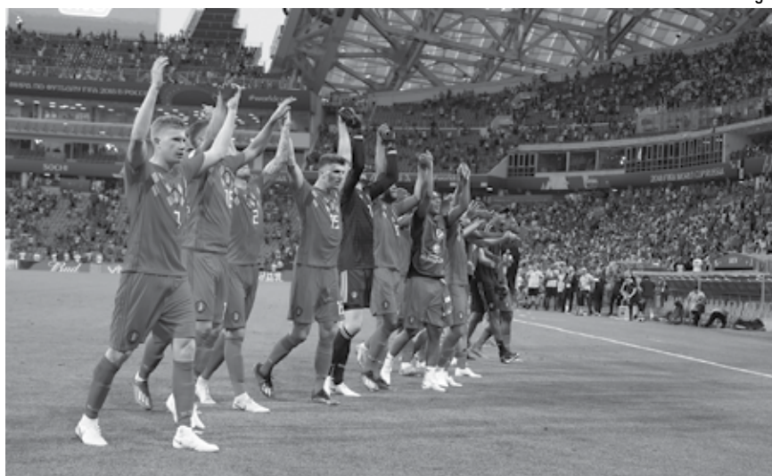
A Bélgica, que venceu bem na estreia da Copa, quer repetir a dose hoje diante da Tunísia

"Todos sempre esperam muito da Bélgica. Que sempre joguemos perfeitamente, que tenhamos 80% de posse, que chutemos 50 bolas por partida e marquemos 40 gols",