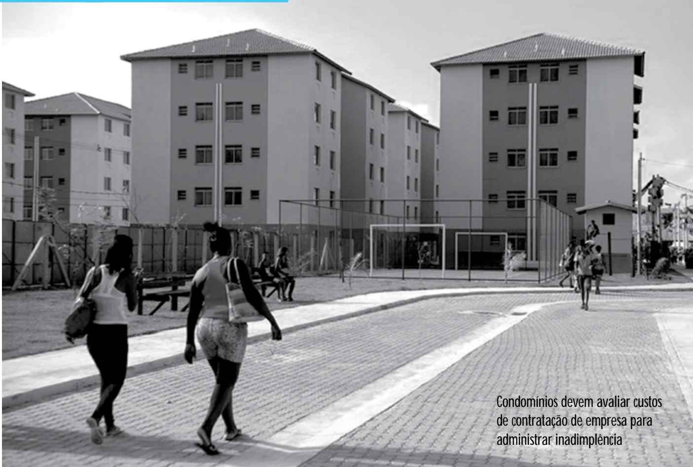
Condomínios devem avaliar custos de contratação de empresa para administrar inadimplência