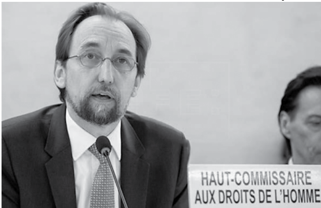
Alto comissário da ONU para os Direitos Humanos, Zeid Ra'ad al Hussein acusa a Venezuela de omissão

Especificamente, o relatório documenta as supostas execuções sumárias cometidas no decorrer de operações contra o crime organizado, chamadas de Operações de Libertação do Povo (OLP) entre 2015 e