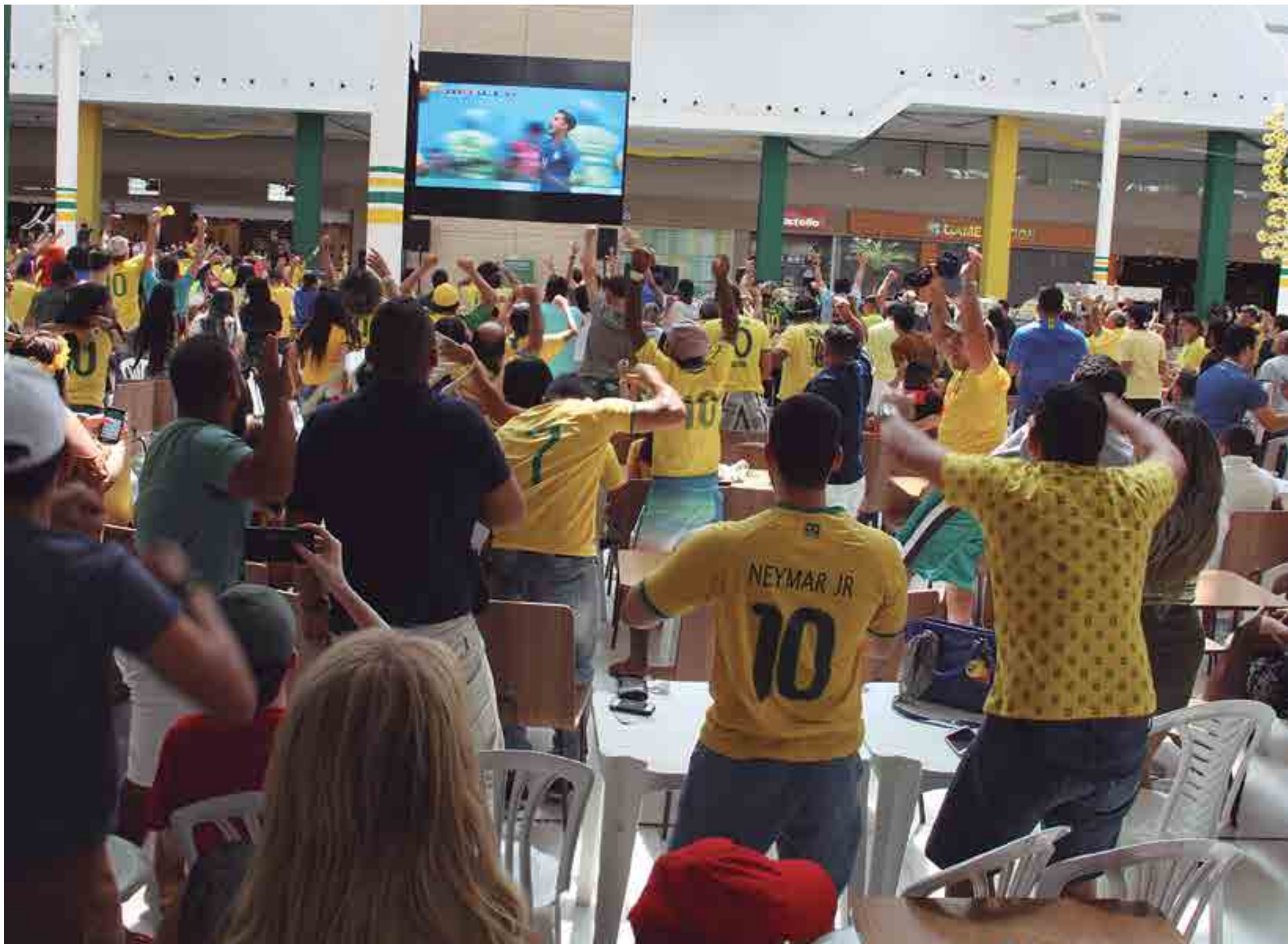
Nos shoppings da cidade e em diversos bares e restaurantes, os torcedores se reuniram para acompanhar o segundo jogo do Brasil na Copa do Mundo e sofreram novamente, mas desta vez comemoraram uma vitória da seleção