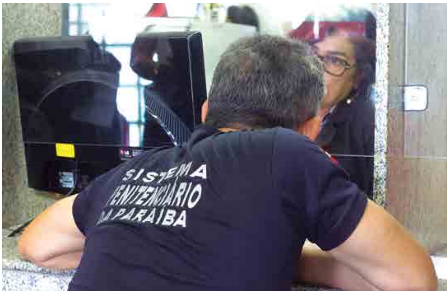
Agentes participam da campanha até o próximo dia 30 no Hemocentro de João Pessoa e Campina Grande e nos hemonúcleos de vários municípios