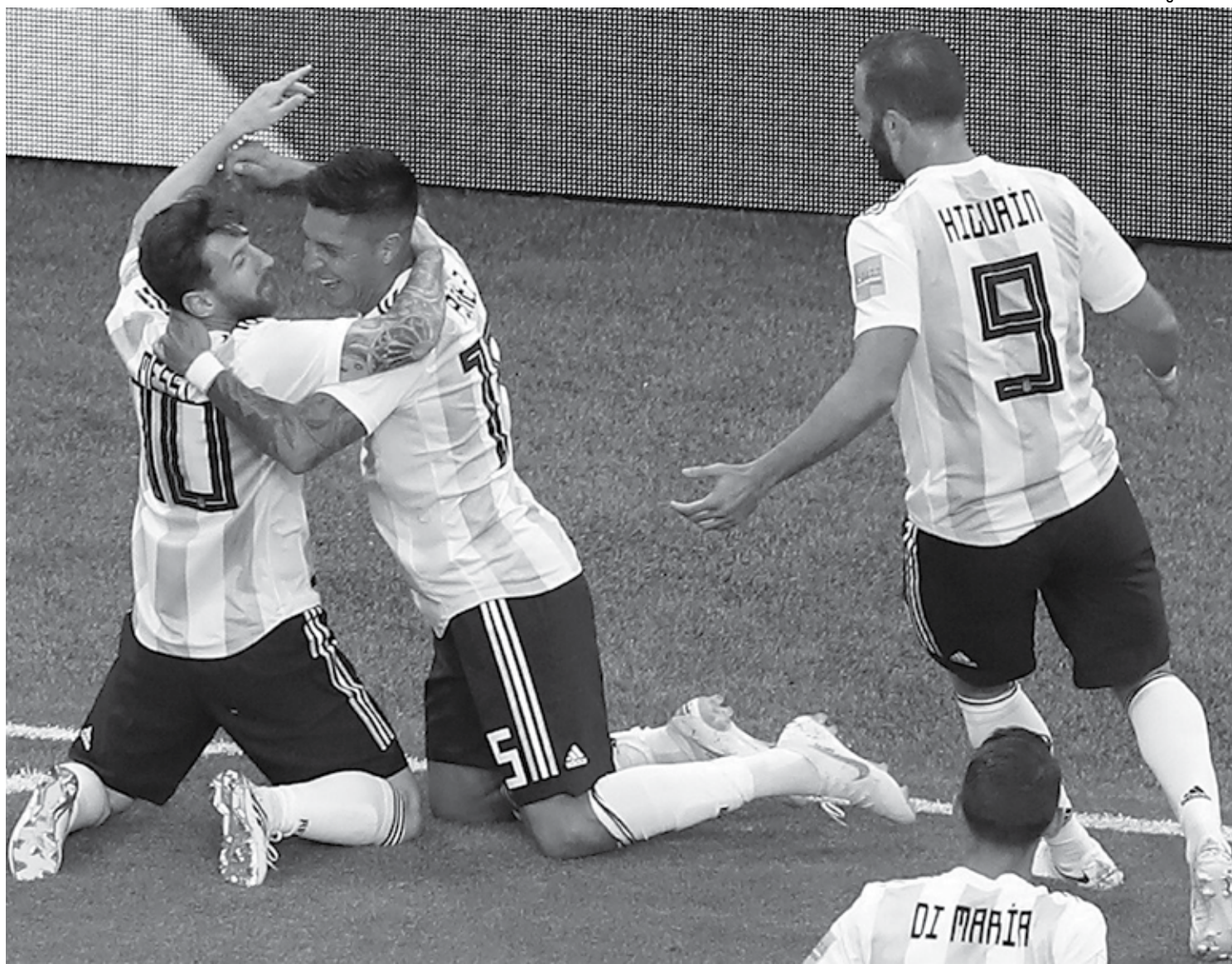
Argentinos comemoram o gol de Lionel Messi marcado no início do primeiro tempo; na segunda etapa, a seleção argentina chegou a correr risco de eliminação