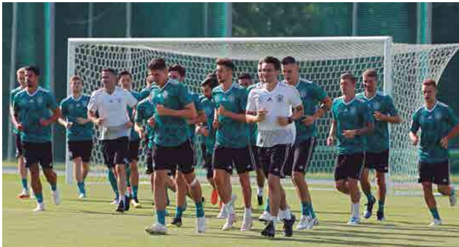
Tme alemão entra em campo hoje às 11h pelo Grupo F. Equipe germânica pode ser a adversária do Brasil nas oitavas de final da Copa do Mundo de 2018

No meio-campo, embora não tenha agradado na estreia, na derrota como o México, Khedira poderá recuperar a posição, já que Rudy, seu