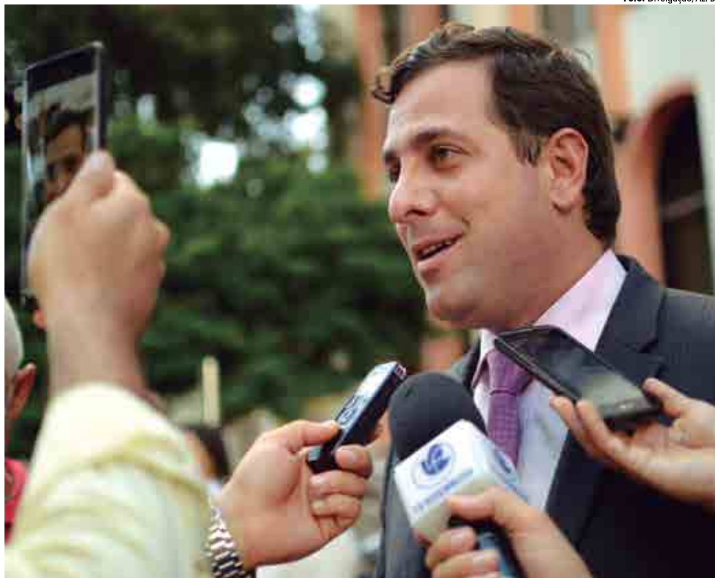
Para Gervásio Maia, o primordial da obra, além de acomodar melhor os servidores, foi garantir a permanência da sede do Poder Legislativo na Praça dos Três Poderes

Gervásio Maia afirmou ainda que o primordial da obra, além de acomodar melhor os servidores, foi garantir a permanência da sede do Poder Legislativo na Praça dos Três Poderes. "Além de promover uma modernização da Casa, a reforma vai garantir a permanência da Assembleia na Praça dos Três Poderes", destacou Gervásio. A reforma, ainda segundo o presidente, acaba com os problemas estruturais que existiam no prédio, adequando e melhorando a sede para que os servidores possam vir a desenvolver melhor suas atividades. "Esse projeto irá trazer soluções para o plenário, o comitê de imprensa