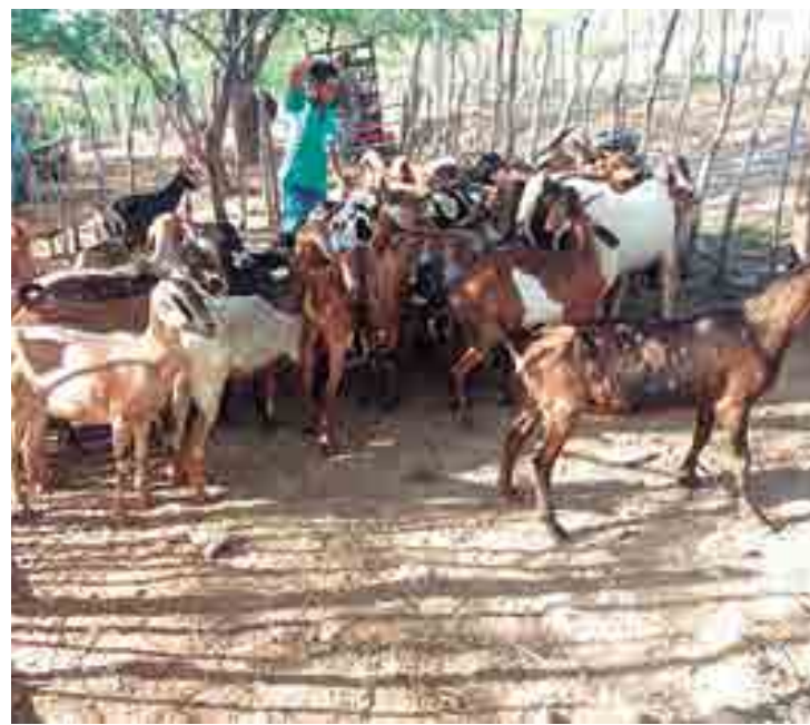
Associação da cidade de Frei Martinho recebeu 55 cabras e dois reprodutores

No município de Arara, a Associação dos Pequenos Produtores Rurais de Riacho Fundo conta com investimentos para fortalecer a ovinocultura. A comunidade recebeu do Procace 88 ovelhas e três reprodutores, além da instalação