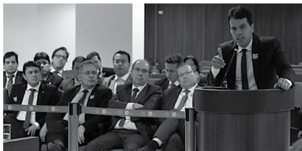
Procurador-geral Francisco Seráfico destaca que a luta do Ministério Público é também por independência

Seráfico requereu aos conselheiros o não conhecimento do procedimento de controle administrativo (PCA), instaurado no CNMP