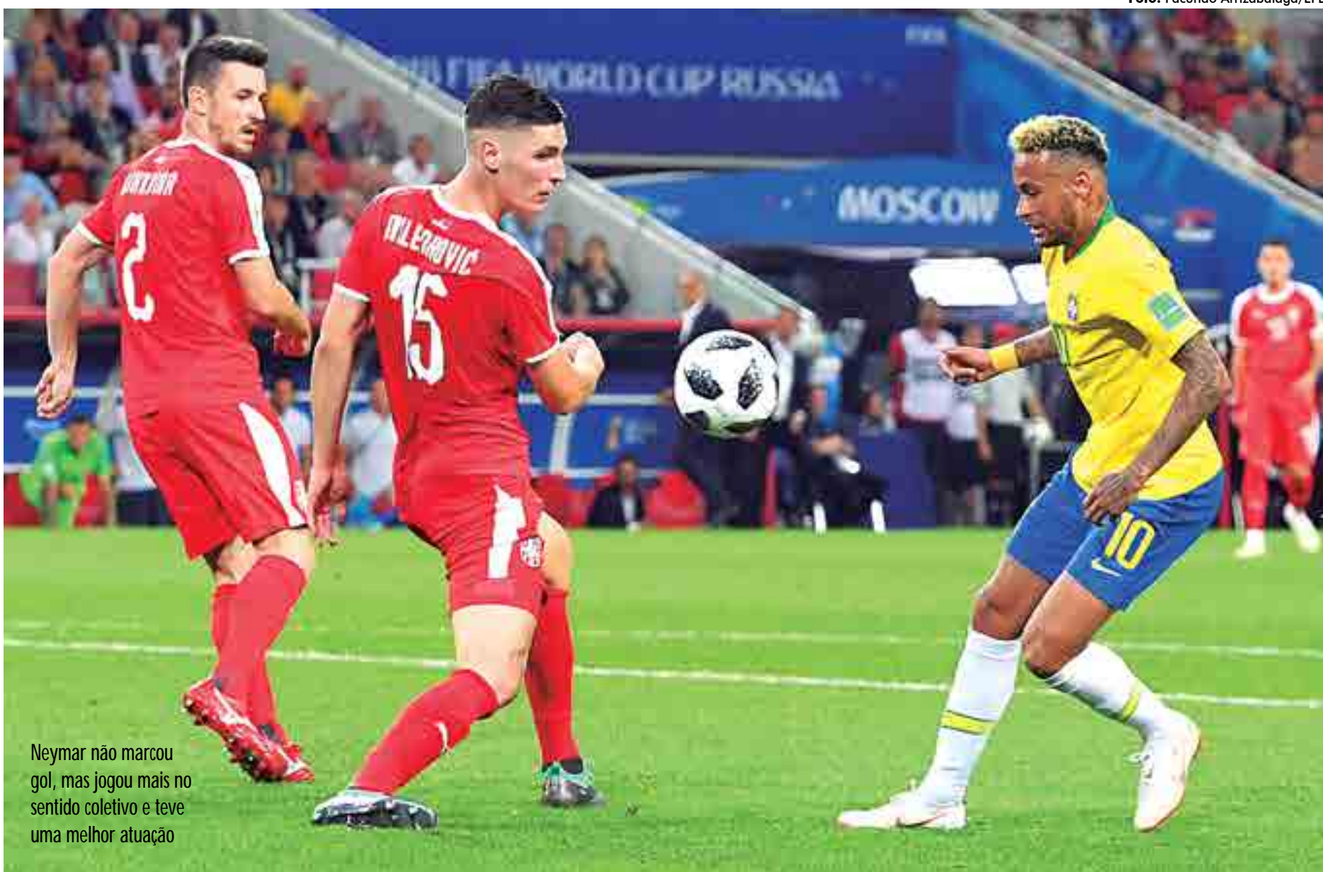
Neymar não marcou gol, mas jogou mais no sentido coletivo e teve uma melhor atuação

Neymar foi o primeiro a abraçar Paulinho no primeiro gol. Vibrou! No segundo tempo, quando a seleção passava por apuros diante da ofensiva sérvia, foi cobrar um escanteio e pediu apoio da torcida, que respondeu prontamente. Foi logo depois, no mesmo canto, que o camisa 10 cobrou o escanteio preciso na cabeça de