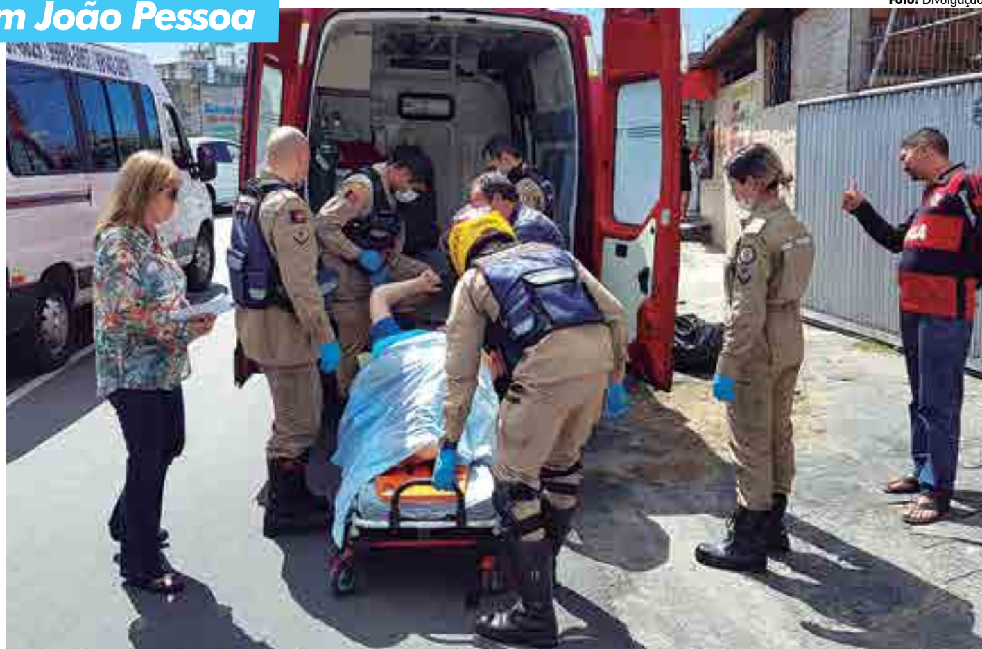
Após constatar necessidade de atendimento, a Promotoria acionou o Corpo de Bombeiros, pois o Samu não dispõe de maca para transportar pacientes obesos