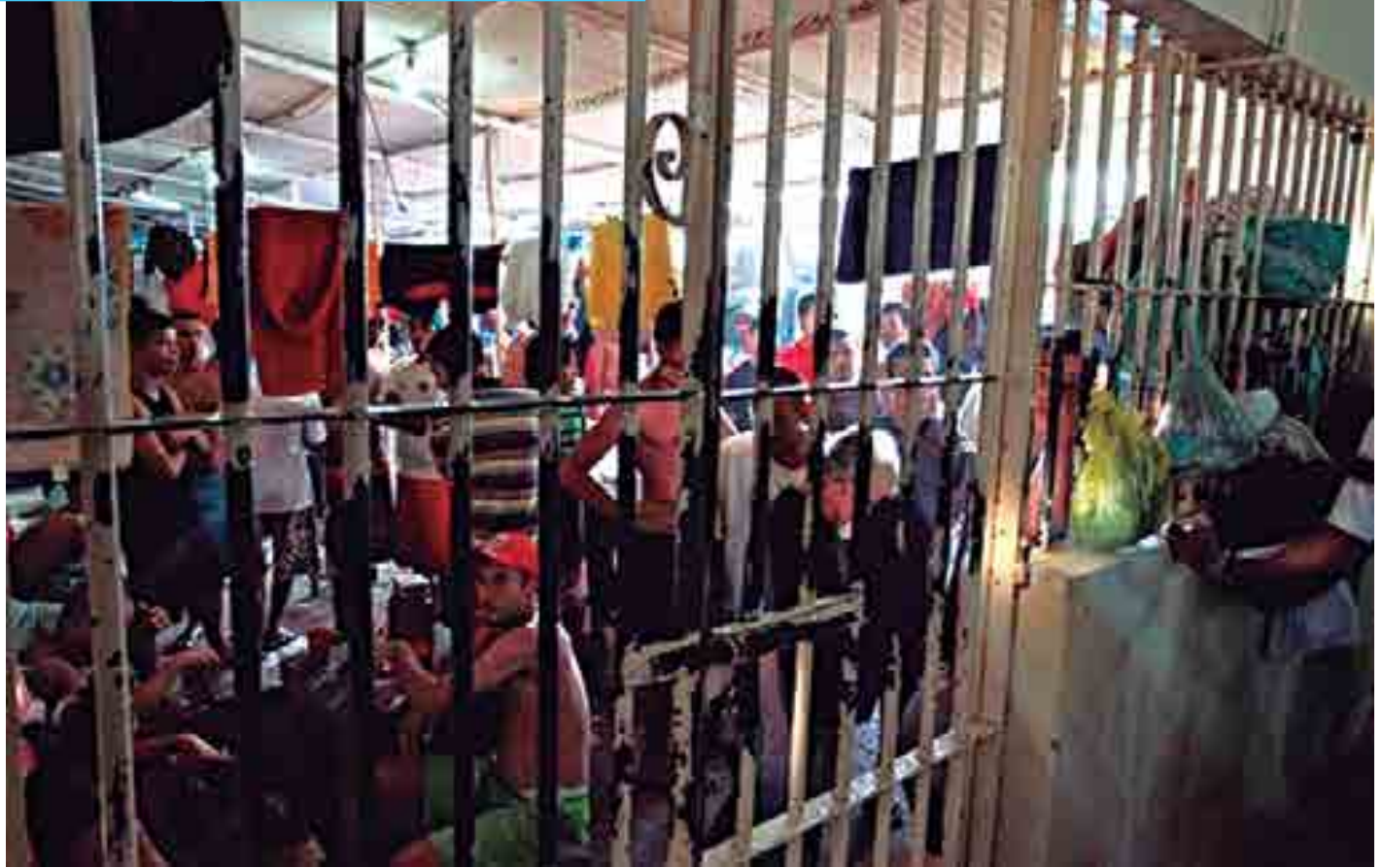
Durante a confusão, no Centro de Recuperação Agrícola Mariano Antunes, em Marabá (PA), outros dois detentos morreram em confronto com policiais