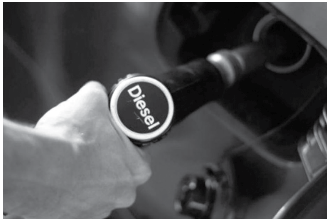
A segunda parcela do preço do óleo diesel entra em vigor a partir do próximo domingo, dia 1º de julho

O Preço Médio Ponderado ao Consumidor Final (PMPF) é o indicador de preço médio do litro de combustível sobre o qual é aplicada a tributação de ICMS nos es-