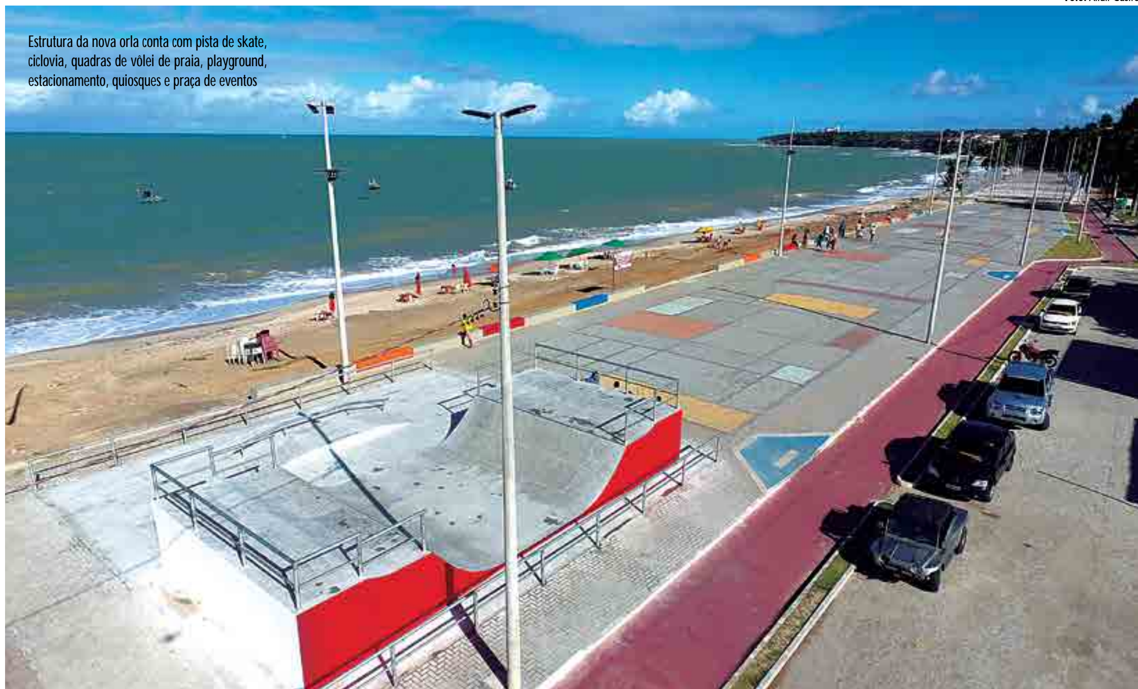
Estrutura da nova orla conta com pista de skate, ciclovia, quadras de vôlei de praia, playground, estacionamento, quiosques e praça de eventos