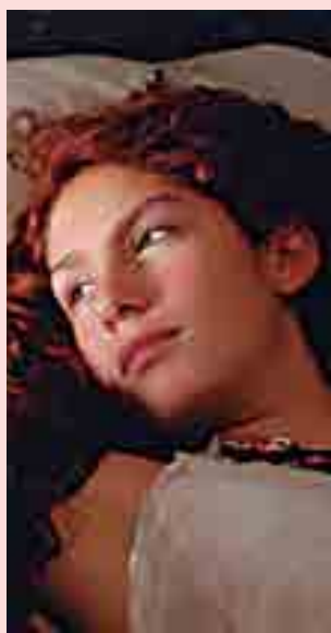
Cena do longa de Hilda Hidalgo

Baseado no romance homônimo lançado em 1994 pelo saudoso escritor colombiano Gabriel García Márquez (1927 - 2014), que ganhou o Prêmio Nobel de Literatura em 1982 pelo conjunto da obra, o longa-metragem intitulado Do Amor e Outros Demônios será exibido hoje, a partir das 18h, dentro da programação do Cineclube "Verbo & Imagem", da Academia Paraibana de Letras (APL), localizada na cidade de João Pessoa. A sessão é única, gratuita e quem vai comentar o filme com o público é o escri-