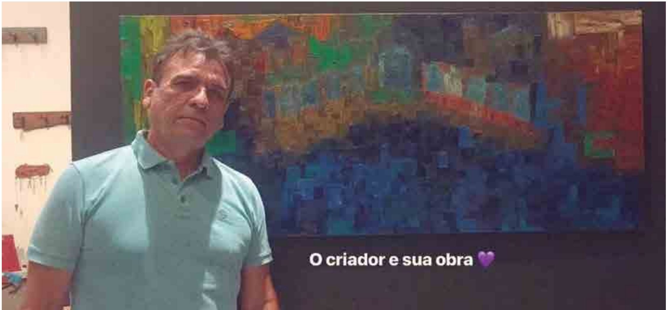
O criador e sua obra