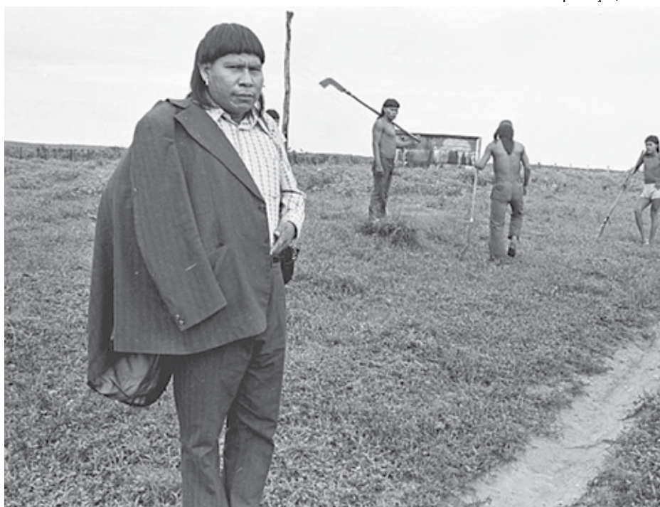
Juruna não conseguiu se eleger novamente e morreu em 2002, aos 58 anos, no Guará, cidade próxima a Brasília

O discurso contundente de Krenak pela aprovação da Emenda Popular da União das Nações Indígenas, apoiado por uma mobilização indígena sem precedentes, foi decisivo para assegurar uma identidade cultural própria quanto à organização social, às línguas, à religião e às tradições e estabelecer o direito inalienável