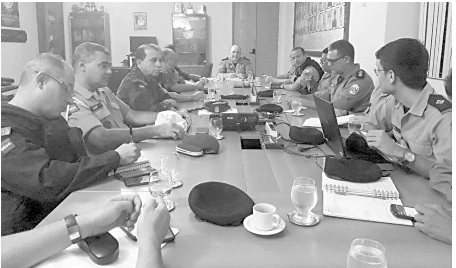
Mais de 100 suspeitos foram detidos no fim de semana, com a apreensão de 29 armas de fogo em todo o Estado. O destaque foi uma ação na cidade de Bom Sucesso, no Sertão, com a prisão de uma quadrilha

A Polícia Militar vai realizar várias operações no mês de maio, com foco na prevenção dos crimes contra a vida e contra o patrimônio, na Paraíba. O anúncio foi feito pelo próprio comandante-geral da PM, coronel Euler Chaves, que reuniu os oficiais para avaliar o resultado da Operação Rotas (Rondas Táticas Avançadas) e da atuação no concurso realizado nesse domingo.