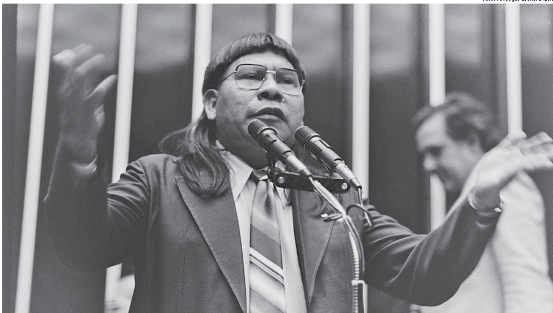
O cacique xavante Mário Juruna se tornou o primeiro e único parlamentar indígena do país, eleito com 31 mil votos pelo PDT do Rio de Janeiro, com apoio de Darcy Ribeiro e Leonel Brizola

ao bater de frente com o governo militar. “Todo ministro é a mesma panelinha, é a mesma cabeça. Não tem ministro nenhum que presta. Para mim todo ministro é corrupto, ladrão, sem-vergonha e mau-caráter. Não vou dizer que todo ministro é bom, legal e justo. Vou dizer que todo ministro é do mesmo saco que aproveita