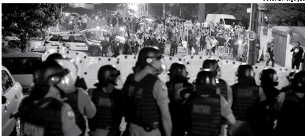
Policiais já feriram um grande número de pessoas durante as manifestações ocorridas em Curitiba