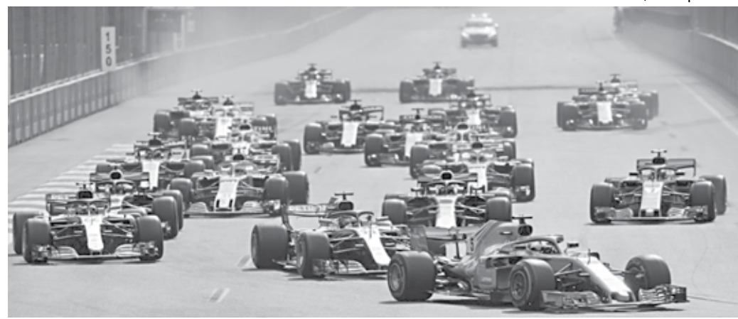
Corrida realizada no último final de semana foi uma das mais atrapalhadas dos últimos anos da Fórmula 1