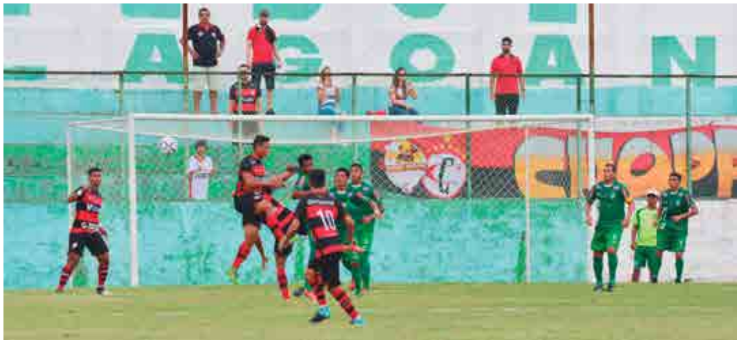
Campinense teve uma atuação perfeita contra o Murici, no sábado, e agora espera repetir a façanha contra o CRB, hoje, na capital alagoana