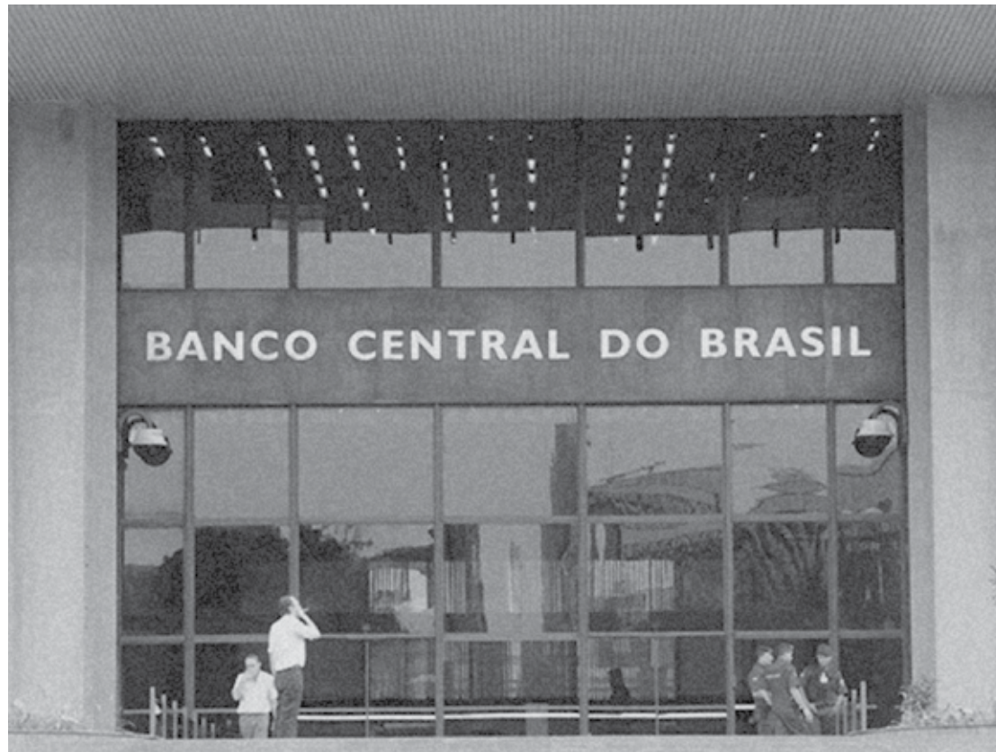
Segundo dados do Banco Central, divulgados ontem, os governos estaduais tiveram superávit primário de R$ 291 milhões

Em 12 meses encerrados em março, as contas públicas estão com saldo negativo de R$ 108,389 bilhões, o