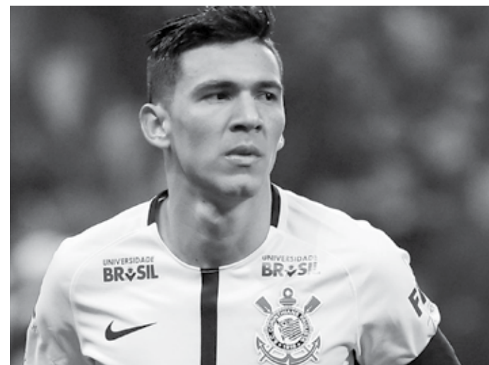
Balbuena é um dos destaques da excelente defesa do Corinthians

Depois do Independiente, Carille e seus comandados terão pela frente o Ceará, às 11h (de Brasília) do domingo, pelo Brasileiro. Depois, o rival será o Vitória, na quinta-feira, 10 de maio, decidindo uma vaga nas quartas de final da Copa do Brasil. Para encerrar, nada melhor do que um Derby, no domingo, dia 13, outra vez pelo Brasileiro.