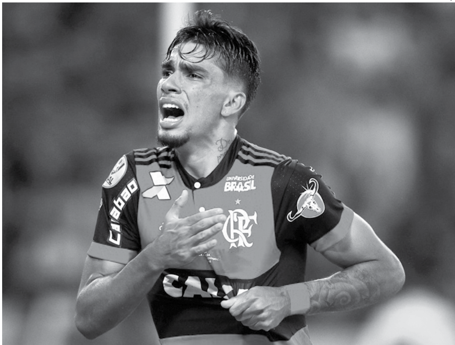
Em um elenco cheio de estrelas milionárias, o jovem Lucas Paquetá deixou de ser uma promessa e se tornou o craque do Flamengo no Brasileirão

Além do desvio no escanteio cobrado por Rodinei, o qual Diego completou e fez o terceiro gol, Lucas Paquetá foi o responsável por ditar o ritmo da equipe.