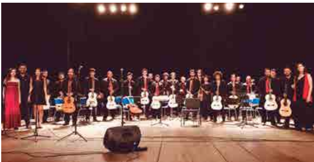
A Orquestra de Violões da Paraíba contribui de forma direta para a formação de novos instrumentistas