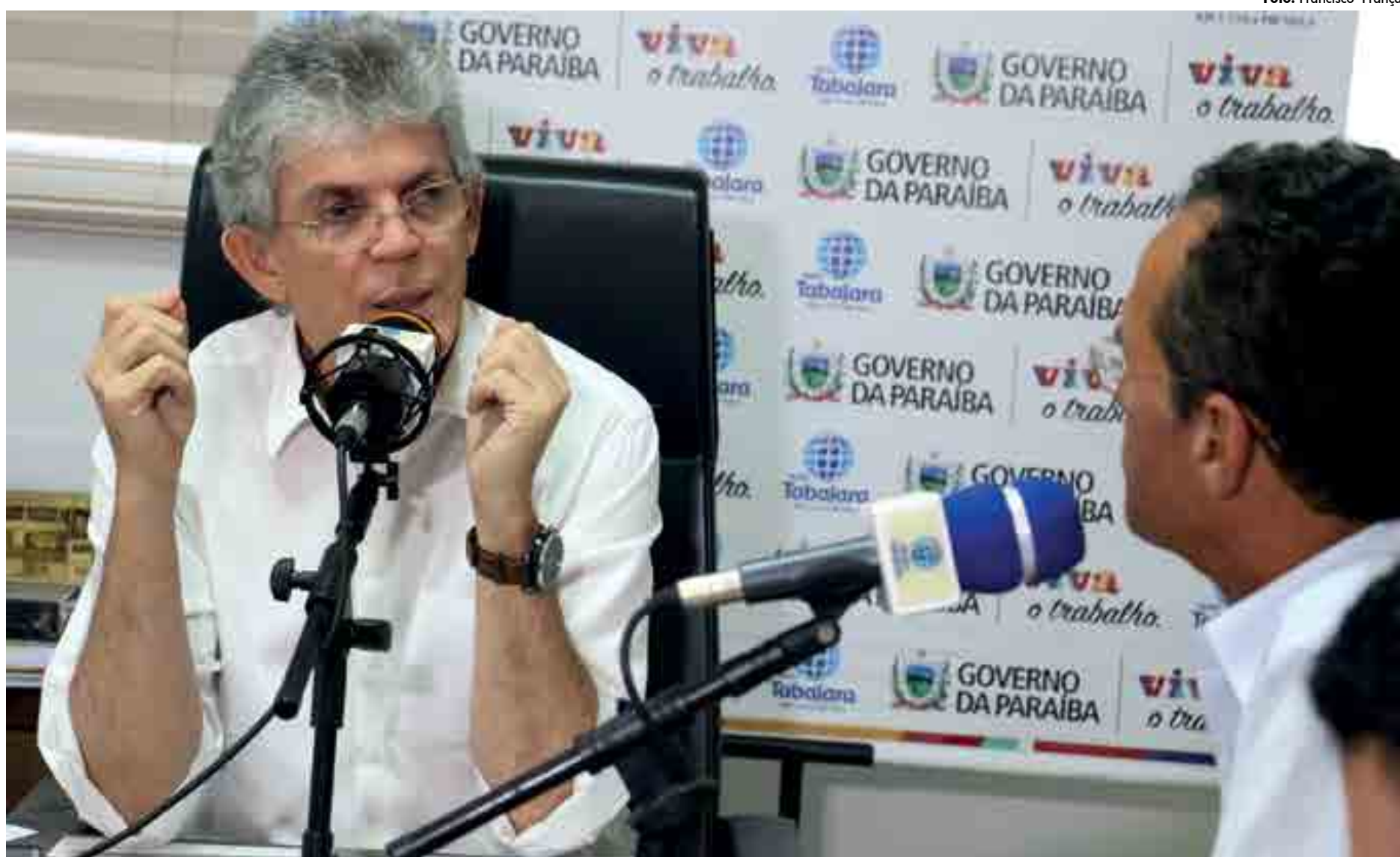
Para o governador Ricardo Coutinho, todos os poderes devem adequar o orçamento, os gastos e o custeio ao momento de crise financeira enfrentada em todo o país, assim como o Executivo tem feito na PB

Governador ressaltou que, ao passo que o governo reduziu gasto com pessoal, a atual gestão do TJ mantém mais de 400 funcionários com altos salários