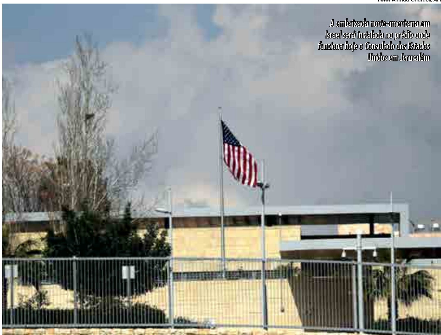
A embaixada norte-americana em Israel será instalada no prédio onde funciona hoje o Consulado dos Estados Unidos em Jerusalém

A decisão do presidente dos EUA, Donald Trump, de transferir a embaixada de Tel Aviv para Jerusalém foi muito polêmica, criticada pela União Europeia e por países árabes porque rompe com o consenso internacional de não reconhecer a cidade como capital da Palestina ou de Israel até que um acordo de paz seja firmado.