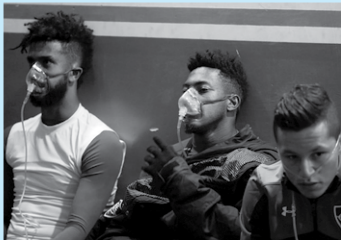
Jogadores do Fluminense recebendo oxigênio no banco de reservas