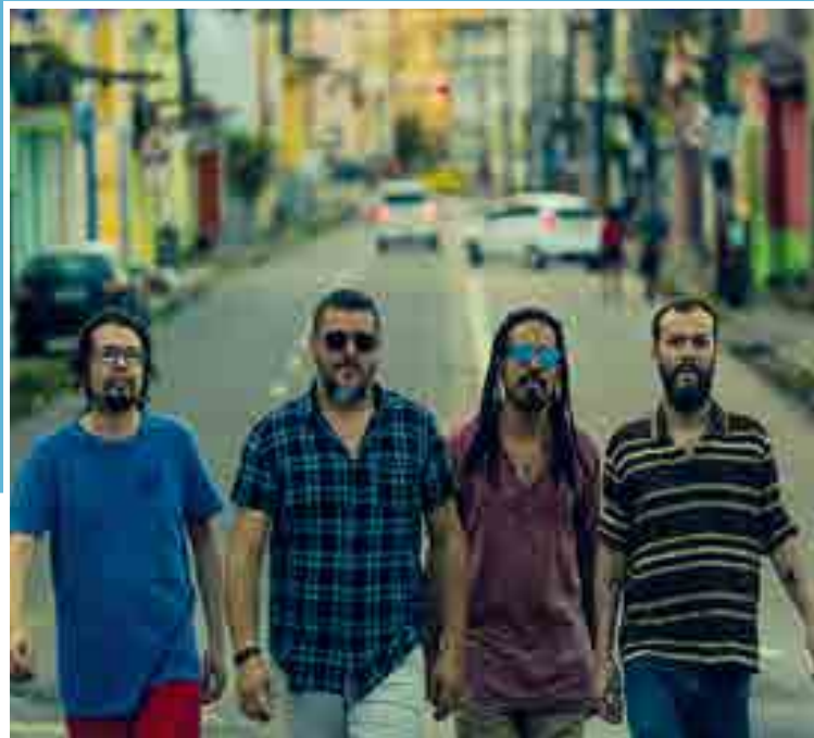
Seu Pereira e Coletivo 401 são donos do hit “Eu não sou boa influência pra você”