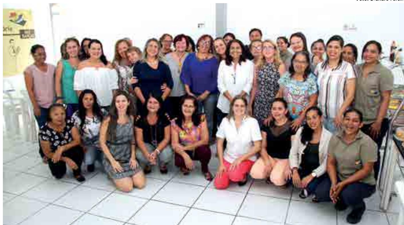
Cerca de 30 mulheres servidoras de A União Superintendência de Imprensa e Editora participaram do café da manhã oferecido no refeitório da empresa