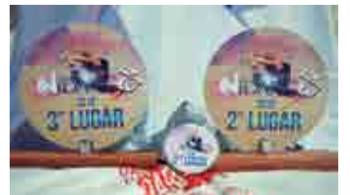
Algumas das medalhas obtidas pelos dançarinos