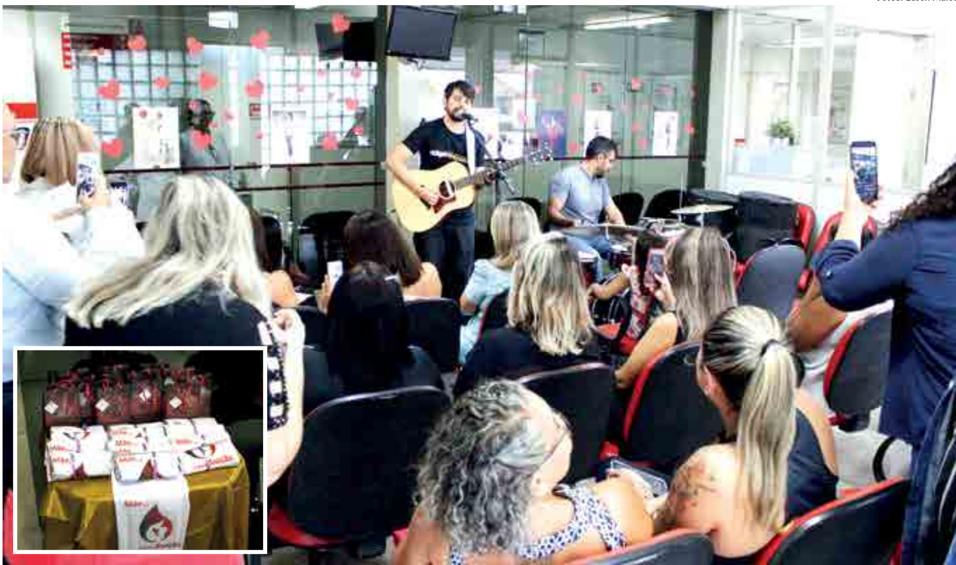
Dez mães doadoras assíduas foram convidadas para a homenagem, que teve como tema "Mãe é Pura Emoção" e contou com apresentação musical e distribuição de brindes no Hemocentro

Segundo a diretora-geral do Hemocentro da Paraíba, comparando os quatro primeiros meses de 2017 com 2018, houve um aumento de