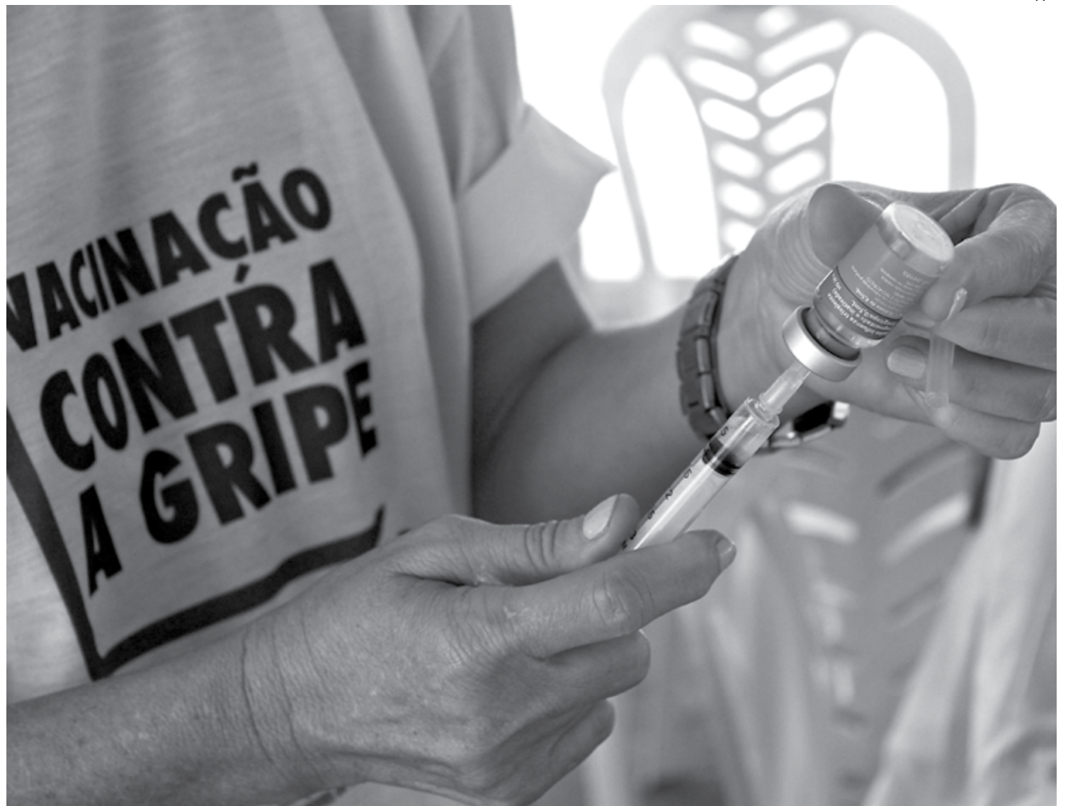
Vacinação é uma das medidas mais efetivas para a prevenção da influenza grave e de suas complicações; meta é vacinar 90% do público-alvo na Paraíba

Para o diretor de Planejamento e Gestão da Secretaria Municipal de Saú-