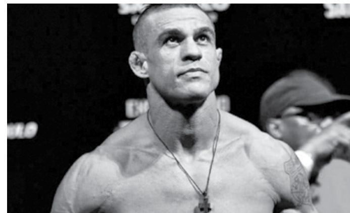
Vitor Belfort gostaria de lutar na Rússia com Fedor Emelianenko