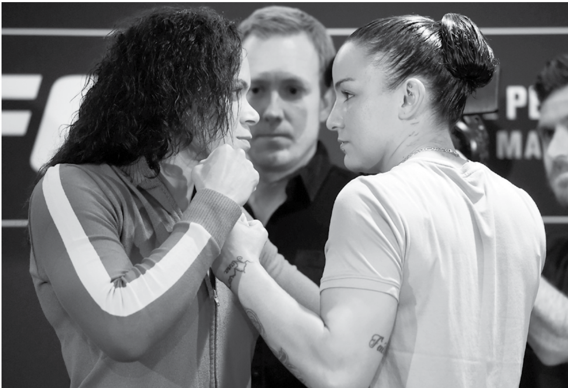
A baiana Amanda Nunes e a desafiante, a norte-americana Raquel Pennington: frente a frente na última quinta-feira em cena de promoção da luta que acontece neste sábado no Rio de Janeiro

Protagonistas da co-luta principal da noite, Ronaldo Jacaré e Kelvin Gastelum também foram só amizade e profissionalismo. Se cumprimentaram e sorriram, sem forçar