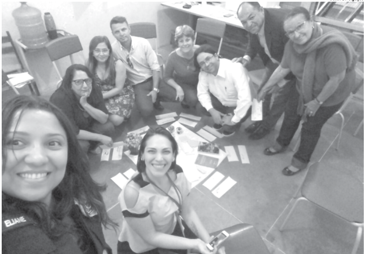
Participaram do treinamento os assistentes sociais, psicólogos, advogado, diretor, vice-diretor e agentes socioeducativos do Lar do Garoto