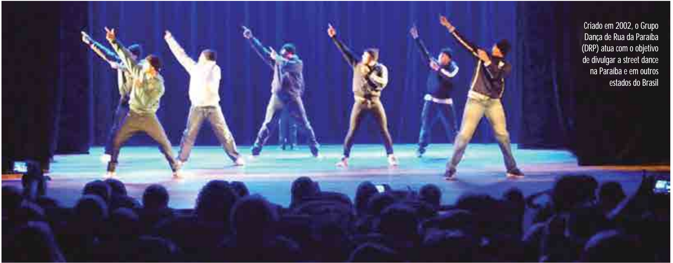
Criado em 2002, o Grupo Dança de Rua da Paraíba (DRP) atua com o objetivo de divulgar a street dance na Paraíba e em outros estados do Brasil