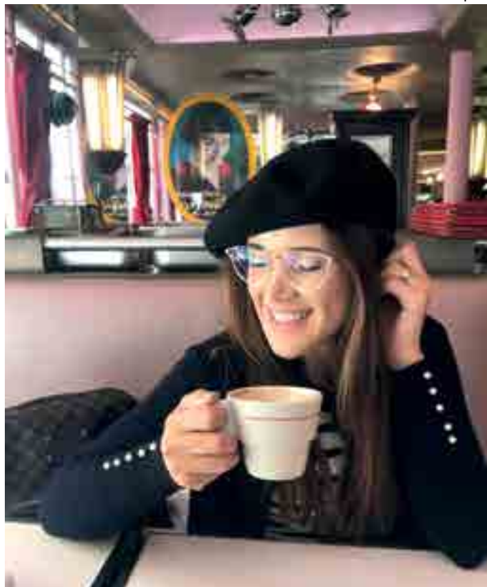
A cantora Marcella Maul no Café des 2 Moulins, do filme Amélie Poulain

● Turismo - Um grupo de quatro jornalistas argentinos desembarca neste sábado em João Pessoa para uma visita de seis dias a vários roteiros turísticos do nosso Estado. A ideia é massificar os roteiros turísticos da Paraíba junto ao leitor das revistas Lonely Planet e Lugares e do jornal La Nación. O retorno dos argentinos a Buenos Aires acontece na sexta-feira, 18.