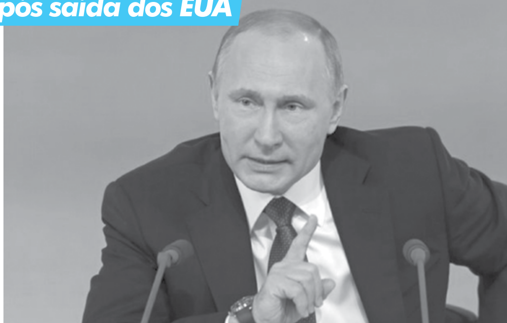
Russo multiplicou os contatos diplomáticos com vários países, após Trump anunciar a saída dos EUA do acordo