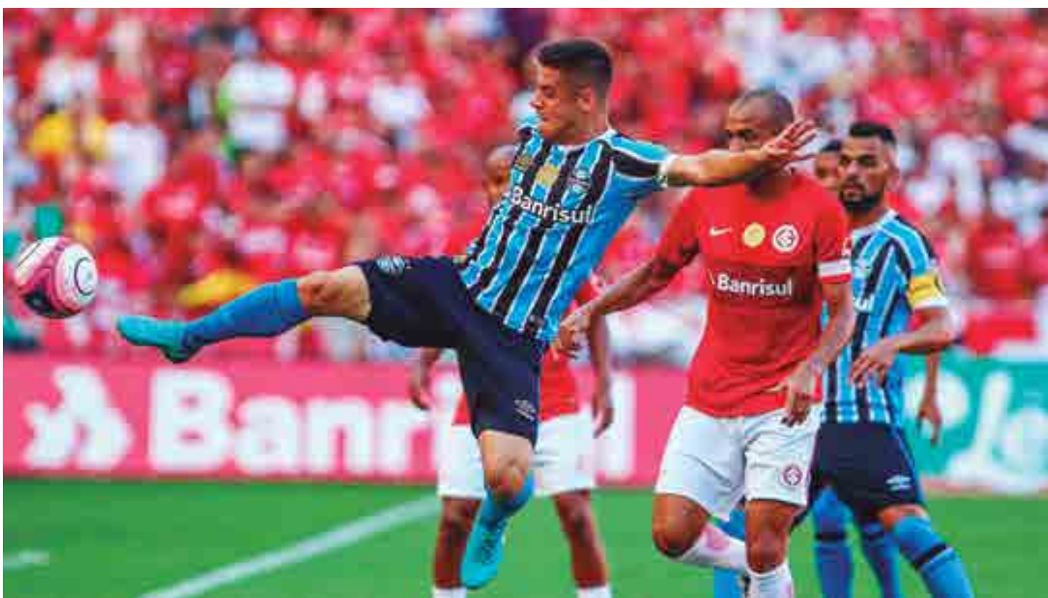
No Campeonato Gaúcho, o Internacional foi eliminado pelo Grêmio, embora no último jogo tenha vencido por 2 a 0. No Brasileiro, o Inter vai muito mal