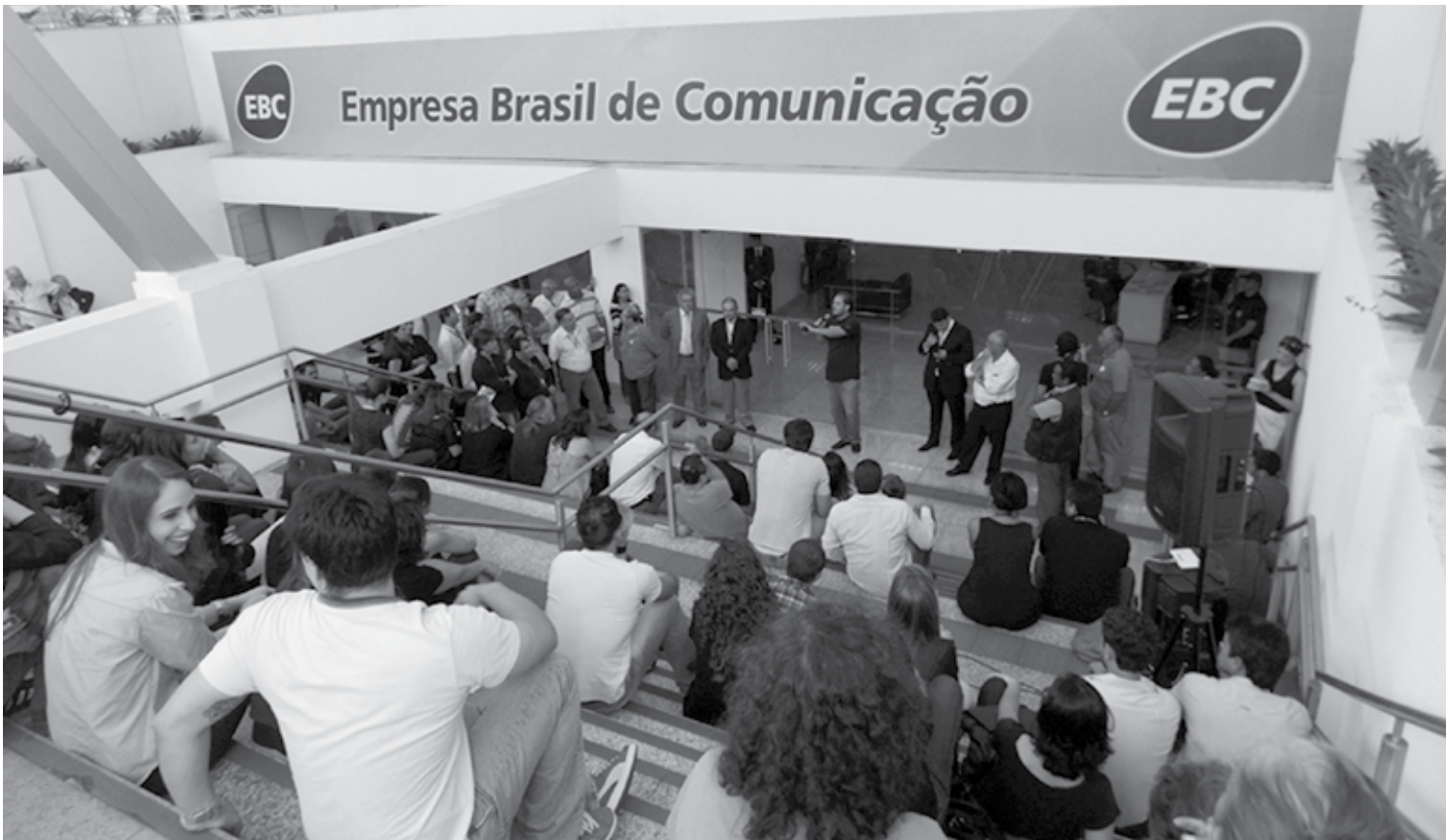
Todas as empresas avaliadas passaram a elaborar o Plano de Auditoria Interna e o Relatório de Anual de Atividades da Auditoria Interna para avaliação

“O fortalecimento das empresas estatais é importante não só para o governo. É importante para o país, é