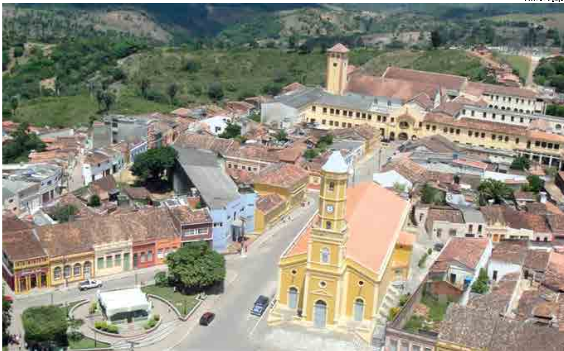
Vista aérea da cidade de Areia, onde está o Sítio Vaca Brava, em área de floresta atlântica: foi nessa região que houve os problemas relatados na ação criminal que correu no TJ da Paraíba