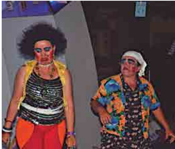
A peça 'A Feia de Caruaru' será apresentada hoje; amanhã, o público cajazeirense e da região pode conferir a comédia 'A Bela e o Lobisomem'

Já nos dias 26 e 27 de maio, será apresentada a peça "O Palhaço do Planeta Verde", com texto de Hilton Have e direção de Francisco Hernandez, sempre às 17 horas. O espetáculo conta a estória de um palhaço que vem de um planeta distante da terra em busca de novas brincadeiras e ao chegar no planeta terra se depara com duas crianças que moram numa fazenda e que estão a caminho da escola. O encontro acontece na roça de uma mulher solitária que mantém um roçado vigiado por um espantalho.