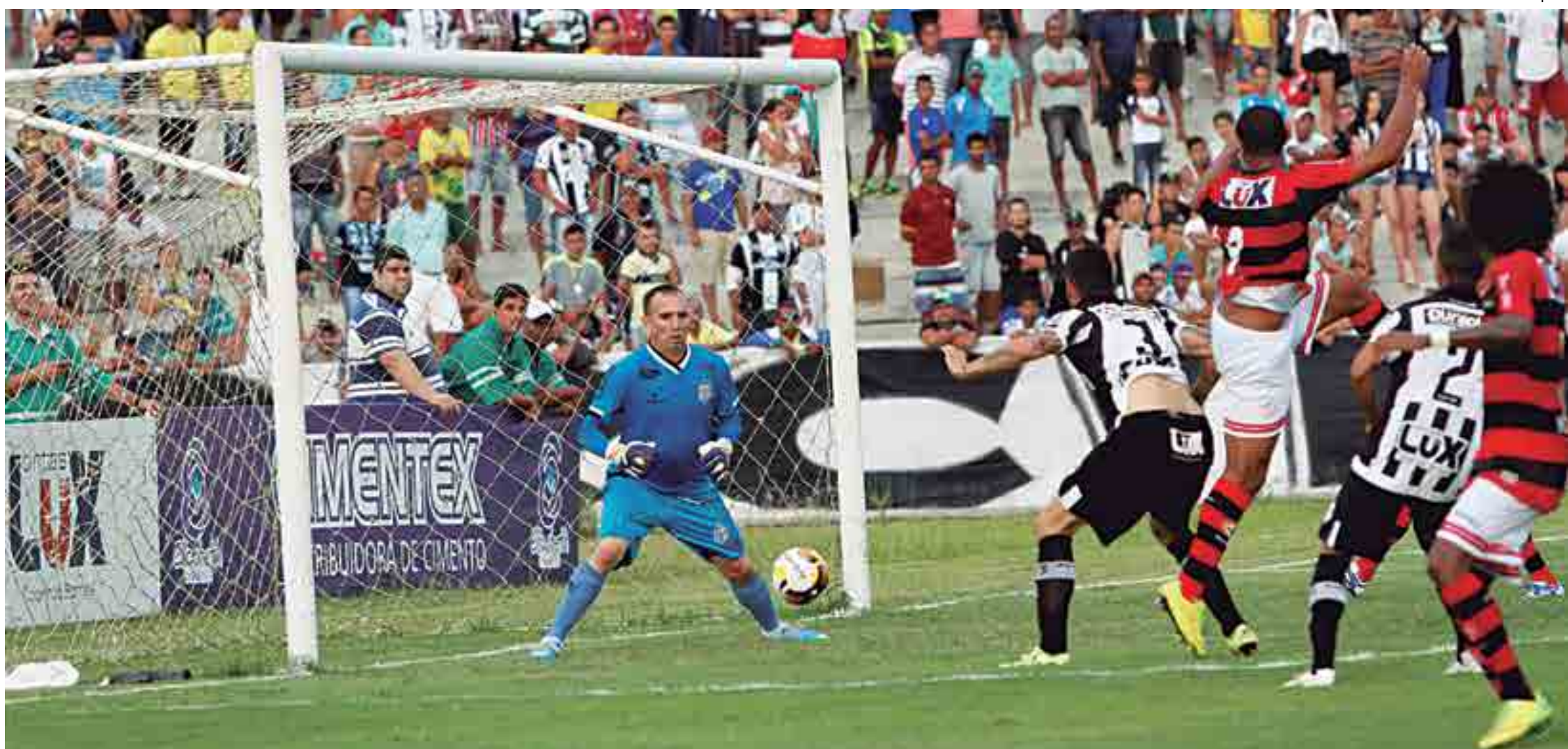
Segundo denúncias contidas em depoimento da Operação Cartola, o Treze teria sido beneficiado no Clássico dos Maiorais contra o Campinense, no Campeonato Paraibano de 2016, com a ajuda de um bandeirinha