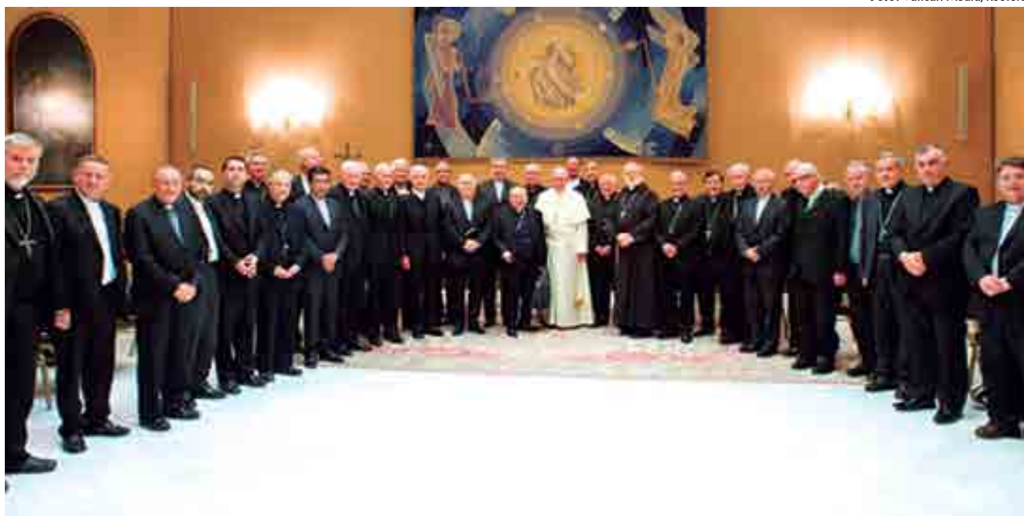
O papa Francisco posou com os bispos chilenos que compareceram ao Vaticano para apresentar sua defesa sobre o escândalo de abuso sexual