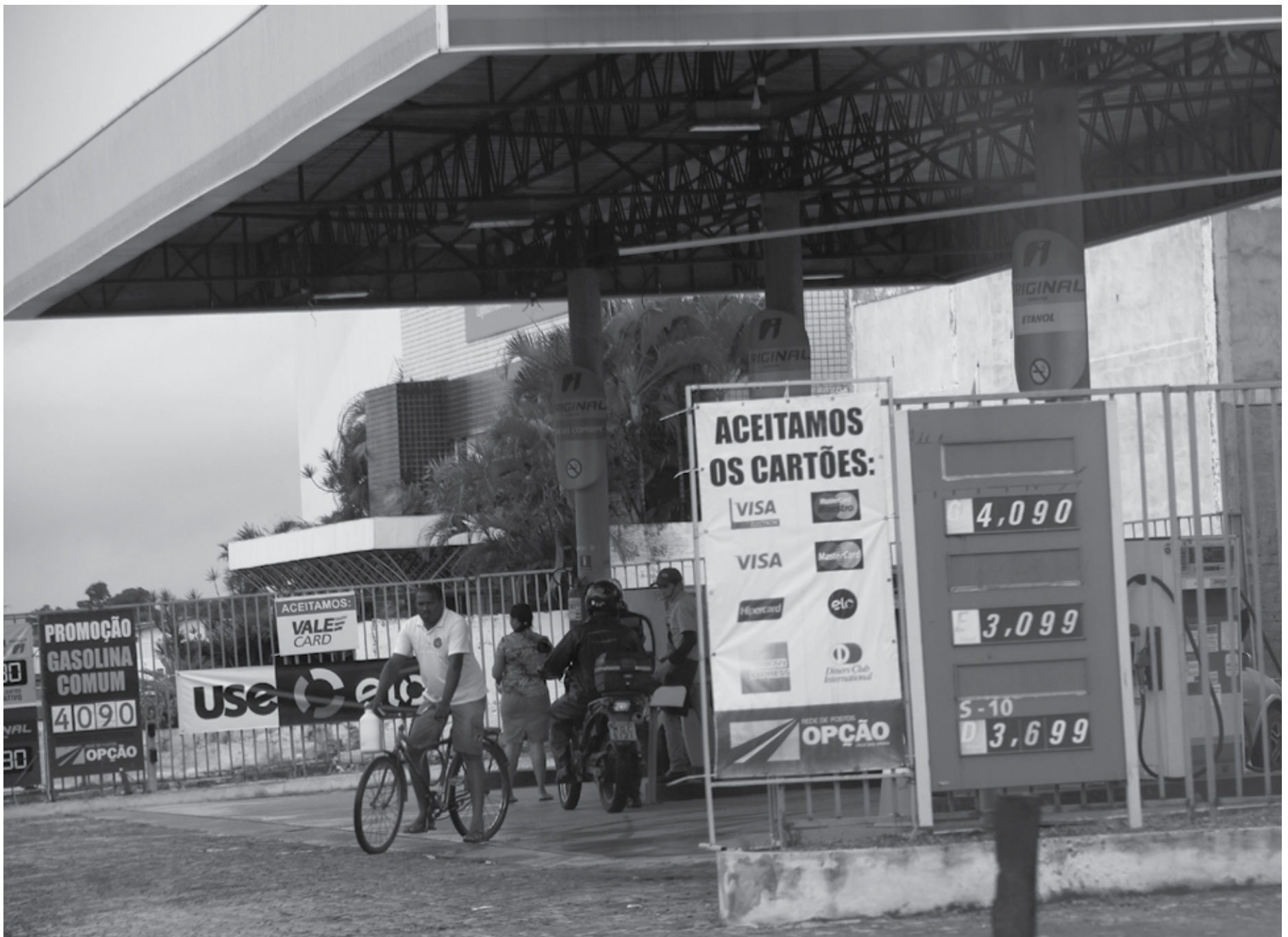
Somente nesta semana, os postos de combustíveis de João Pessoa aumentaram três vezes o preço do litro da gasolina, que já está sendo repassado pelas distribuidoras a quase R$ 4,00