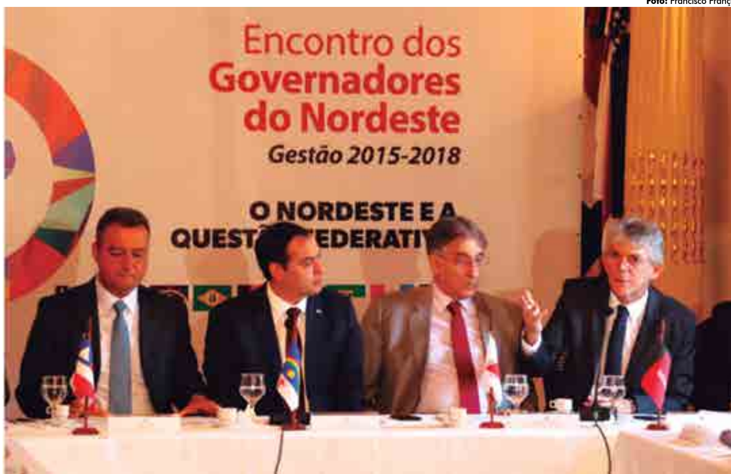
Para o governador Ricardo Coutinho, a Eletrobras e a Chesf são patrimônios fundamentais para que o Brasil seja tratado de forma igualitária

Para o governador Ricardo Coutinho, a Eletrobras e a Chesf são patrimônios fundamentais para que o Brasil seja tratado de forma igualitária. "Por isso temos uma postura absolutamen-