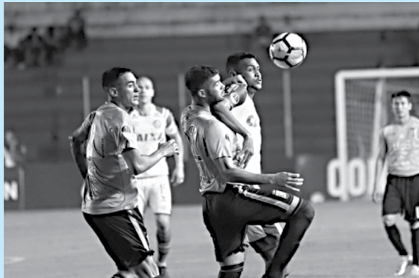
Bahia tenta virada contra o Blooming para avançar. Jogo está programado para acontecer no próximo dia 23 de maio, na Fonte Nova