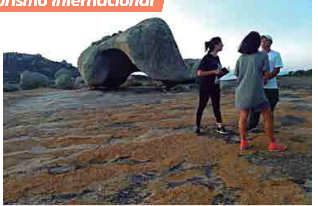
Grupo de jornalistas da Argentina visitou pontos turísticos no Litoral e em Campina Grande e Cabaceiras