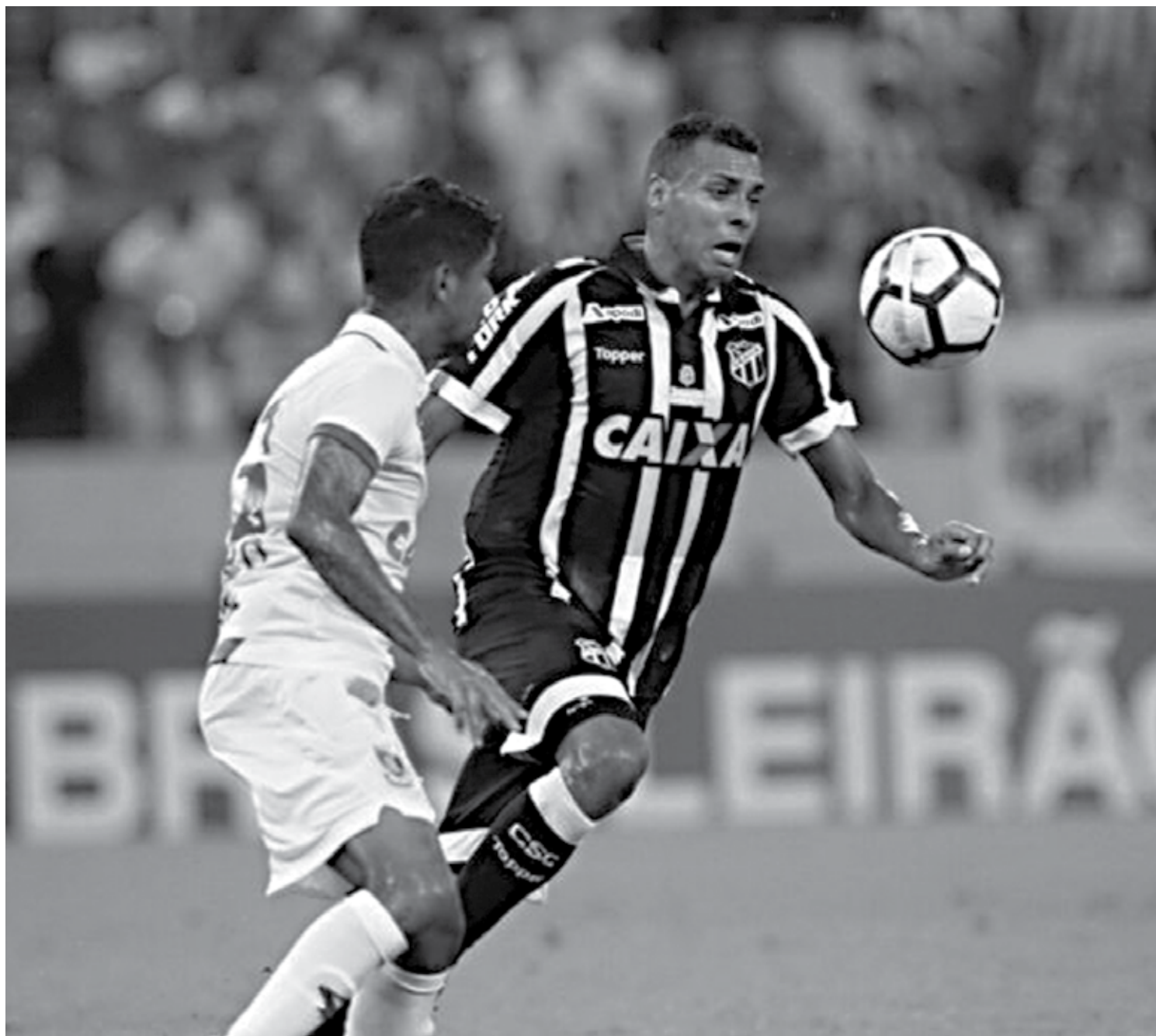
O jogo Ceará e América mineiro foi realizado segunda-feira, 14, na Arena Castelão. Primeiro gol do Vovô aconteceu quando o Coelho ganhava por 2 a 0