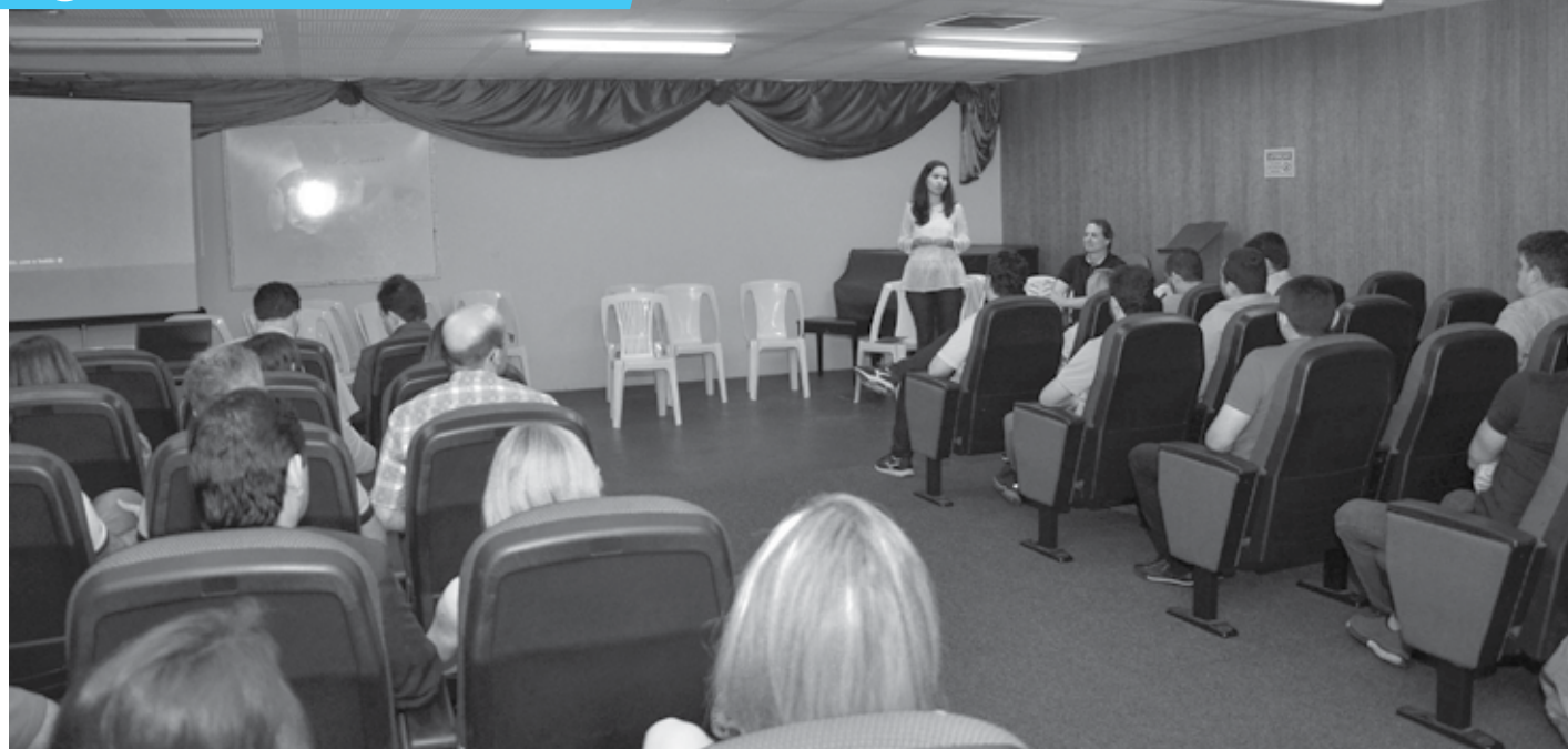
Professores e gestores se reuniram ontem para discutir e trocar experiências a respeito do programa, que é uma parceria entre a SEE e a Fapesq