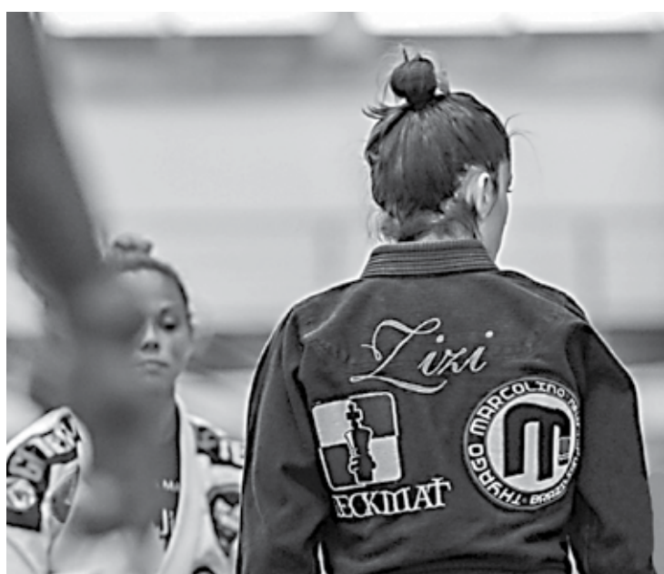
Para Zizi, o Brasileiro foi um teste importante para tentar o mundial