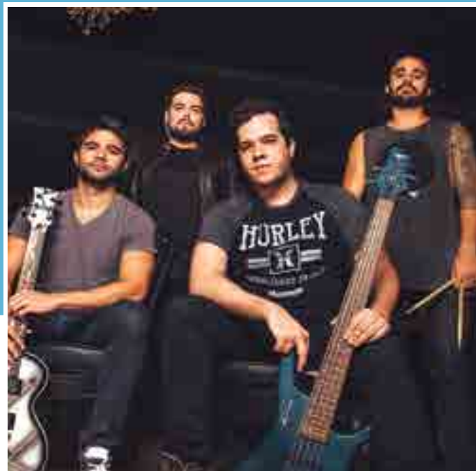
A Velsor se apresenta hoje no Campus Festival