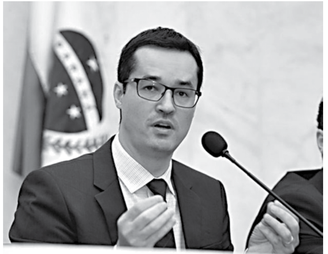
O procurador da República, Deltan Dallagnol, disse que a desburocratização faz parte das propostas

“Também vamos apresentar a ideia da democracia partidária, para que não exista apenas o