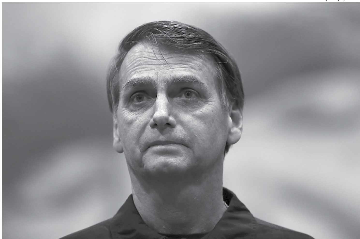
Anteontem, Bolsonaro concedeu a primeira coletiva de imprensa após a eleição, mas apenas TVs e algumas rádios e sites foram convocadas para a entrevista

Os jornais impressos (e seus portais online), agências de notícias nacionais e internacionais - inclusive a Agência Brasil - tiveram seus pedidos de credenciamento ignorados. O presidente eleito disse que não pediu para excluir ninguém e que desconhecia quem tinha organizado a coletiva.