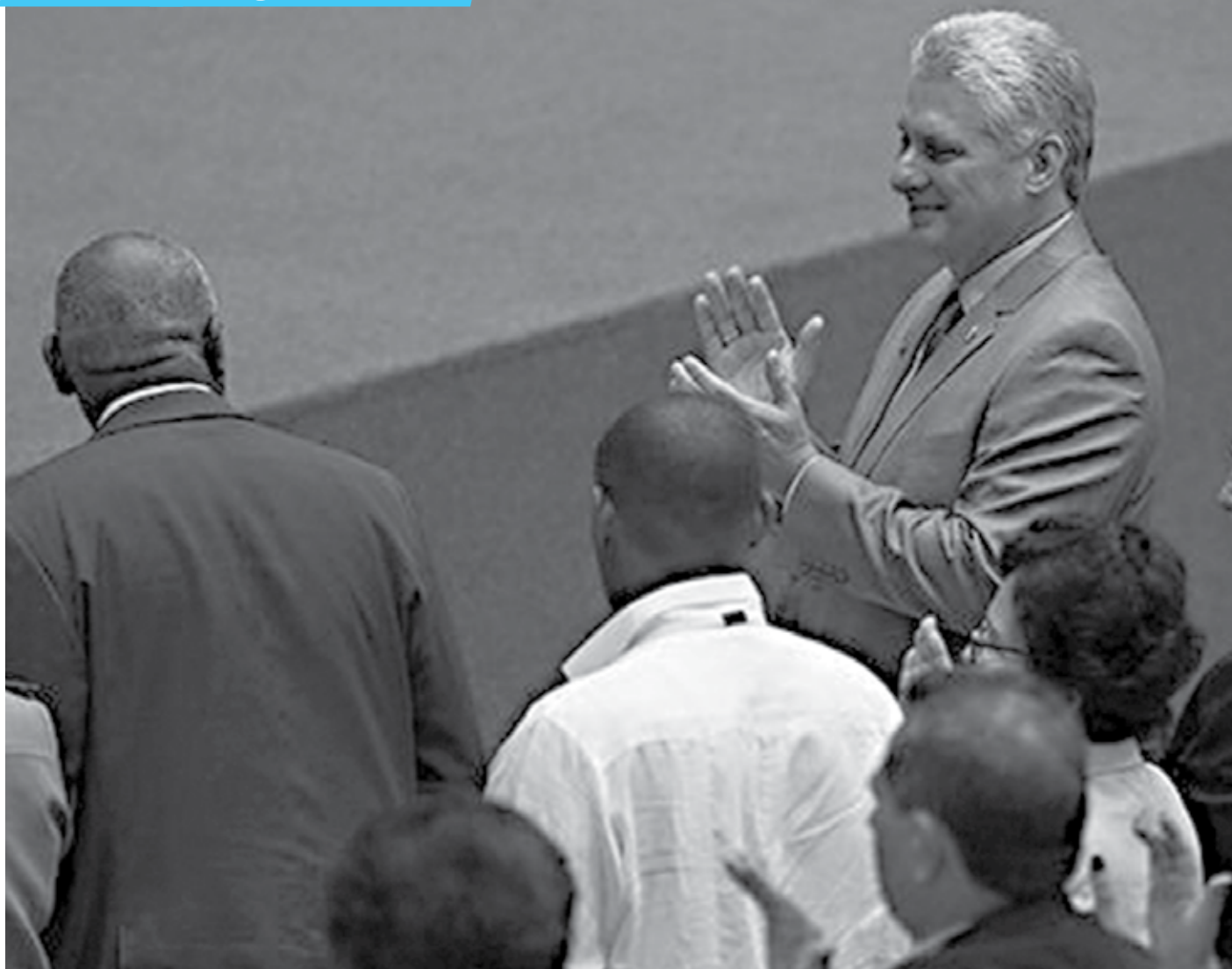
O líder cubano Miguel Díaz-Canel condenou firmemente as sanções aplicadas por países ocidentais contra o Kremlin, citando também os Estados Unidos