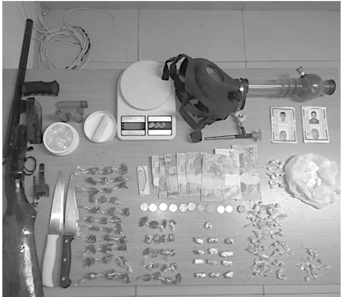
Uma espingarda calibre 12, munições, 71 pedras crack, 66 papelotes de maconha e 30 gramas de cocaína foram apreendidos

Os dois suspeitos foram conduzidos para a Central de Flagrantes, onde foram autuados por tráfico e posse ilegal de arma.