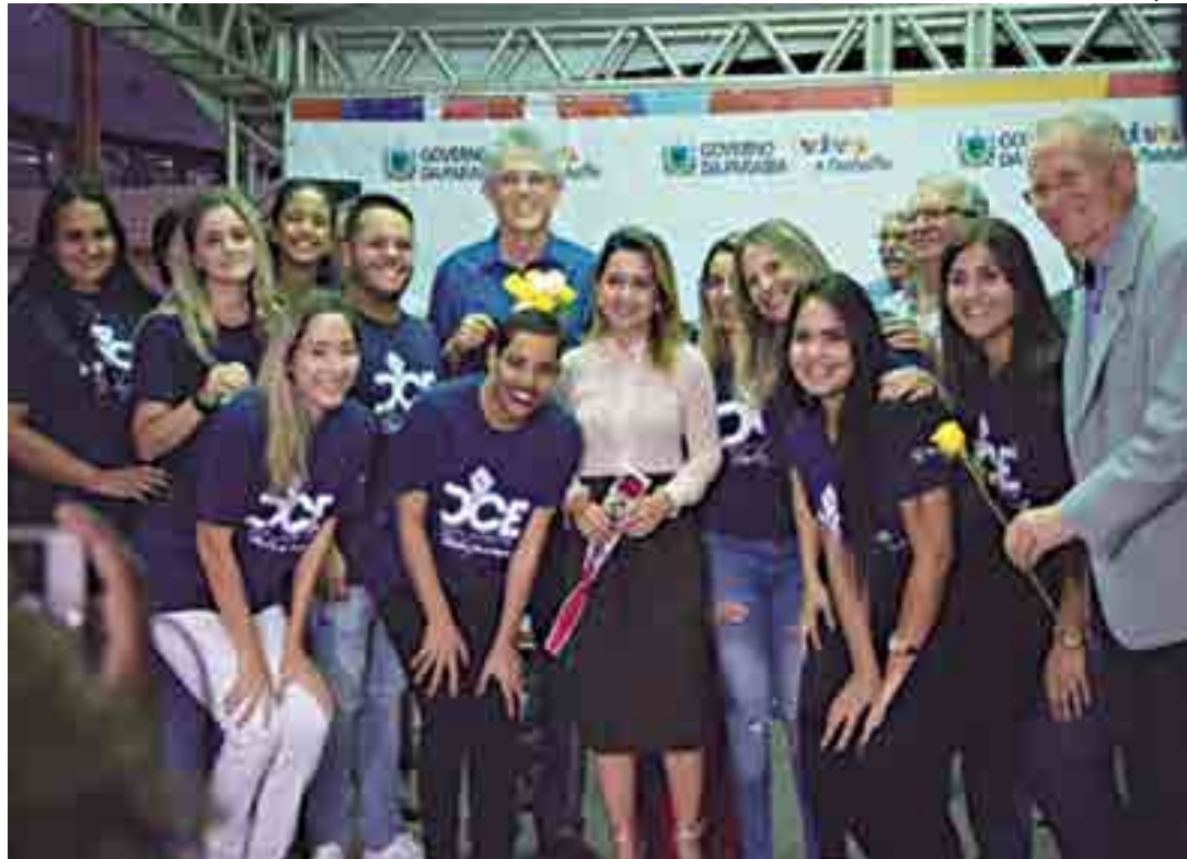
O governador Ricardo Coutinho em foto com a diretoria e alunos do Iesp em entrega de passarela