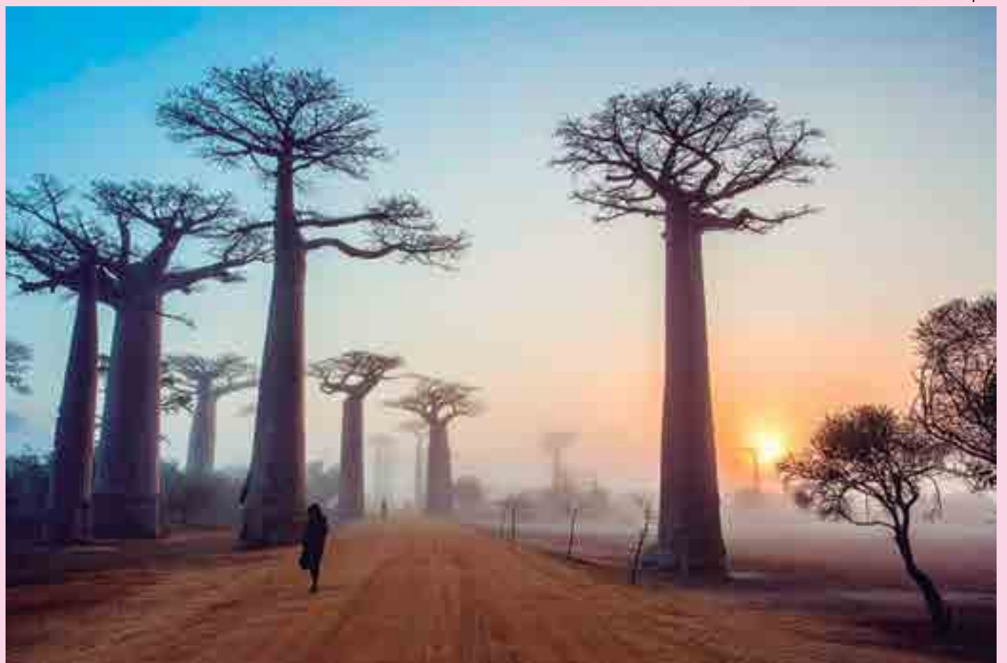
Imagem captada por Milton Majella, um dos mais de 2 mil fotógrafos participantes do Festival, cujo foco, na edição deste ano, é a inclusão social

Durante o Festival, o público poderá conferir cer-