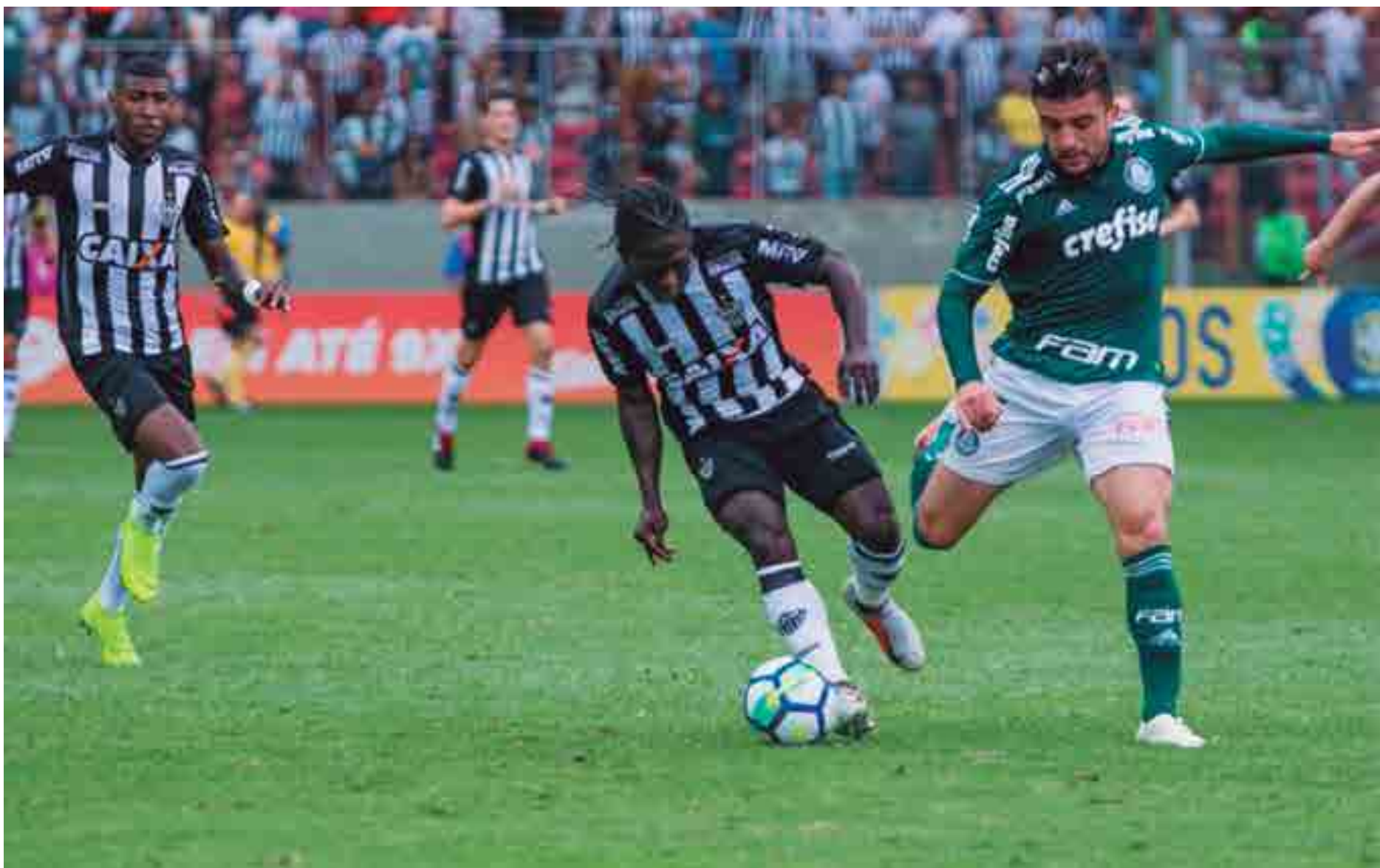
No domingo passado, o Palmeiras foi até ao Estádio Independência, em Minas Gerais, enfrentar o Atlético Mineiro e conseguiu um empate de 1 a 1, mantendo a distância para o segundo colocado

Se somar só um ponto nas próximas rodadas, o Colorado vai a 63, o que o deixaria a 10 do Verdão, sendo impossível alcançar o adversário.