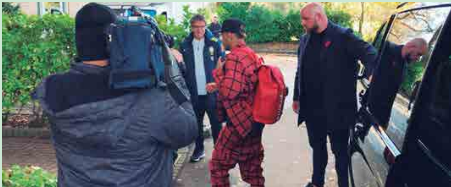
Com roupa espalhafatosa, o atacante Neymar volta a chamar atenção da mídia na apresentação em Londres para jogos contra Uruguai e Camarões

A outra baixa também vem da Espanha. Philippe Coutinho teve uma pequena ruptura no bíceps femoral da perna esquerda, uma lesão muscular, assim como Marcelo. O clube catalão anunciou que o brasileiro ficaria