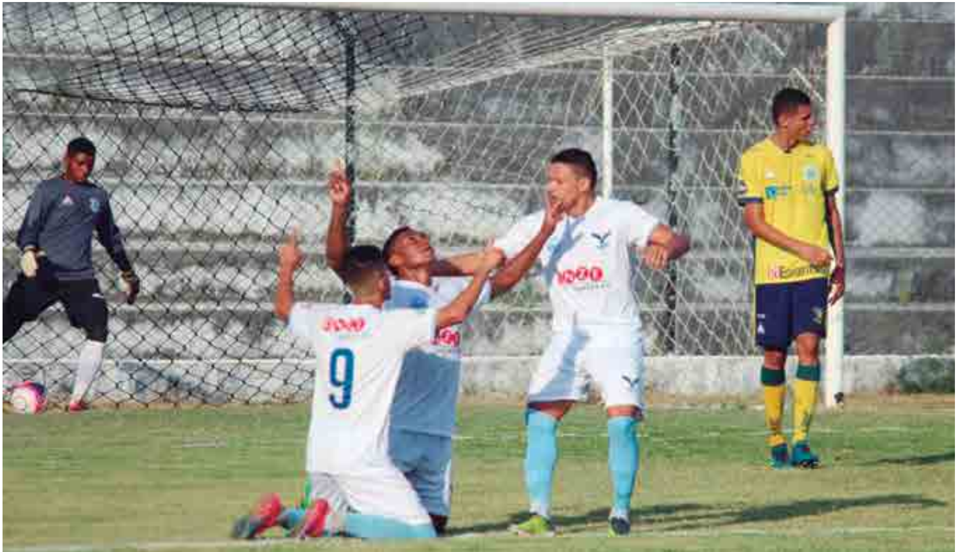
A Perilima, que confirmou a vaga no último sábado, terá representação no Conselho Arbitral programado para as 15 horas desta terça-feira, no Hotel Cabo Branco Atlântico, em João Pessoa

Na semana passada, em contato com alguns dirigentes do Sertão, a reportagem de A União pôde apurar que a sugestão deles era realizar um campeonato de ponto corrido, com jogos de ida e volta, ficando os 4 primeiros colocados classificados para as semifinais quando começaria um mata-mata até as finais. Porém, este tipo de fórmula só poderia acontecer em 22 datas com todas as fases com jogos de ida e volta ou em 20, com semifinais e finais sendo disputadas em jogo único. Mas, começando