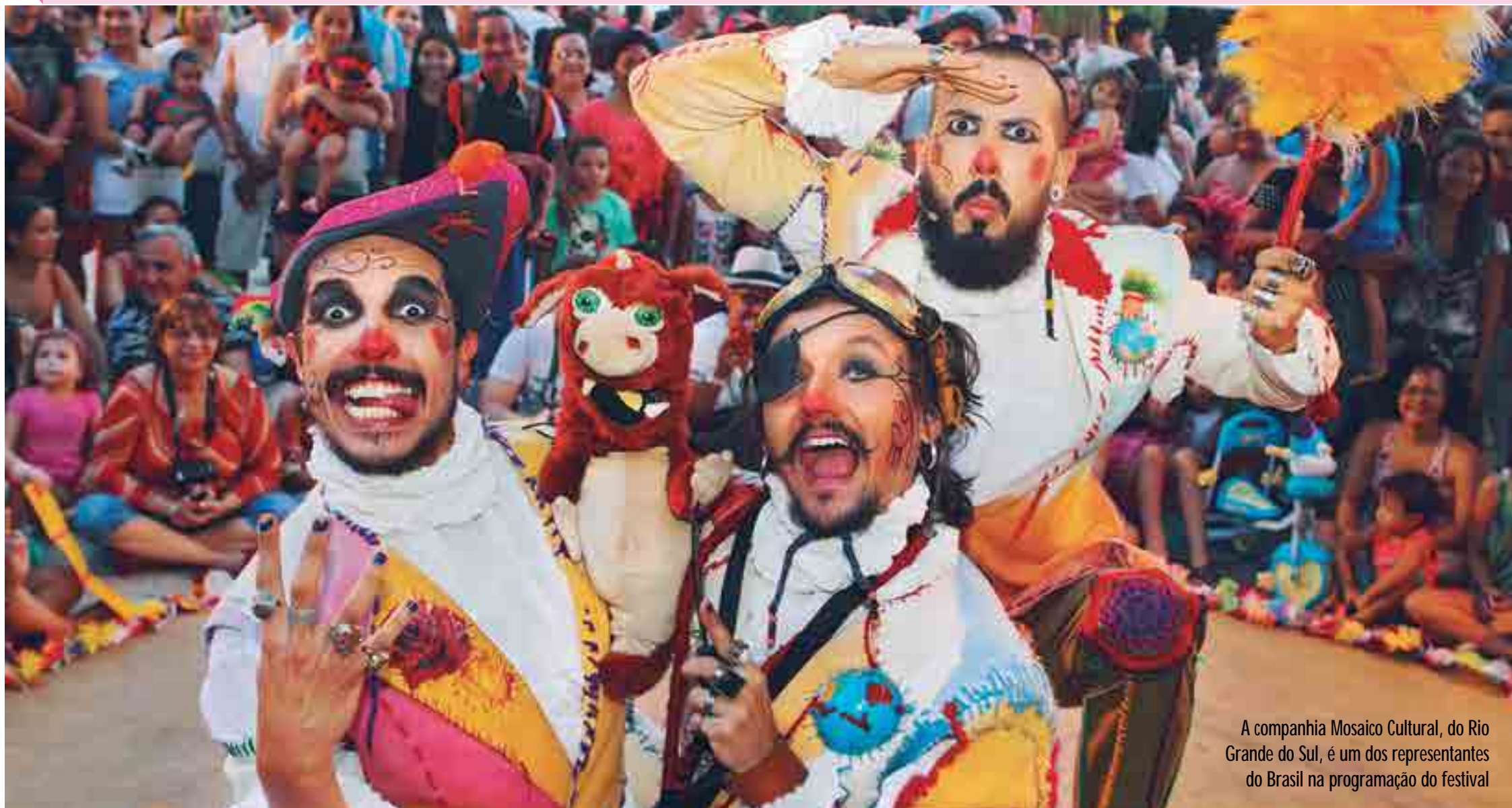
A companhia Mosaico Cultural, do Rio Grande do Sul, é um dos representantes do Brasil na programação do festival