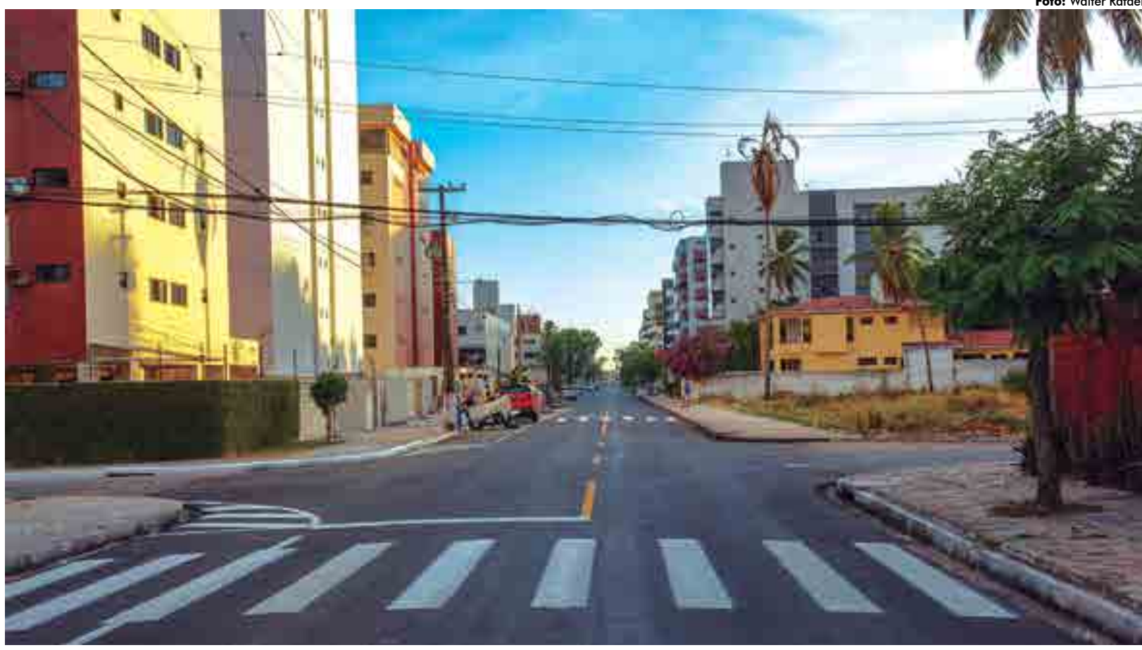
Mobilidade urbana. Obra de recapeamento da Via Litorânea de Intermares, em Cabedelo, é inaugurada pelo Governo do Estado. Página 4