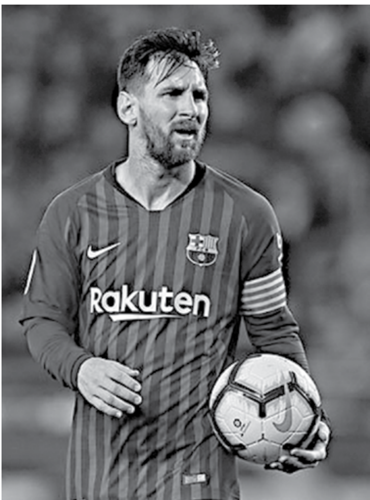
O argentino Lionel Messi segue fazendo história com a camisa do Barcelona