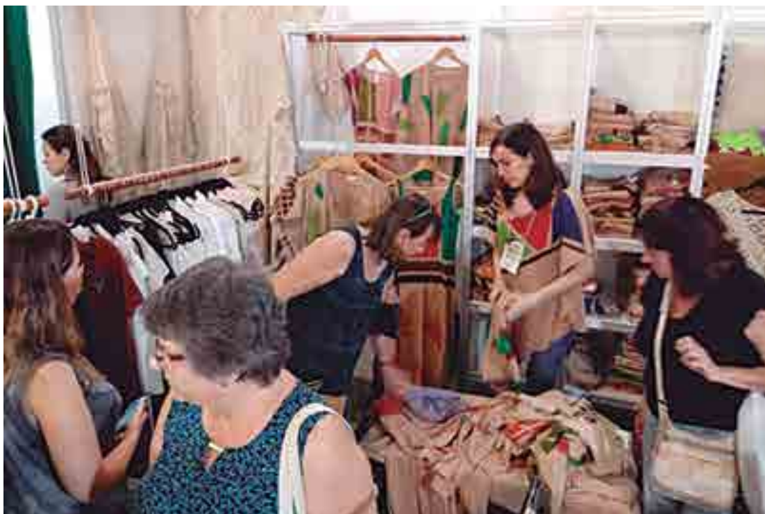
Durante o evento os representantes da Paraíba comercializaram mais de R$ 100 mil, superando edições anteriores

pectativa. Muitos deles participaram do evento pela primeira vez, e afirmaram estar orgulhosos e satisfeitos com as vendas.