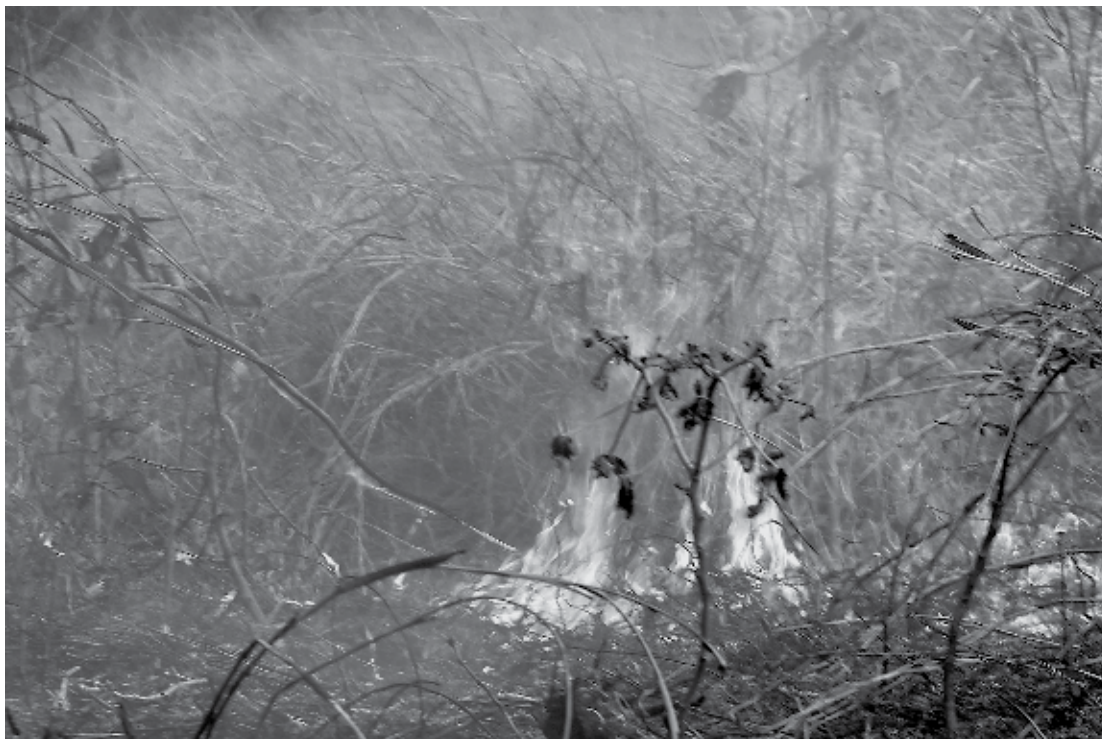
Vários focos de incêndios foram registrados, ontem, em João Pessoa, principalmente às margens de rodovias

“O tráfego ferroviário entre as duas estações foi suspenso, para que nós pudéssemos averiguar se o incêndio havia comprometido a estrutura da ponte que tem as bases de madeira para amortecerem a parte metálica onde passa o transporte. Como ela não foi danificada, desde às 9h30 de ontem, os trens voltaram a funcionar normalmente”, explicou. Outro incidente com queima da vegetação também foi registrado na manhã de ontem às margens da BR 230, no sentido Cabedelo e nas imediações do Unipê. Segundo o major Flaubert Barbosa essas ocorrências são comuns nesse período devido à junção de fatores como estiagem, calor e o clima seco. “Além da alta da temperatura que favorece a propagação do fogo na vegetação seca, também é comum isso ocorrer porque a população costuma atear folgo em lixo ou terrenos baldios. Por isso, os Bombeiros recomendam a população, principalmente de áreas rurais mantenham o terreno sempre limpo e a grama capinada, para evitar a propagação de incêndios na área”.