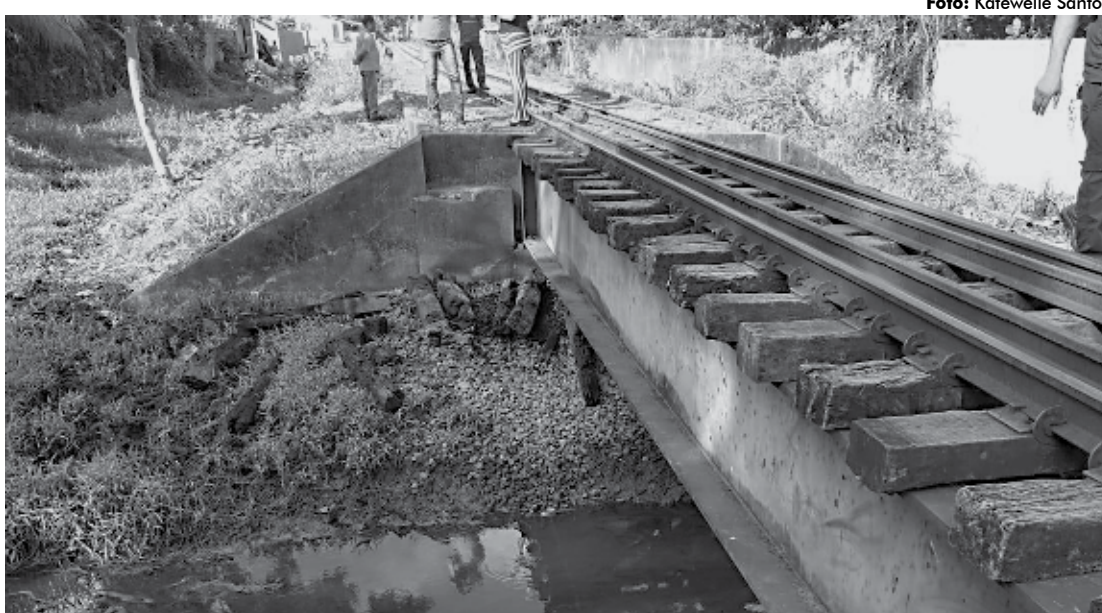
Foram registrados incêndios próximos à linha do trem para Cabedelo. A CBTU suspendeu o tráfego