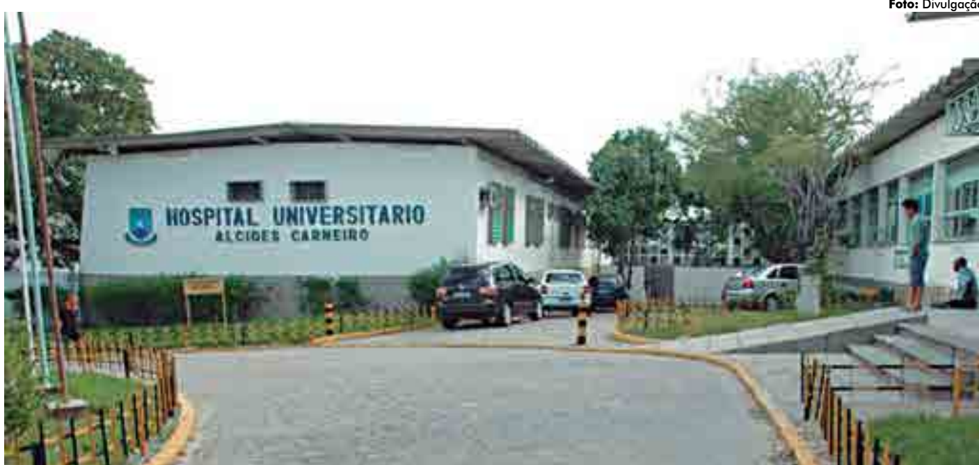
O Hospital Universitário Alcides Carneiro realizou o Mutirão do Novembro Azul de prevenção contra o câncer de próstata para o público campinense