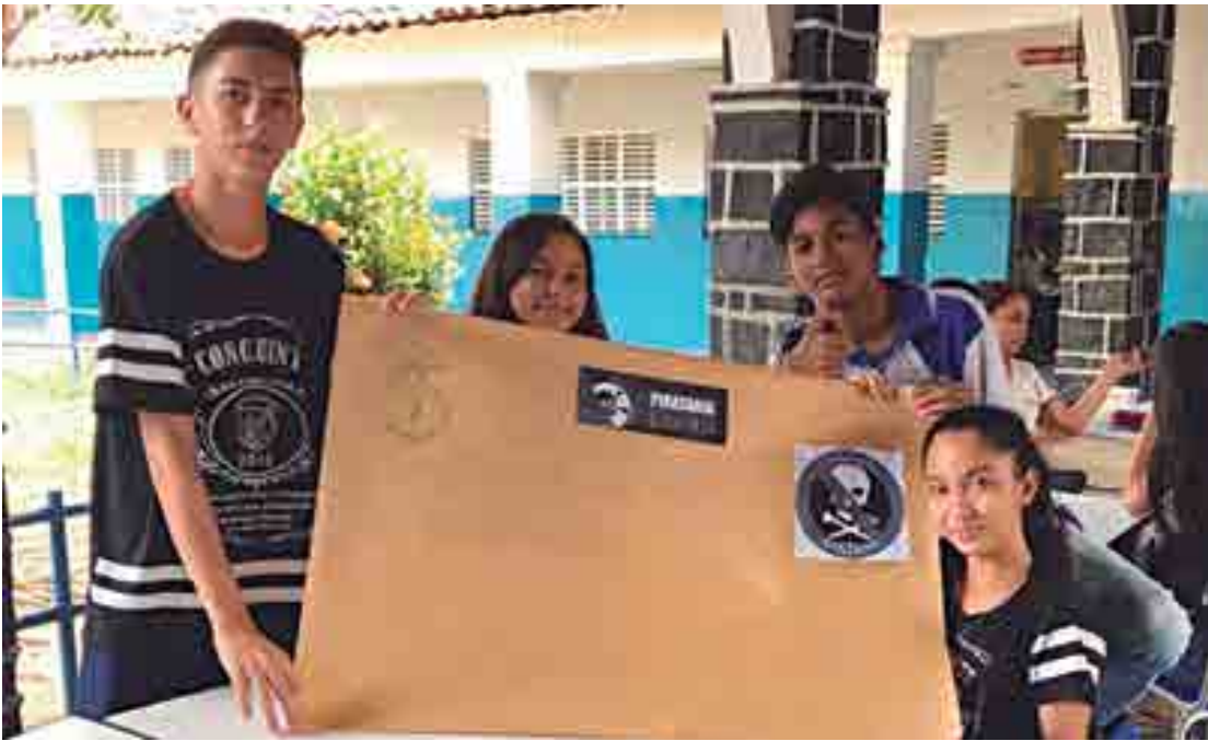
Os alunos apresentaram um trabalho que foi reconhecido pela Federação Brasileira de Associações de Fiscais