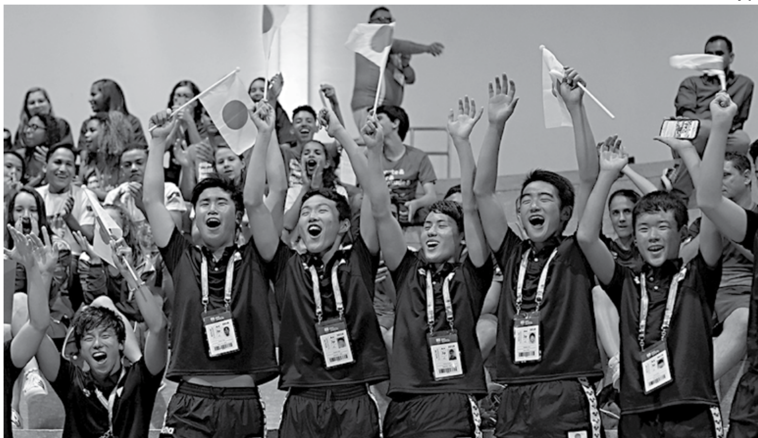
Durante a cerimônia de abertura, os japoneses fazem a festa e já estão competindo como convidados nos Jogos Escolares da Juventude em Natal-RN