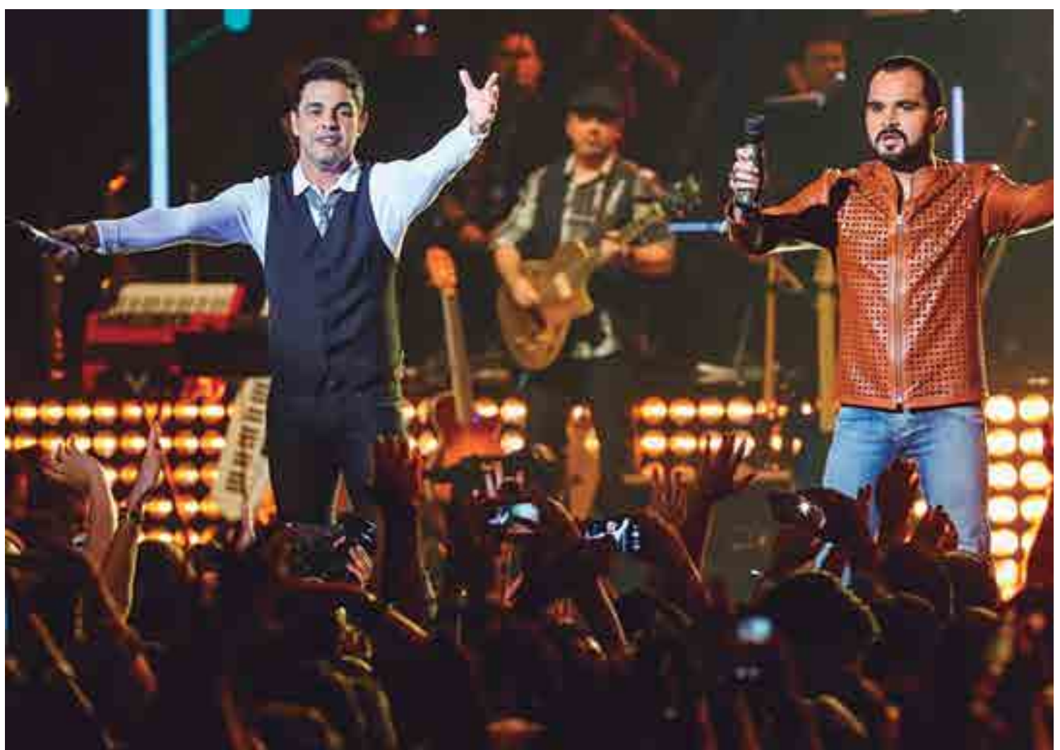
A dupla sertaneja Zezé di Camargo e Luciano será uma das atrações do show e apresentará novas músicas e os sucessos que marcaram a sua carreira

Zezé di Camargo & Luciano e Raça Negra devem animar os fãs cantando juntos as músicas 'Me Leva Junto Com Você' e 'Dou a Vida Por um Beijo', que gravaram para o projeto 'Raça Negra e Amigos II', em 2017. Além disso, as bandas apresentarão outros clássicos que marcaram as suas trajetórias, bem como novos sucessos.