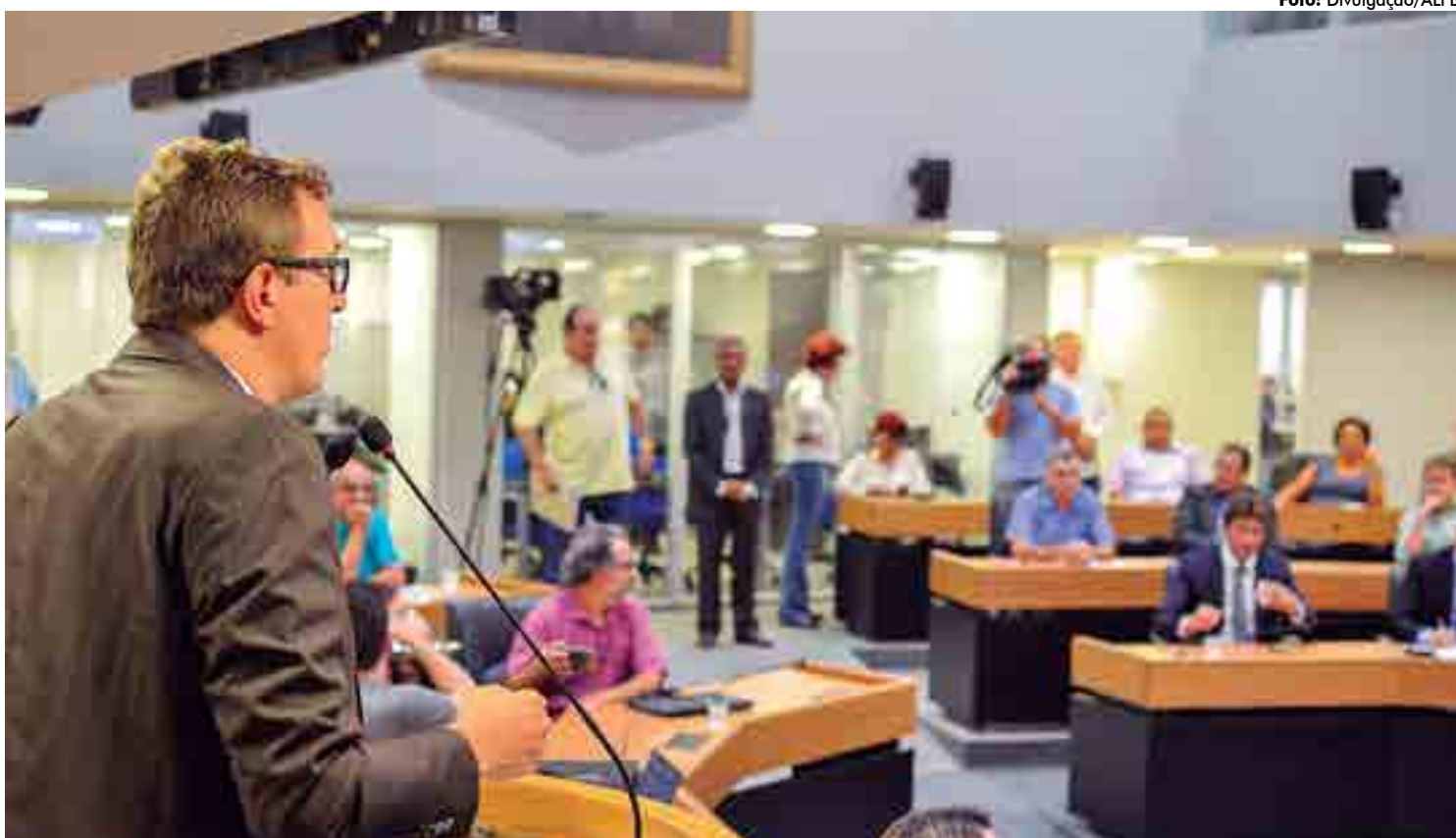
Durante audiência pública realizada pela Comissão de Acompanhamento e Controle da Execução Orçamentária, secretário disse que cenário é de desafio