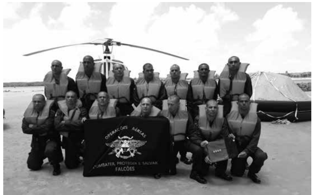
O treinamento somou 473 horas aulas, ministradas de 24 de setembro até esta segunda-feira (12), quando houve a formatura

No caso específico do CBMPB, conforme Jean Jacques, as técnicas aprendidas serão úteis para as opera-