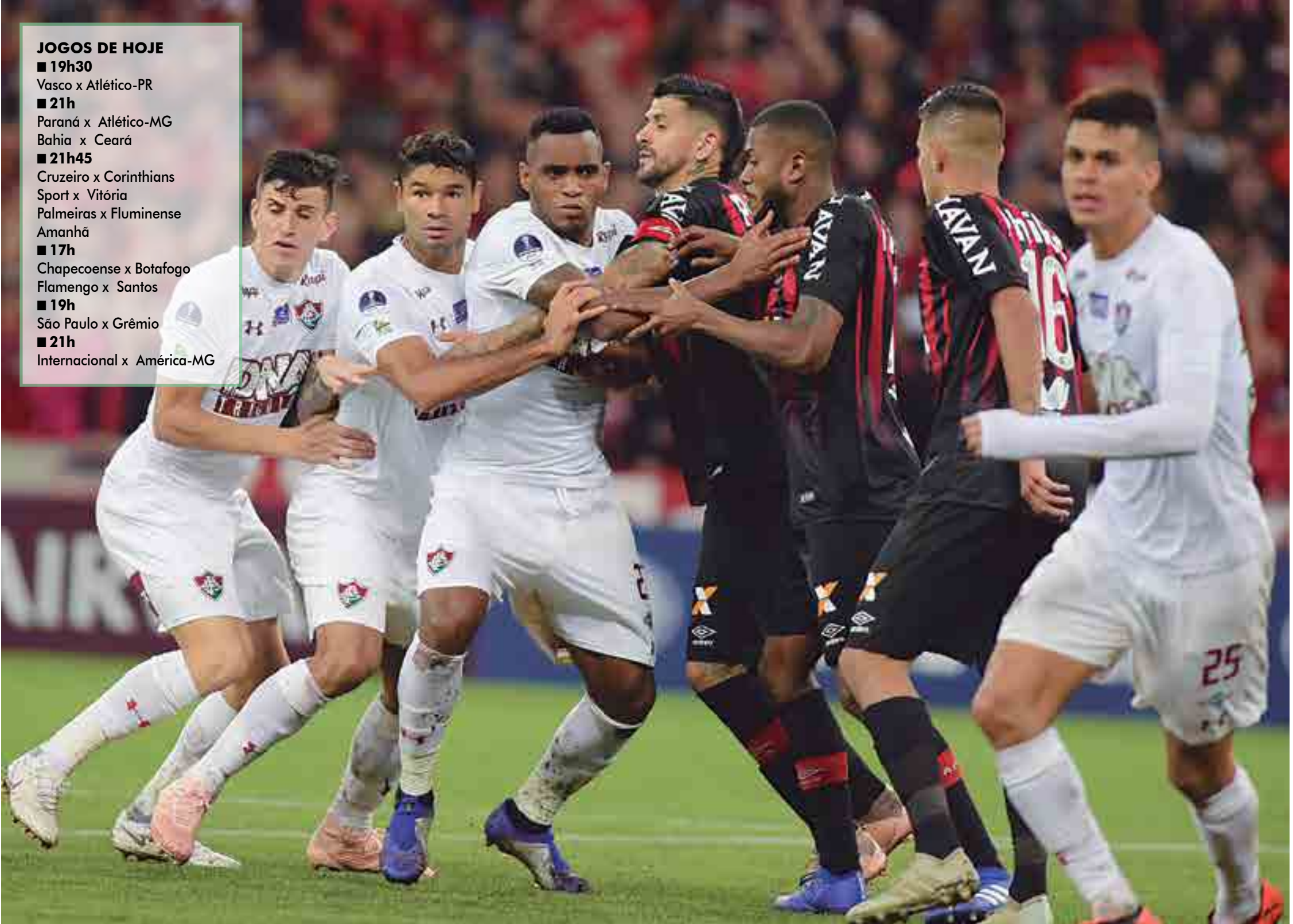
Atlético Paranaense e Fluminense levam vantagem por estarem nas semifinais da Copa Sul-Americana. Um dos dois clubes pode ir à final e, em caso de conquista de título, garantir-se na Libertadores do próximo ano na fase de grupos