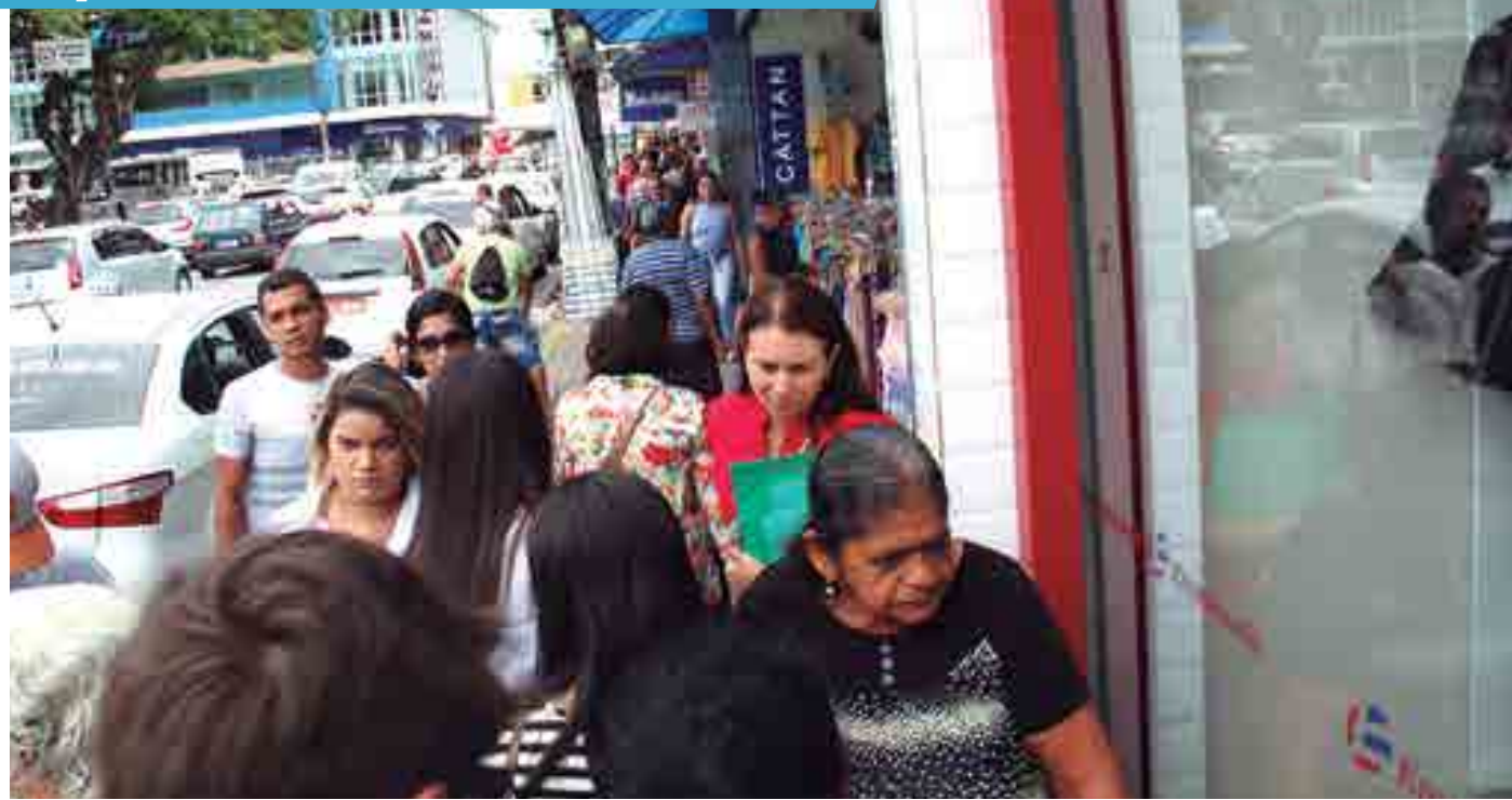
CDL-JP quer incrementar as vendas das lojas durante as festas de fim de ano, que é o período de maior movimentação no comércio da capital