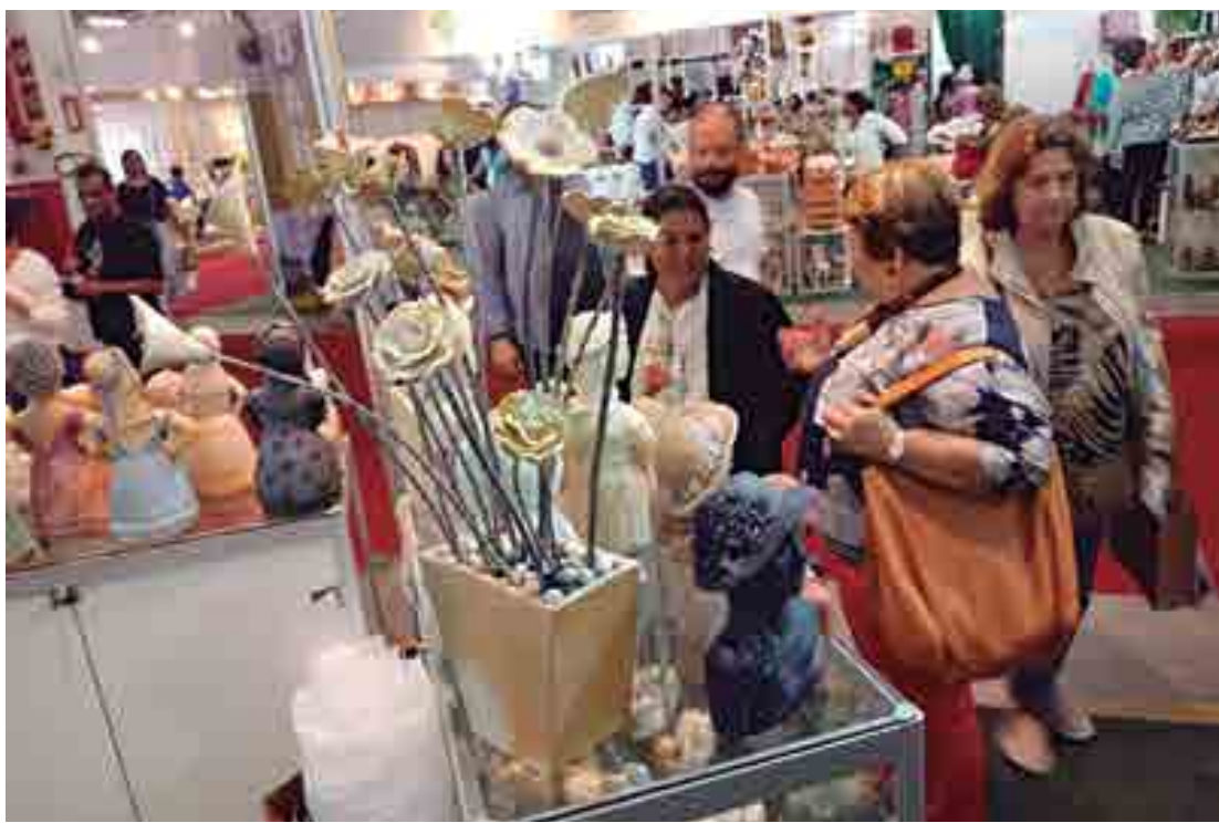
A 11ª edição do Salão do Artesanato de São Paulo teve duração de cinco dias com a participação de expositores da PB

A participação dos artesãos paraibanos na 11ª edição do Salão do Artesanato de São Paulo superou a ex-