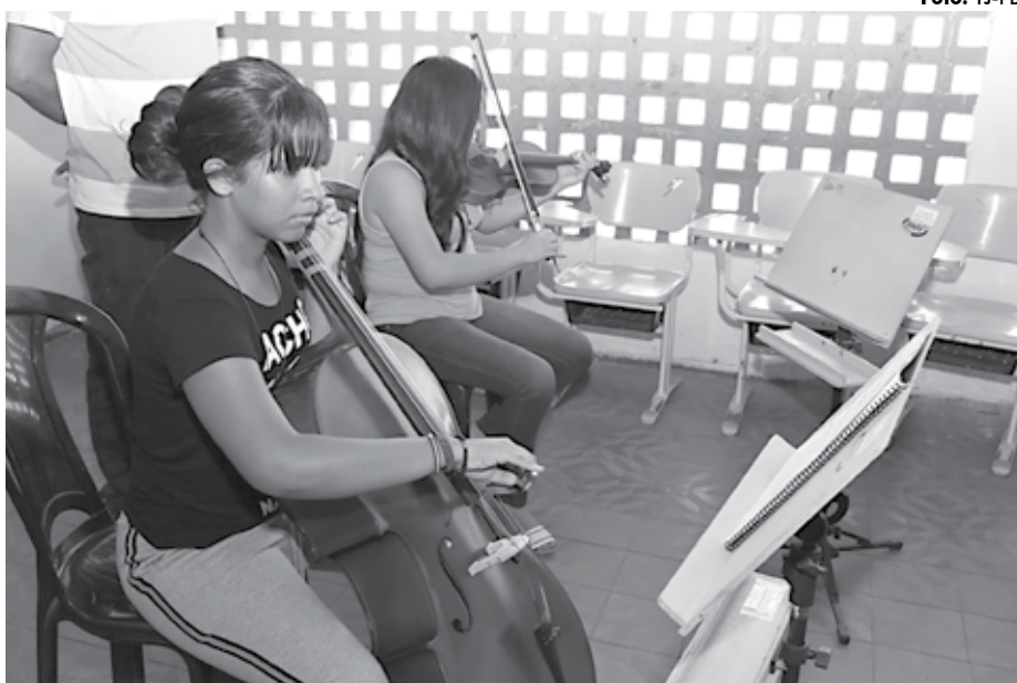
Apresentação dos novos instrumentistas chamou a atenção do magistrado pela desenvoltura