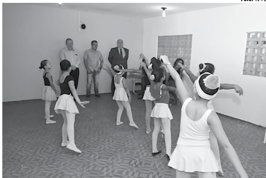
O balé clássico tem participação e boa aceitação, principalmente das crianças, dentro do projeto