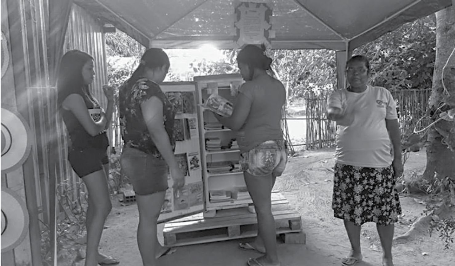
A iniciativa consiste em reutilizar geladeiras sem funcionamento para abrigar livros e espalhar o hábito da leitura nas diversas comunidades da cidade