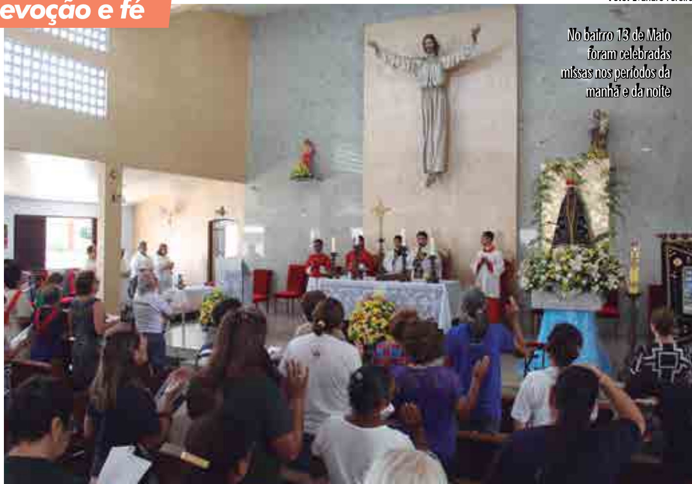
No bairro 13 de Maio foram celebradas missas nos períodos da manhã e da noite