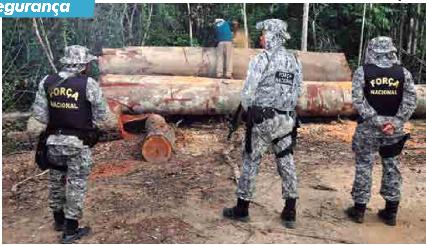
Autorizado o emprego da Força Nacional em ações de fiscalização de unidades de conservação federais, com ênfase no combate ao desmatamento