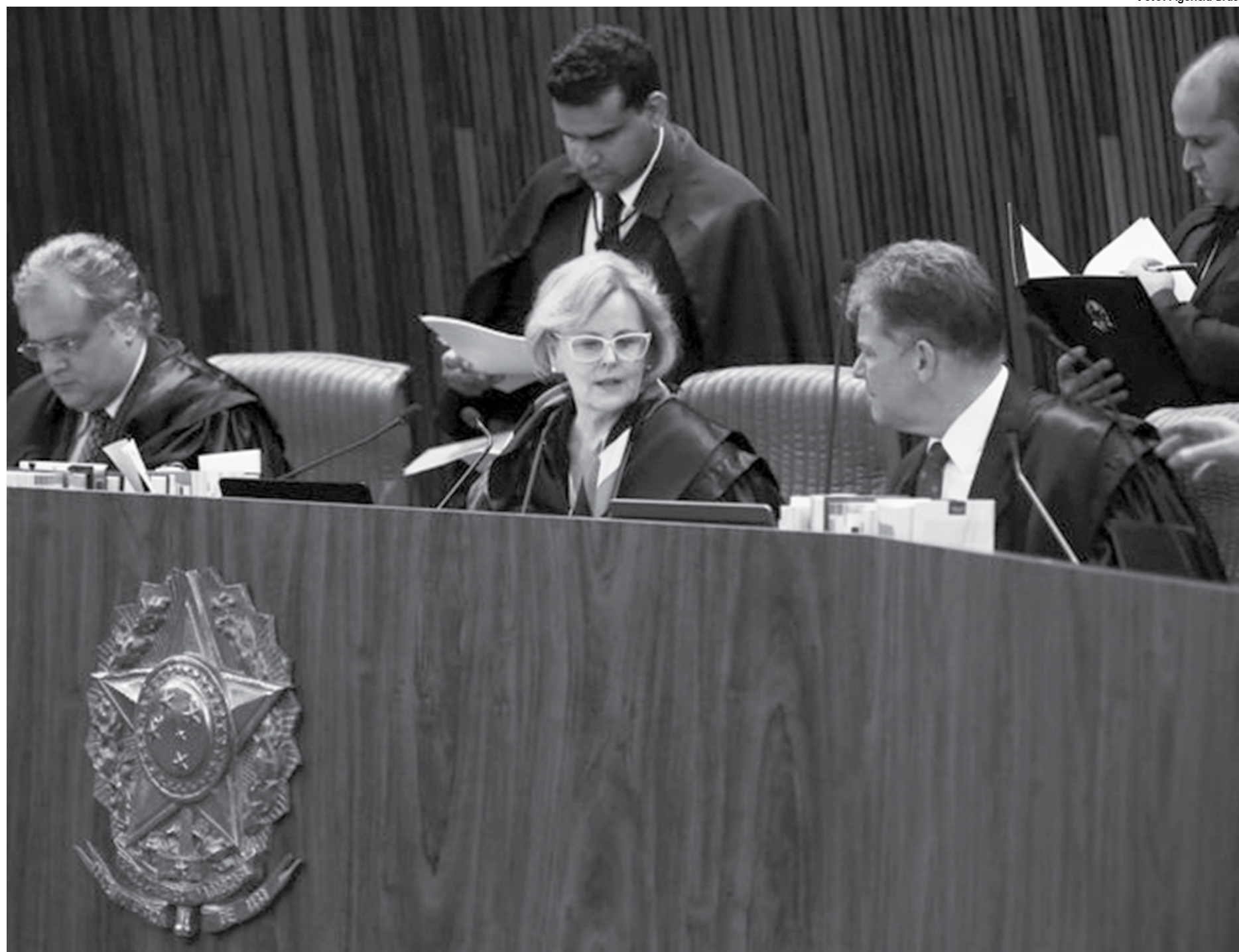
"A grande preocupação não é perder no voto, é perder na fraude. Então, essa possibilidade de fraude no segundo turno, talvez no primeiro, é concreta", diz Bolsonaro no vídeo, no qual faz ainda críticas ao PT

O PT ingressou com uma representação no TSE pedindo direito de resposta contra Bolsonaro, o que foi negado pelo plenário da Corte. Os ministros, contudo, resolveram acatar a solicitação para que o vídeo fosse retirado do ar. O entendimento prevalecente foi o de que a fala do candidato do PSL foi além do direito de crítica, ao buscar abalar a credibilidade da Justiça Eleitoral.