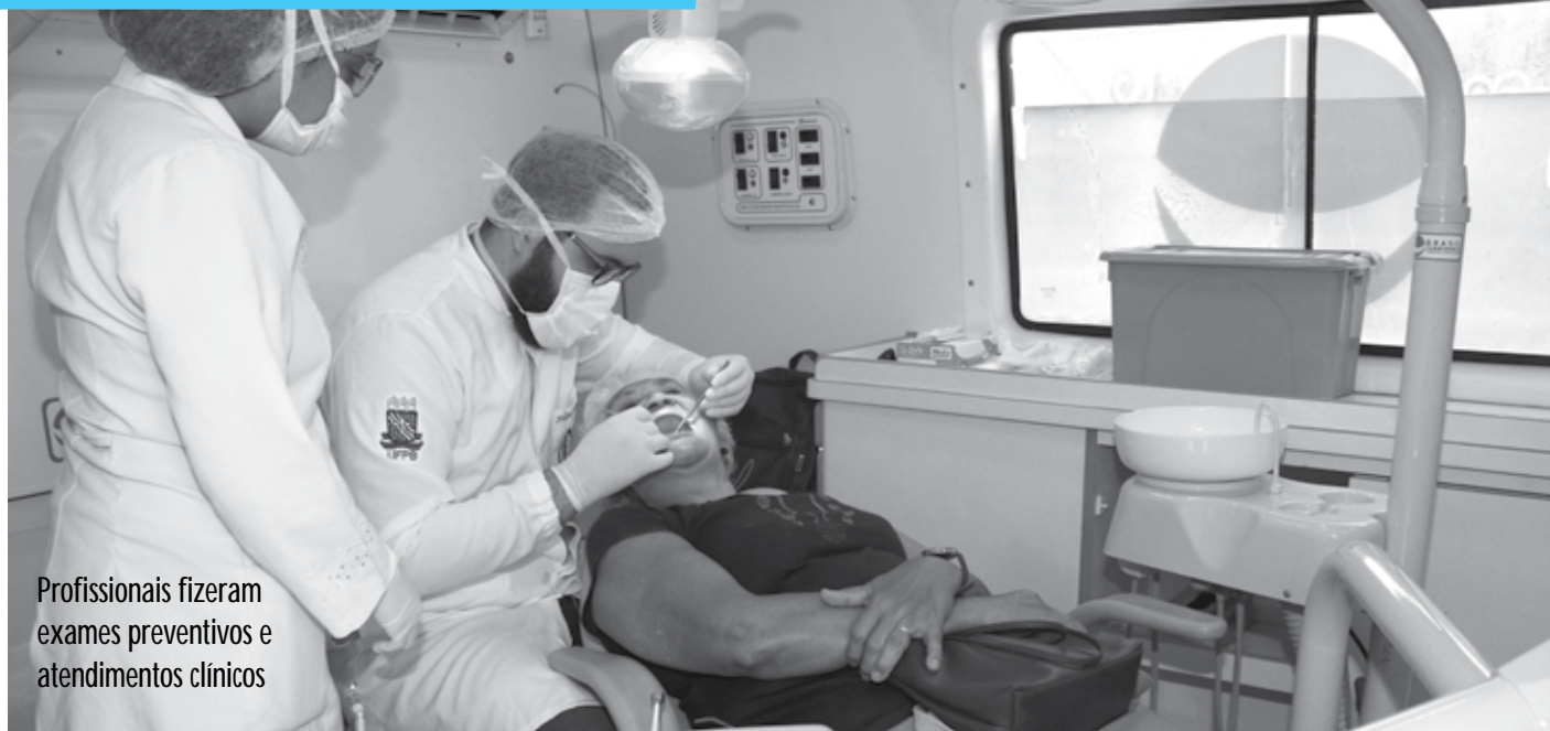
Profissionais fizeram exames preventivos e atendimentos clínicos