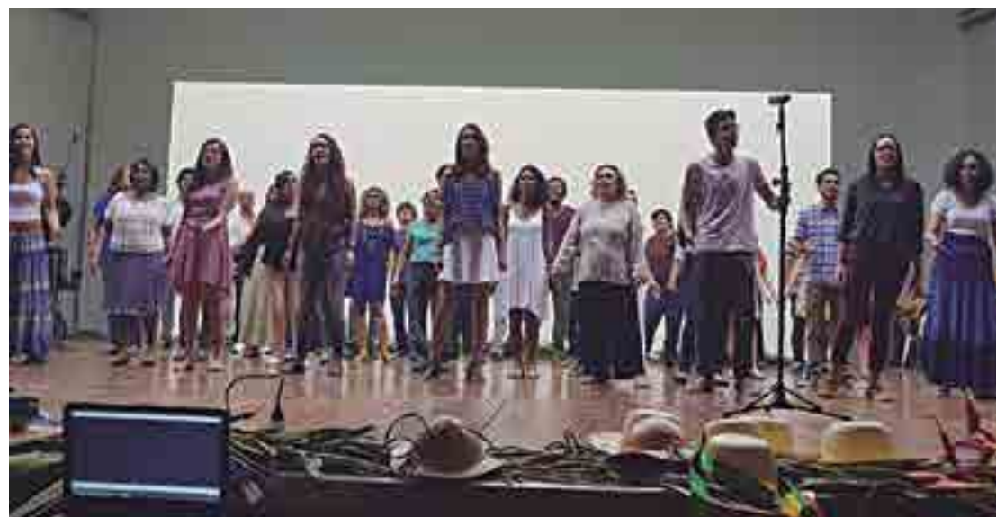
O grupo lakekan (E) fará a abertura dos concertos e o Coral Universitário Gazzi de Sá (D), formado por estudantes, professores e funcionários da UFPB, dará continuidade com repertório que prioriza canções latino-americanas