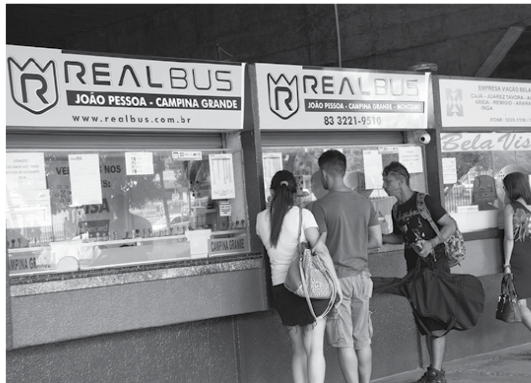
Destinos mais procurados na Paraíba são os municípios de Campina Grande, Patos, Sousa e Cajazeiras