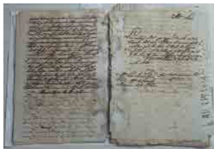
Entre esses documentos achados estão atas, cartas e registros públicos

Outra peça importante desse achado são as cópias de tratados internacionais da época do Império, que comunicam à Câmara da então Cidade da Parahyba, por exemplo, um tratado de comércio, navegação e amizade entre o Império do Brasil e o Império da Áustria. "O documento traz, em português e francês, que era a língua diplomática internacional, as cláusulas do tratado, assinalando para a Câmara da Parahyba cumprir o que coubesse a ela esse tratado", revela o professor.