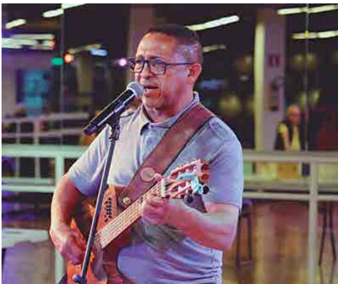
Músico cajazeirense é reconhecido pela militância social; sua música tem o protesto como característica