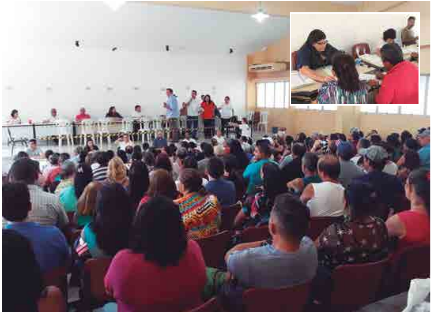
Moradores e proprietários compareceram com seus respectivos cônjuges, munidos da identificação de quadra e lote, além dos documentos, para assinatura e entrega da escritura

tinuidade ao trabalho de legalização e entrega das escrituras a todos os beneficiários. Esse tem sido um trabalho grande, inclusive contra quem coloca obstáculos a implantação da lei que permite a regularização de comunidades e bairros no nosso país. Desde 2011 que estamos lutando contra isso, para que todos os mutuários que já receberam casas da Cehap tenham direito à sua escritura. A luta foi grande, e mais um passo foi dado e dessa forma já estamos chegando perto de 10 mil escrituras entregues”, destacou Emilia Correia Lima, presidente da Cehap.