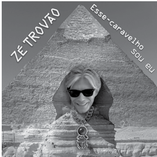
Quinto álbum do artista tem como característica a mescla de gêneros