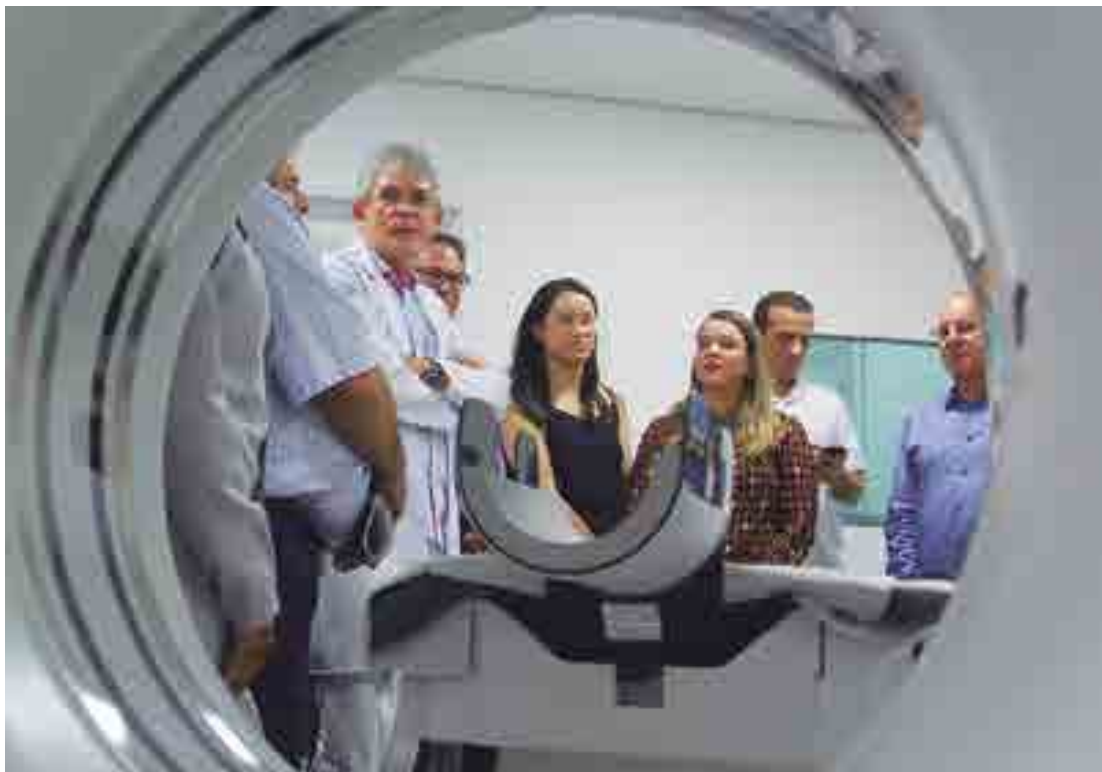
Governador Ricardo Coutinho entregou o tomógrafo, que vai possibilitar cerca de mil tomografias por mês, e inaugurou a Ponte do Figueiredo sobre o Rio da Cruz, além de passarelas metálicas

Na ocasião, o governador Ricardo Coutinho ressaltou que, a partir de agora, o Hospital Regional vai conseguir realizar cerca de mil tomografias por mês. Atualmente, são realizadas 300 tomografias com o deslocamento do paciente para outras unidades de saúde. "É um ganho enorme para a saúde. Estamos melhorando a assistência hospitalar ofertada à população de Patos e região. As tomografias passam a ser feitas no próprio hospital, sem a necessidade do paciente ir para outro local, além de agilizar o diagnóstico. No