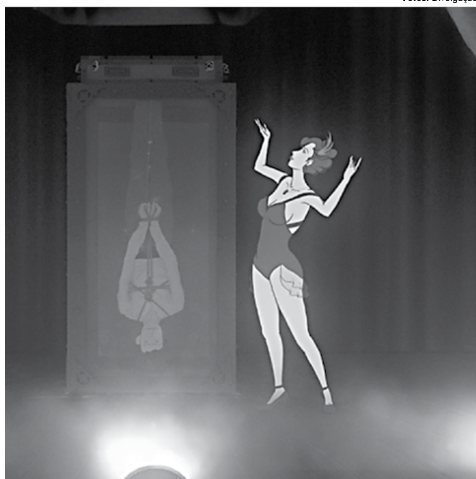
A animação 'Los Aeronautas' (E) é uma produção mexicana dirigida pelo cineasta León Fernández e será exibida na mostra internacional; 'O homem na caixa' (D), de Ale Borges, Alvaro Furloni e Guilherme Gehr, compõe a mostra nacional