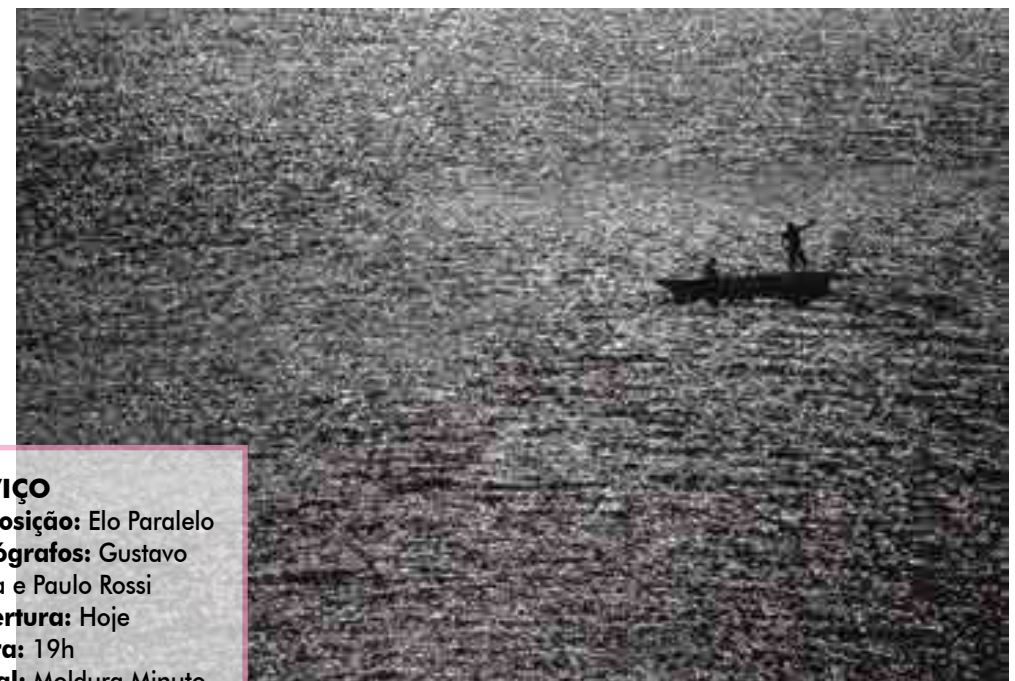
Já o fotógrafo Paulo Rossi, que também é professor de fotografia, está expondo imagens captadas na região do Cariri paraibano