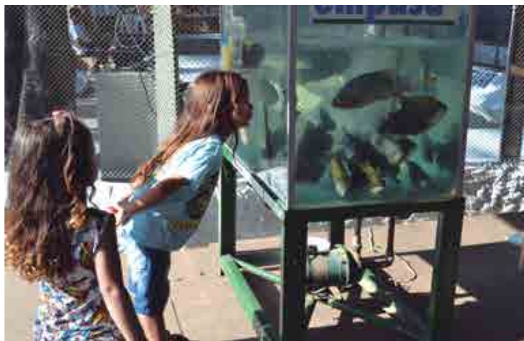
Programa Estadual de Piscicultura da Empasa chamou a atenção de adultos e crianças no Parque de Exposições

postagem, sacos de fertilizantes na apresentação de 5 e 10 kg foram mostrados, e os interessados que não puderam visitar a feira poderão adquirir, por preços subsidiados, o composto orgânico na sede da Empasa, no Cristo Redentor, como também, solicitarem, por ofício, uma capacitação técnica para aprenderem a pro-