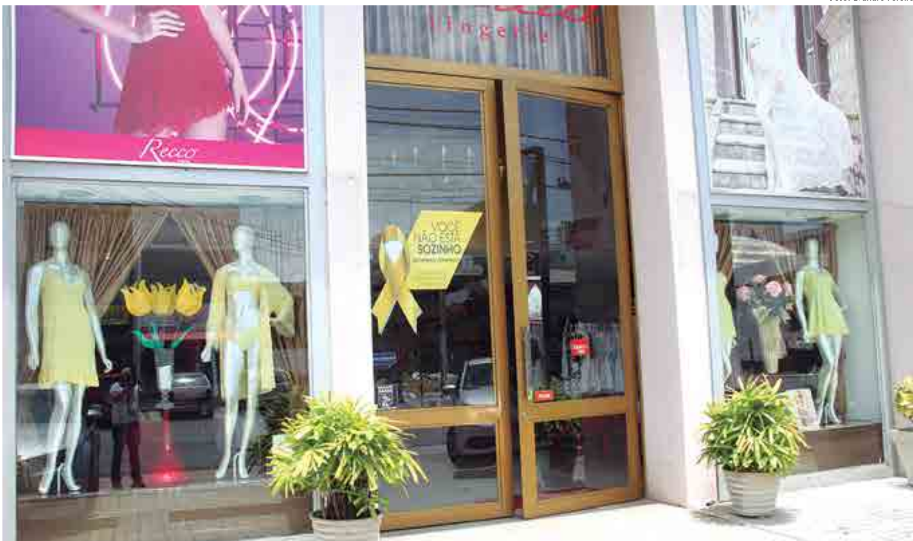
Adesivo que destaca a frase "Você não está sozinho" e a predominância da cor amarela nas vitrines estão em cerca de 40 lojas da Avenida General Edson Ramalho, no bairro de Manaira

A campanha tem o apoio do CVV (Centro de Valorização da Vida), uma associação civil sem fins lucrativos, que existe desde 1962 e que é reconhecida, desde 1973, como de Utilidade Pública Federal. Com uma média de