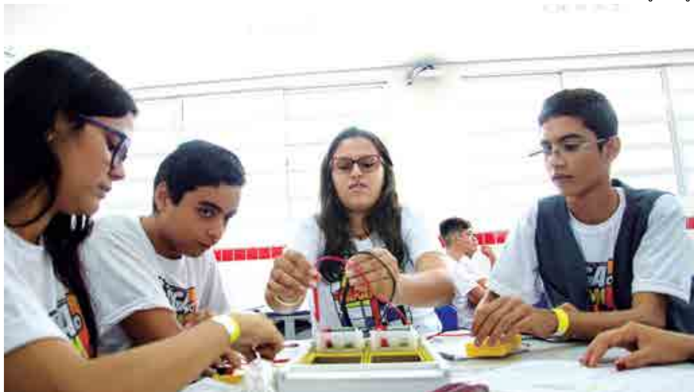
Evento reúne alunos da Rede Estadual com oficinas temáticas, práticas laboratoriais, orientação de estudos e educação emocional de forma lúdica