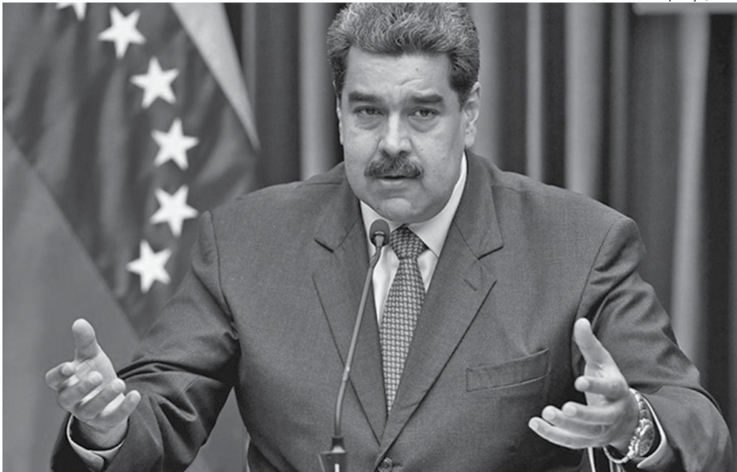
Governo de Nicolás Maduro é acusado de sérias denúncias, como prisões arbitrárias, assassinatos, execuções extrajudiciais, tortura, abuso sexual e estupro