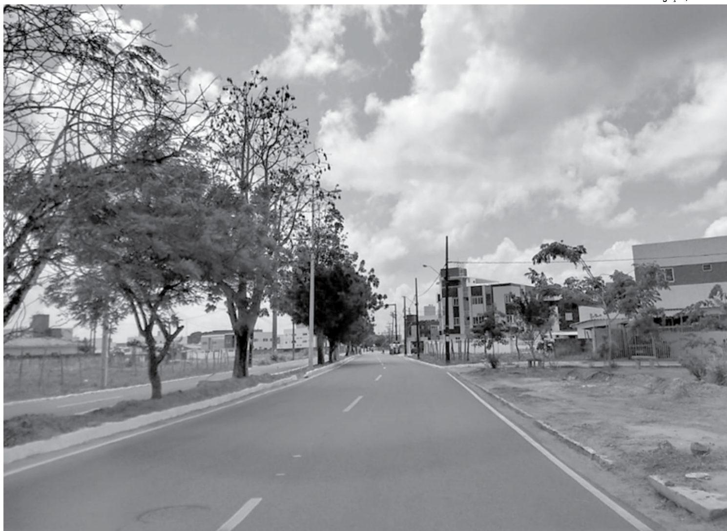
Via Perimetral Sul tem extensão de 12,8km com pista dupla e recebeu investimento com recursos próprios do Governo do Estado de R$ 21 milhões

Toda a população da Zona Sul de João Pessoa será beneficiada, além de ser uma alternativa moderna e mais rápida para turistas vindos de outros estados