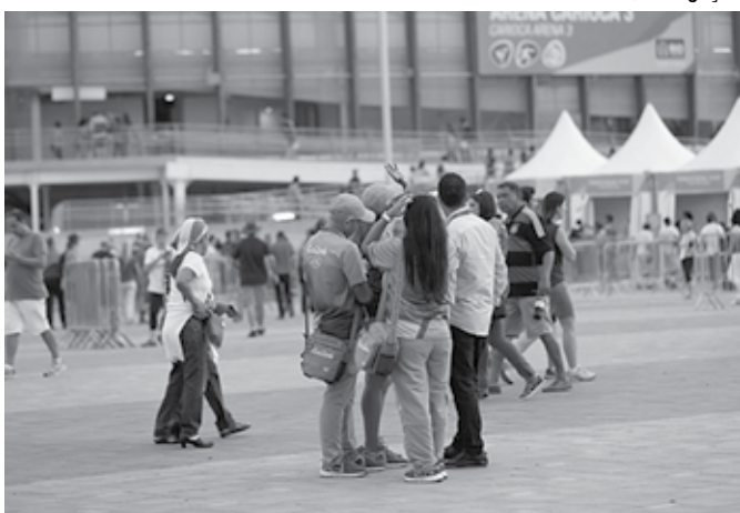
Voluntários em ação nos Jogos Olímpicos realizados no Rio de Janeiro

O fim das inscrições se dará em dezembro, embora os organizadores de Tóquio-2020 não tenham definido uma data específica para o encerramento do processo. Os voluntários não são remunerados e, em geral, precisam buscar sua própria hospedagem, apenas recebendo uniformes e refeições gra-