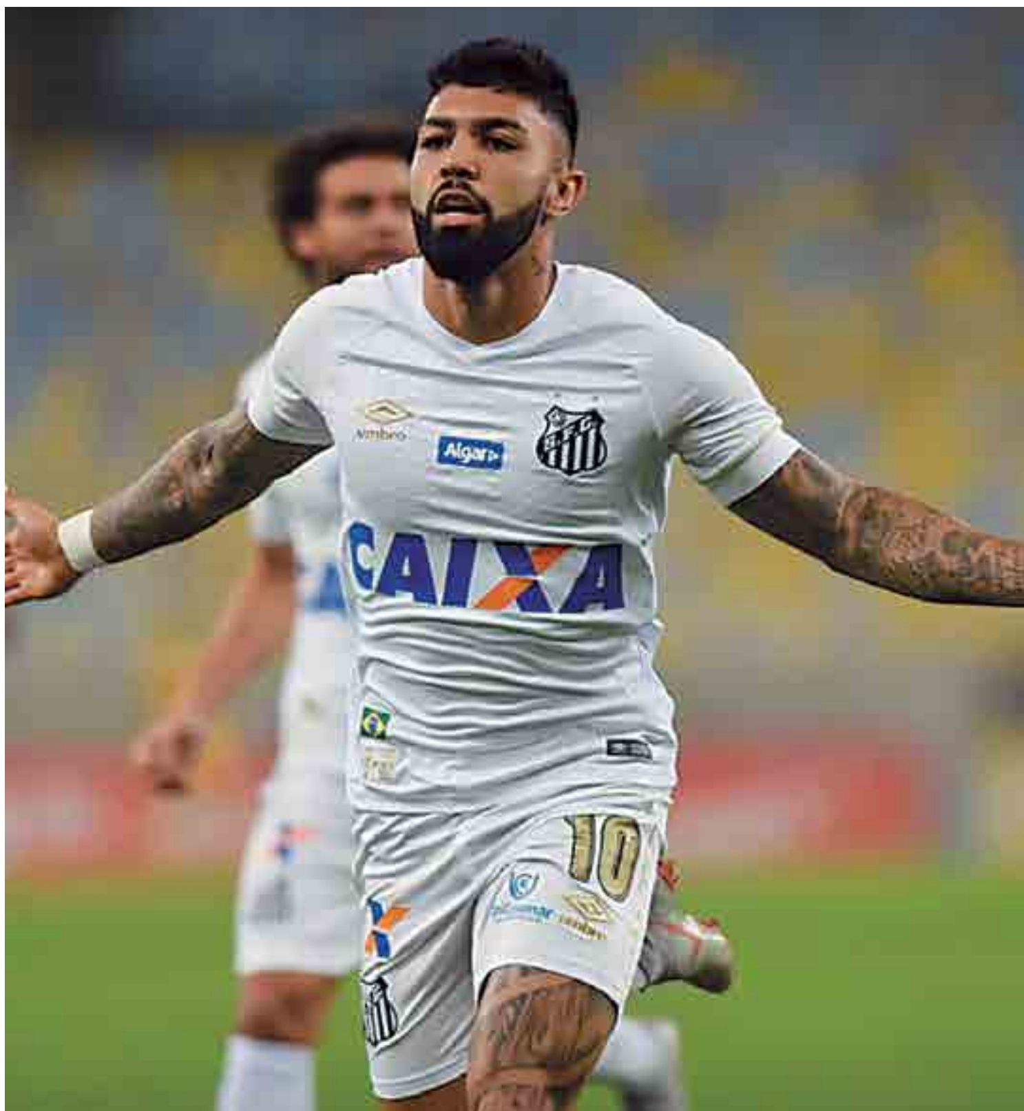
Gabigol é o artilheiro do Campeonato Brasileiro com 13 gols, dos quais três foram no Vasco. Hoje, no Pacaembu, as duas equipes voltam a se enfrentar

Até lá, Pikachu espera que o time esteja melhor. Ele, particularmente, mostrou alívio com o retorno às redes: de pênalti, marcou seu 17º gol na temporada – é o artilheiro do Vasco em 2018.