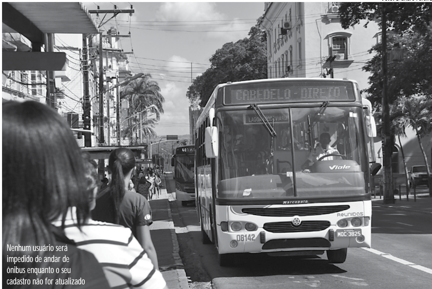
Nenhum usuário será impedido de andar de ônibus enquanto o seu cadastro não for atualizado

O cadastramento começou a ser feito com os estudantes. Mas, os usuários não precisam se preocupar, pois a atualização cadastral será feita gradativamente