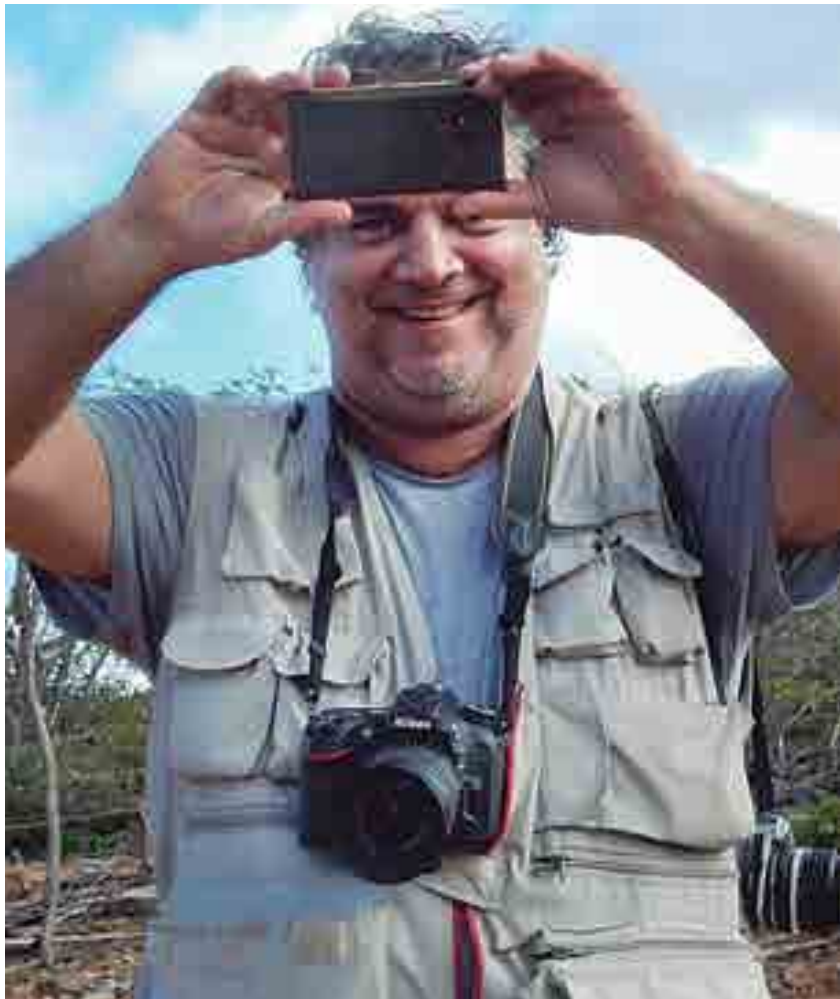
O fotógrafo Gustavo Moura (acima) selecionou imagens captadas no entorno do Rio Paraíba, coletadas ao longo de uma década

Sobre os fotógrafos - Gustavo Moura nasceu na cidade de João Pessoa e atua profissionalmente desde o início dos anos 1980. A característica do seu trabalho é transitar entre o documental e o autoral, registrando o ambiente e a cultura da região Nordeste do Brasil. Em 1998, ele participou do projeto "Brasil Bom de Bola" (Editora Tempo d'Imagem). Na sequência, vieram outras publicações, a exemplo das obras intituladas Imaginário (Editora Tempo d'Imagem, 2000); Varadouro, Soneto em Preto e Branco (Edições Varadouro, 2002); Artesanato no Brasil (Sebrae) e 1º Caderno da Fotografia Brasileira, lançado pelo Instituto Moreira Salles. Destaque, ainda, para o projeto "Do Reino Encantado", que resultou em exposição e livro nos quais aborda o universo da vida e obra do escritor paraibano Ariano Suassuna (1927 - 2014). Em 2003, Gustavo Moura venceu, na