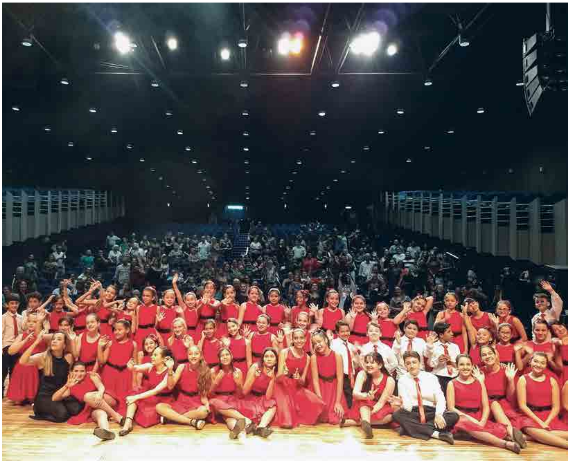
Audições com as crianças e adolescentes ocorrerão nos dias 20 e 22 de agosto, no Espaço Cultural, próximo à administração da Orquestra Sinfônica da Paraíba; os candidatos serão submetidos a um teste de aptidão vocal