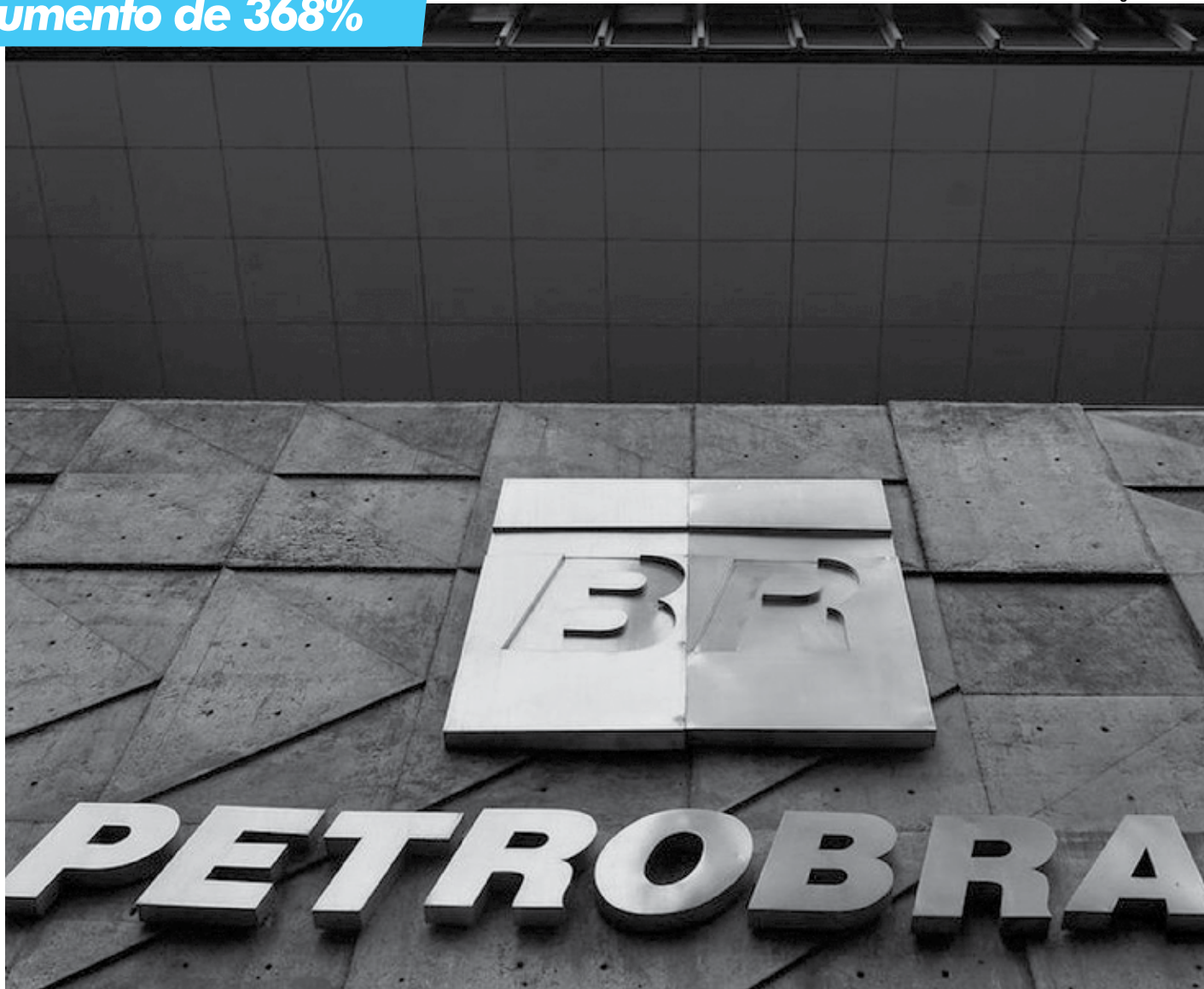
O fluxo de caixa livre da Petrobras foi positivo pelo 17º trimestre consecutivo, somando R$ 11,3 bilhões. Já a dívida líquida manteve queda em US$ 83,7 bi