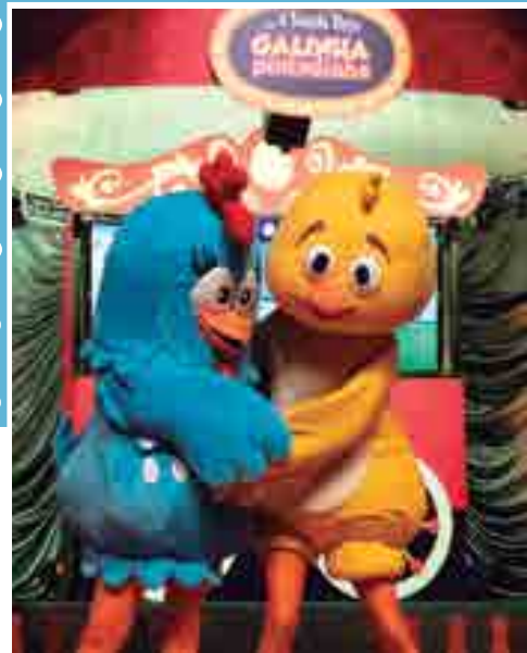
"A Fabulosa Trupe" se apresenta em João Pessoa