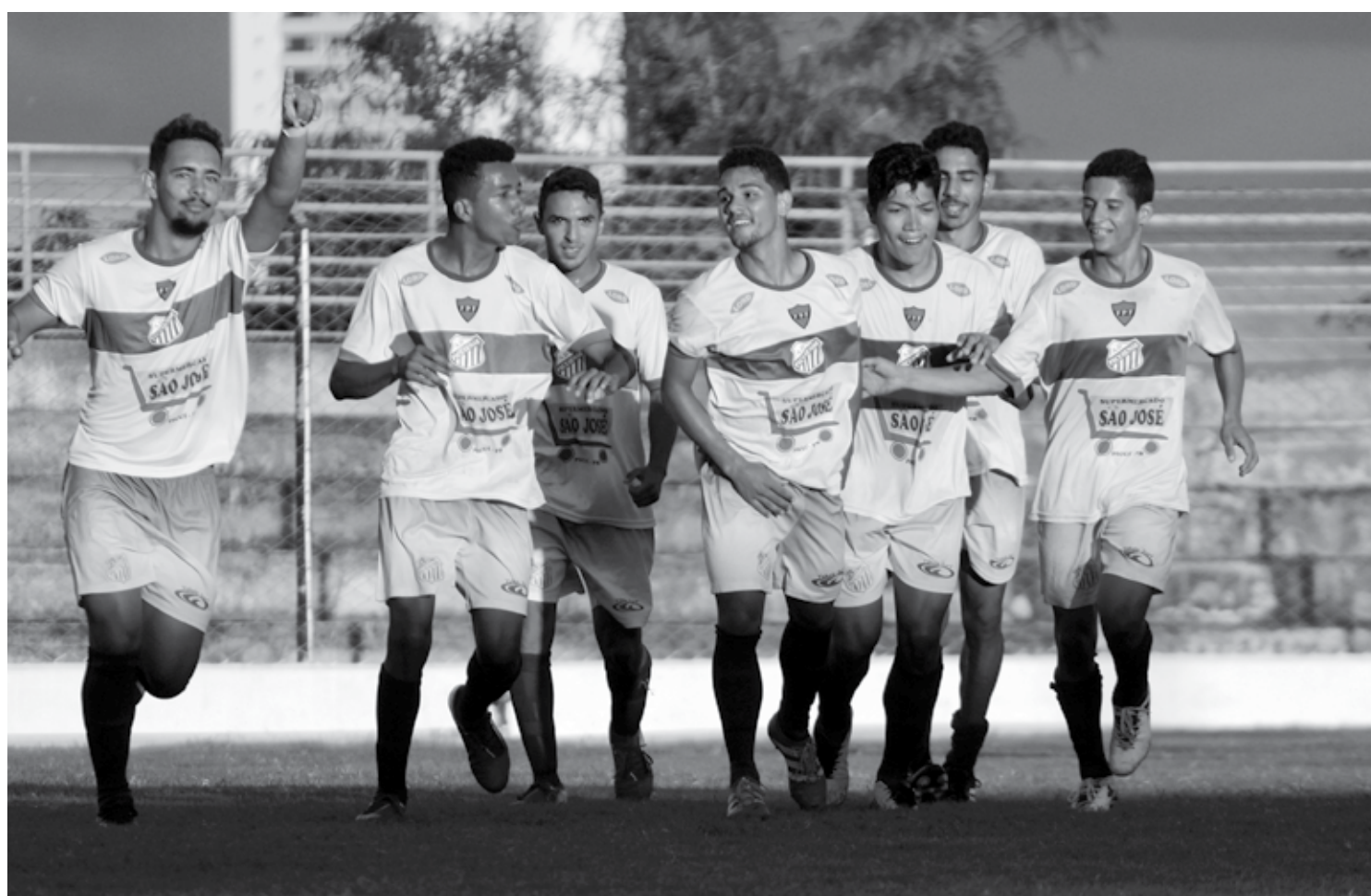
A Picuiense, que derrotou o Treze na última quinta-feira, garantiu vaga no mata-mata e vai decidir a vaga hoje contra a Perilima, em Campina Grande

Abrindo a rodada de quartas de final, está o CSP, equipe detentora do me-