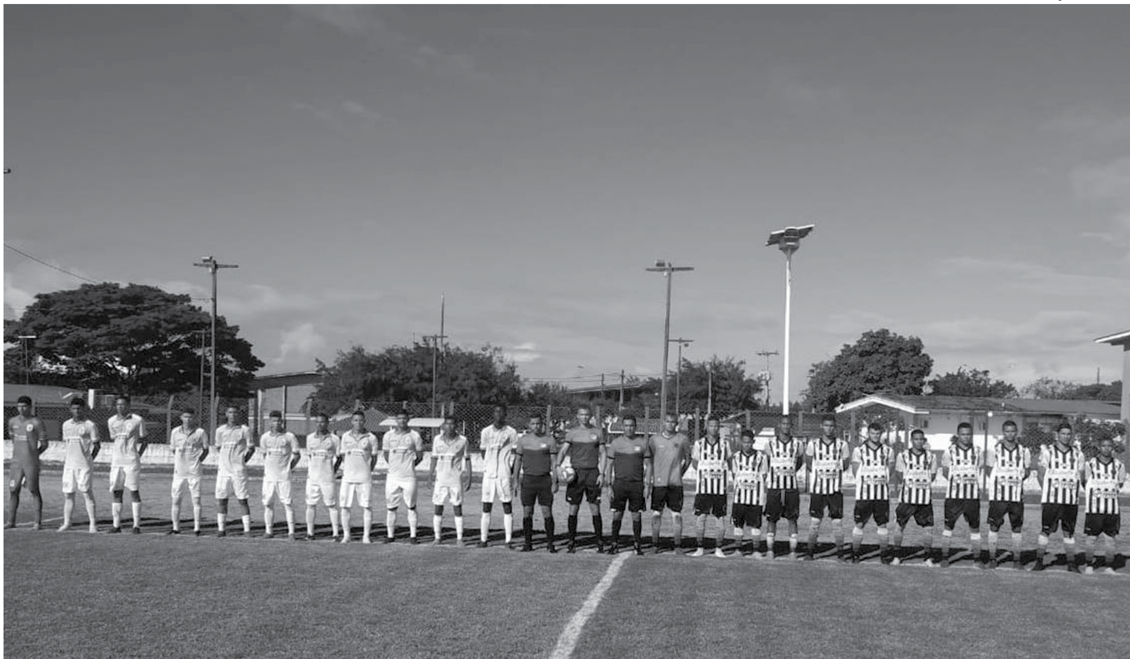
No primeiro jogo disputado pela fase classificatória, no mesmo local da disputa, o campo da Unipê, o Centro Sportivo Paraibano levou a melhor e venceu por 1 a 0. Quem for eliminado perde a chance de brigar por vaga na Copa SP