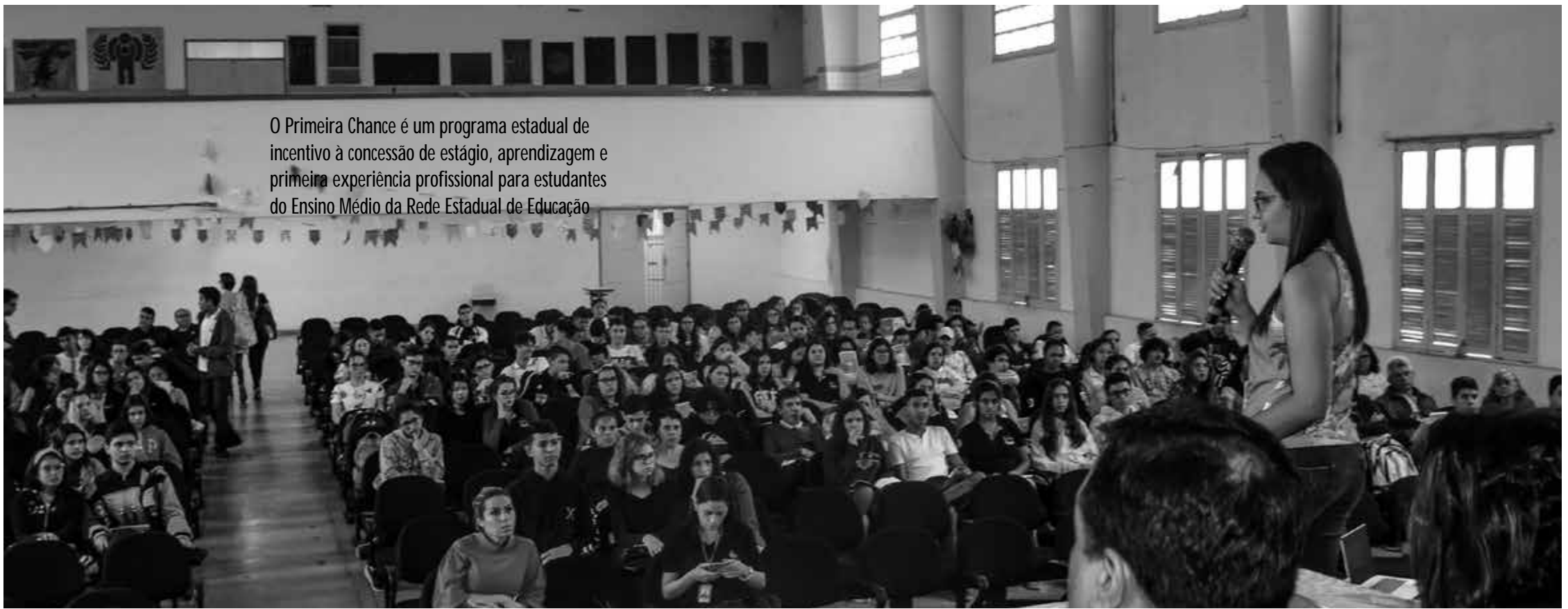
O Primeira Chance é um programa estadual de incentivo à concessão de estágio, aprendizagem e primeira experiência profissional para estudantes do Ensino Médio da Rede Estadual de Educação