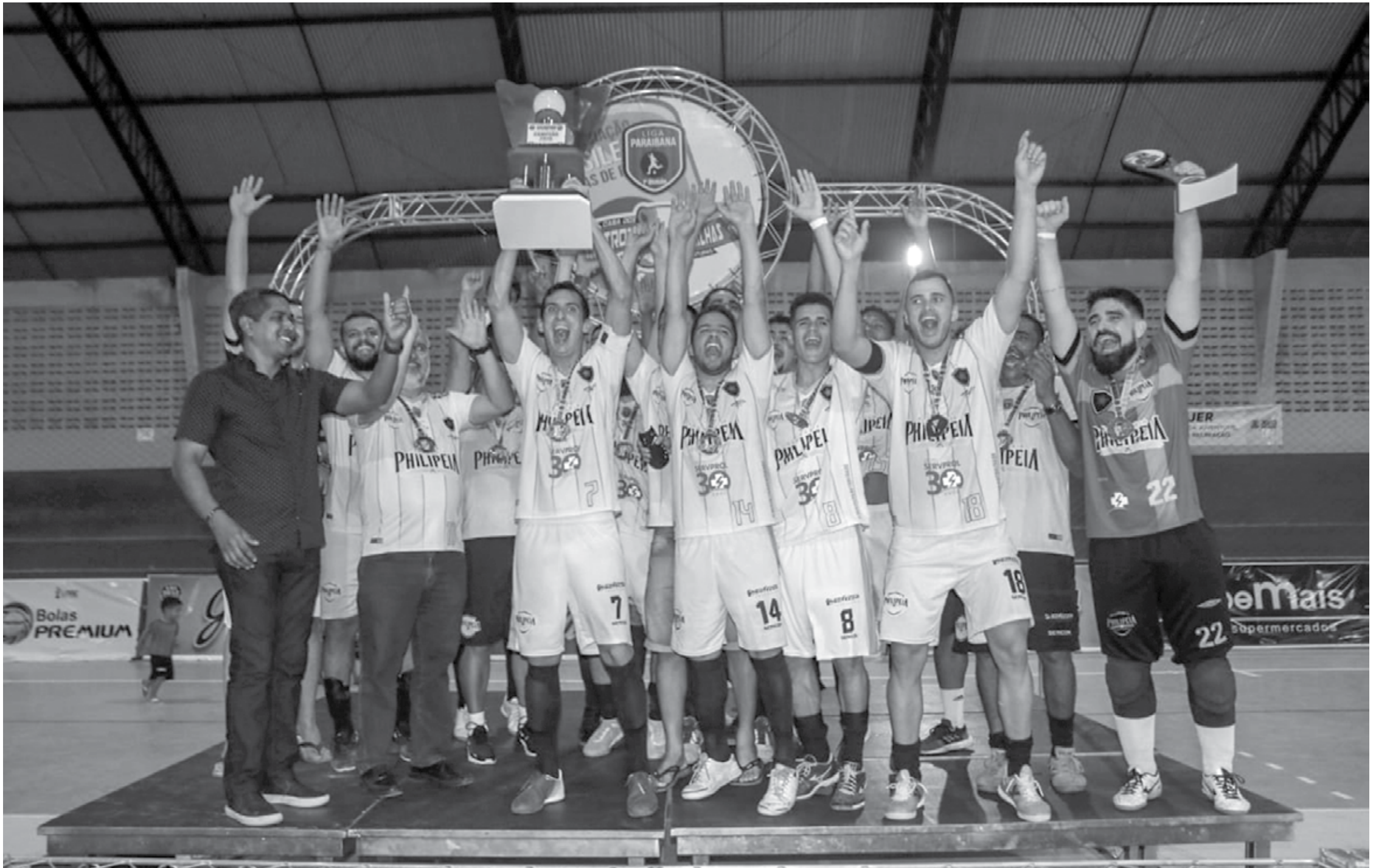
No Ginásio Odilon Ribeiro Coutinho, jogadores e dirigentes do Philipeia/Botafogo comemoram o título de campeão depois de um jogo bem disputado diante do Bonança, na última quarta-feira, no bairro do Valentina Figueiredo