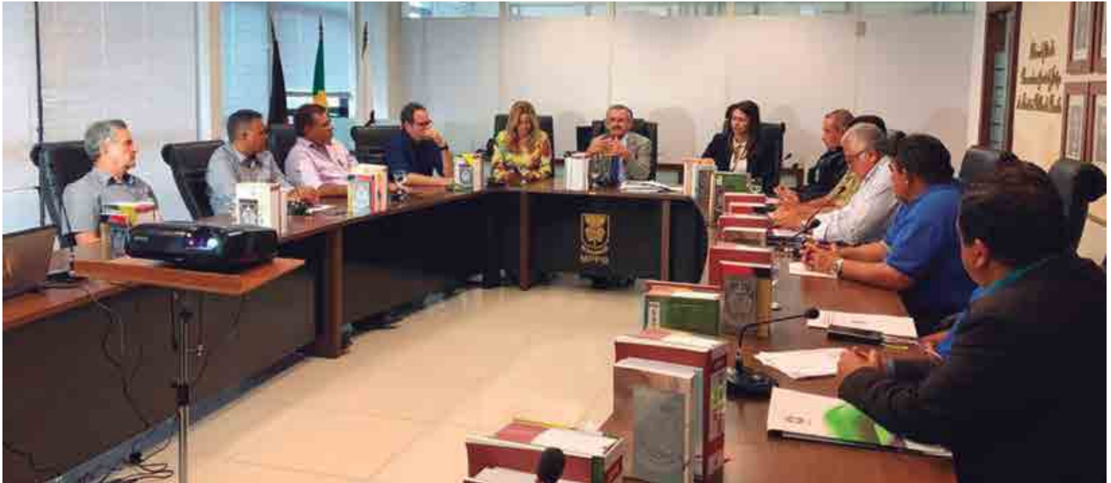
O Núcleo de Defesa do Torcedor do Ministério Público da Paraíba vai estar reunido na manhã desta quarta-feira com dirigentes da Federação Paraibana de Futebol, administradores de estádios e dirigentes de clubes para definir a situação dos campos onde a bola vai rolar no Estadual de 2020