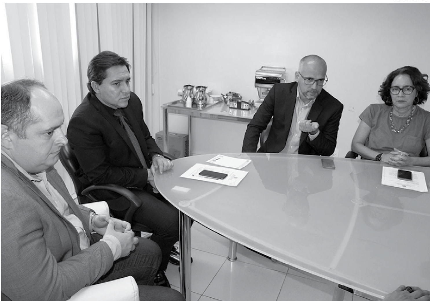
O Termo de Cooperação Técnica foi discutido na manhã dessa terça-feira (3) e a capacitação acontecerá no período de abril a novembro de 2020