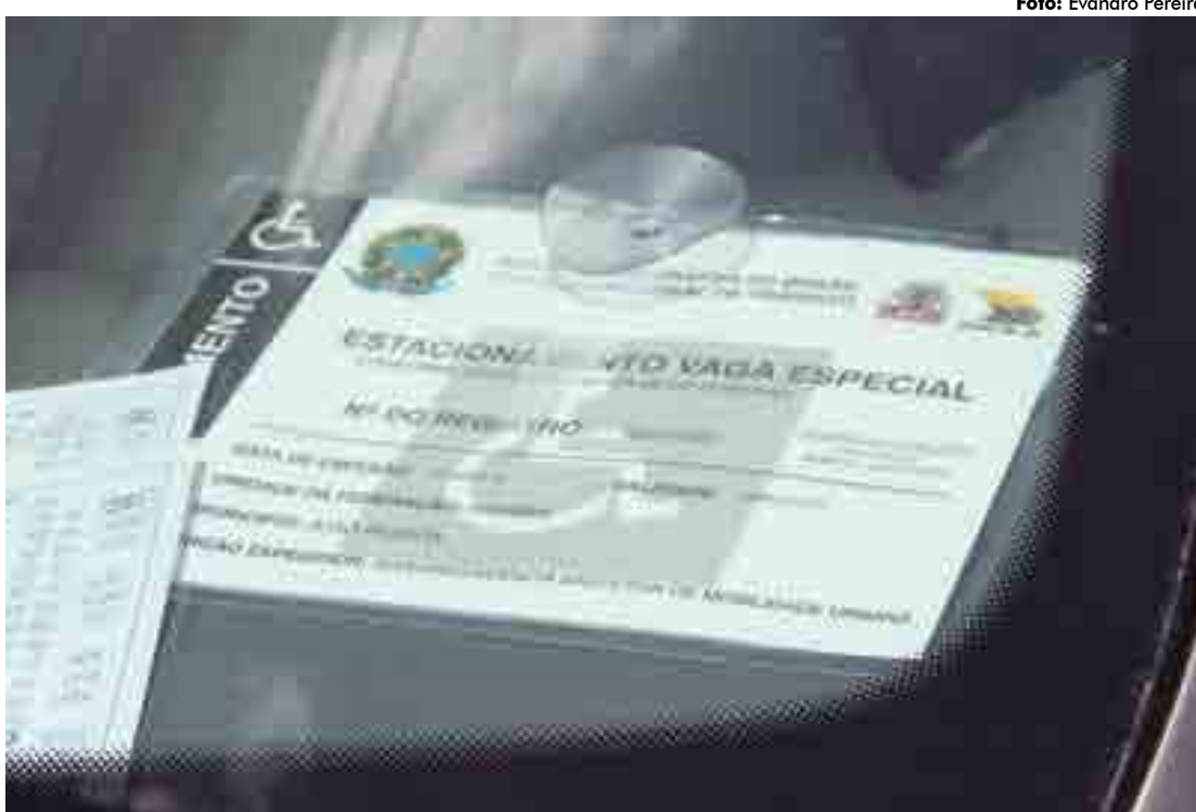
Uma das principais reclamações diz respeito às vagas para deficientes que são ocupadas de forma indevida