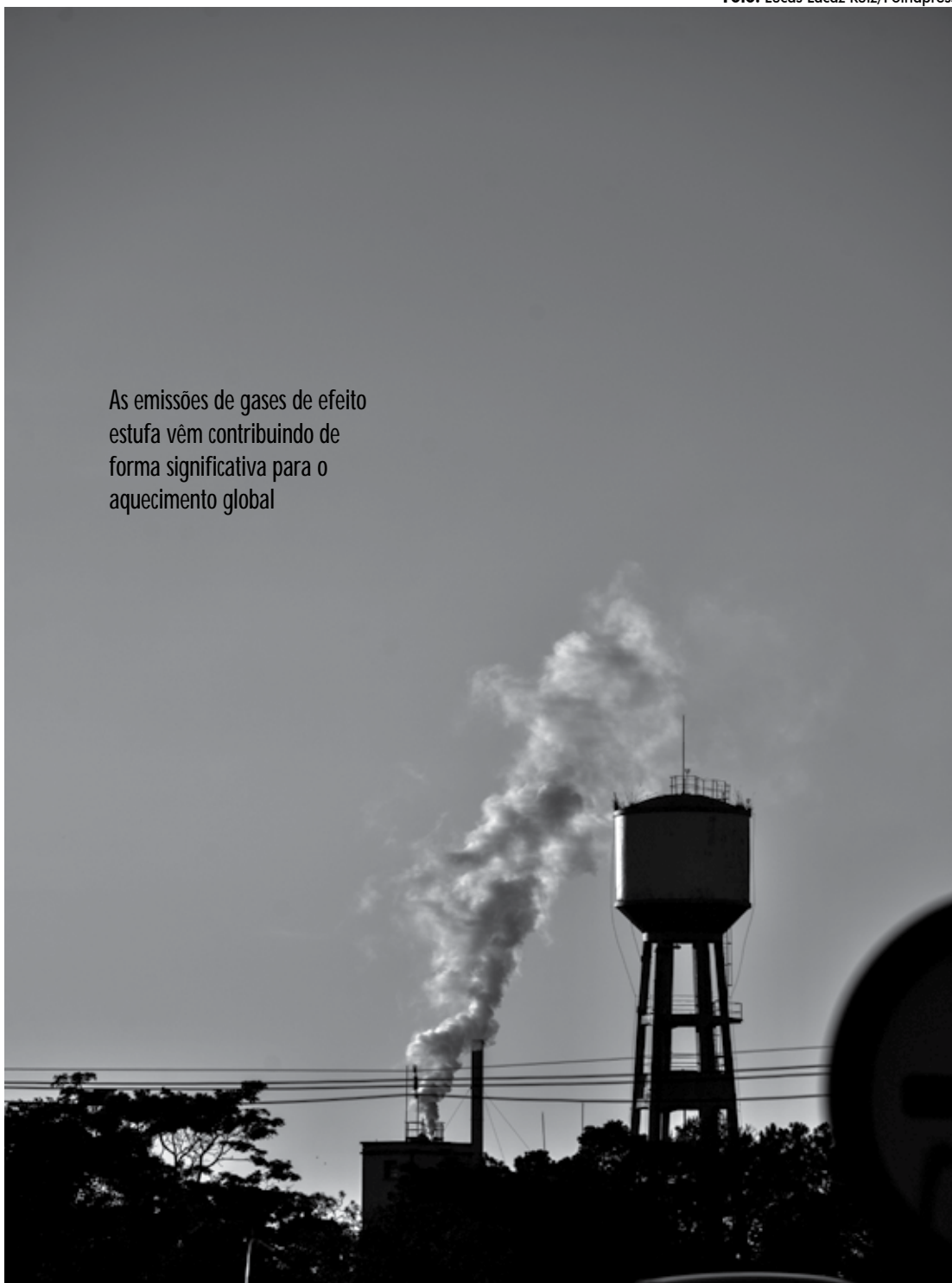
As emissões de gases de efeito estufa vêm contribuindo de forma significativa para o aquecimento global

Guterres pediu que as pessoas "entrem no caminho correto hoje, não amanhã" e disse que a conferência vai oferecer a oportunidade para que isso seja feito.