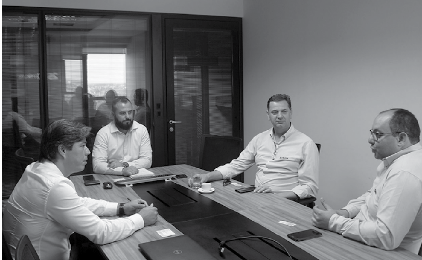
Executivos da indústria Alumasa, empreendimento com sede em Santa Catarina, foram recebidos na última segunda-feira pela diretoria da PBGás