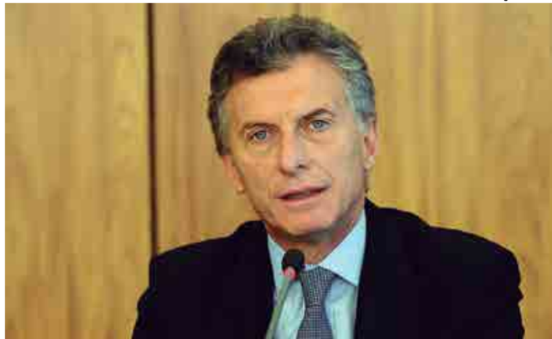
Macri, que defende a redução da tarifa externa comum, se despede do Mercosul, já que não se reelegeu na Argentina

Novo item de série: massagem relaxante pra você.