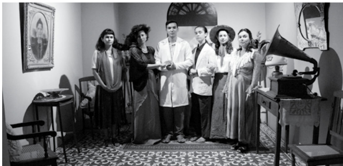
Grupo Atores da Pá levam ao palco da Usina Cultural Energisa, nesta quarta, adaptação de Machado de Assis