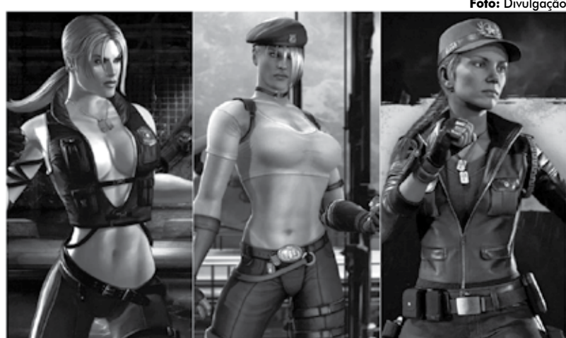
Sonya Blade, de 'Mortal Kombat', agora está mais realista e menos sexualizada

Não foi só a Sonya que mudou. Todas estão com os seios bem mais proporcionais e com um tanto a mais de pano no corpo e menos centímetros nos saltos (às vezes, nem salto tem). Algumas personagens continuam sensuais, e como a rainha do sub-mundo Sindel, que tem um quê de bruxa e um quê de vampira. Já a filha dela usa armadura, sem decotes. A guerreira Scarlet usa uma roupa que lembra as de ninjas, com o corpo completamente coberto. Para mim, o jogo se torna ainda mais interessante e me faz querer saber mais sobre a história e contexto de cada uma. Fi-