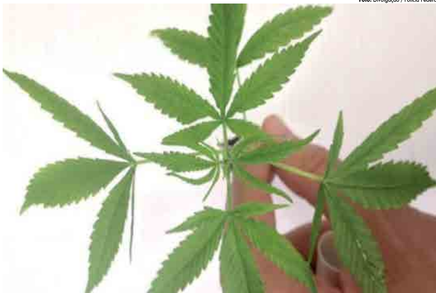
Tramita na Câmara um Projeto de Lei que faculta a comercialização de medicamentos que contenham extratos ou partes da planta Cannabis sativa em sua formulação

A Associação Brasileira de Apoio Cannabis Esperança (Abrace) contabiliza centenas de pessoas que tiveram acesso ao medicamento para casos de epilepsia, autismo, mal de Alzheimer, mal de Parkinson e neuropatias. A entidade divulga nomes e contatos de mais de 150 médicos que já prescrevem medicamentos à base de Cannabis.