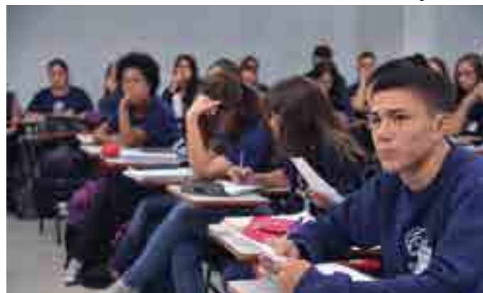
O Brasil ocupa no ranking da avaliação a 42ª posição em leitura

o Brasil, o relatório destaca a inclusão de alunos na escola no período entre 2000 e 2012.