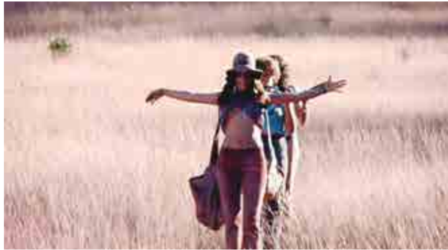
'O Barato de Iacanga' é o longa-metragem que encerra o festival, hoje à noite, na Sala Macro XE

Sivuca ainda aparece em outro momento da programação desta quarta: no documentário O Barato de Iacanga , de Thiago Mattar, filme que marca o encerramento da 14ª edição do Fest Aruanda e será exibido na sequência de homenagens, na mesma Macro XE.