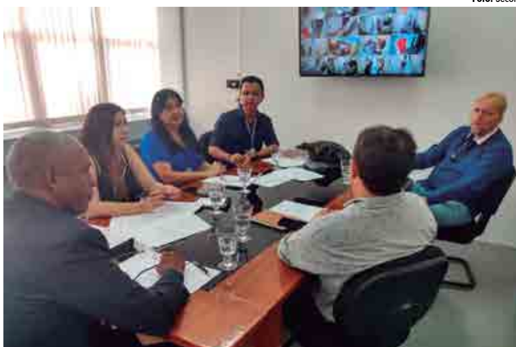
Ameaças à comunidade remanescente de “Fonseca”, na cidade de Manaíra, também motivaram a reunião

“Nós temos recebido notícias, inclusive oficiais, de ameaças de morte contra a comunidade quilombola inteira. Os órgãos federais entraram em estado de atenção e haverá uma ação de proteção