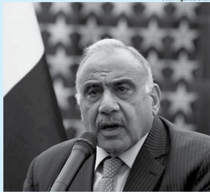
Adel Abdul Mahdi não suportou as pressões contra o governo e renunciou