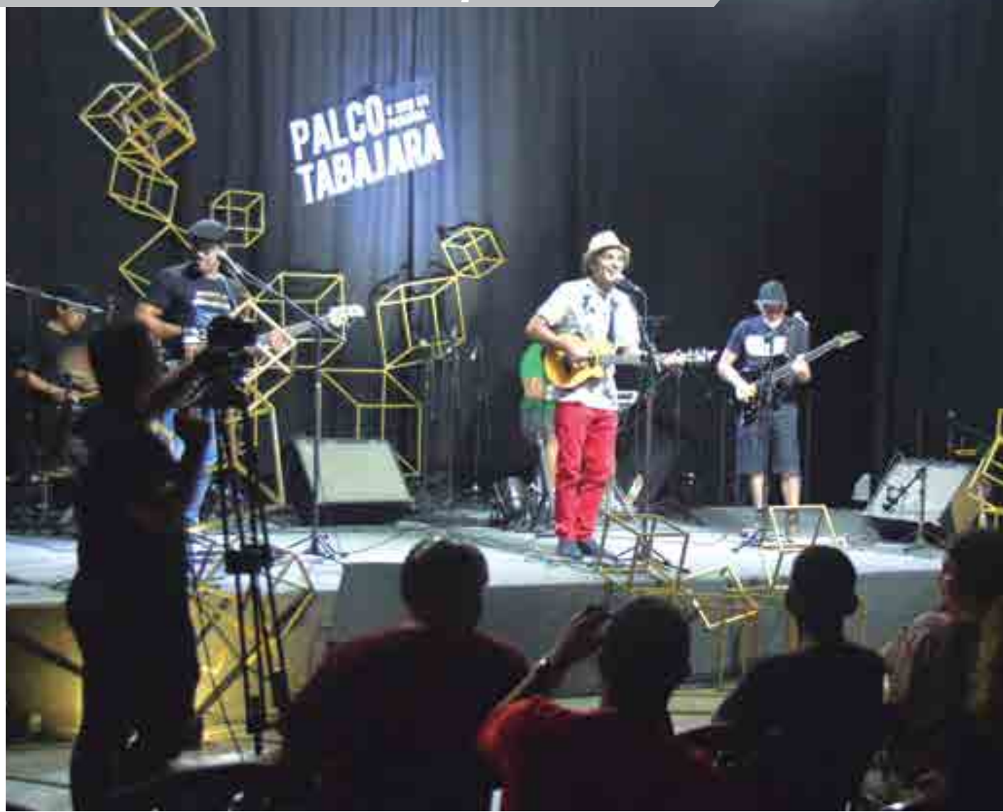
O público curtiu o melhor do trabalho do cantor e compositor Fuba e da banda Samba de Praia que fechou a temporada 2019 do Palco Tabajara