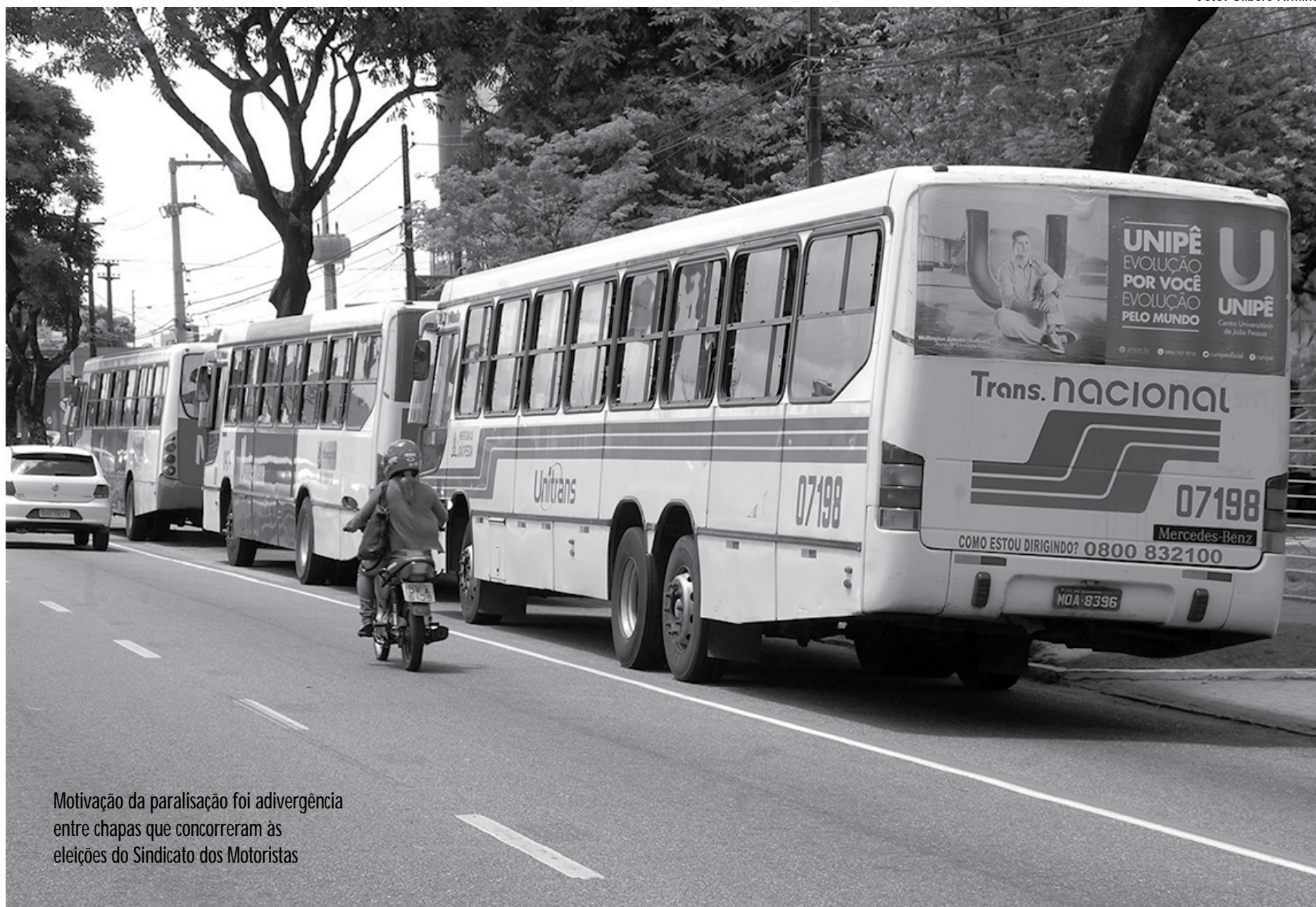
Motivação da paralisação foi adivergência entre chapas que concorreram às eleições do Sindicato dos Motoristas

Nascimento criticou a realização da eleição, realizada em 2014 para a presidência e demais cargos da diretoria do sindicato e exigiu transparência para a escolha dos mandatários da entidade. Com a decisão dos atuais di-