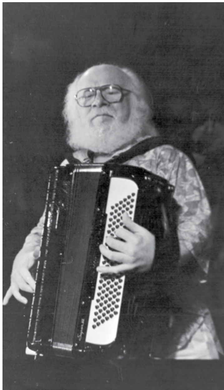
Sivuca compôs músicas para filmes de Os Trapalhães e de Roberto Farias