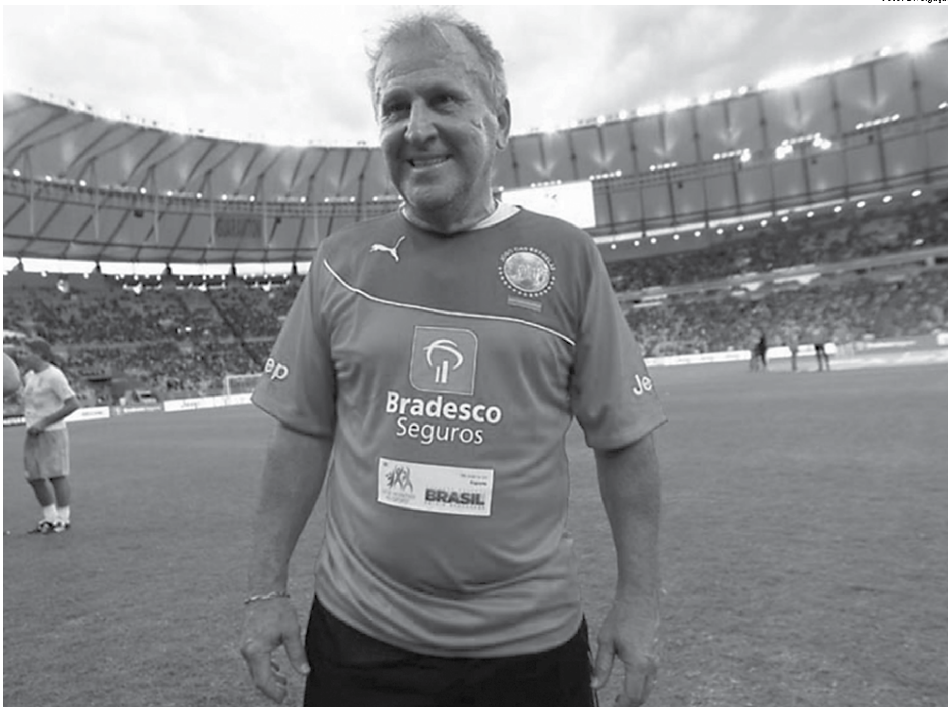
Zico conta que marcou um gol contra a Bolívia no Morumbi em 1979 e depois levou um pontapé de um boliviano, gerando a maior confusão já nos acréscimos da partida e briga generalizada

“Foi um dia bem especial para mim. Eu tinha jogado contra a Argentina uma semana antes e foi minha estreia pela Seleção, no Maracanã. Tinha feito o gol da vitória. E aí, fomos para São Paulo para esse duelo contra a Bolívia. Mas o titular na época era