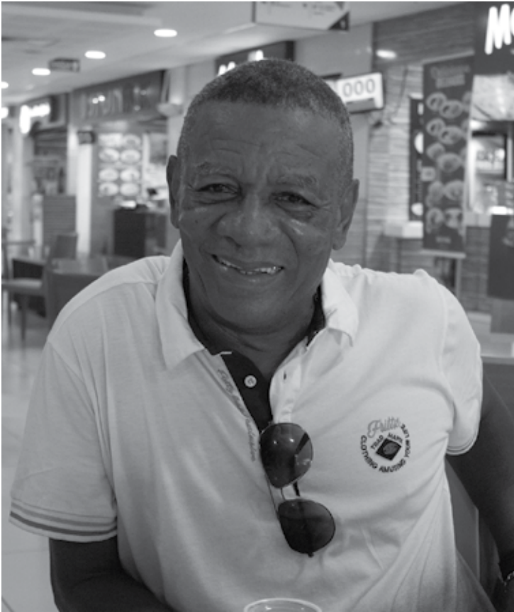
Ex-atleta visita João Pessoa e fala de sua trajetória no futebol paraibano