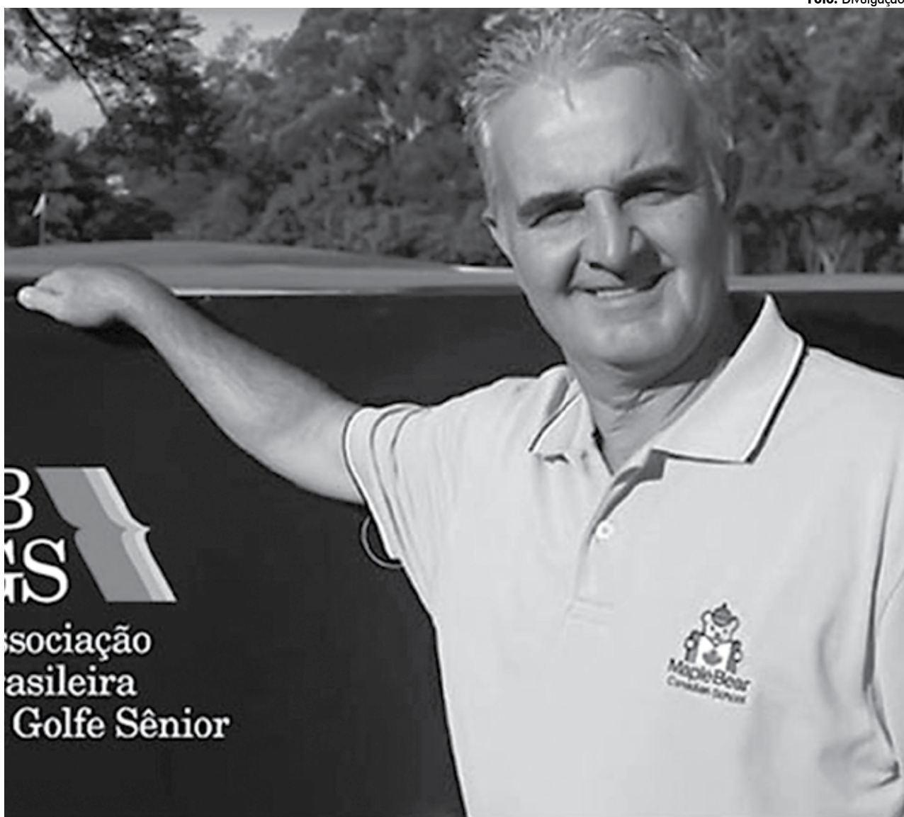
Para Tita, o Brasil tem todas as condições de se impor jogando em casa e o grupo está amadurecido para superar os adversários

Desde a inauguração do Estádio Cícero Pompeu de Toledo (nome oficial do Morumbi) em 1960, a Canarinho acu-