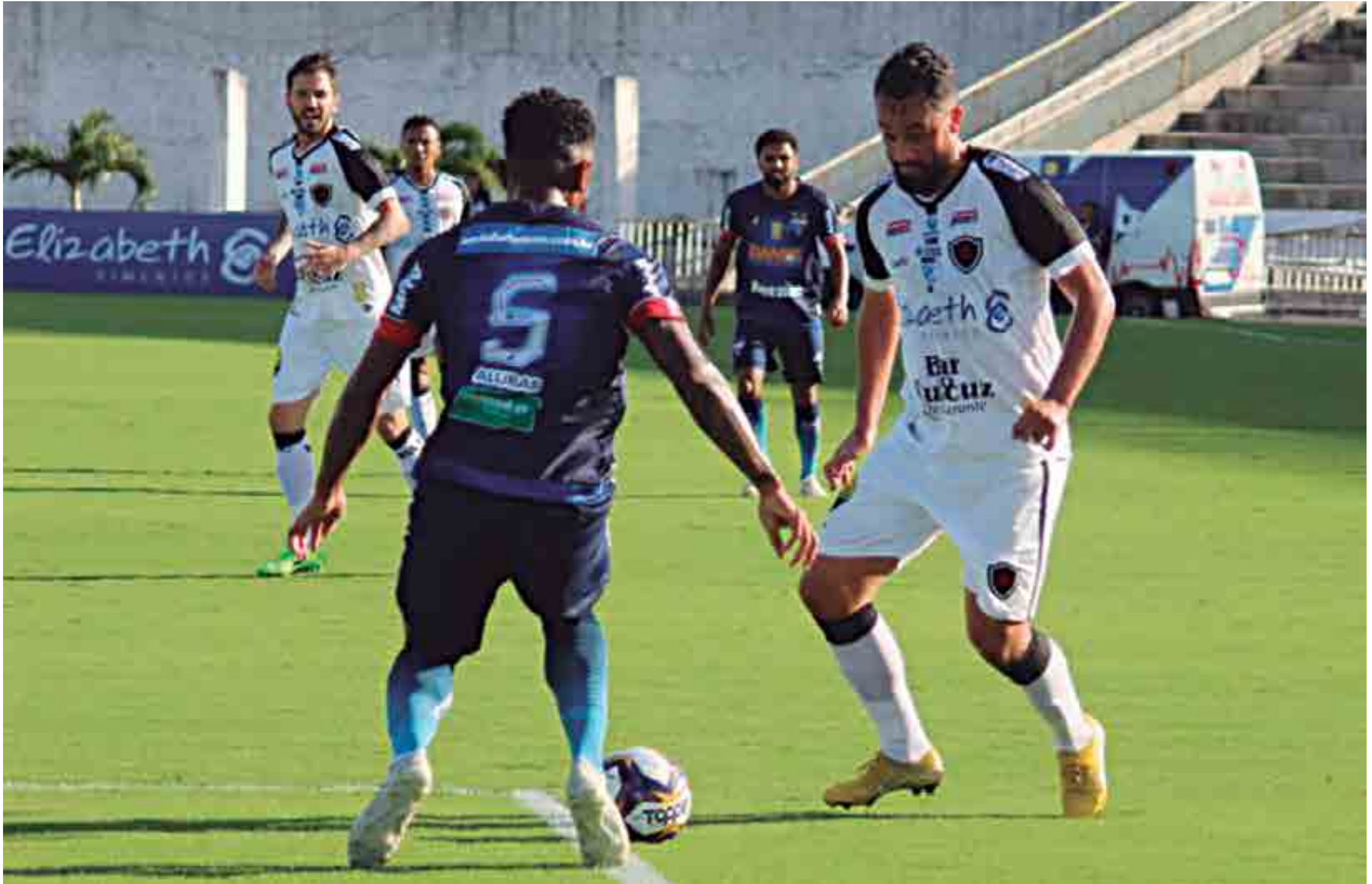
Botafogo vem de uma vitória sobre o Fortaleza pela Copa do Nordeste e hoje entra em campo para jogo do Paraibano com uma equipe mista, já que na próxima quarta-feira vai entrar na sua terceira competição, a Copa do Brasil