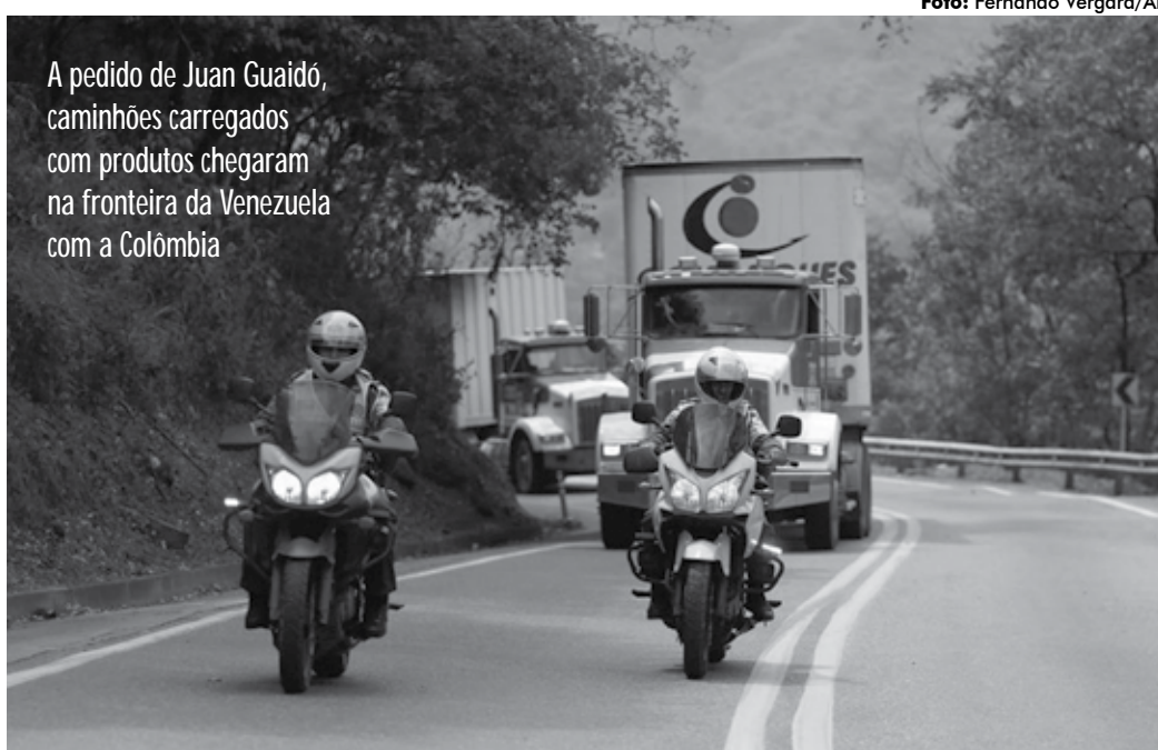
A pedido de Juan Guaidó, caminhões carregados com produtos chegaram na fronteira da Venezuela com a Colômbia

Uma dezena de veículos carregados com medicamentos e alimentos chegou na quinta-feira na cidade de Cúcuta, na fronteira colombiana, onde foi instalado um centro de estocagem próximo à ponte internacional de Tienditas, bloqueada pelos militares venezuelanos com dois caminhões e uma cisterna.