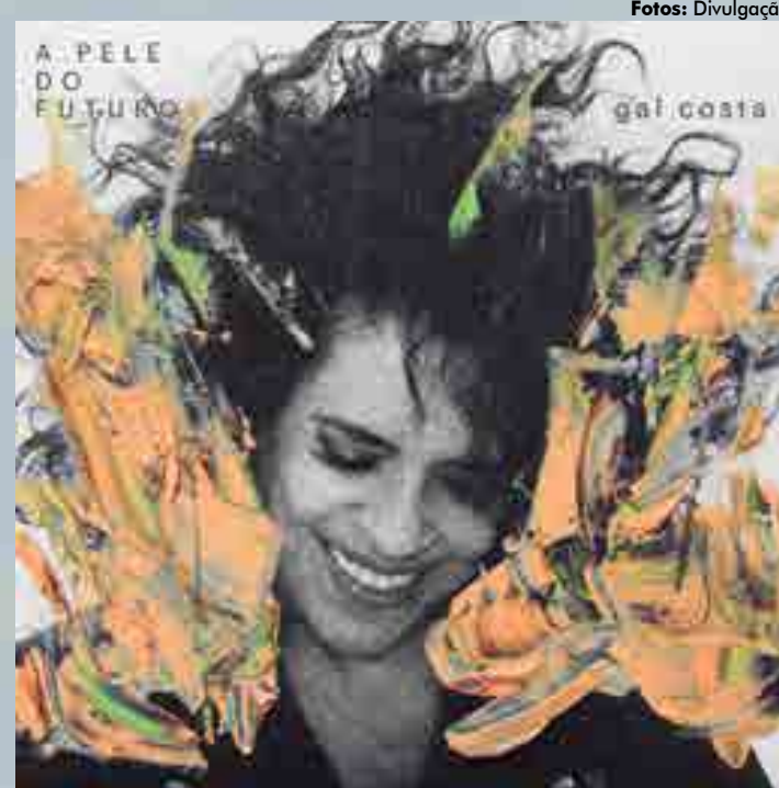
Capa do disco 'A pele do futuro', onde Gal canta músicas inéditas