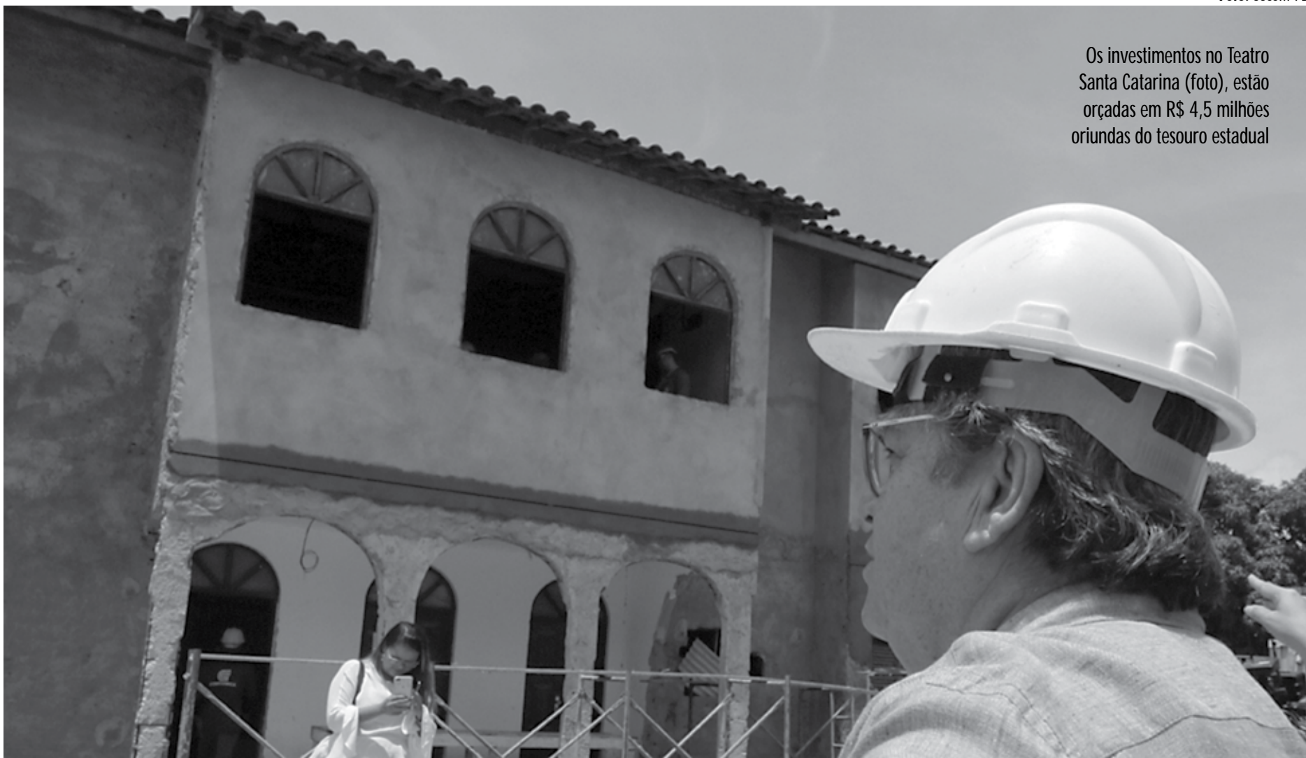
Os investimentos no Teatro Santa Catarina (foto), estão orçados em R$ 4,5 milhões oriundos do tesouro estadual