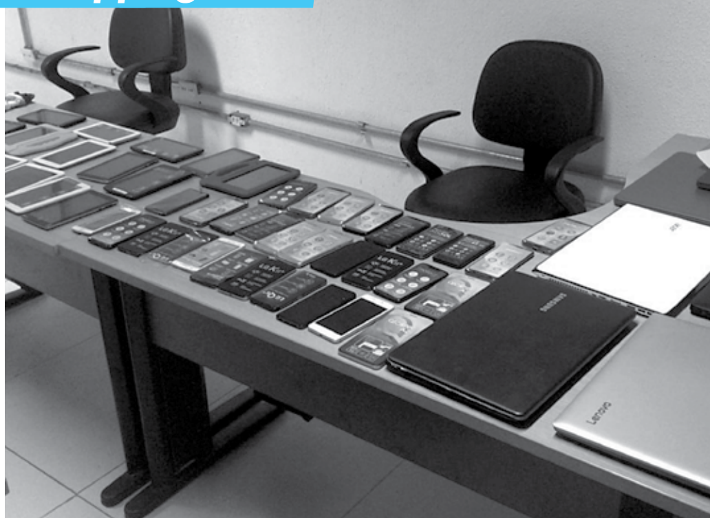
Suspeito foi preso em flagrante dentro da loja tentando levar celulares, tablets e notebooks de várias marcas