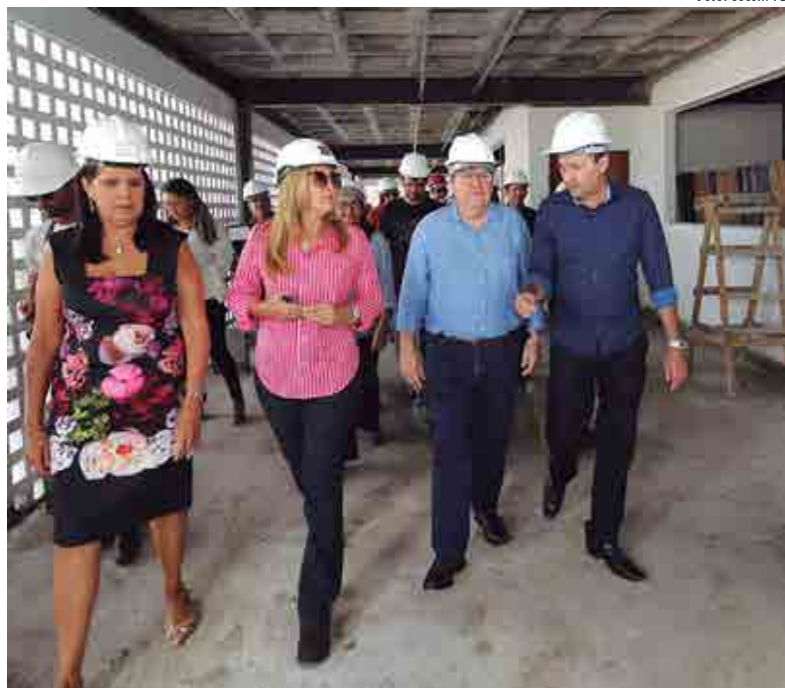
O chefe do Executivo acompanhado de assessores quando inspecionava o Complexo Educacional José Lins do Rego

“O que temos buscado é a governabilidade, ao mesmo tempo o que for necessário para fazermos uma gestão tranquila. Se novas adesões surgirem querendo compor conosco esse projeto que mudou a Paraíba, nós aceitamos discutir. E se forem em bases republicanas e sejam