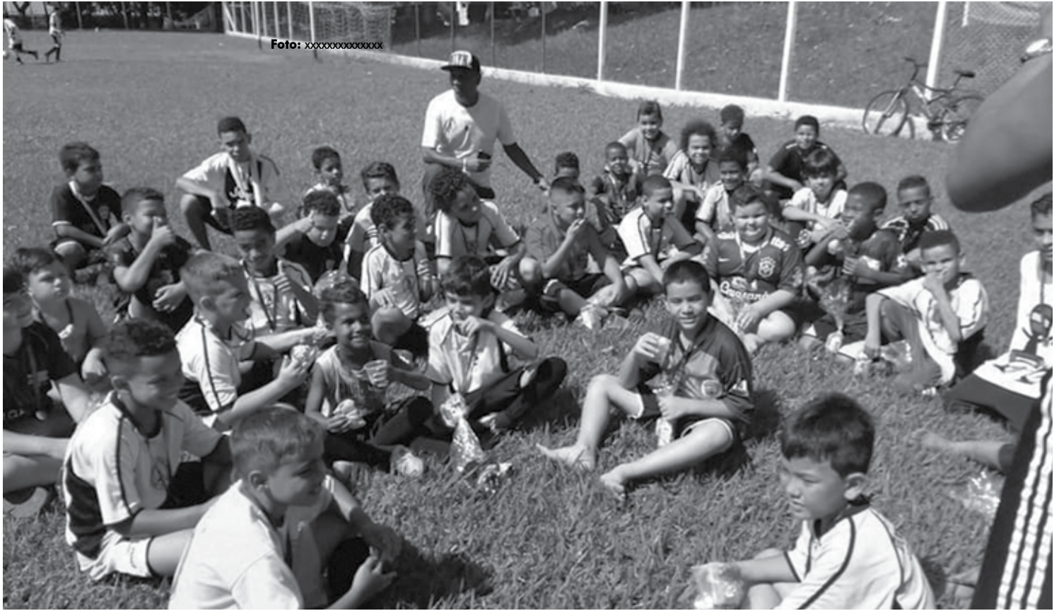
Fantick comanda uma entidade que trabalha com crianças e adolescentes, pelo menos três deles integram a equipe do Santos, de São Paulo