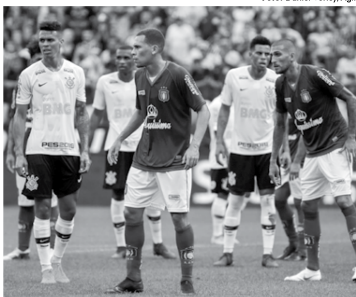
O Corinthians aparece em segundo lugar em público nas quartas-feiras