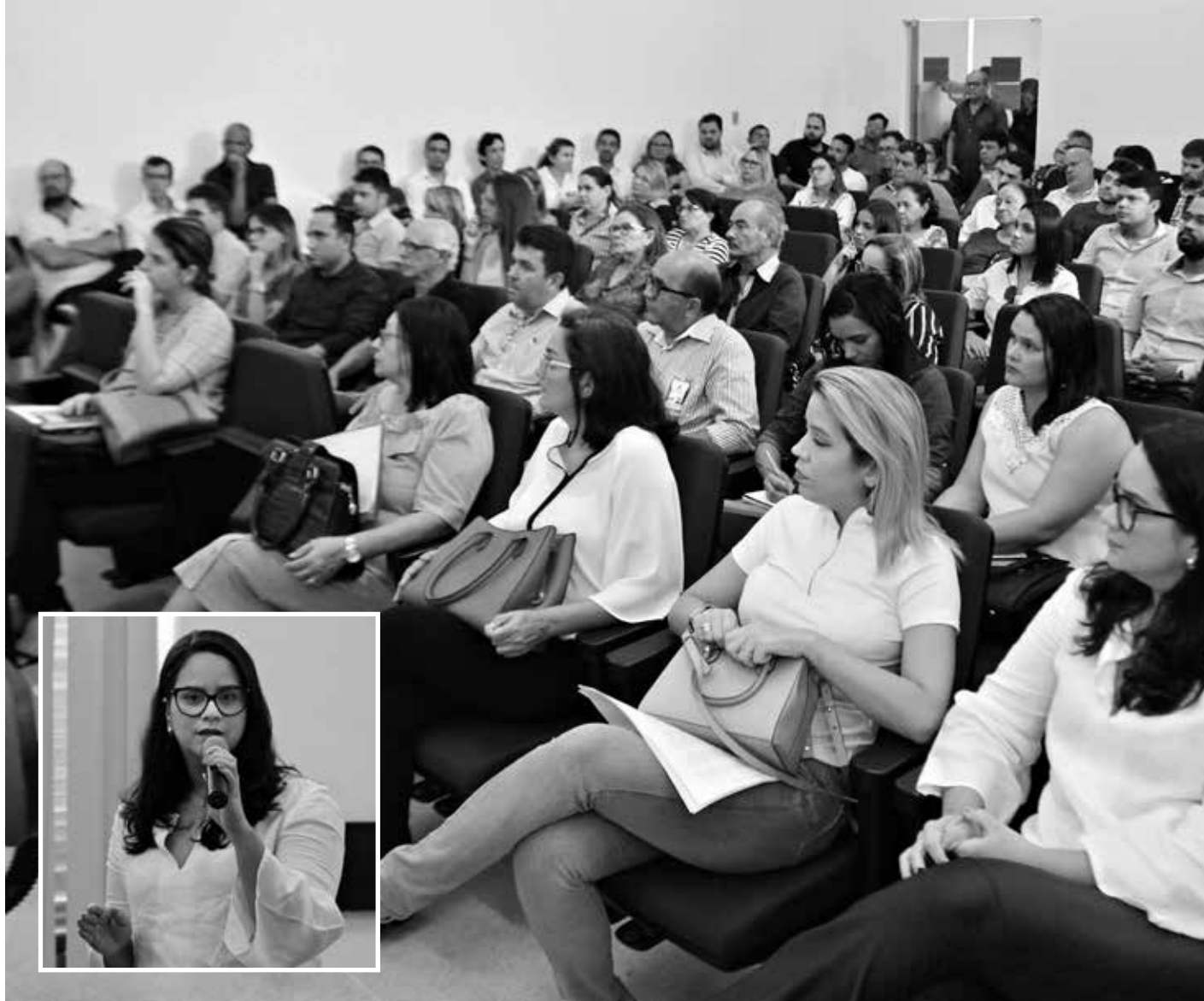
O objetivo da oficina foi orientar sobre a instrução normativa que vai ser publicada e que trata da prestação de contas dos hospitais e outros serviços da SES