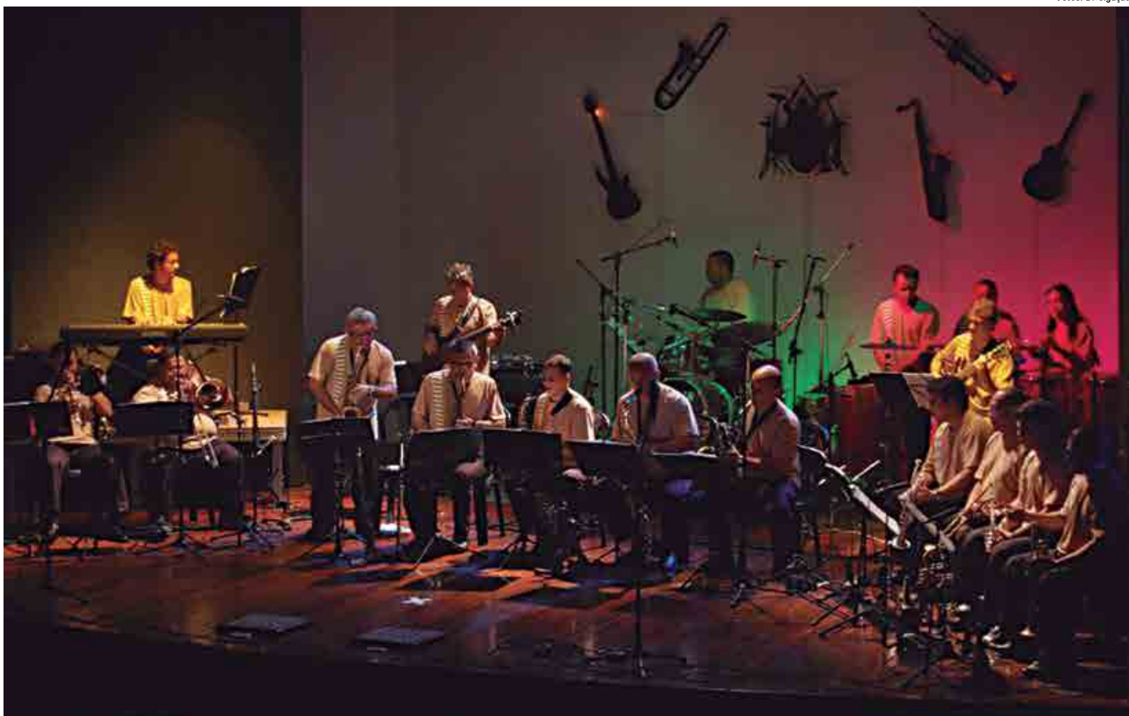
Além dos corais Voz Ativa e Mosaico entoando os sucessos de Chico Buarque, a festa contará com um baile da Orquestra Sanhauá (foto acima) e também Yuri e banda de frevo, neste sábado, no Bar do Baiano, nos Bancários