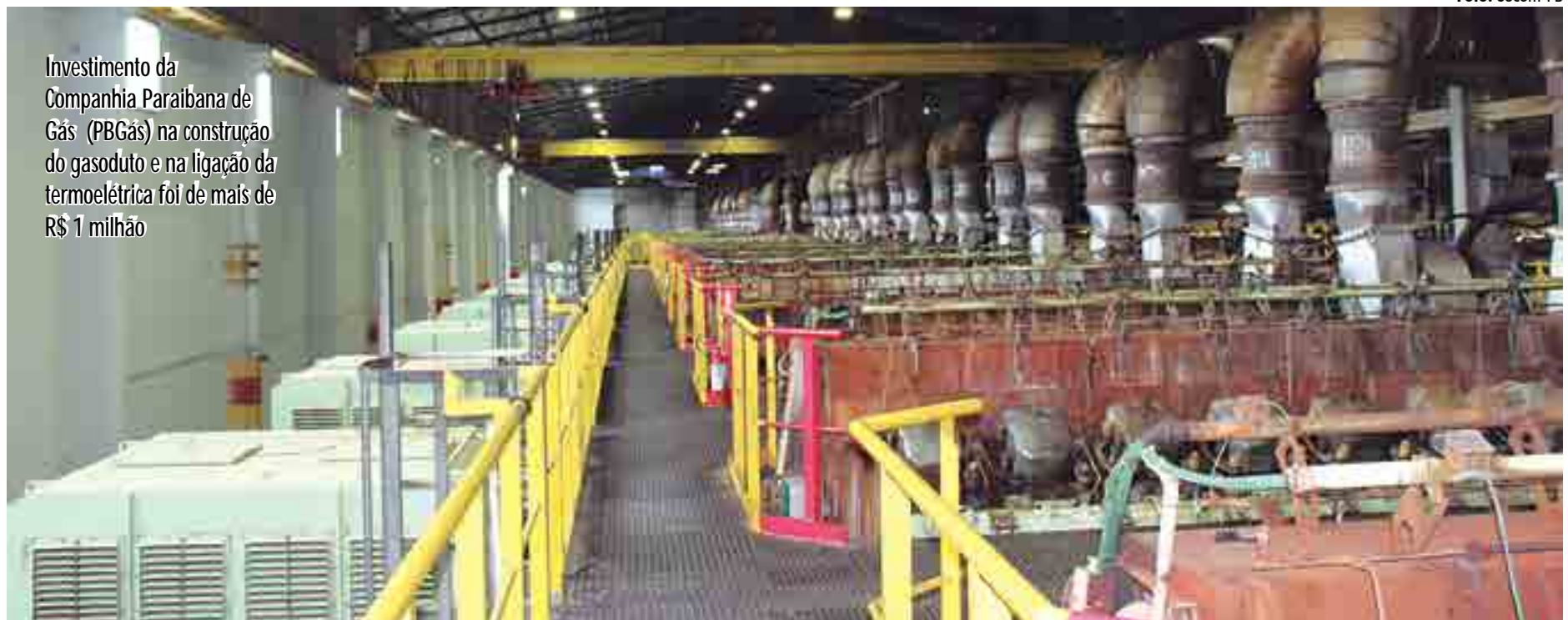
Investimento da Companhia Paraibana de Gás (PBGás) na construção do gasoduto e na ligação da termoeletrica foi de mais de R$ 1 milhão

Nesta primeira etapa, o gás natural será utilizado para a geração de vapor das caldeiras que tem a finalidade de pré-aquecer o óleo combustí-