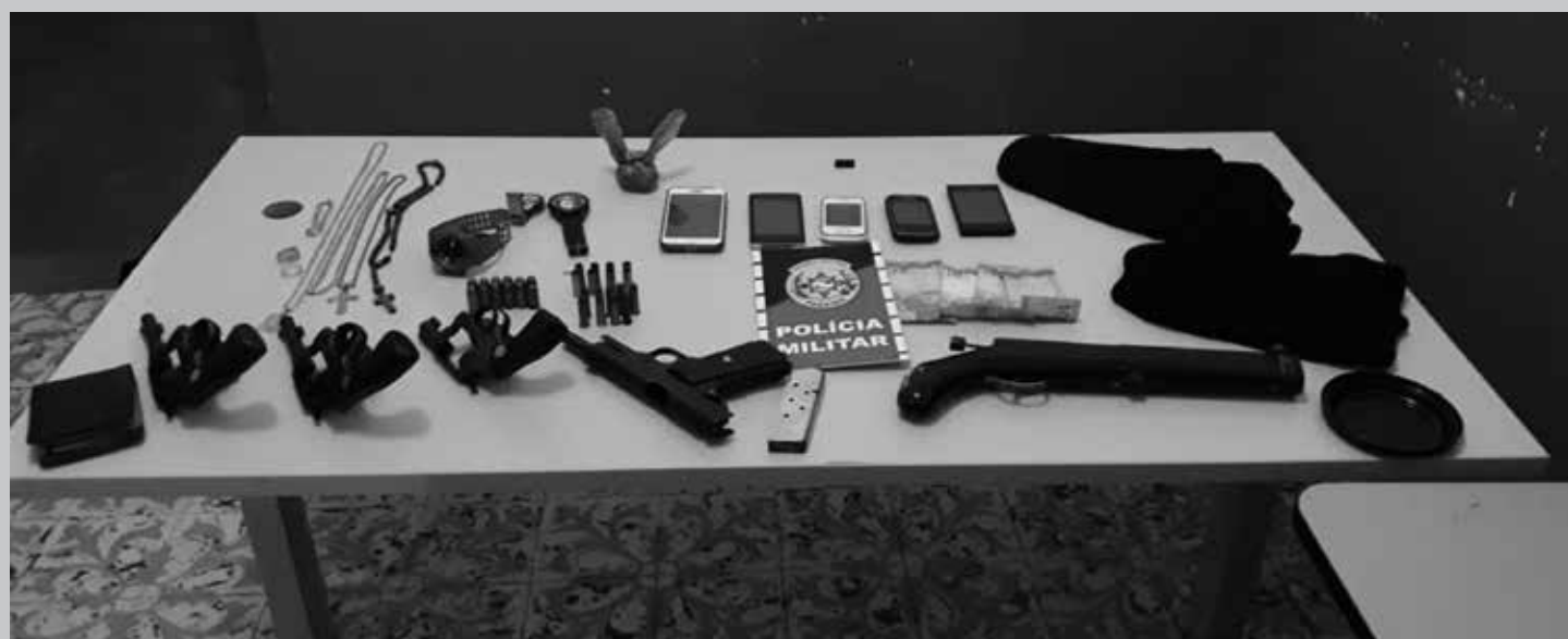
Com os suspeitos que planejavam instalar ponto de venda de drogas em Araruna a PM apreendeu cinco armas e uma quantidade de drogas

Cinco suspeitos que estariam planejando instalar um ponto de venda de drogas na cidade de Araruna foram detidos em flagrante, na noite da quinta-feira (14), durante ação realizada pela 7ª Companhia Independente da Polícia Militar. O bando tinha acabado de tentar matar a tiros um jovem de 24 anos, crime que possivelmente teria sido motivado pela disputa do tráfico.