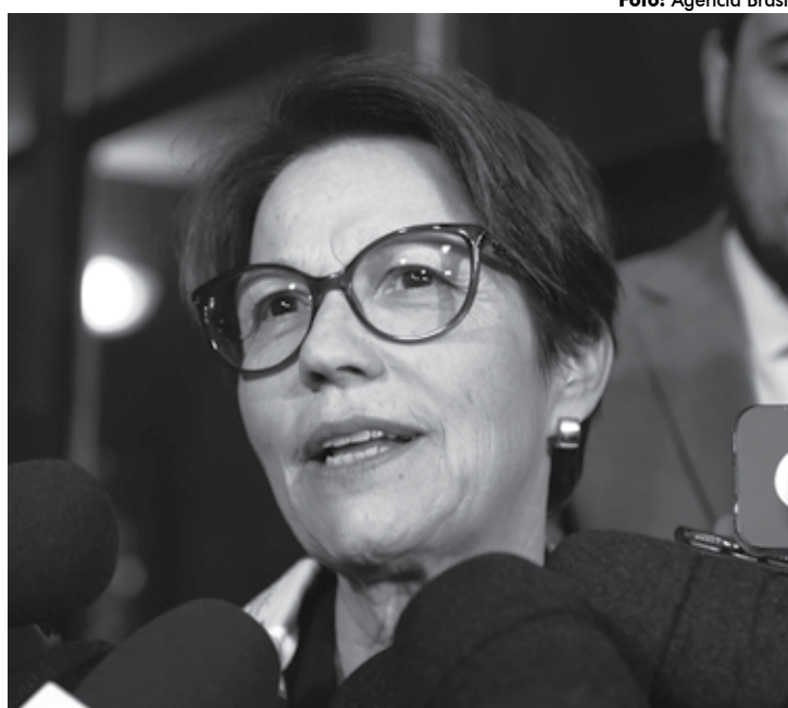
Vinda da ministra Tereza Cristina faz parte do Plano de Ação da Agricultura

No domingo, o encerramento das visitas técnicas será na Cooperativa dos Curtidores e Artesãos em Couro Arteza,