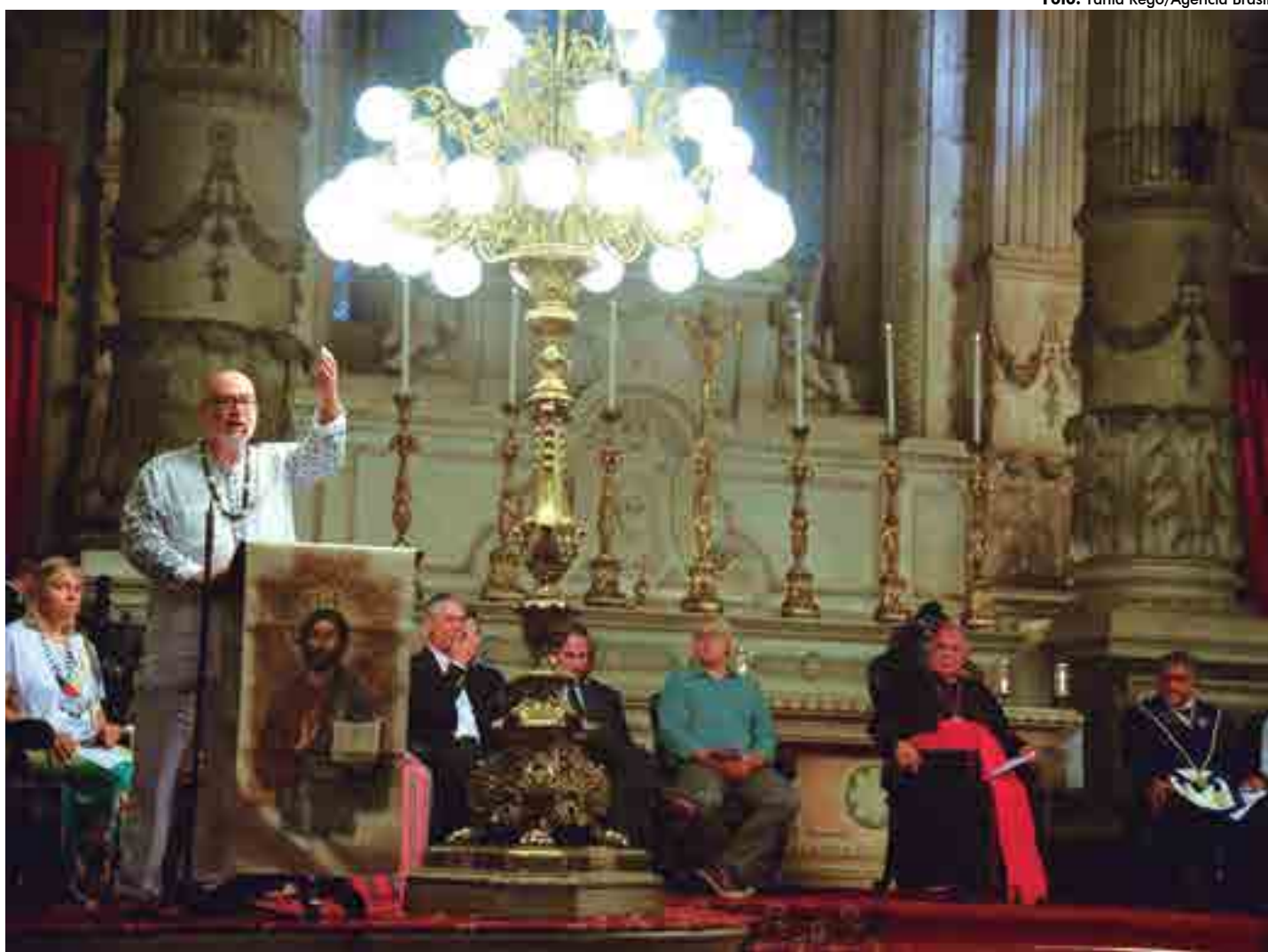
Embora organizada pela comunidade católica, a cerimônia recebeu representantes de diversas religiões, como as de matriz africana, muçulmana e judaica

"Foi uma mensagem de esperança para a gente. Todos se uniram e quem