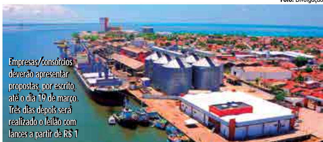
Empresas/consórcios deverão apresentar propostas, por escrito, até o dia 19 de março. Três dias depois será realizado o leilão com lances a partir de R$ 1