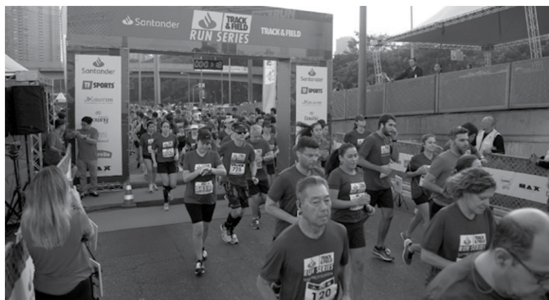
Às 6h será a largada dos 21km, enquanto que para os atletas de 5km e 10km as largadas acontecem às 6h30

O evento esportivo, que acontece há 16 anos, ganhou em 2018 ainda mais abrangência com o novo acordo entre Santander e TF Sports, que prevê a realização de aproximadamente 240 provas em diversas cidades do País. A inauguração da parceria aconteceu em maio de