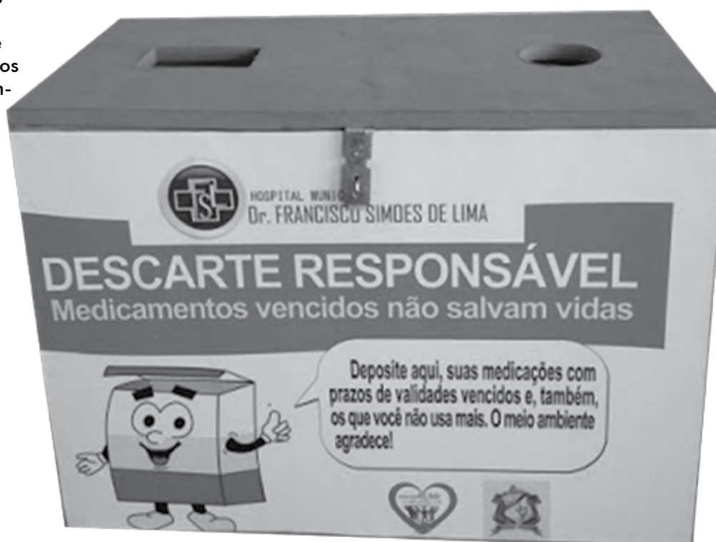
Descarte de remédios vencidos ou impróprios ao consumo pode ser feito nas drogarias e farmácias

■ Atendimento - Para informações ou denúncias, as pessoas podem entrar em contato com a Vigilância Sanitária através dos telefones 0800-281-4020 e 3214-7956.