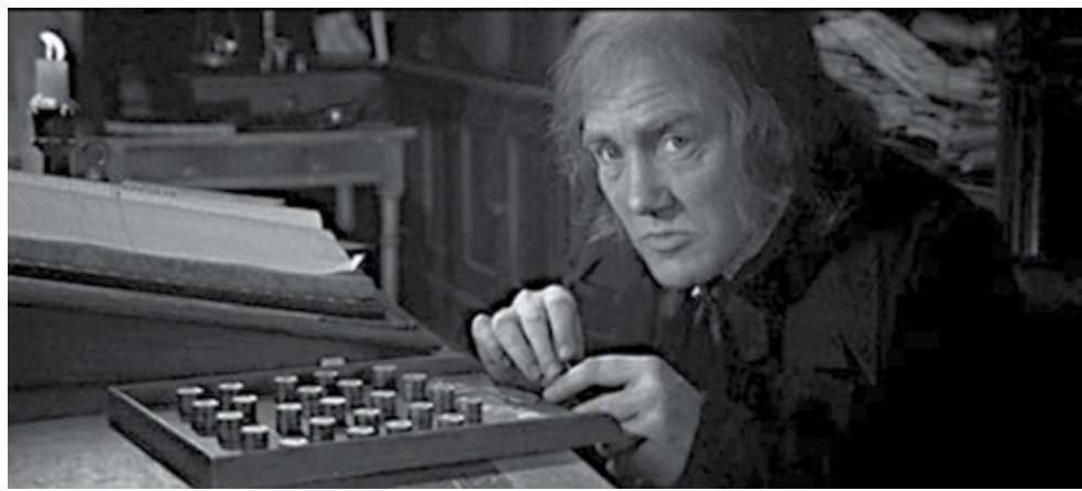
Ator inglês Albert Finney, de origem irlandesa, morreu aos 82 anos, semana passada, em Londres

Com mais de cinquenta filmes, cinco vezes indicado ao Oscar por seus inúmeros papéis de destaque em grandes obras do cinema, especialmente inglesas, embora nunca tenha ganhado a cobiçada estatueta, mas, vencedor de vários outros prêmios, em festivais de Berlim e Veneza, ele se destacou em personagens importantes, inclusive shakespearianos.