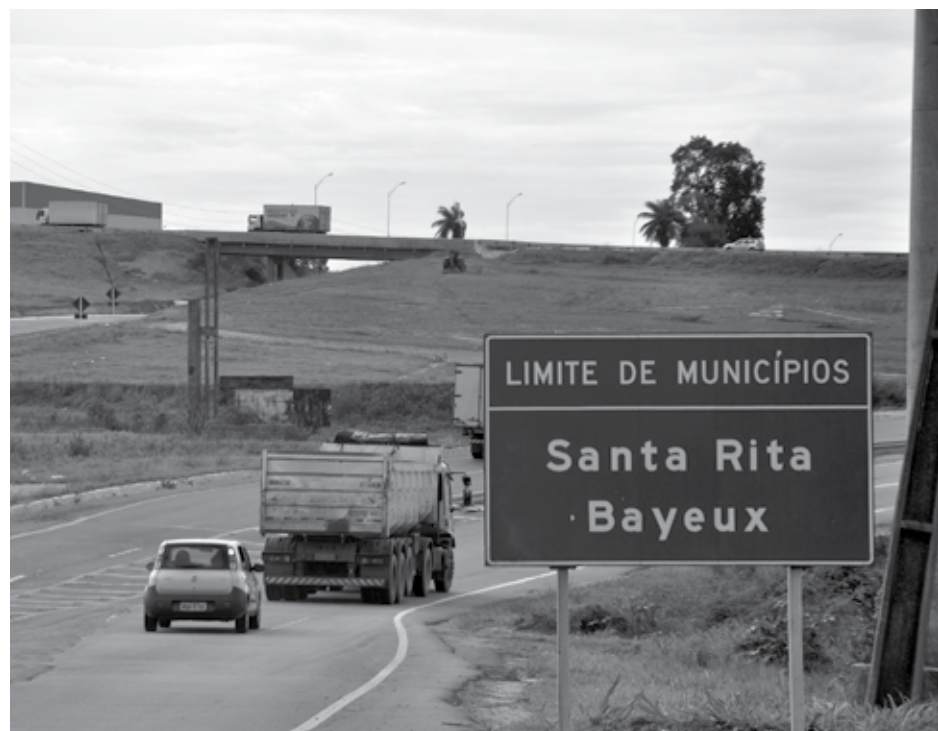
Processo teve apoio imprescindível do Governo do Estado e do Poder Legislativo paraibano

Conforme os estudos dos limites municipais, publicados na edição de 29 de dezembro de 2018, do Diário Oficial do Estado, como anexos à Lei 11.259, Monteiro, no Cariri paraibano foi confirmado como o maior município em área territorial do Estado da Paraíba, com 988,2 km² de área e um PIB de 449,3 milhões.