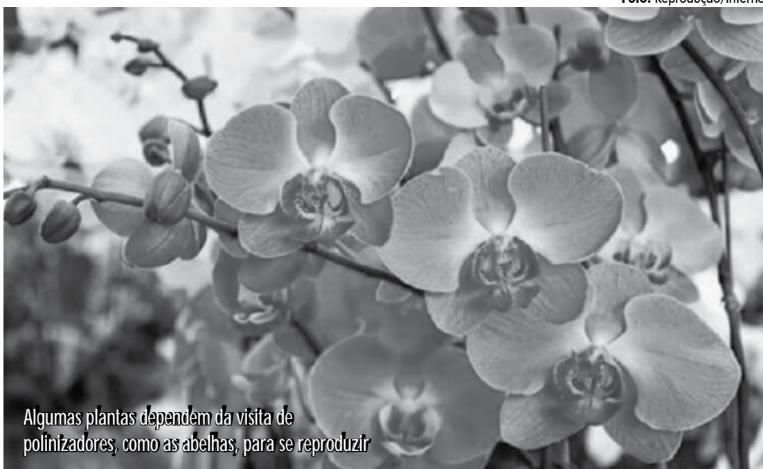
Algumas plantas dependem da visita de polinizadores, como as abelhas, para se reproduzir

O grupo de pesquisadores fez uma revisão sistemática de mais de 400 publicações de