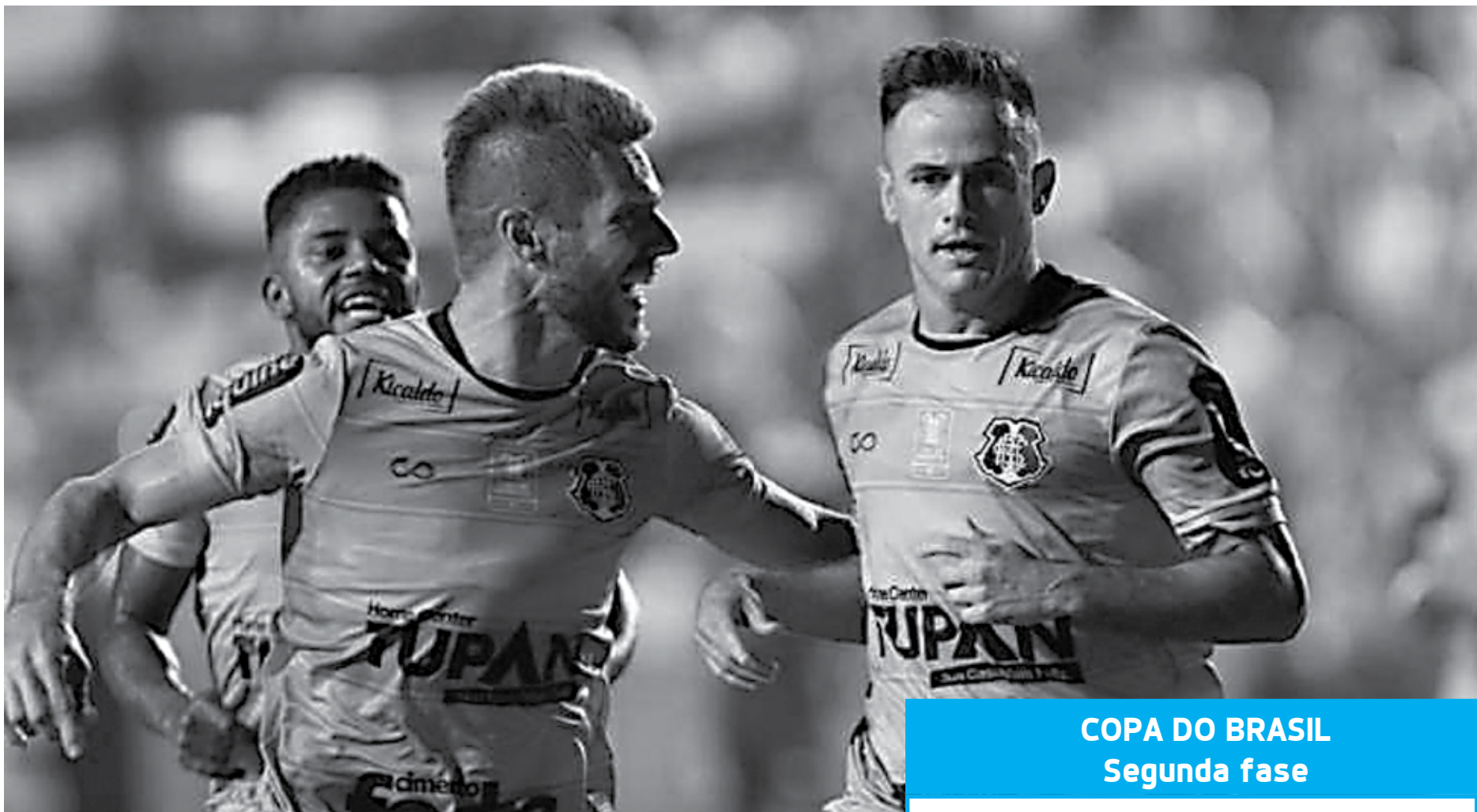
O Santa Cruz passou de fase e vai pegar o Náutico no clássico pernambucano pela segunda fase da Copa Brasil

Na 2ª fase com 40 clubes também será definida em duelo único. Em caso de empate, a decisão será nos pênaltis. Todas as outras fases, por outro lado, serão com jogos de ida e volta.