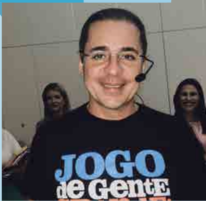
O criador do Método CIS e do Coaching Integral Sistemico