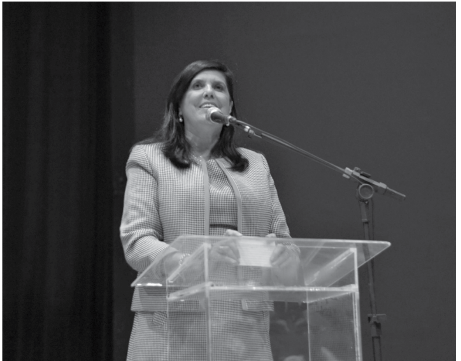
Evento consiste em firmar parcerias e buscar fortalecimento com os municípios de toda a Paraíba com a finalidade de implantar ações para melhorias

Em seguida, uma mesa-redonda foi realizada com os prefeitos dos municípios de Cabaceiras, Conde, São Bento e Rio Tinto. Na ocasião, foram discutidas propostas de fortalecimento e integração, além de experiências compartilhadas pelos prefeitos de ações e atividades do