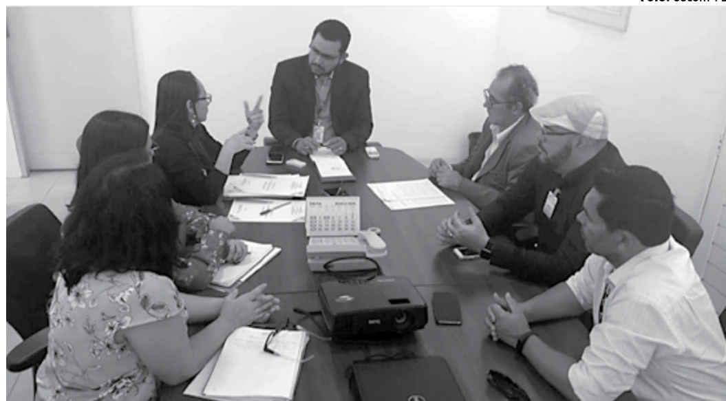
Proposta de cooperação técnica foi apresentada durante reunião com diretores da Fundac e da Cagepa

“As ações estratégicas de profissionalização no âmbito da Fundac se materializam por meio de parcerias com órgãos governamentais, como o Sine/PB, e não governamentais como CIEE, buscando levar os socioeducandos e egressos a possibilidade de uma nova inclusão social a partir da inclusão no mercado de trabalho, como também informações e encaminhamentos para a inscrição nos programas Jovem Aprendiz disponíveis no Estado” acrescentou a diretora técnica da Fundac.