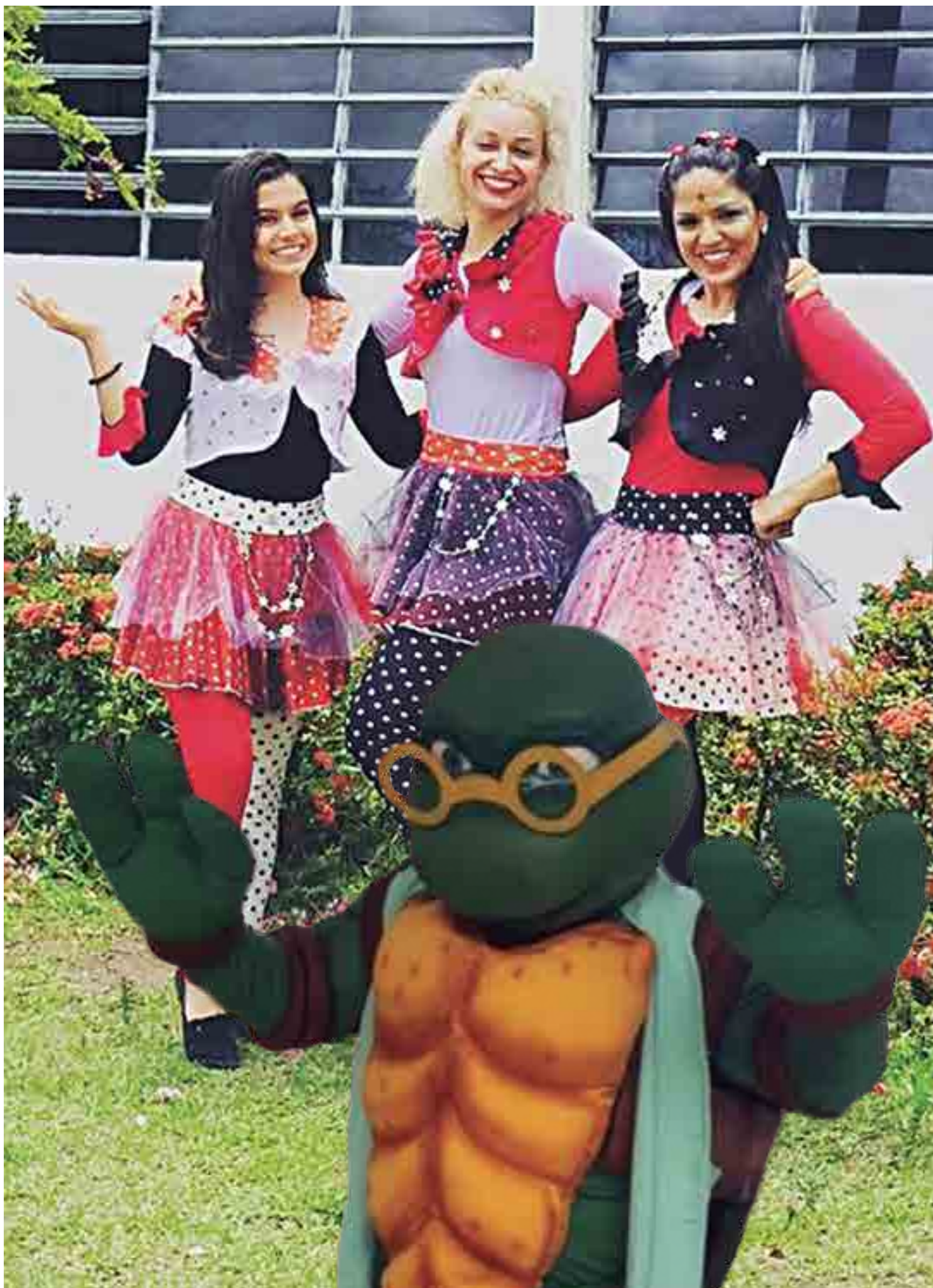
O grupo 'Contaço de Rua' lançou o disco 'Lendo o Brasil', em agosto passado e agora fará apresentações dentro do projeto Tartarugas do Bem

São professores, de acordo com o Contaço da Rua, que acompanham o trabalho do grupo na Internet, através do YouTube.