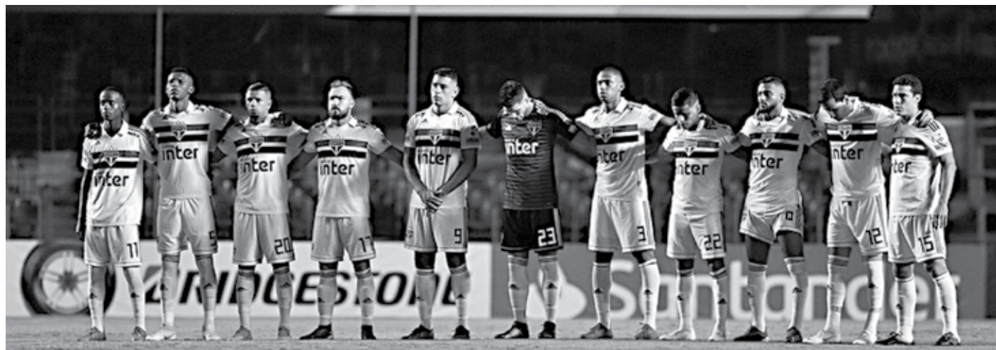
Jogadores do São Paulo na partida que culminou na eliminação na Libertadores. Este ano só ganhou 37% dos pontos até o momento na temporada