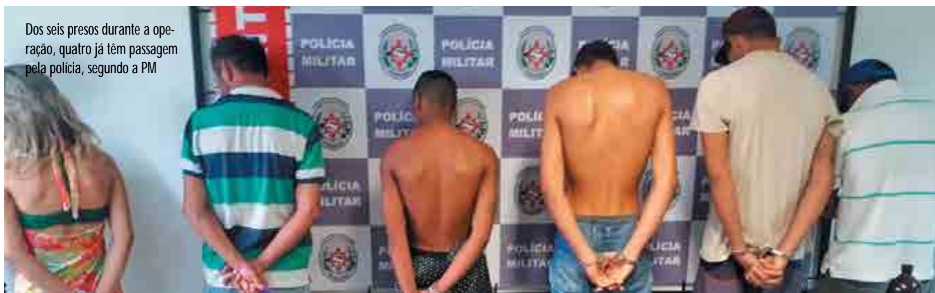
Dos seis presos durante a operação, quatro já têm passagem pela polícia, segundo a PM

A operação aconteceu nos bairros de Gramame, Valentina e Muçumago, que eram os pontos de apoio do bando. Dois dos quatro carros recuperados foram encontrados na areia da praia, em Gra-