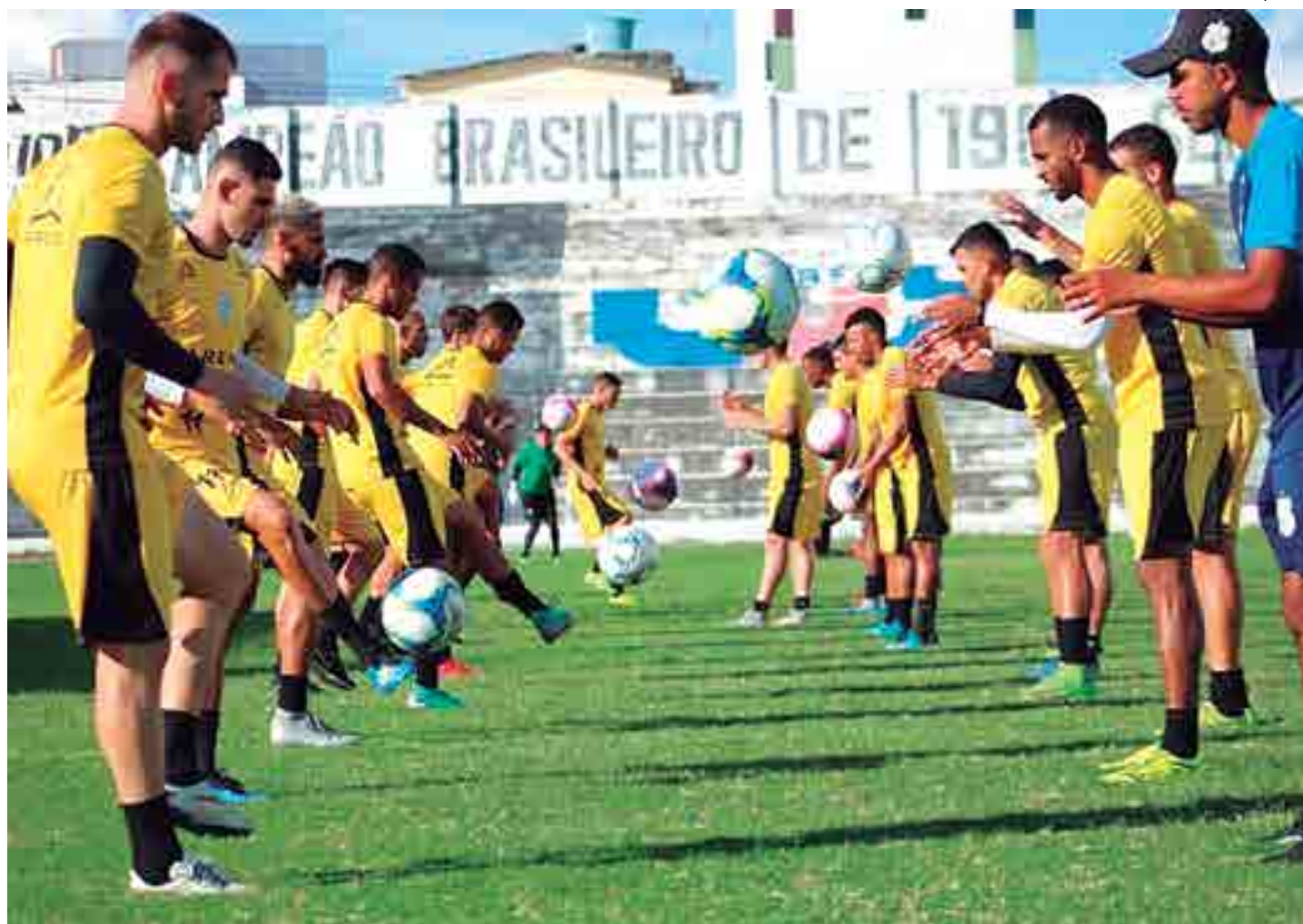
Time do Treze intensifica os treinos para dar a volta por cima e espantar a crise, no próximo domingo, com uma vitória sobre o Atlético, no Amigão