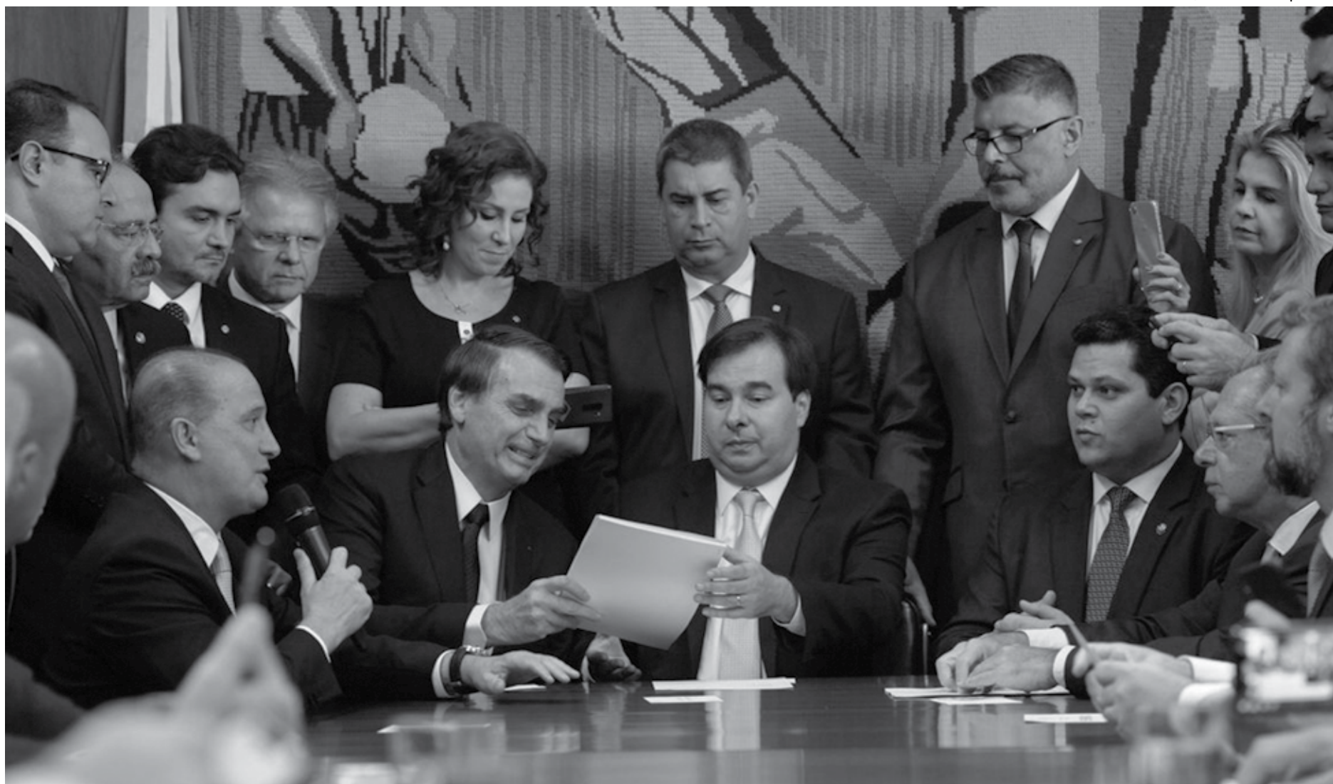
Acompanhado de ministros, Bolsonaro entregou a texto da reforma da Previdência ao presidente da Câmara dos Deputados, Rodrigo Maia, que deverá agilizar a votação na Casa

A idade mínima para a aposentadoria poderá su-