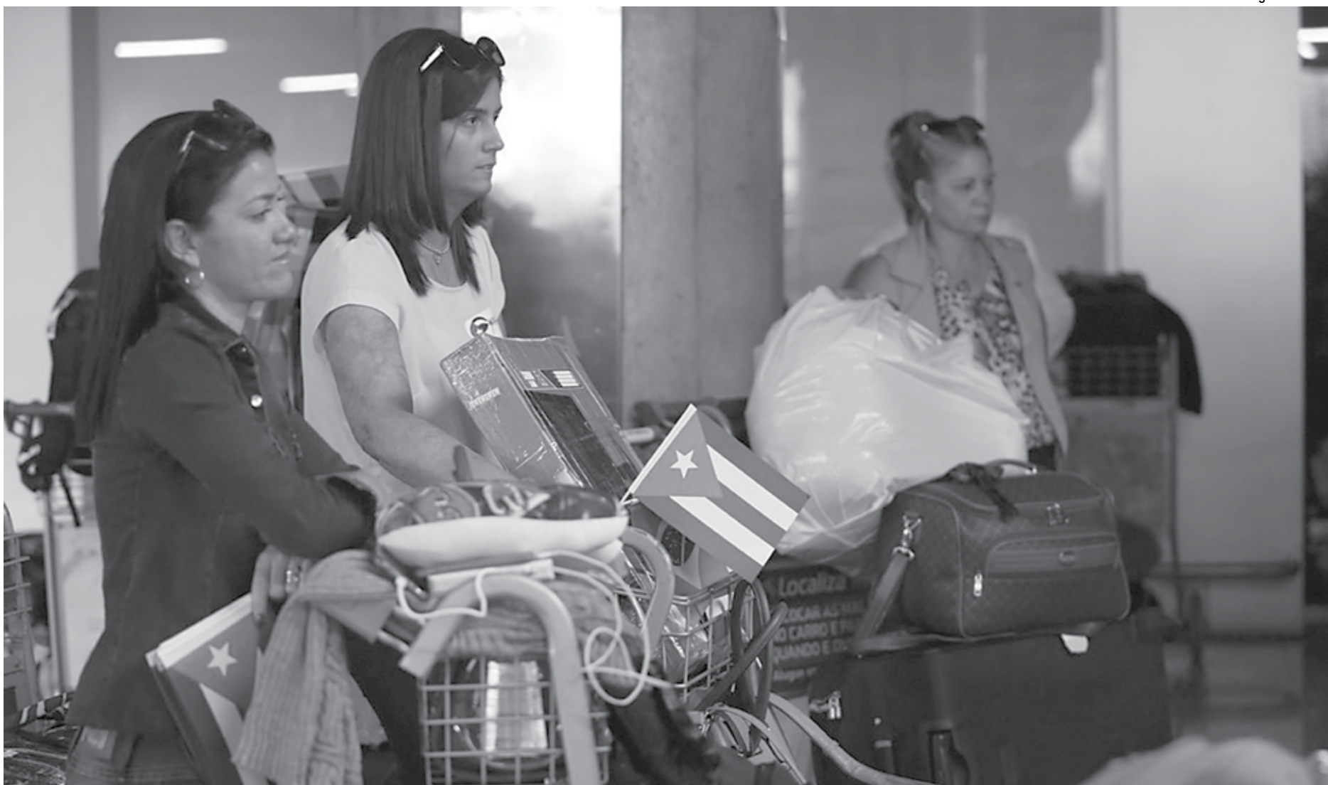
Depois que Cuba decidiu retirar seus profissionais do Brasil, o Ministério da Saúde abriu seleção com 8.517 vagas para que médicos com registro brasileiro pudessem ocupar os postos

Depois que Cuba decidiu retirar seus profissionais do Brasil, o Ministério da Saúde abriu seleção com 8.517 vagas para que médicos com registro brasileiro pudessem ocupar os postos, distribuídos em todo o país. Eles tiveram até 18 de dezembro para se apresentar às prefeituras. De acordo com a pasta, após o fim desse prazo, 2.549 postos de trabalho continuavam disponíveis, distribuídos em 1.197 municípios e 34 distritos de saúde indígena.