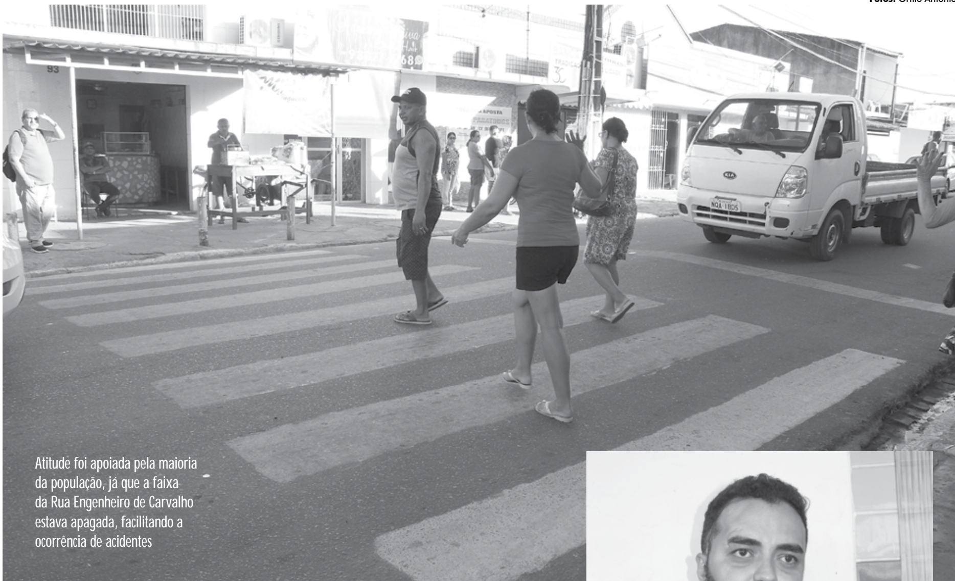
Atitude foi apoiada pela maioria da população, já que a faixa da Rua Engenheiro de Carvalho estava apagada, facilitando a ocorrência de acidentes

O grupo não pensou em pedir providências do Poder Público e após a pintura, não