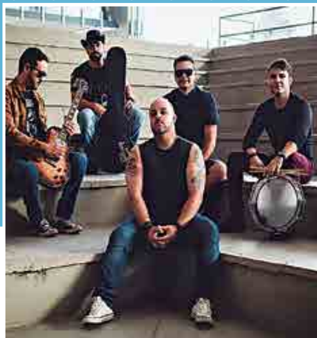
O grupo Retrohollics Classic Rock