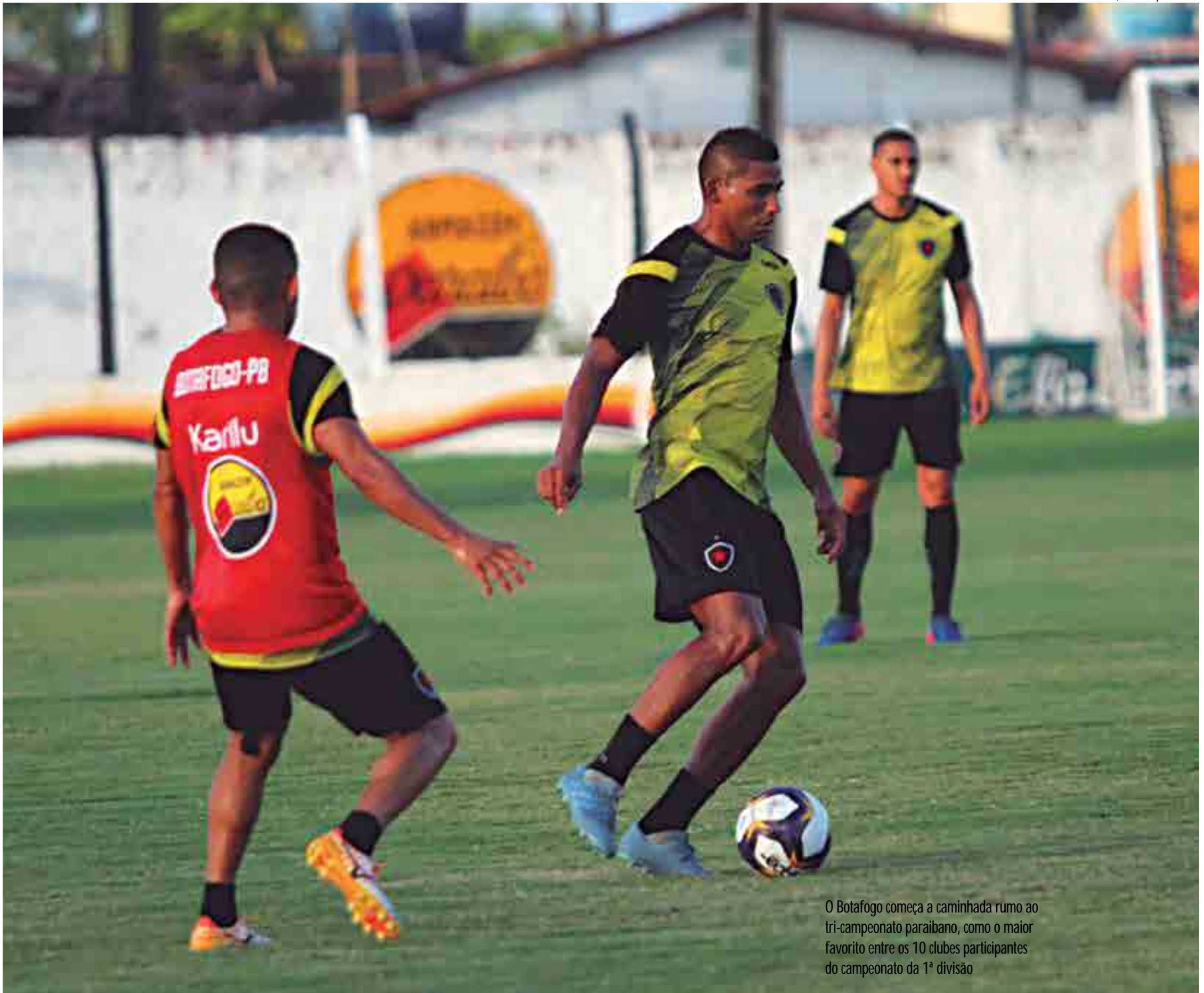
O Botafogo começa a caminhada rumo ao tri-campeonato paraibano, como o maior favorito entre os 10 clubes participantes do campeonato da 1ª divisão