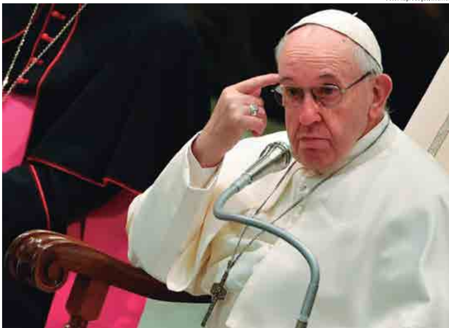
O escândalo sobre casos de pedofilia que abalou a Igreja Católica no Chile trouxe sérias consequências para o papa Francisco, que foi alvo de muitas críticas

O relatório de Scicluna tem 2,3 mil páginas e os depoimentos de 64 vítimas e familiares de pessoas afetadas por casos de pedofilia no país.