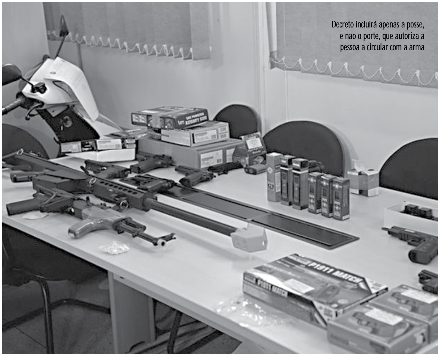
Decreto incluirá apenas a posse, e não o porte, que autoriza a pessoa a circular com a arma

A legislação é clara ao distinguir posse e porte de arma. A posse de arma de fogo, tratada no futuro decreto, permite ao cidadão ter a arma em casa ou no local de trabalho. O porte, que não será contemplado nesse decreto, diz respeito à circulação com arma de fogo fora de casa ou do trabalho.