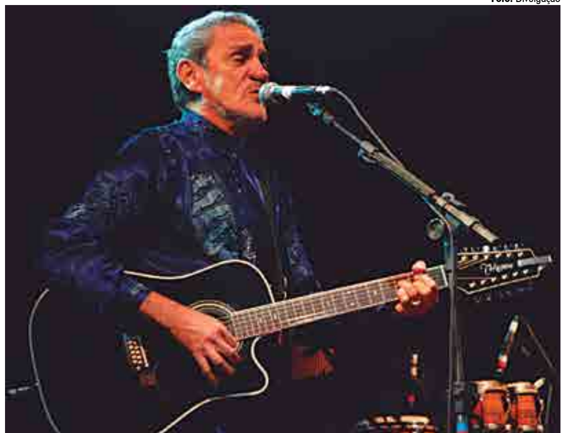
Paraibano nascido em Brejo do Cruz, no Sertão do Estado, é considerado um dos ícones da música brasileira

'Antologia Acústica' é seu maior êxito comercial até hoje, com aproximadamente dois milhões de cópias vendidas e vencedor do Prêmio Sharp como melhor projeto gráfico. Este disco deu início a uma trilogia que seguiu com Nação Nordestina, um mapeamento da história musical e política da sua região natal, indicado ao Grammy Latino de melhor álbum regional e, Estação Brasil, um passeio pelo cancionário nacional. Zé Ramalho ainda homenageou Raul Seixas, gravou seu primeiro CD ao vivo, lançou o inédito 'O gosto da Criação' e ainda convidou amigos para participar do CD e DVD Parceria dos Viajantes.