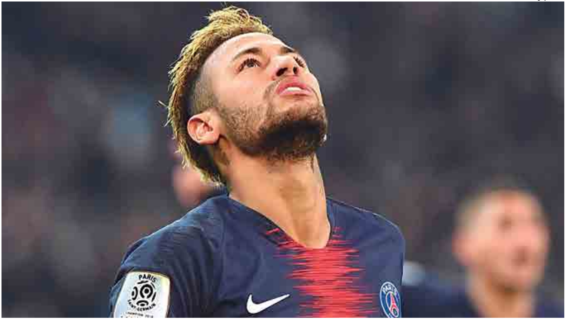
O atacante do PSG e da Seleção Brasileira tem usado também o pai para convencer os dirigentes do Barcelona por seu regresso. Retorno se complica devido a ação movida contra o time espanhol

Entretanto, um empecilho para a volta de Neymar ao Barcelona seria um proces-