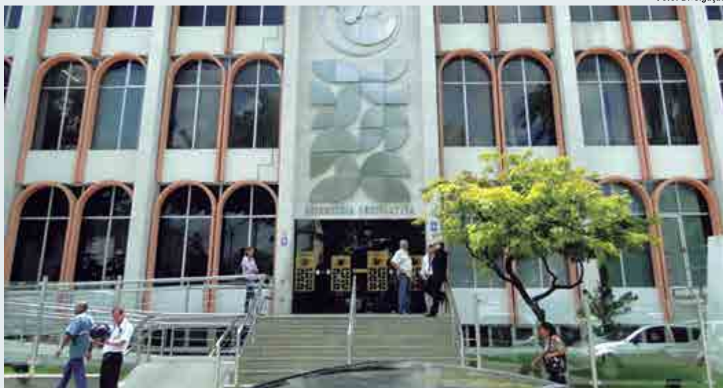
O presidente da Assembleia Legislativa da Paraíba, Gervásio Maia (PSB), também homologou resolução que reduz os cargos nos gabinetes em 20%