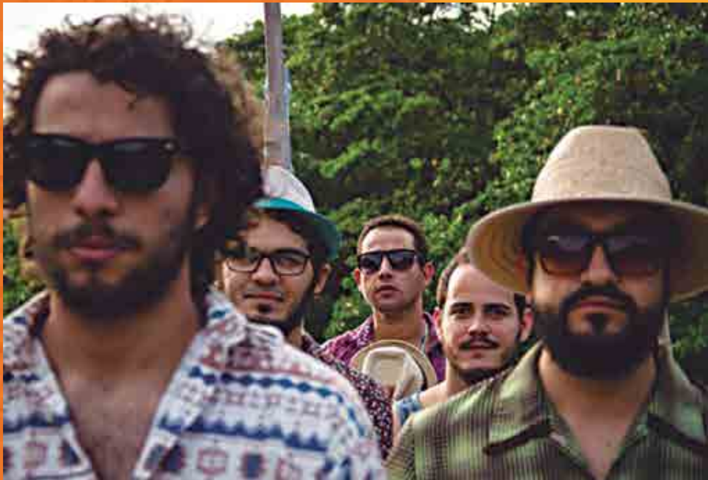
Banda Caburé lançará disco em abril e, na apresentação de hoje, mostra o novo single 'Capitu' ao vivo, que foi lançada na última quinta-feira (10)