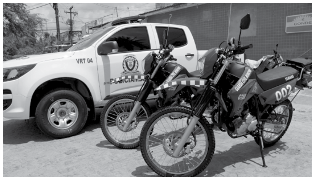
A prefeita Márcia Lucena destacou o trabalho que a Guarda Municipal desenvolve em toda a região