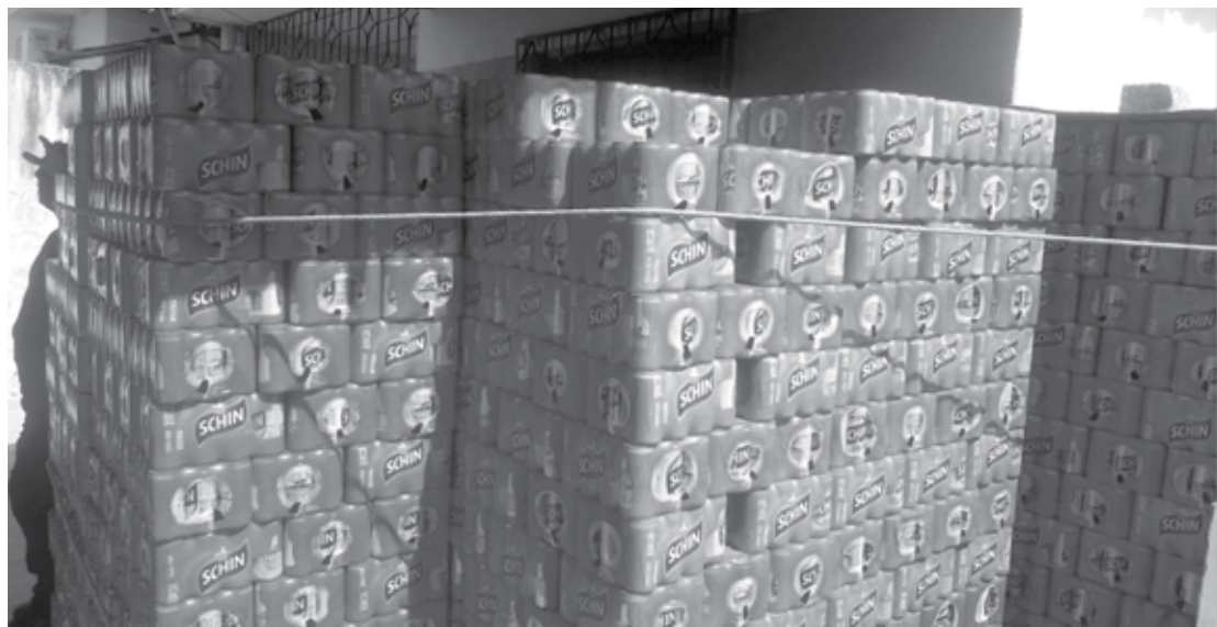
Foram repassadas 3.650 caixas de cervejas a um comerciante do bairro de Afogados, na cidade do Recife