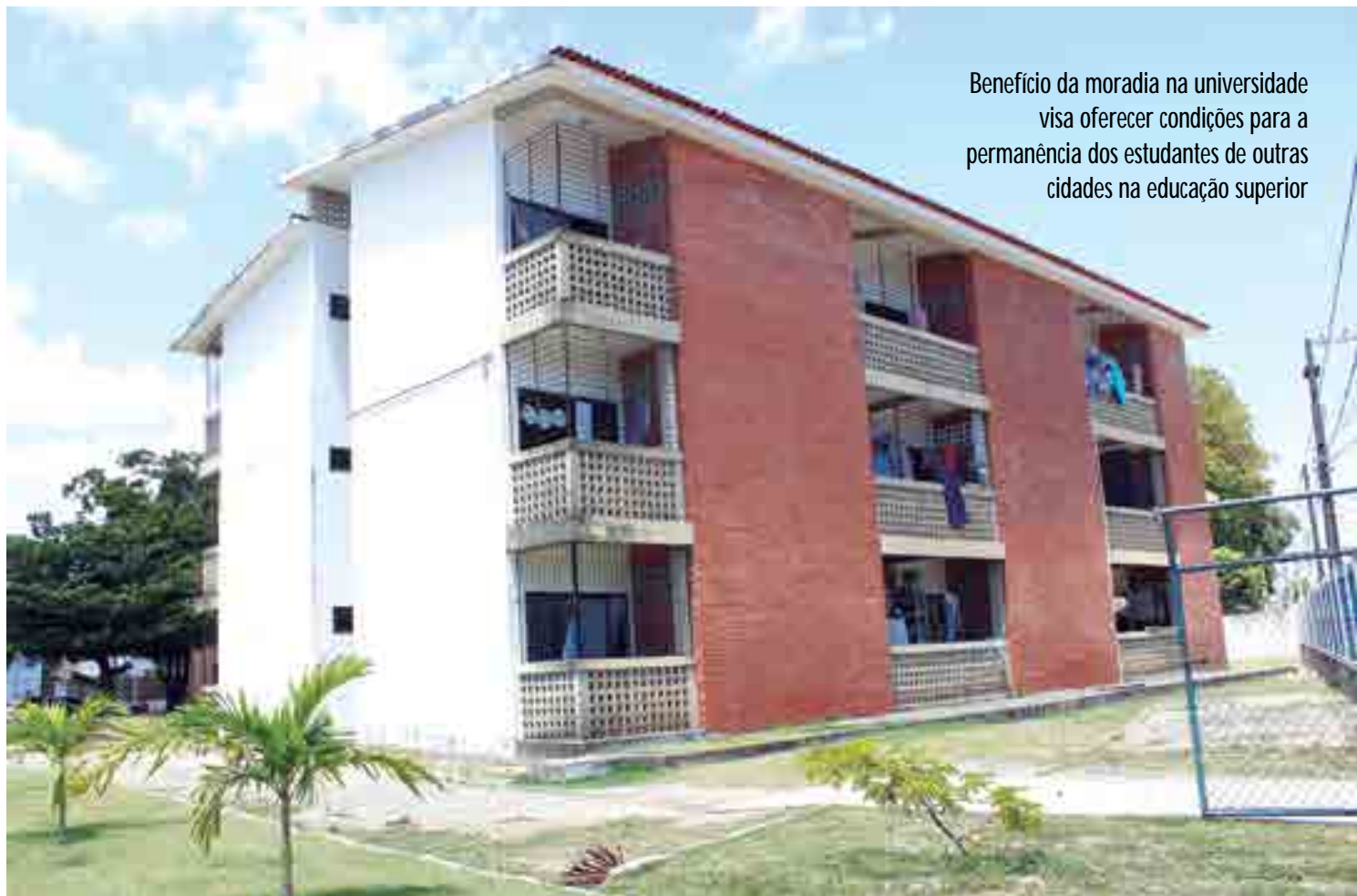
Benefício da moradia na universidade visa oferecer condições para a permanência dos estudantes de outras cidades na educação superior

“A minha estadia aqui faz parte de um projeto de vida. Enquanto eu estou aqui, eu procuro aliar minhas pesquisas a algumas referências que a casa me traz. Dentre várias pesquisas, a questão saúde é fundamental. Então se nós pensarmos a saúde do ponto de vista de estar na casa em relação ao nosso seio familiar, então nós temos uma ruptura, uma dificuldade, porque estamos longe dos familiares. Durante minha estadia aqui eu tive