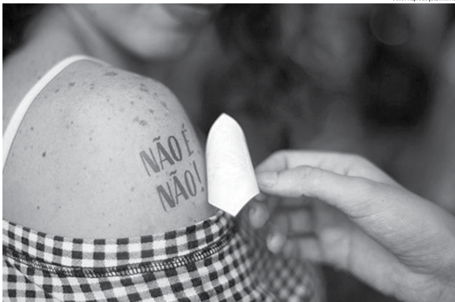
Tatuagens não permanentes Não é Não! serão distribuídas gratuitamente com mulheres nos eventos pré-carnavalescos e durante os dias de Carnaval