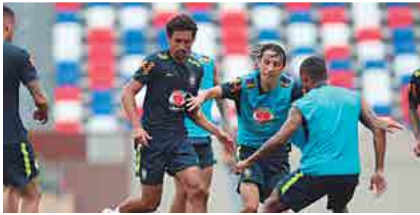
A Seleção Brasileira está no pote 1 com Uruguai e Argentina no sorteio de hoje no Rio