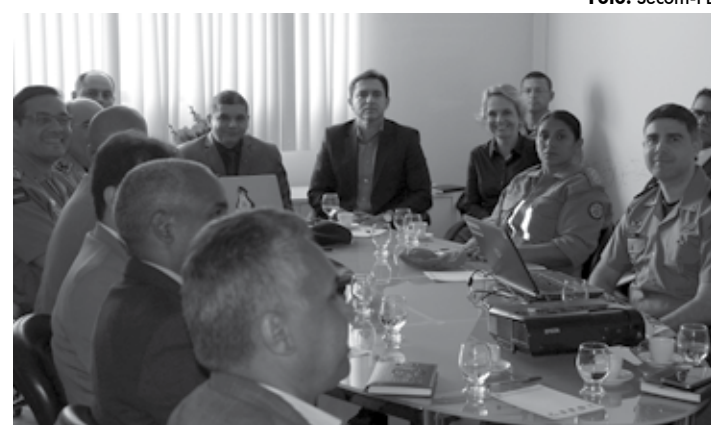
Secretário de Segurança, Jean Nunes, se reuniu com gestores da pasta

policiais e polícias de estados vizinhos, como Pernambuco, Rio Grande do Norte e Ceará. “Agiremos integrando a Polícia Civil e unidades especializadas da Polícia Militar - como Batalhão de Operações Especiais (Bope), Grupo de Operações Táticas Especiais (Gate), Grupo Especializado de Operações na Área de Caatinga (Gaosac), no Sertão - e também o trabalho de Inteligência Policial. Temos casos de sucesso com a coleta de material biológico em cenas de crime, como já acontece em Pernambuco, no Sudeste