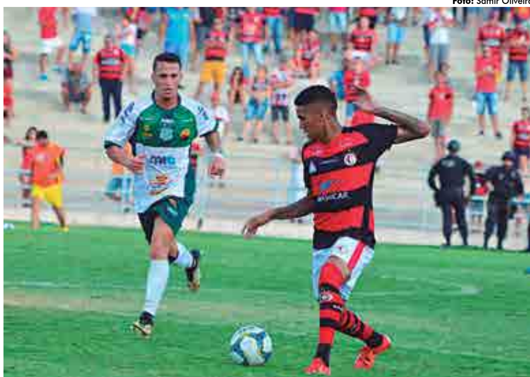
O Campinense vai enfrentar no próximo final de semana o Serrano no estádio Amigão com alguns desfalques

"O gramado tem as dimensões bem menores do que o do Amigão, e isso dificulta muito para encaixar a marcação num campo maior, onde sobra mais espaços. Mas, nosso campo está em reformas e nós temos que se adaptar a estas dificuldades e trabalhar forte para ser