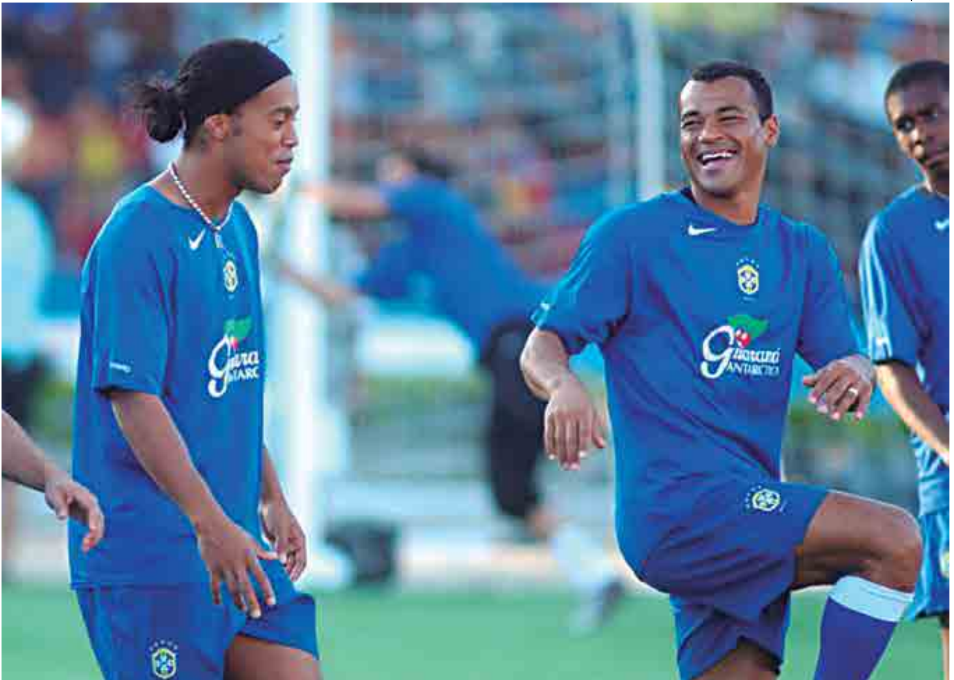
Ronaldinho Gaúcho e Cafu vão participar do sorteio da Copa América de 2019, que terá ainda outros convidados, como Zé Roberto, Zico, Diego Lugano, Romerito, Maturana, Zanetti e ainda Marta

O bicampeão Chile também estará representado no palco. Integrante da equipe nas conquistas de 2015 e 2016, Jean Beausejour, terá a honra de trazer ao palco o troféu Copa América, que estará novamente em disputa a partir de 14 de junho.