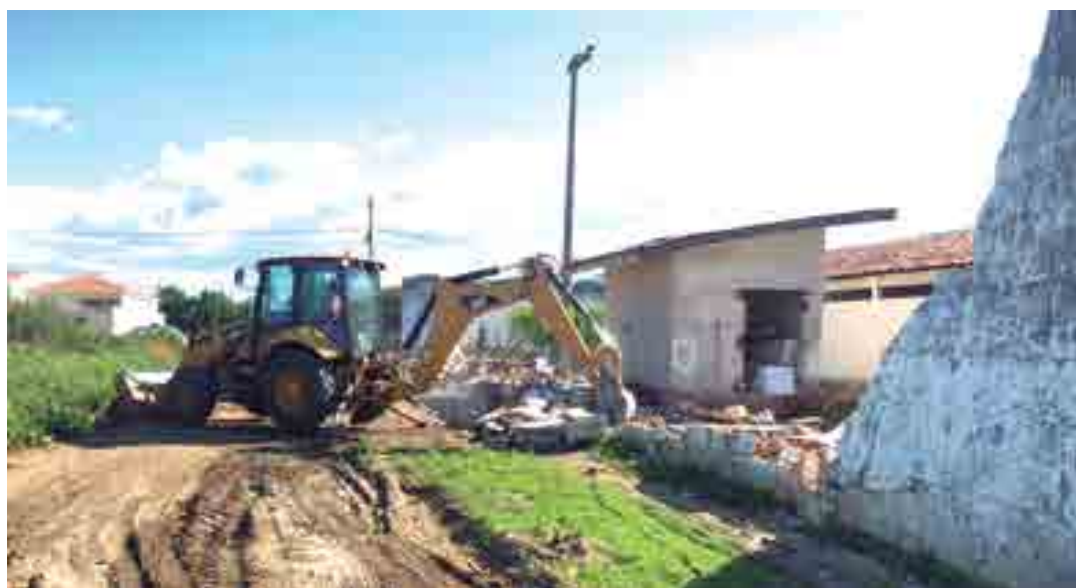
Além da reconstrução, será feito um reforço na parte do antigo muro que não foi comprometida com as chuvas

O Governo do Estado iniciou a recuperação de parte do muro do Centro Educacional do Adolescente (CEA), unidade socioeducativa da Fundação Desenvolvimento da Criança e do Adolescente “Alice de Almeida” – Fundac, que desmoronou na última quinta-feira (17), devido às fortes chuvas que caíram na cidade de Sousa.