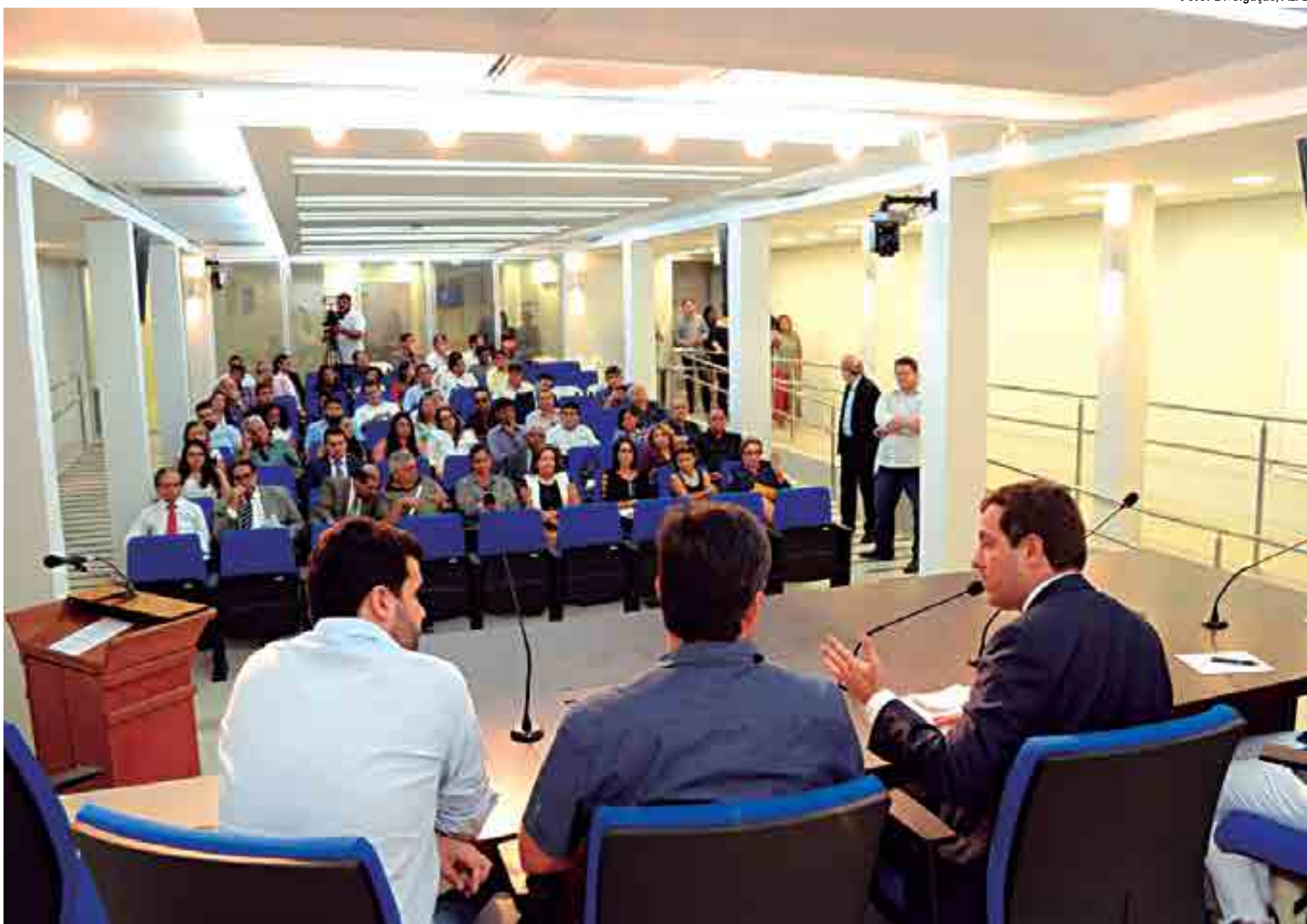
O encontro, que foi promovido pela secretaria legislativa, teve o intuito de apresentar aos parlamentares e assessores os sistemas internos da Assembleia e distribuição de verbas legislativas

Além de interiorizar a TV Assembleia, Gervásio Maia realizou obras que reestruturaram a comunicação da Casa