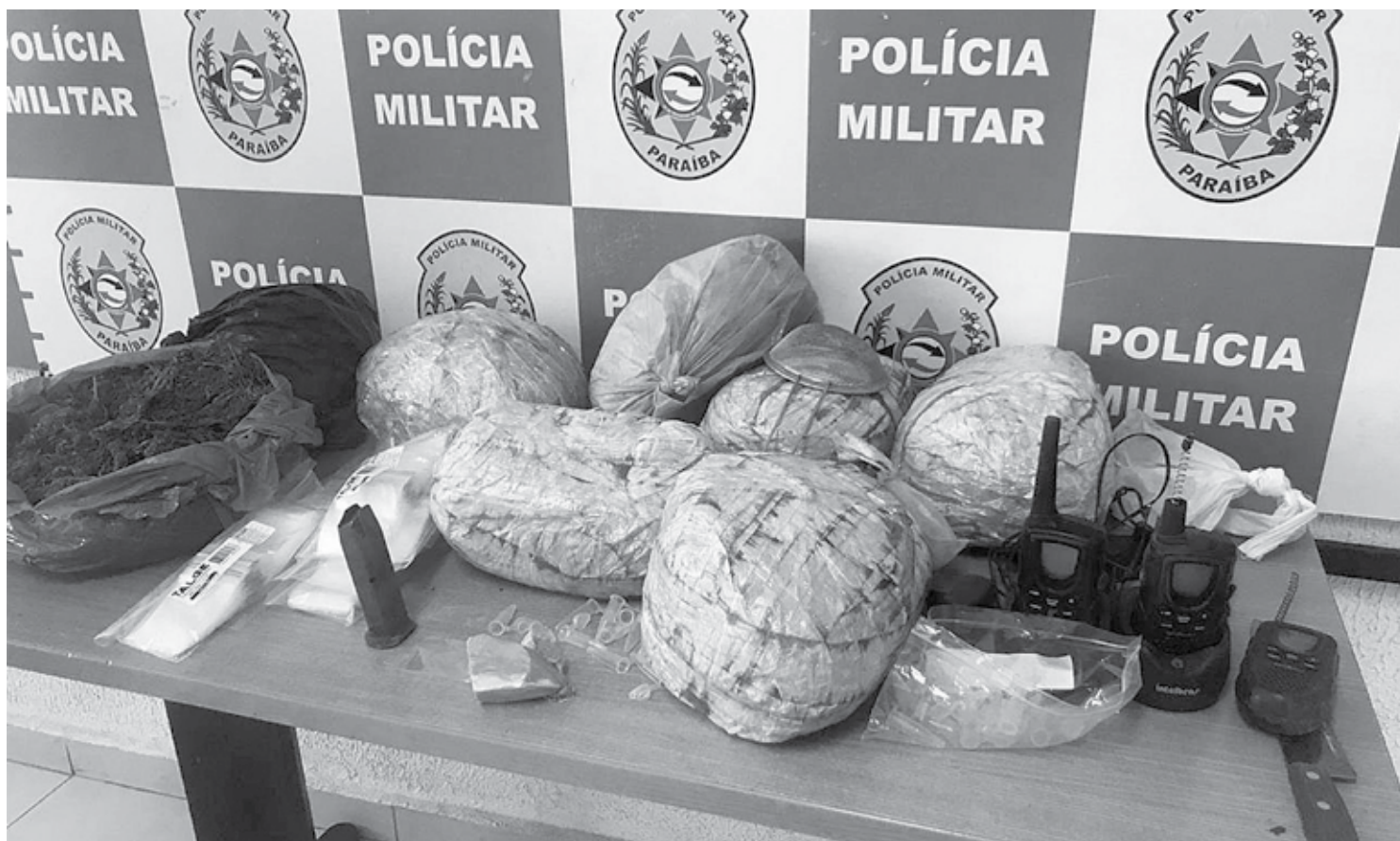
São vários sacos de maconha pronta para o consumo e comercialização embaladas com plásticos, uma pequena quantidade de cocaína e rádios comunicadores

O suspeito foi apresentado com todo o material apreendido na Central de Flagrantes, no Geisel. A droga ainda será pesada. O material encontrado com ele deve passar por perícia.