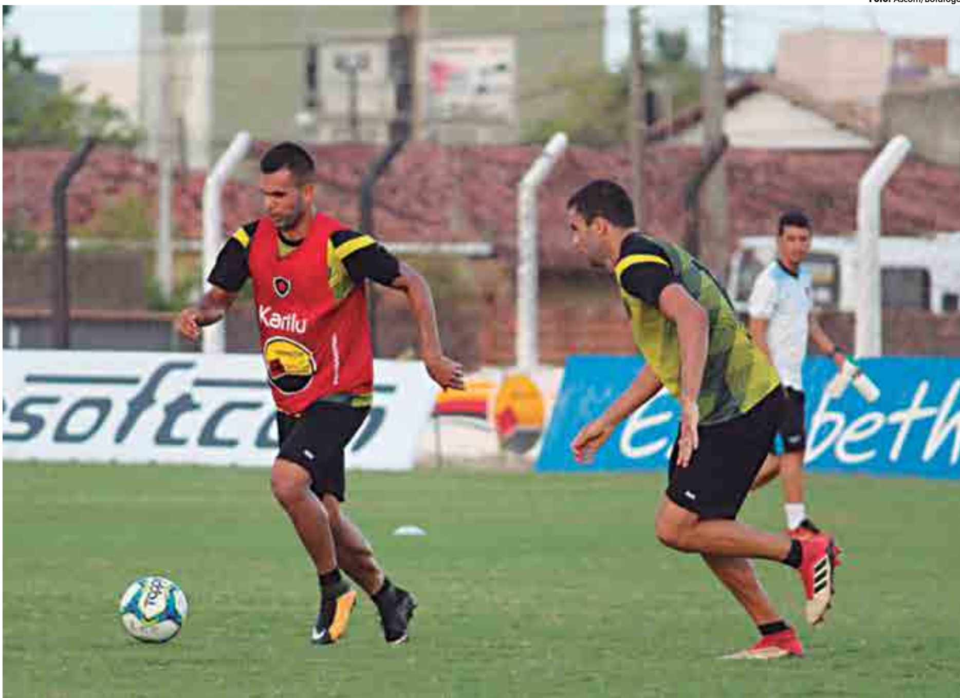
No final de semana, os atletas vão jogar no interior de Pernambuco contra o Salgueiro, voltam para atuar em Campina Grande diante do Campinense e depois pegam o Fortaleza em casa

Diante da sequência de jogos e viagens, o técnico Evaristo Piza está cumprindo com o que prometeu, fazendo um rodízio. "Nós estamos verificando, jogo após jogo, o desgaste dos atletas, e substituindo alguns em determinados jogos, para que eles descansem, evitando assim um problema muscular grave, que venha a tirar um jogador importante em um momento decisivo de alguma competição", disse o treinador.