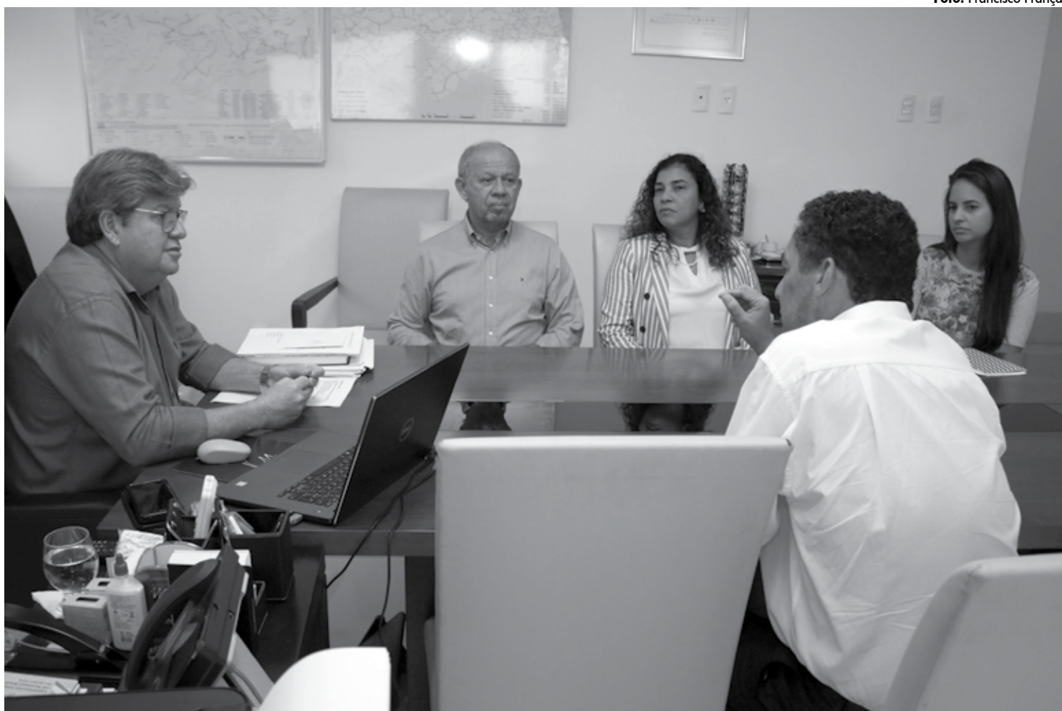
O governador ressaltou a importância do modelo de ensino para a educação e garantiu que esse é um caminho sem volta que resulta em avanços

Anúncios foram feitos durante reunião com representantes do Instituto de Corresponsabilidade pela Educação (ICE), do Instituto Qualidade do Ensino (IQE) e do Instituto Sonho Grande (ISG), que apoiam as ações