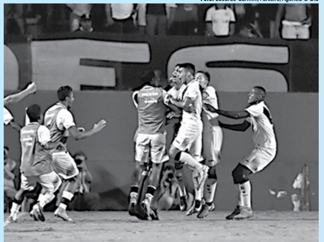
Jogadores do Vasco comemoram a classificação para a final da Copa SP após vitória nos pênaltis