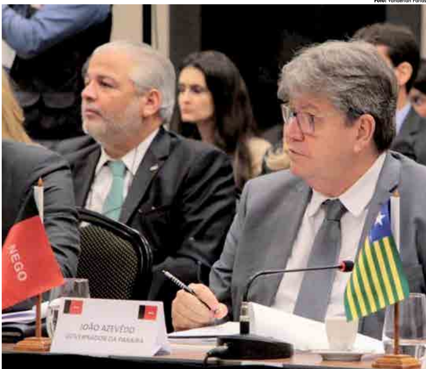
Para o governador da Paraíba, João Azevêdo, reunião de hoje só será interessante se houver espaço para equacionamento da dívida dos estados

Nessa reunião, o governador vai discutir e já ter noções de que emendas e qual a destinação que os deputados paraibanos estão planejando para a Paraíba, definições que serão formuladas e aprovadas na LDO. O Congresso Nacional deverá discutir e elaborar a LDO partir de setembro ou outubro com votação e aprovação prevista para novembro ou dezembro deste ano.