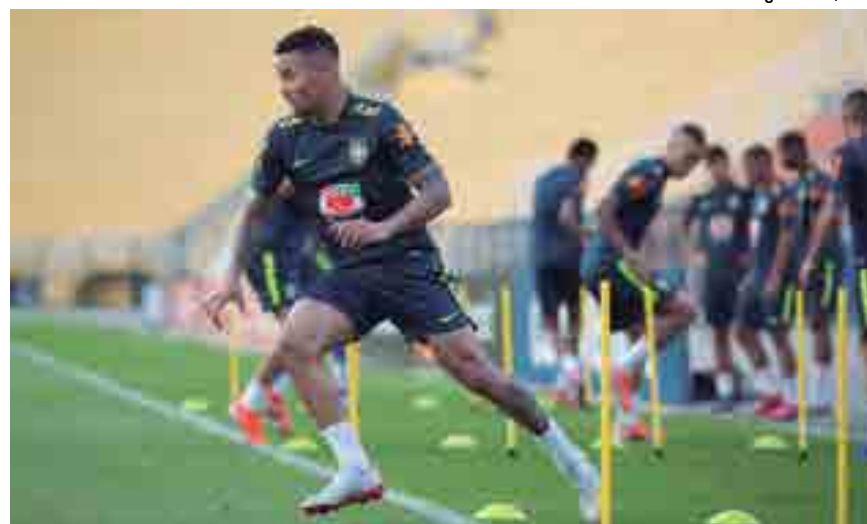
Gabriel Jesus treina com muita disposição para enfrentar a Argentina hoje no Mineirão

“Tratam-se de duas seleções gigantes. Por causa do momento e por jogar em casa, nós temos mais pressão para ganhar. Mas a Argentina também precisa muito vencer. Não acredito que