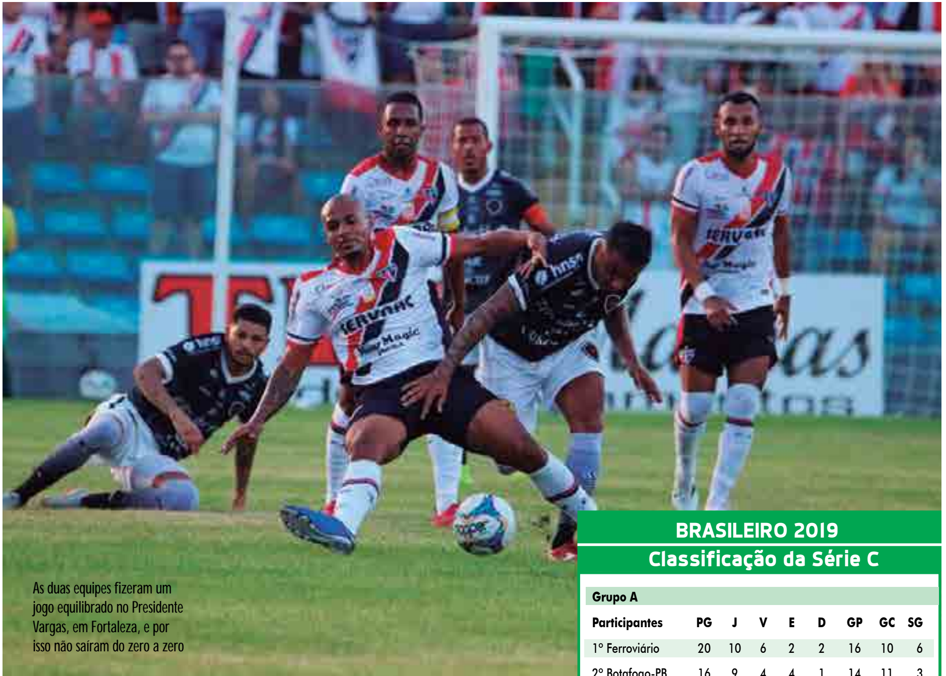
As duas equipes fizeram um jogo equilibrado no Presidente Vargas, em Fortaleza, e por isso não saíram do zero a zero

"A gente sabia que ia ser um jogo difícil. Foi uma entrega muito boa da equipe, que jogou com muita determinação. Foi um ponto importante porque nos deixa no G-4. Temos que manter essa entrega e essa