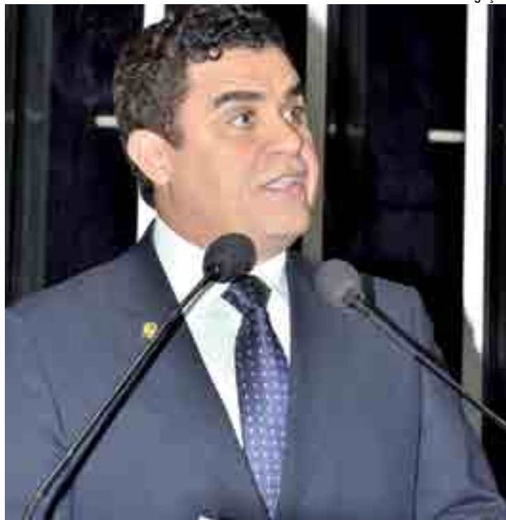
Deputado Federal Wilson Santiago (PTB): “Continuarmos crescendo em 2019”