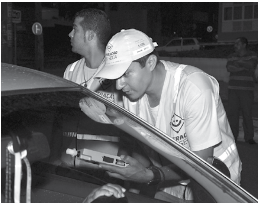
Ação é resultado da parceria entre o Detran e a Polícia Militar da Paraíba

Intensificada durante as festas juninas, a Operação Lei Seca registrou 47 autuações de condutores por embriaguez, no mês passado. O maior índice aconteceu no entorno do Parque do Povo, nos festejos do Maior São João do Mundo, em Campina Grande. As blitzes contaram com o apoio da Polícia Militar.