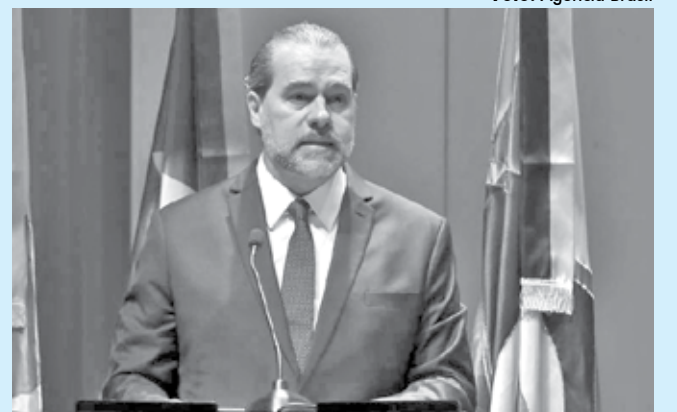
Toffoli fez uma avaliação sobre as manifestação do fim de semana