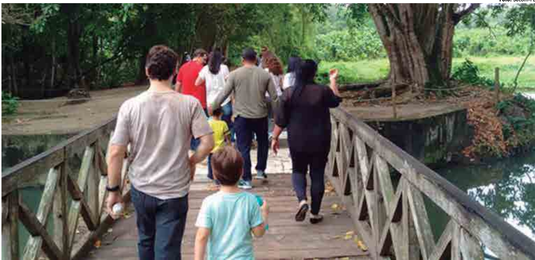
Jardim Botânico Benjamin Maranhão oferece uma programação permanente, de terça a sábado, com a realização de trilhas gratuitas para crianças e adultos pela manhã e à tarde

Na Estação Cabo Branco, no Altiplano, há atividades recreativas neste período de férias, a partir de hoje, na Sala de Práticas Educacionais