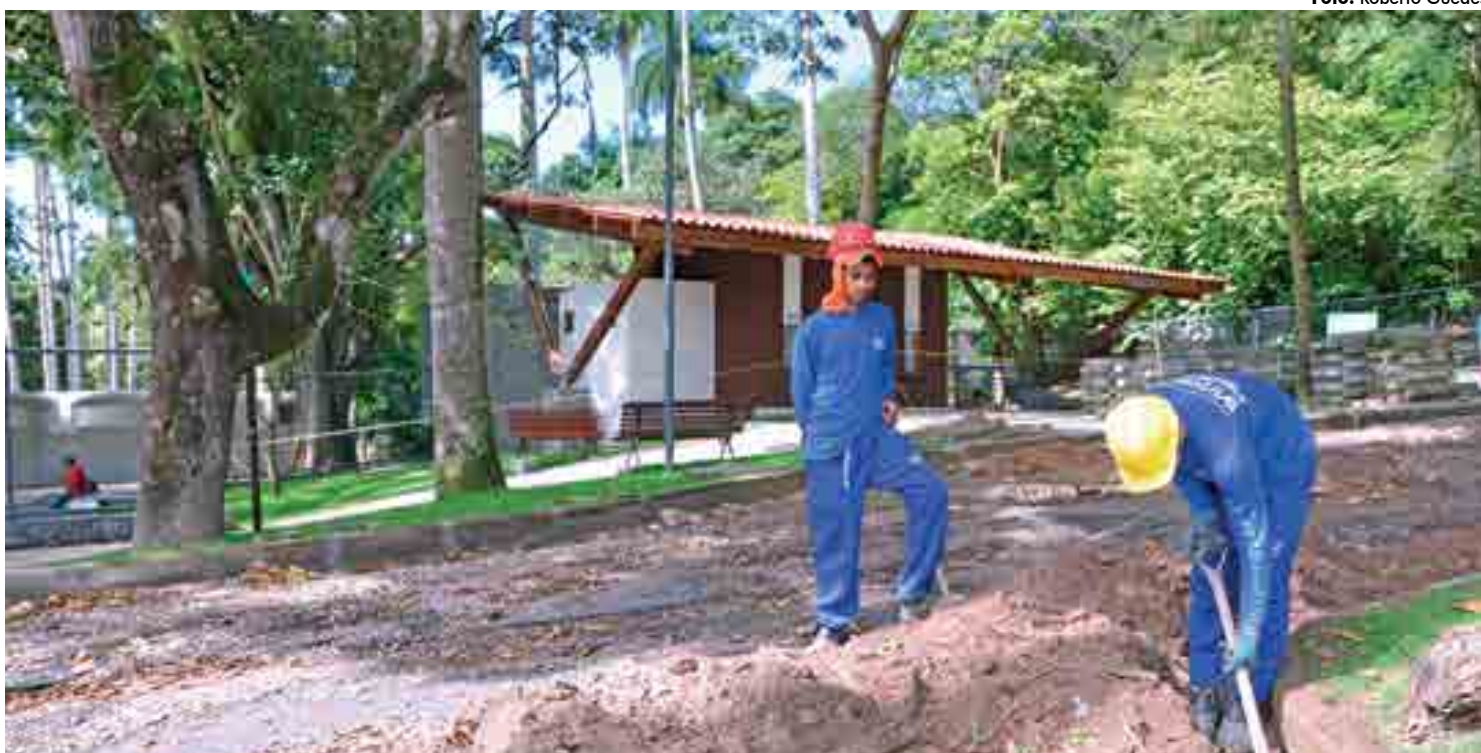
As obras realizadas pela Prefeitura estão em fase final, segundo a assessoria. O atraso teria ocorrido, principalmente, por conta das fortes chuvas de junho

A assessoria de imprensa do parque informou que as fortes chuvas do mês de junho atrapalharam o andamen-