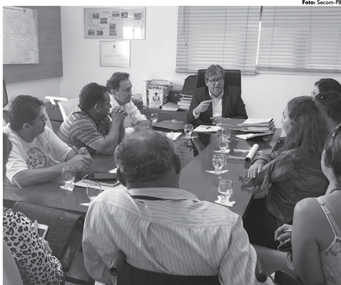
O governador João Azevêdo discutiu com entidades a elaboração de um programa voltado à política habitacional no Estado

O secretário da Infraestrutura, dos Recursos Hídricos e do Meio Ambiente, Deusdete Queiroga, também participou da reunião.