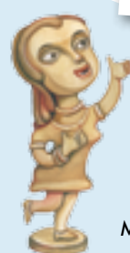
MADAME DE STAËL

★ CASA NOVA - Um seleto grupo de clientes, parceiros e corretores de imóveis poderá conferir com exclusividade o apartamento decorado e todos os diferenciais exclusivos do Torre da Lapa nos meses de julho e agosto. O empreendimento é o mais novo da Construtora SC Global, empresa portuguesa com nove anos de atuação no mercado da construção civil em João Pessoa.