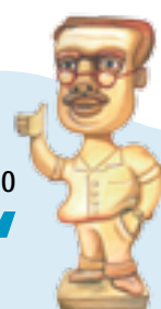
PETER BRIAN MEDAWAR

/// Se a política é a arte do possível, a pesquisa é seguramente a arte do solúvel. Ambos são assuntos imensamente práticos ///