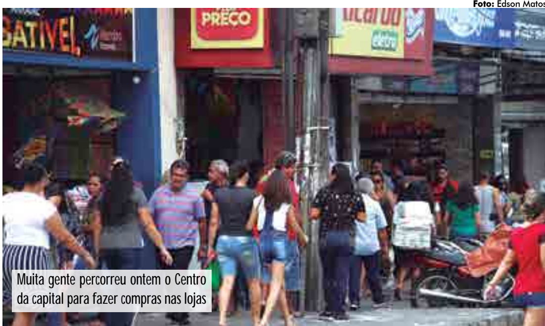
Muita gente percorreu ontem o Centro da capital para fazer compras nas lojas