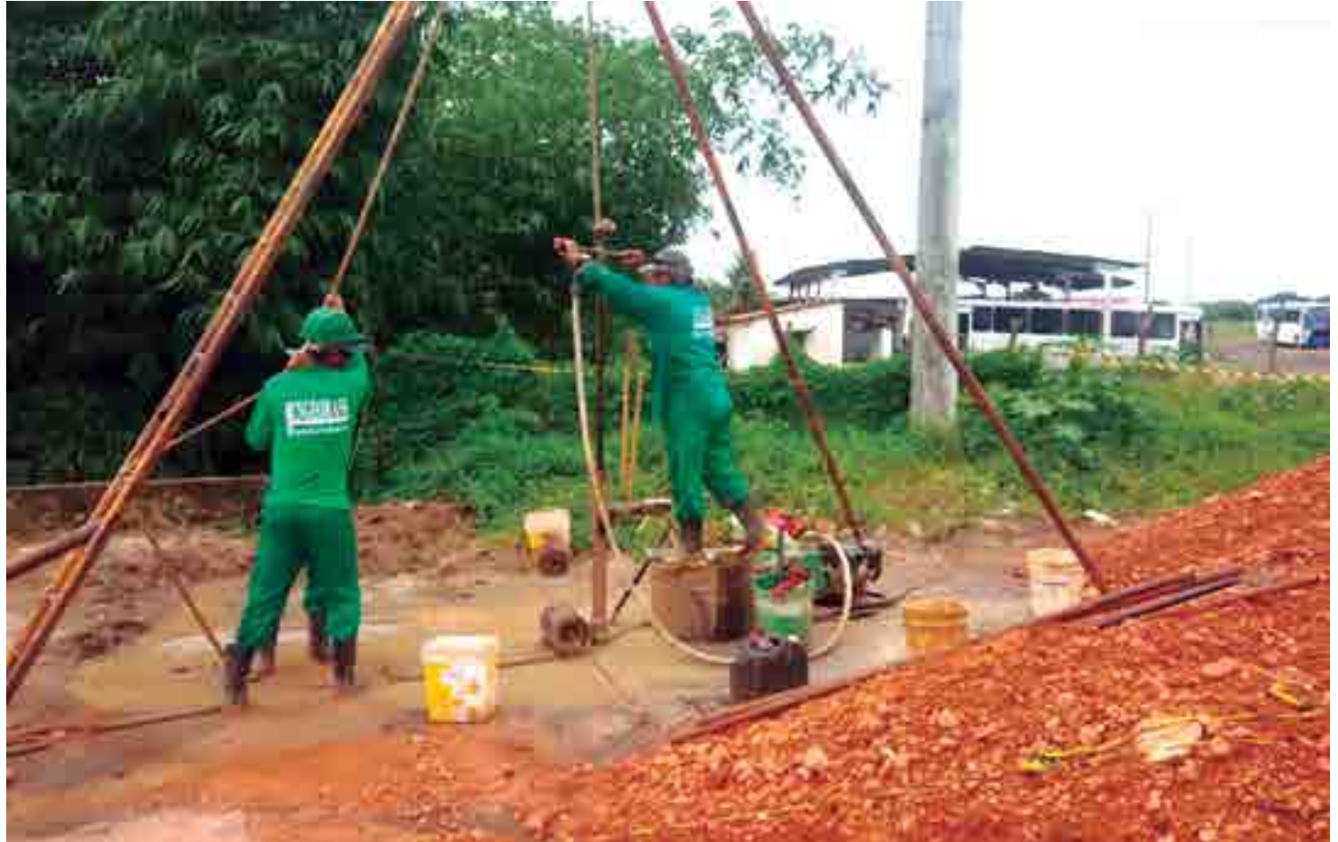
Os técnicos orientaram operários nos trabalhos de sondagem do solo na rodovia PB-004, onde será construída a nova ponte ligando Santa Rita a Cruz do Espírito Santo e Sapé