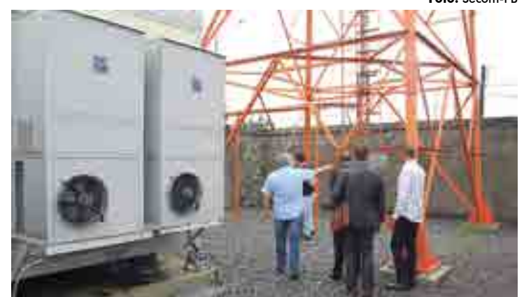
Servidores de Tocantins estiveram na torre de radiocomunicação da Seds

Na oportunidade, os representantes da Secretaria da Segurança Pública de Tocantins estiveram na torre de radiocomunicação instalada na estrutura da Seds. "No Fórum de Secretários a Paraíba foi identificada como um Case para a solução de comunicação e nós no Estado do Tocantins, a Segurança Pública, temos interesse de adquirir uma solução integrada e por este motivo estamos aqui para conhecer a solução e ver como