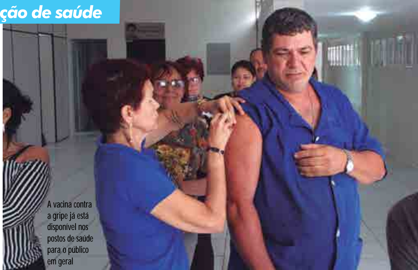
A vacina contra a gripe já está disponível nos postos de saúde para o público em geral