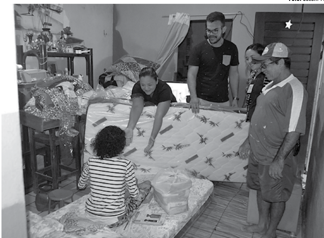
Sedh já realizou a entrega de cestas básicas, cobertores e colchões em 12 comunidades de João Pessoa e de Cabedelo

Para atendimento das demandas iniciais a Sedh já realizou a entrega de cestas básicas, cobertores e colchões para os moradores das comunidades São José, São Rafael, Comunidade Castelhinho, Padre Hildon Bandeira, Três Lagoas, na capital paraibana, e das comunidades Portelinha, Bairro 13, Portal do Poço, Oceania, Renascer,