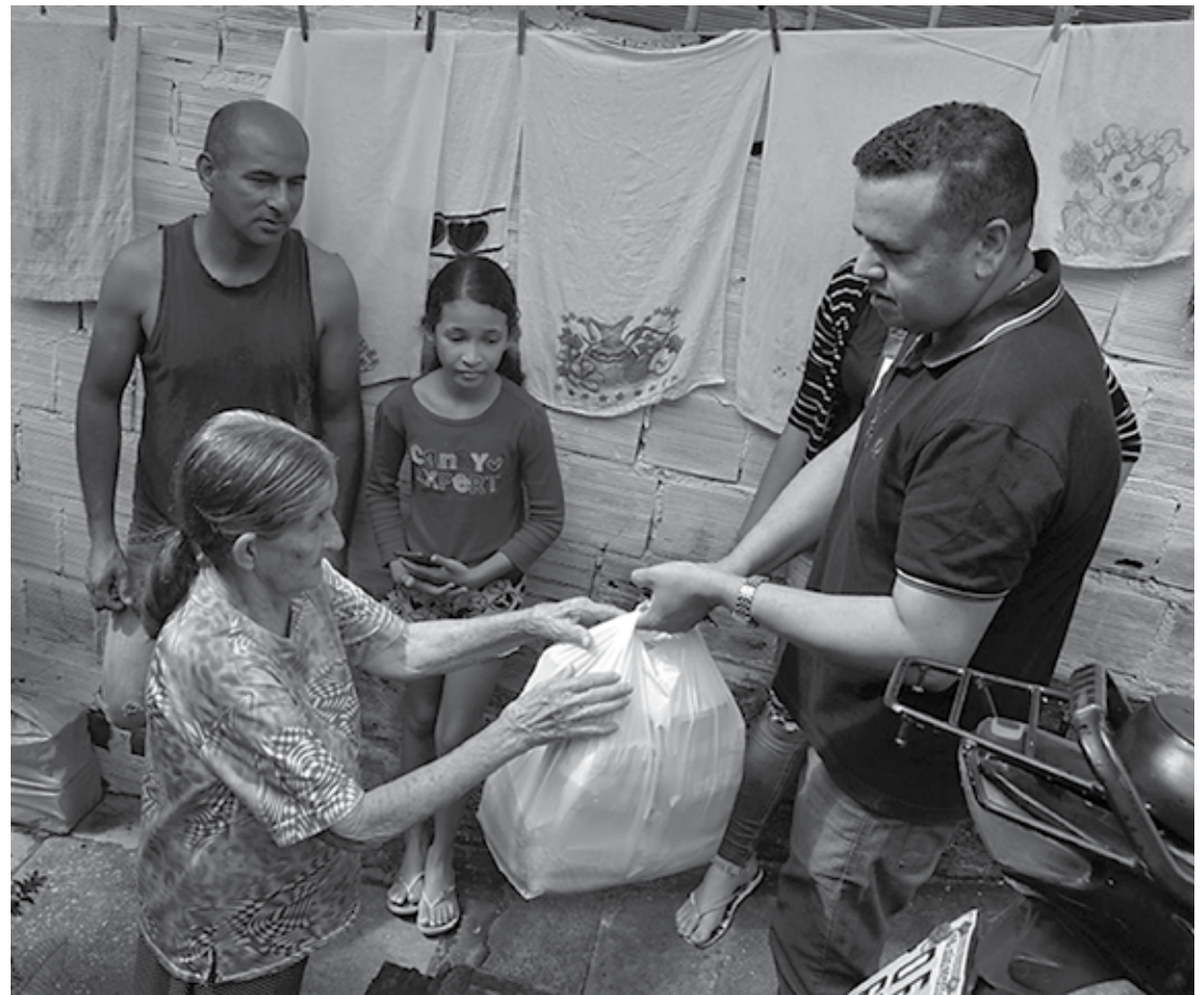
Desde a última quinta-feira, a Secretaria de Estado do Desenvolvimento Humano vem visitando as famílias atingidas pelas chuvas e realizando um levantamento das principais necessidades; equipe elaborou um plano emergencial para atendimento dos moradores