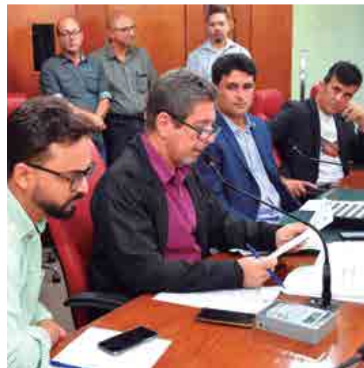
Falta de quórum e muita arenga adiaram votações na Câmara da capital