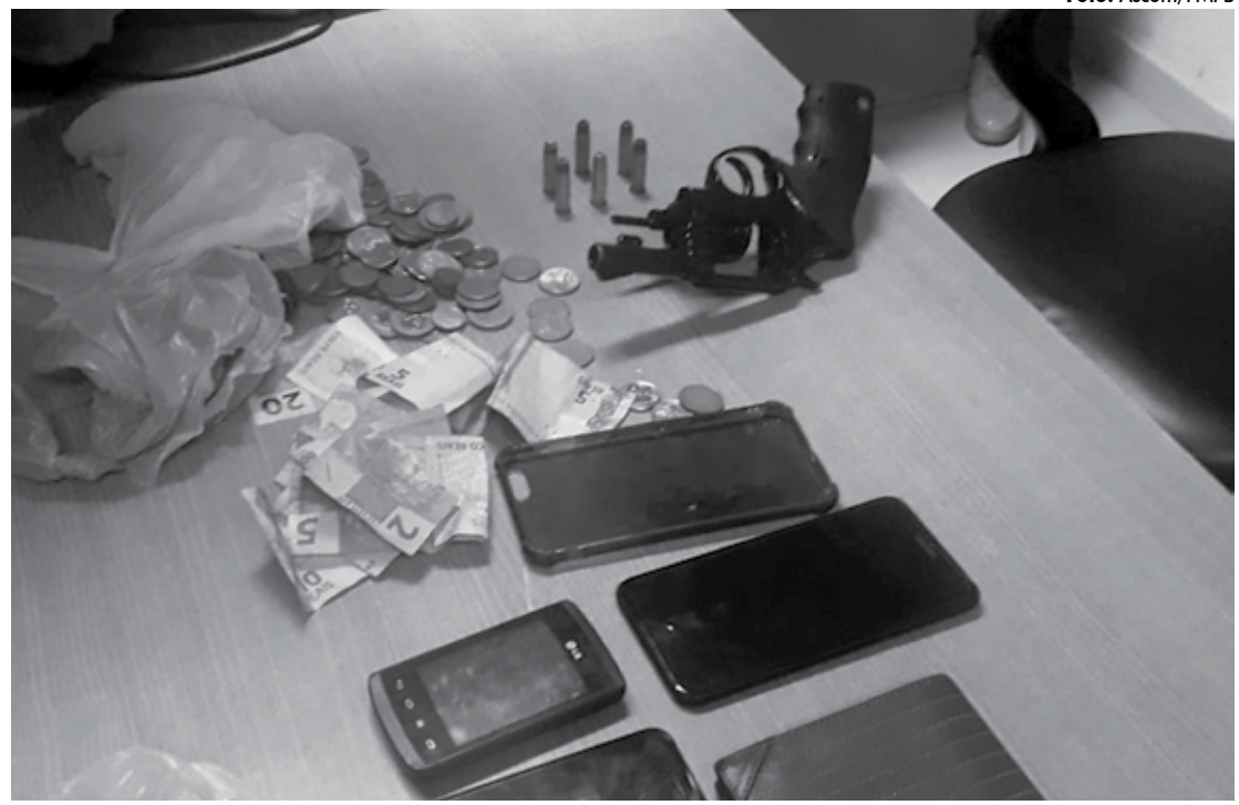
Suspeito foi localizado após polícia rastrear o celular de uma pessoa vítima do assalto no restaurante, no Bessa