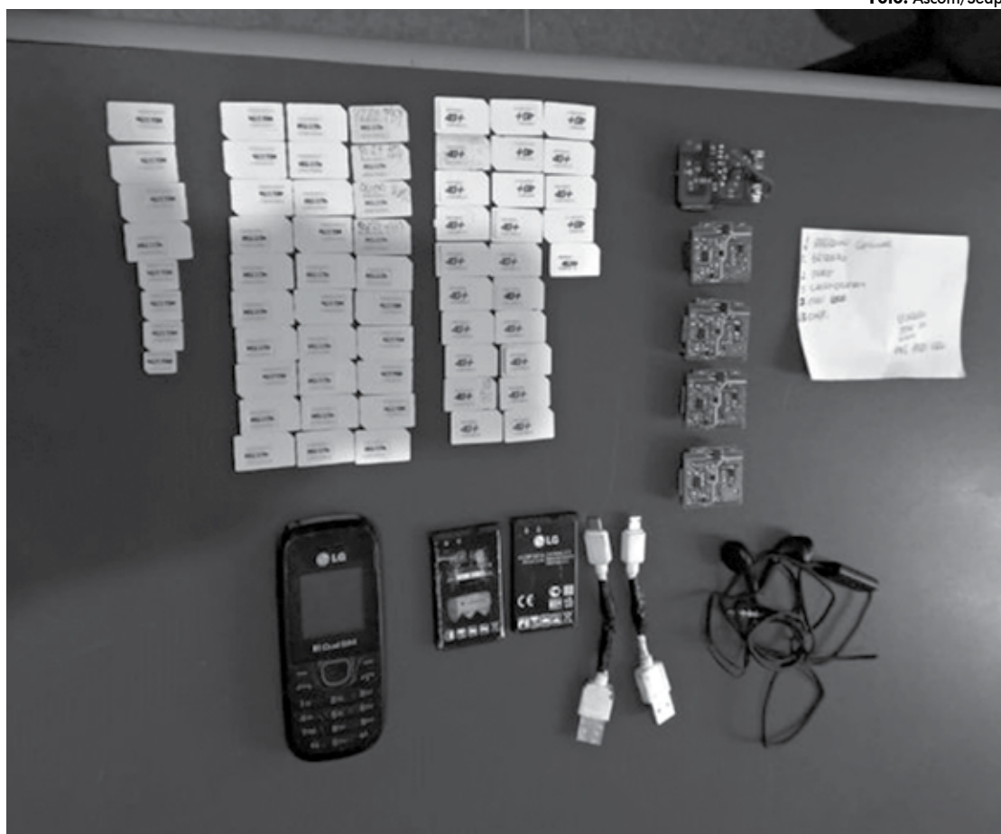
Material apreendido com o advogado estava escondido dentro de um colchão e foi detectado pelo aparelho de raio-X