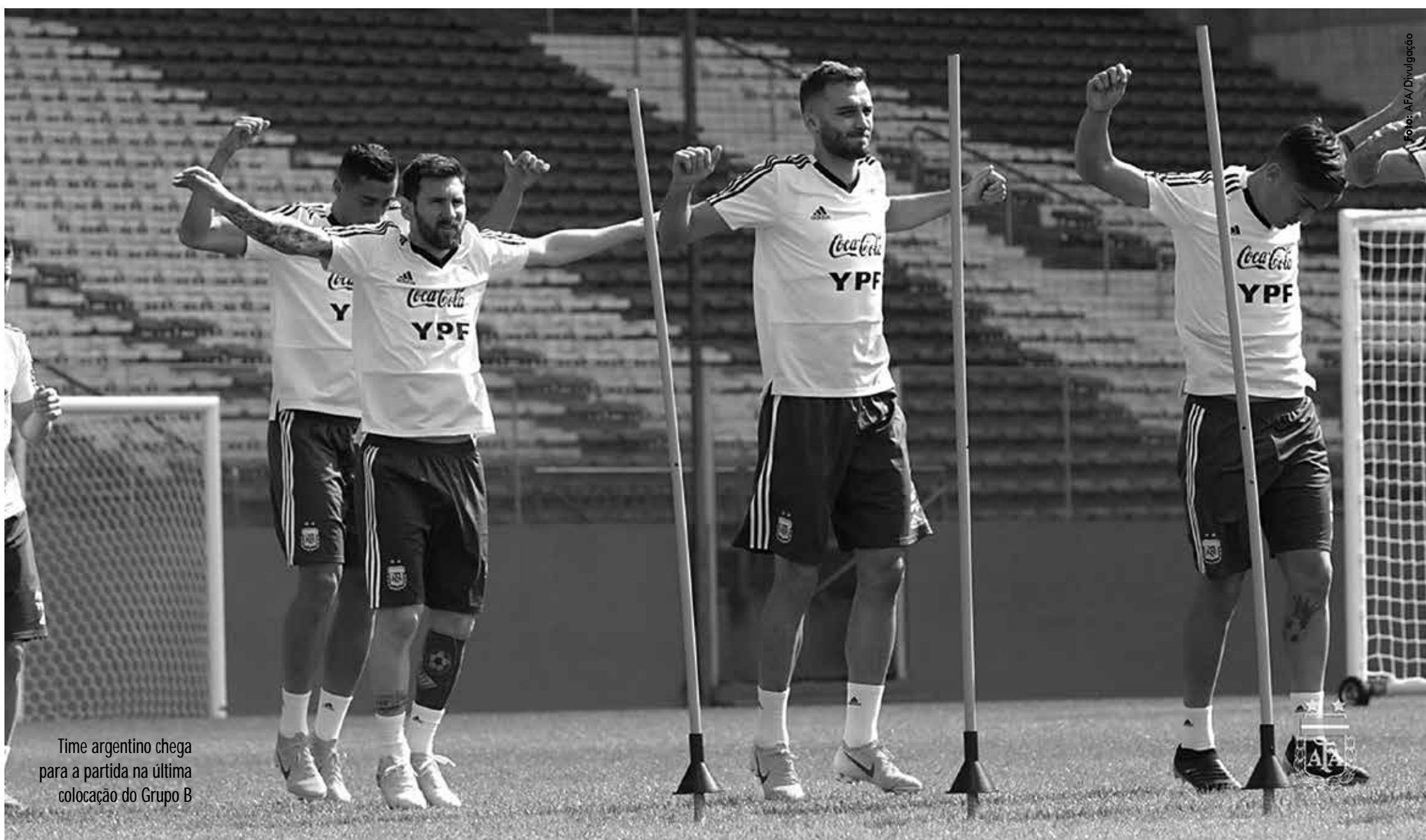
Time argentino chega para a partida na última colocação do Grupo B