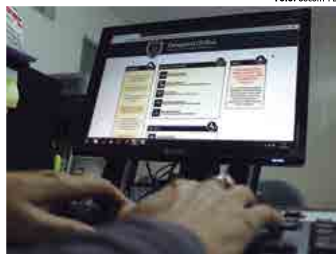
Serviço pode ser acessado por qualquer aparelho com acesso à internet

No caso de pessoas desaparecidas, o BO Também é encaminhado para uma delegacia física. Nesses ca-