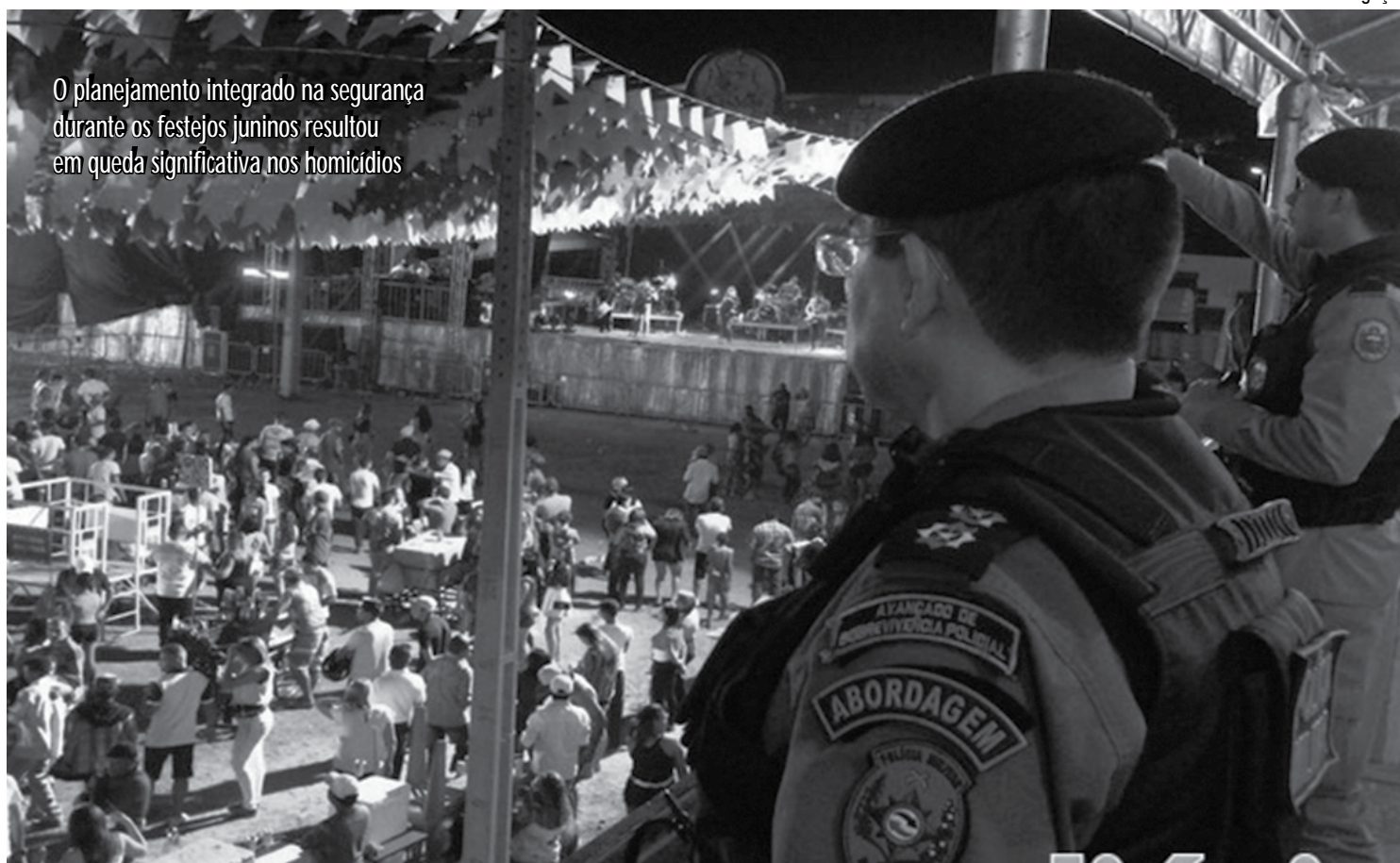
O planejamento integrado na segurança durante os festejos juninos resultou em queda significativa nos homicídios