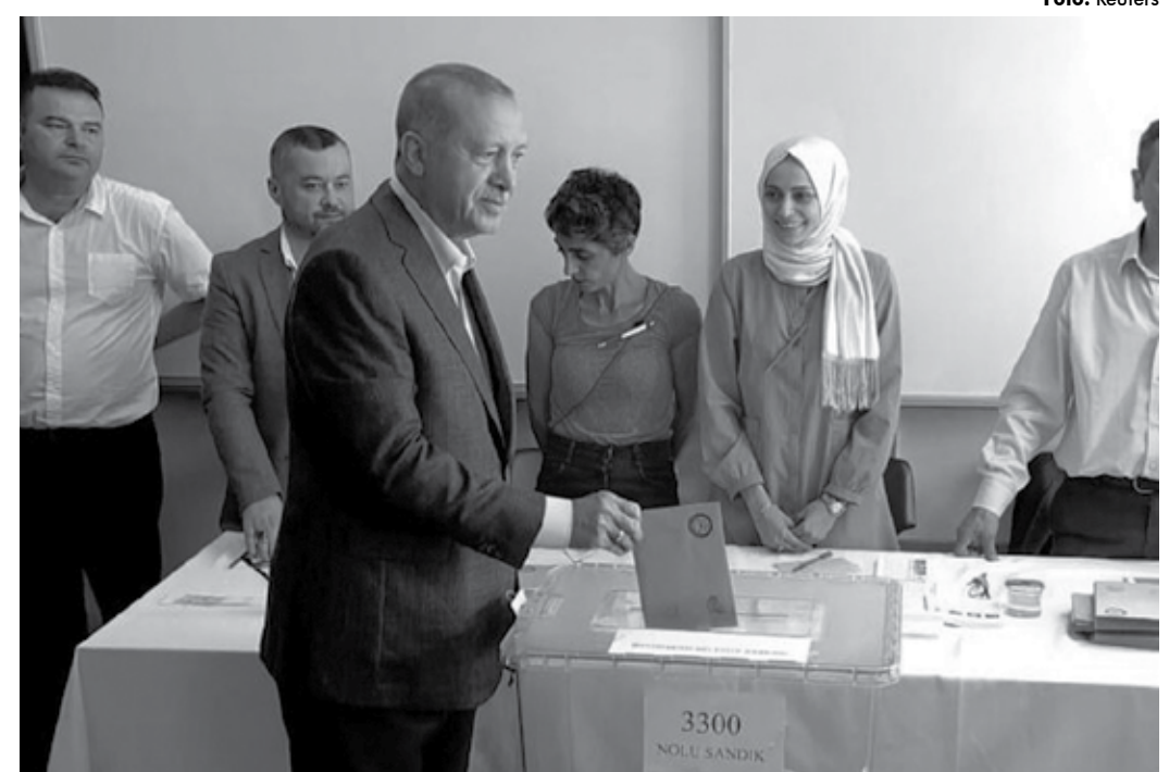
Presidente Recep Tayyip Erdogan no momento em que votava na eleição para a Prefeitura de Istambul

Yildirim admitiu a derrota logo após o anúncio das primeiras parciais, comentando, em relação ao adversário: “Eu o parabenezo e lhe desejo sucesso.” Imamoglu agradeceu especialmente o apoio de “centenas de milhares” de