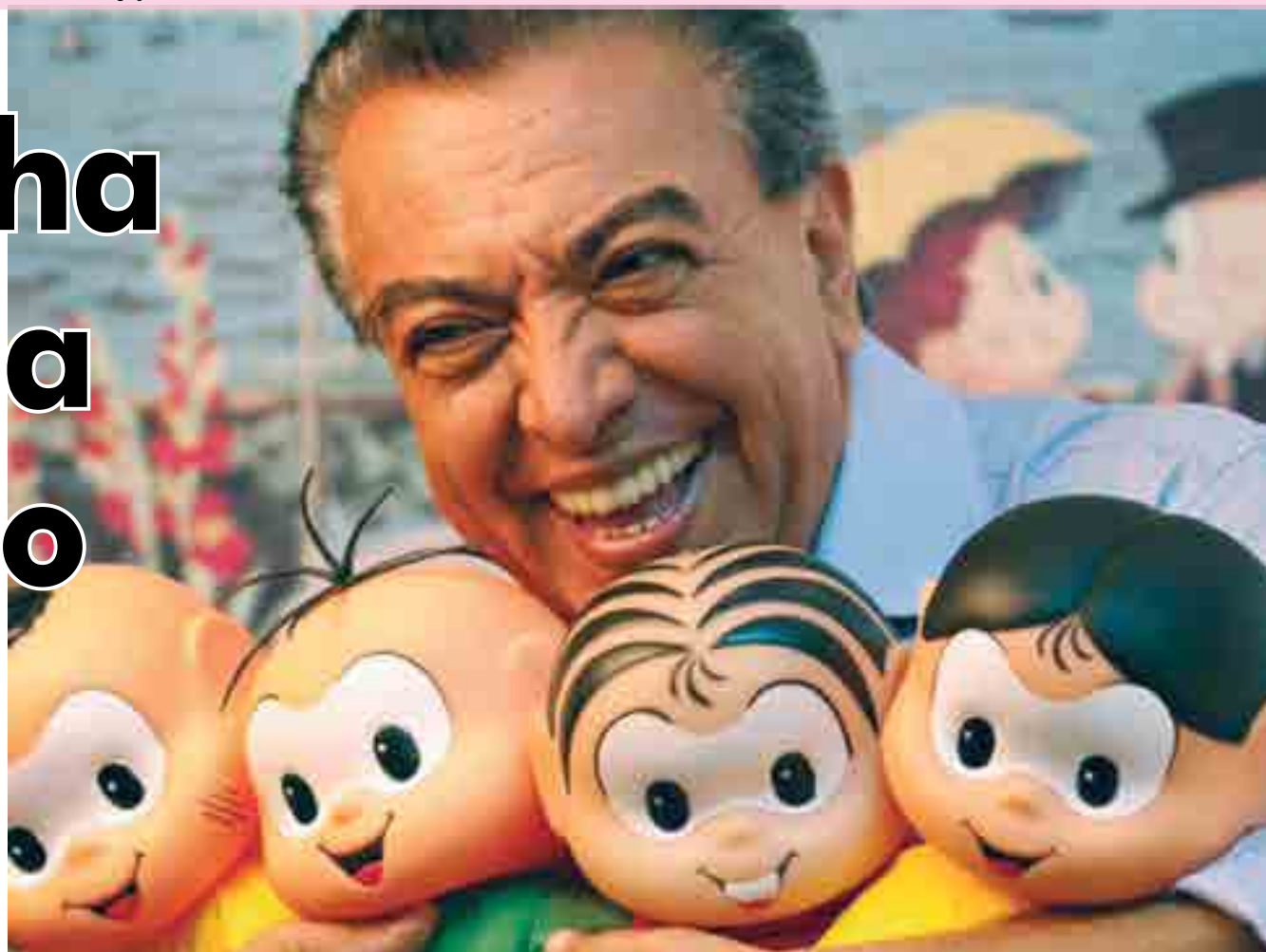
Por mês são produzidas mais de 1.200 páginas de historinhas em quadrinhos e criação brasileira já circula nos Estados Unidos e Canadá

Turma da Mônica faz 60 anos e cartunista recebe homenagem no Festival de Cinema de Gramado