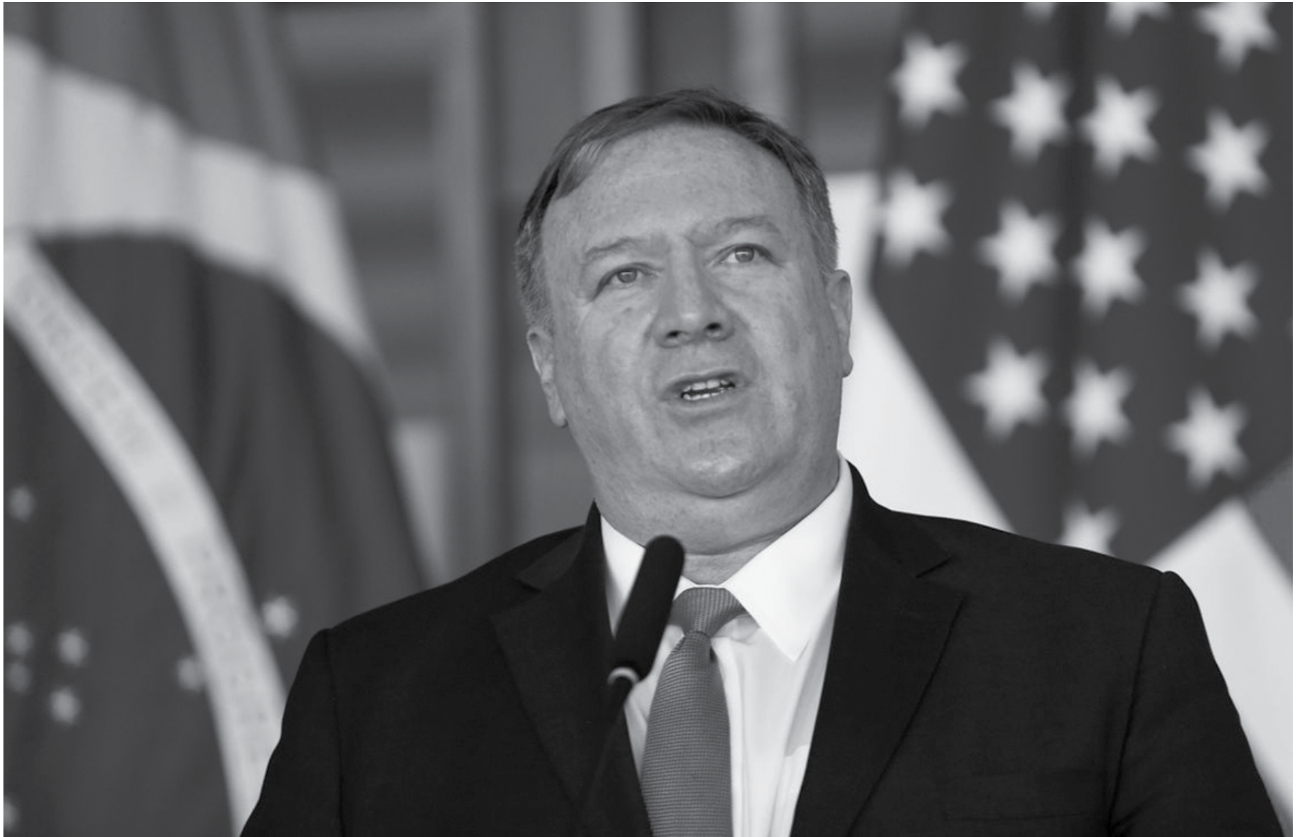
O secretário de Estado americano, Mike Pompeo, visitará a Arábia Saudita e os Emirados Árabes Unidos, aliados dos EUA, que temem o aumento da influência do Irã no Oriente Médio

“Conversaremos sobre como assegurar que estejamos todos estrategicamente alinhados e de que forma podemos construir uma coalizão global, uma coalizão