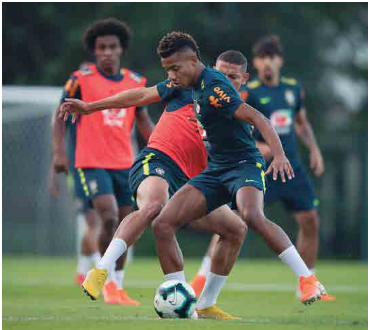
Os jogadores da Seleção Brasileira já voltaram aos treinos, agora em Porto Alegre, no CT Luis Carvalho, do Grêmio, visando o jogo das quartas de final

"Eu cheguei no intervalo e disse que tínhamos que trabalhar com todas as variáveis. Tem que continuar no mesmo ritmo. Temos experiência em buscar resultado então tínhamos que manter a mesma pegada no segundo tempo" analisou o comandante.