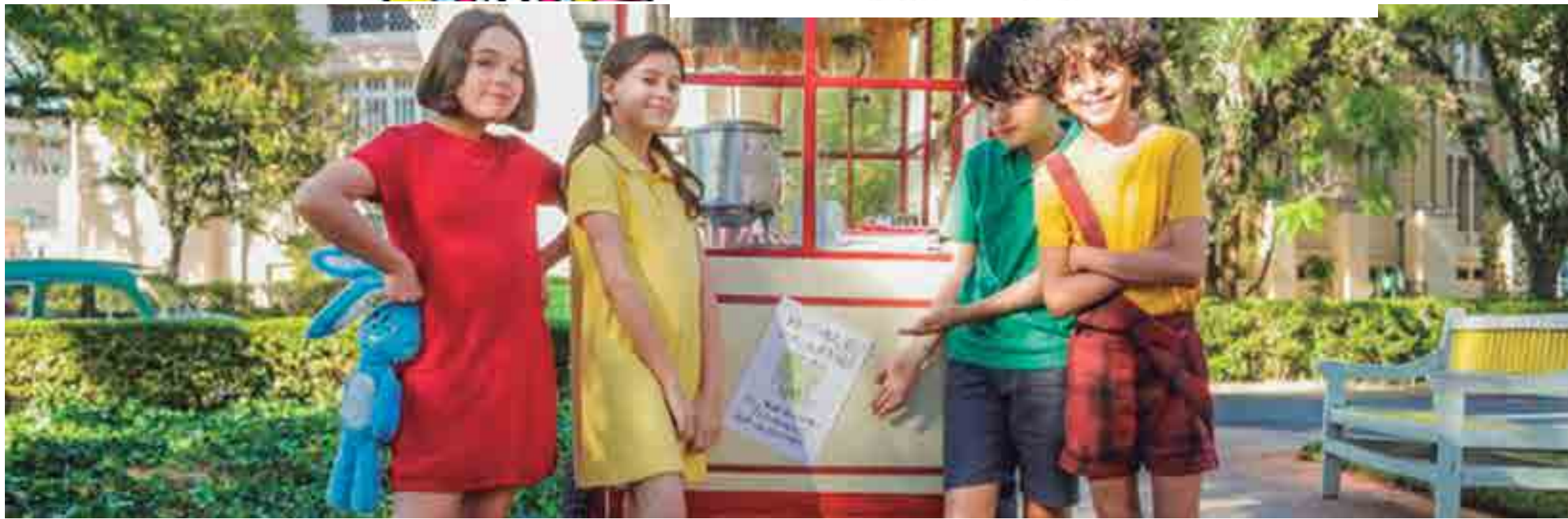
Em comemoração ao aniversário, a Mauricio Sousa Produções traz várias novidades em 2019, a exemplo do espetáculo circense-musical 'Brasilis' e do lançamento do filme 'Turma da Mônica - Laços', do diretor Daniel Rezende

Outras novidades do MSP este ano para comemorar o aniversário da Turma da Mônica e homenagear seu criador é uma superprodução circense-musical, que enaltece a diversidade cultural do país, intitulada “Brasilis”. Outro destaque entre os projetos está a inclusão da Turma da Mônica na Coleção Monteiro Lobato. Este ano, o escritor completaria cem anos de existência.