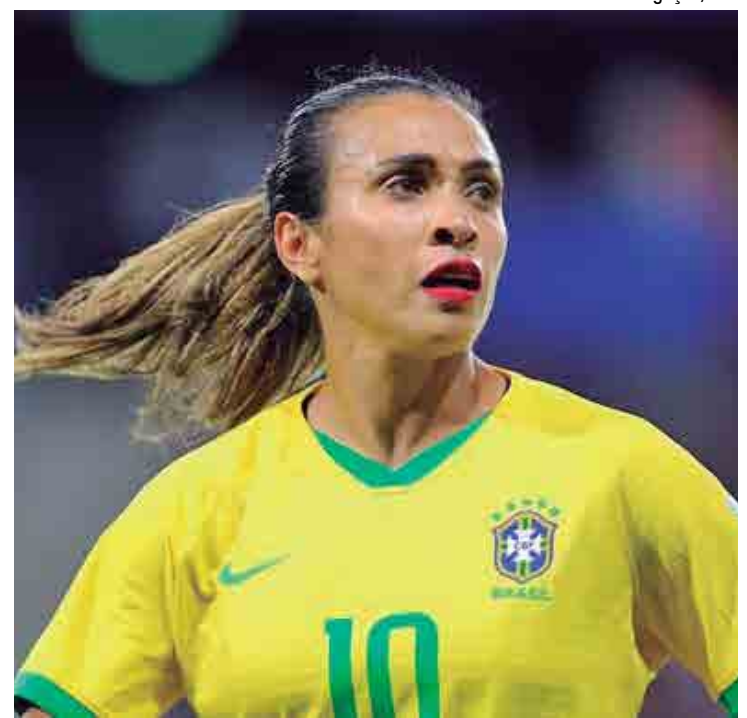
No último domingo, a França venceu e eliminou o Brasil da Copa do Mundo

"A gente sai de cabeça erguida. O Brasil fez um jogo muito bom, mostrou sua força, temos time para bater de frente com grandes seleções. Esperamos que mesmo com a derrota fique a mensagem de que somos sim meninas vitoriosas que tem muita garra e um talento que precisa ser explorado" declarou.