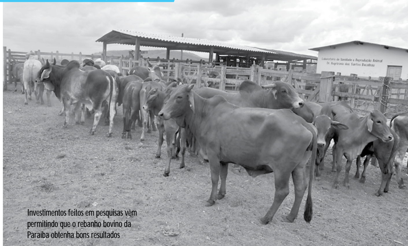
Investimentos feitos em pesquisas vêm permitindo que o rebanho bovino da Paraíba obtenha bons resultados