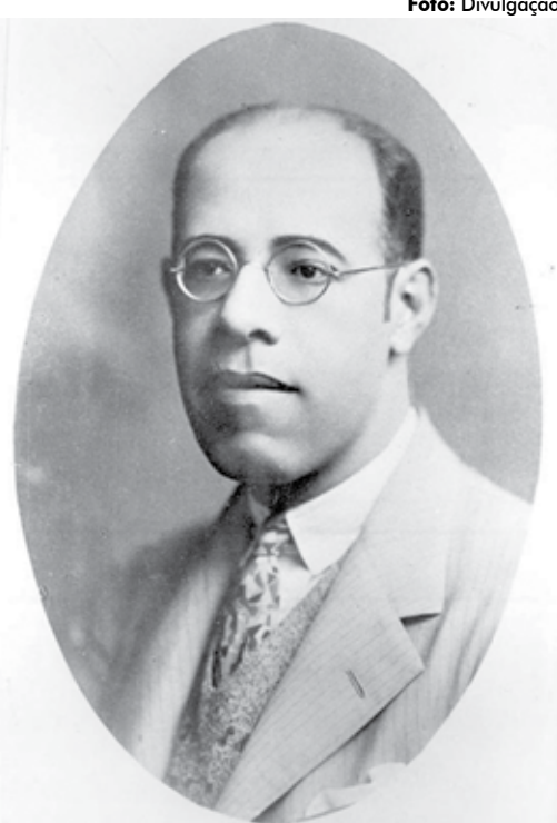
Poeta Mário de Andrade

Mas, em todo caso, quando a vida está Mais dura, mais vida, ninguém como a mãe Pra agüentar a gente escondendo a cara