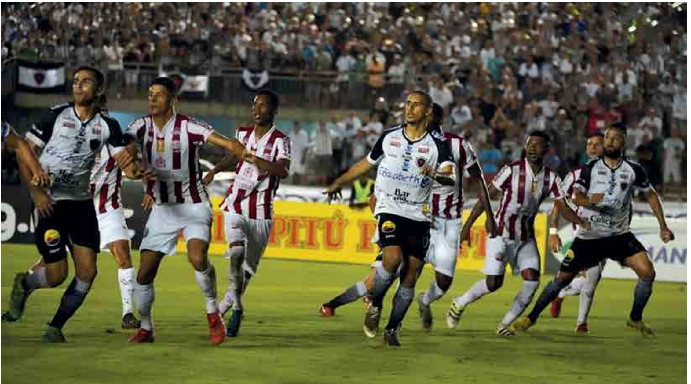
A vitória de 2 a 1 sobre o Náutico garantiu o time tricolor na final da Copa do Nordeste com o Fortaleza como adversário. O primeiro jogo será no Castelão, no dia 22 de maio, e o segundo no dia 29, no Estádio Almeidão