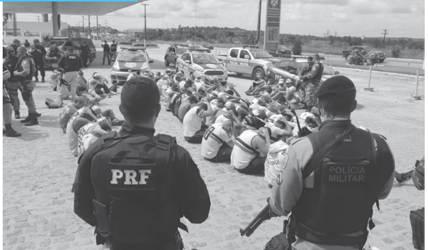
Operação foi realizada pela Polícia Rodoviária Federal com apoio da Polícia Militar em um posto de combustíveis na BR-101, município de Conde