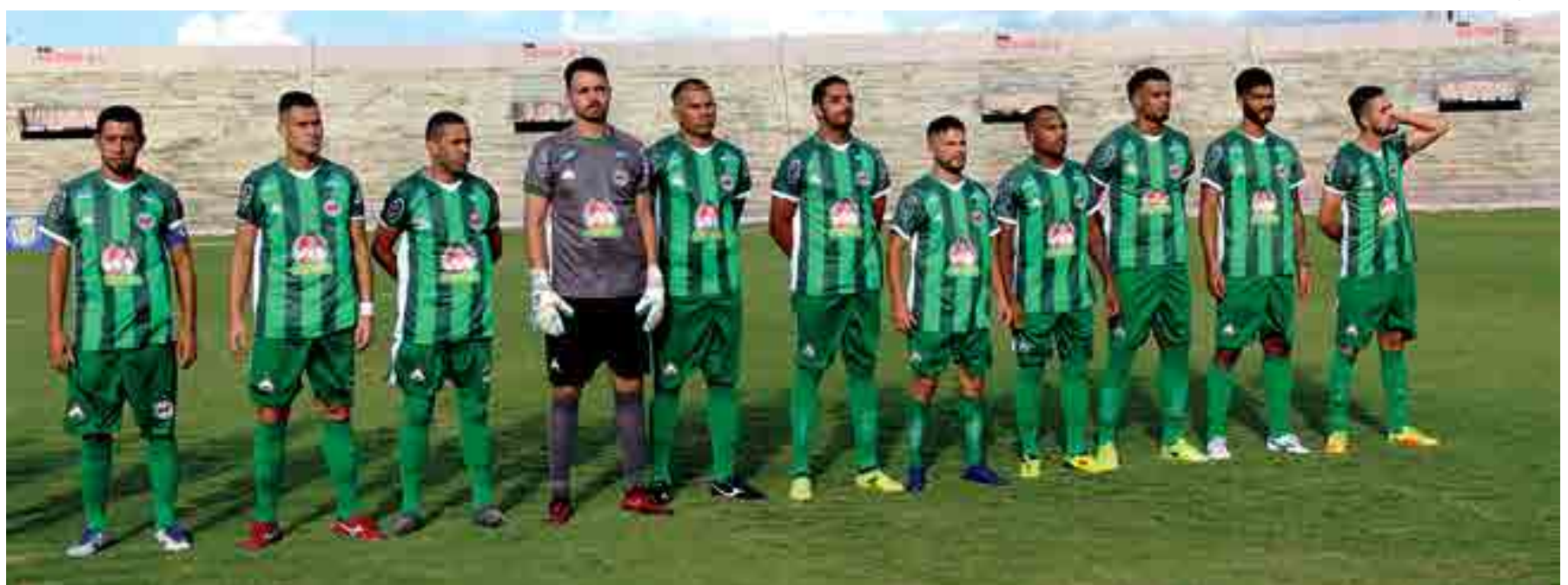
Jogadores perfilados antes da partida de estreia no Almeidão, diante do América de Natal, na semana passada, quando o time paraibano foi goleado pelo placar humilhante de 6 a 0