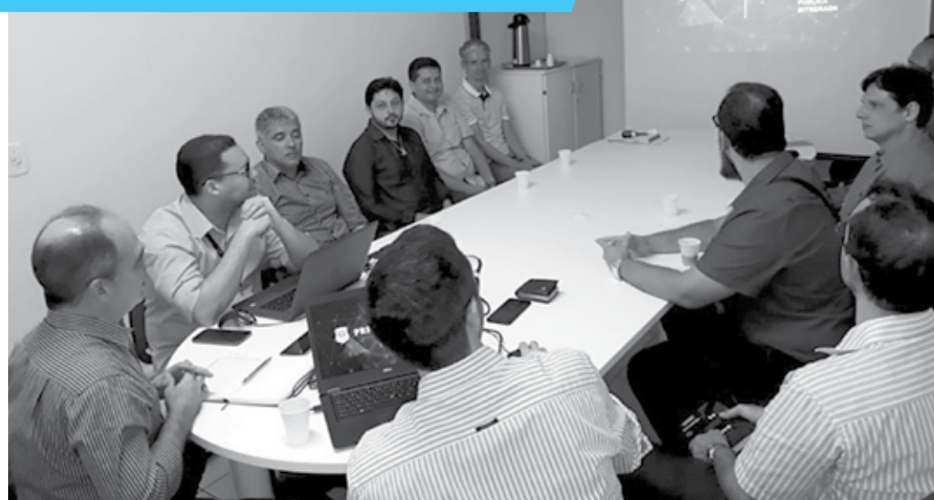
Reunião técnica entre os gestores dos dois órgãos discutiu os sistemas de videomonitoramento eletrônico nas rodovias