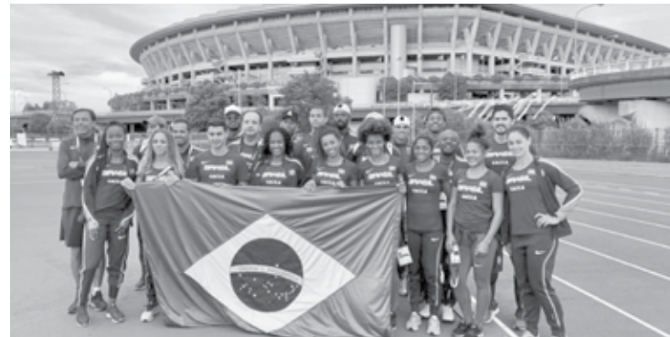
Delegação brasileira que compete a partir de hoje na cidade de Yokohama