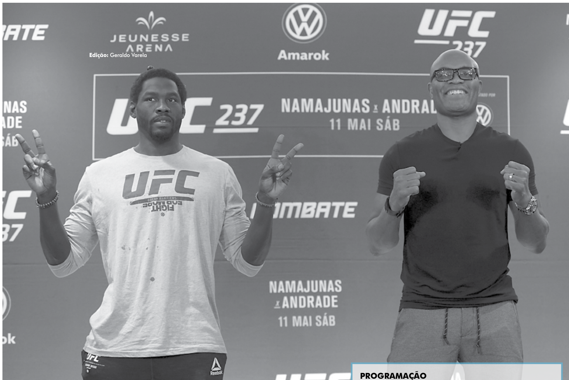
Anderson Silva e seu adversário de hoje, Jared Cannonier, em luta que vai acontecer esta noite no Rio de Janeiro

Nesta semana, José Aldo disse da sua vontade de se aposentar aos 32 anos, enquanto Anderson quer seguir em atividade aos 44 é porque talvez tenha se planejado “muito melhor” que o