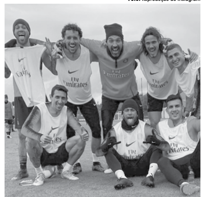
Neymar com outros jogadores do PSG em brincadeira durante treino

Neymar ficará fora das duas rodadas finais da competição nacional, diante do Dijon, em casa, e Reims, fora, e da Supercopa da França, em 3 de outubro, na China. O PSG anunciou que vai recorrer da punição por considerar severa demais, justificando a reação do craque pela provocação do torcedor a ele e outros