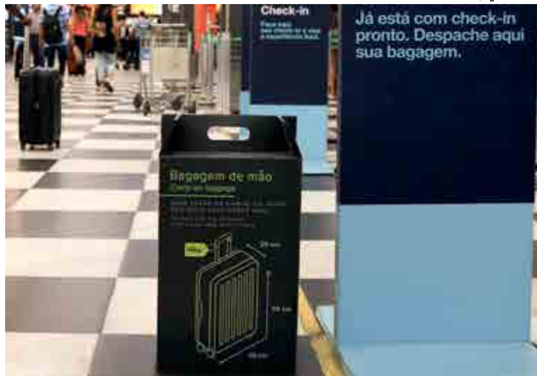
Passageiros de Congonhas tiveram que seguir as mudanças nas regras relativas ao tamanho da bagagem de mão