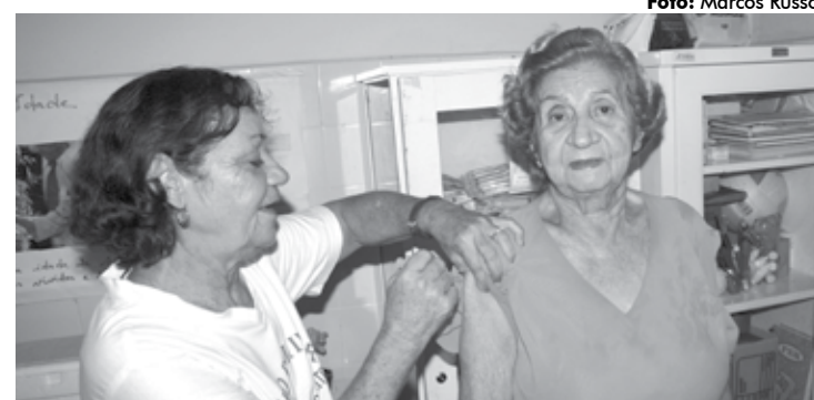
Secretaria Estadual de Saúde já aplicou mais de 650 mil vacinas na Paraíba

No último dia 4 uma mobilização em todo o país reforçou a importância de se tomar a vacina. O dia D de