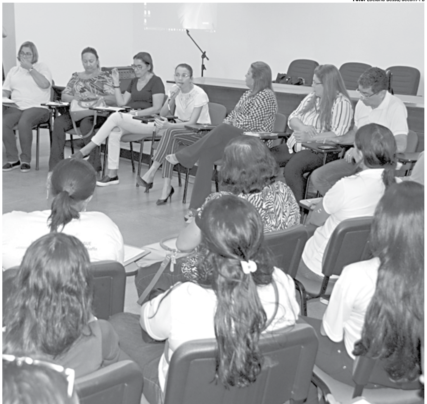
Gerência Executiva de Segurança Alimentar e Nutricional reuniu técnicos de referência de 60 dos 88 municípios que atuam na execução, monitoramento e fiscalização