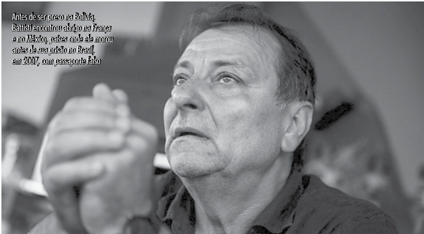
Antes de ser preso na Bolívia, Battisti encontrou abrigo na França e no México, países onde ele morou antes de sua prisão no Brasil, em 2007, com passaporte falso