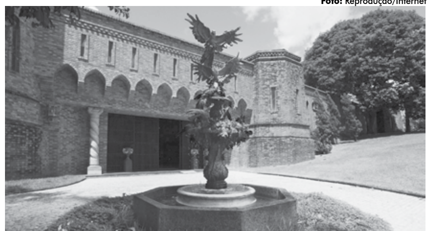
Reunião com o Conselho Deliberativo da Sudene aconteceu no Instituto Ricardo Brennand, em Recife