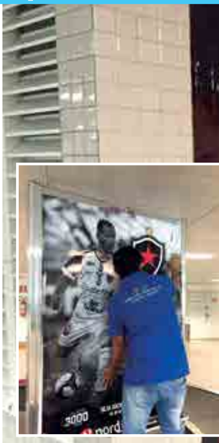
Empresa responsável pelo marketing do Belo elabora projeto institucional no Aeroporto Internacional Castro Pinto para contar a história do Botafogo aos visitantes