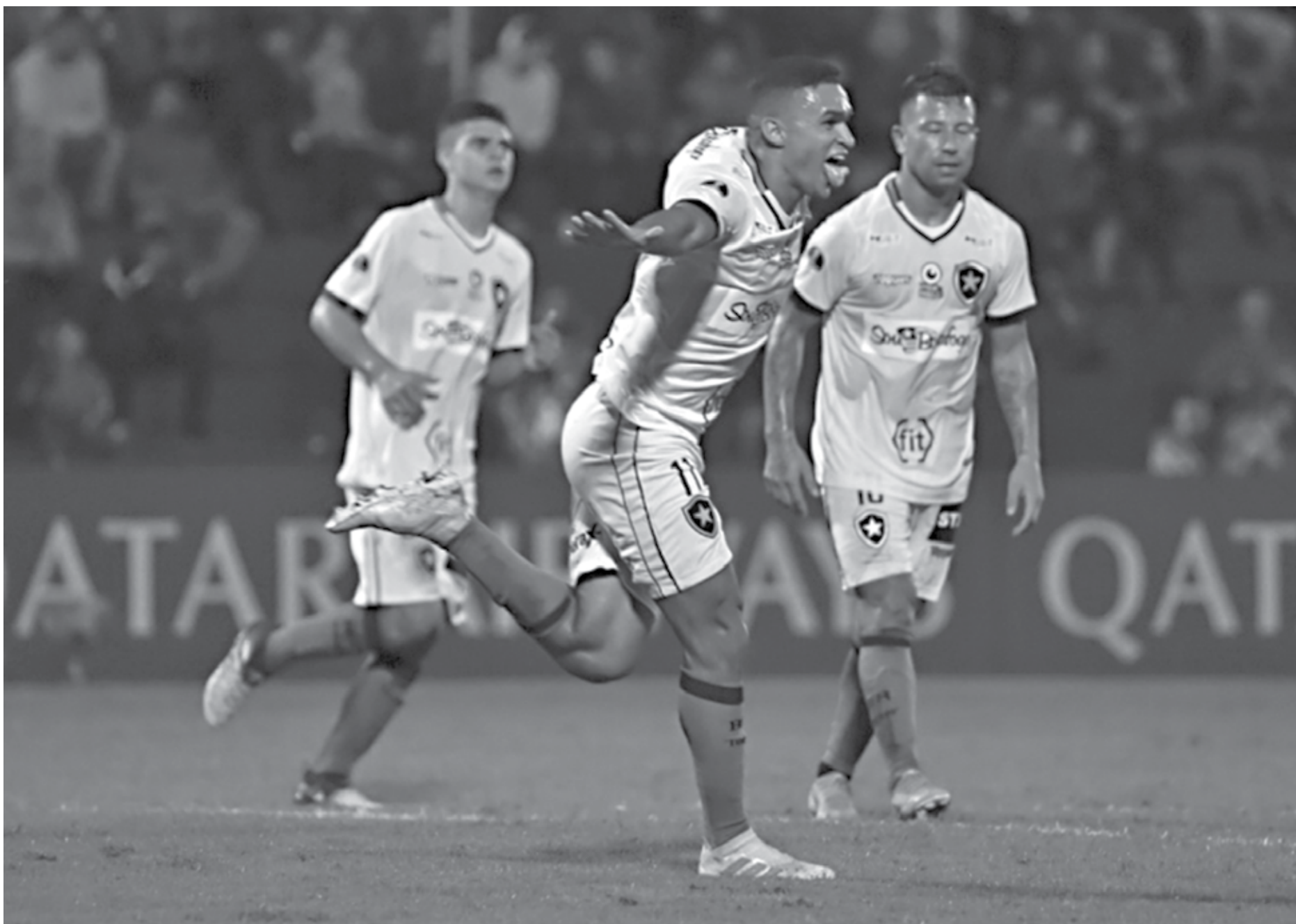
O Botafogo, que venceu esta semana o jogo de ida diante do Sol de América pela Copa Sul-Americana, volta a disputar o Brasileiro e pega o líder da competição, o Palmeiras, em Brasília

O Palmeiras deve jogar com Weverton; Mayke, Luan, Gustavo Gómez e Diogo Barbosa; Thiago Santos, Bruno Henrique e Gustavo Scarpa; Dudu, Zé Rafael e Deyverson.