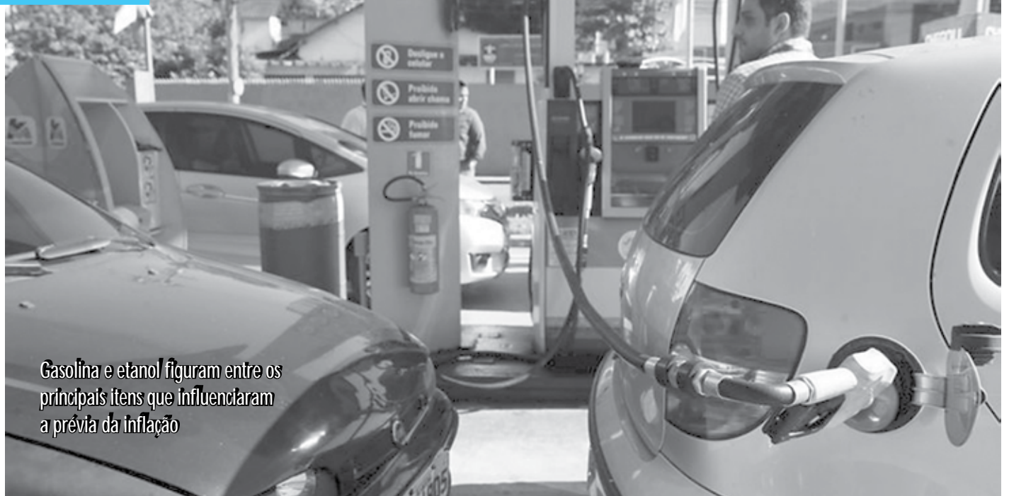
Gasolina e etanol figuram entre os principais itens que influenciaram a prévia da inflação