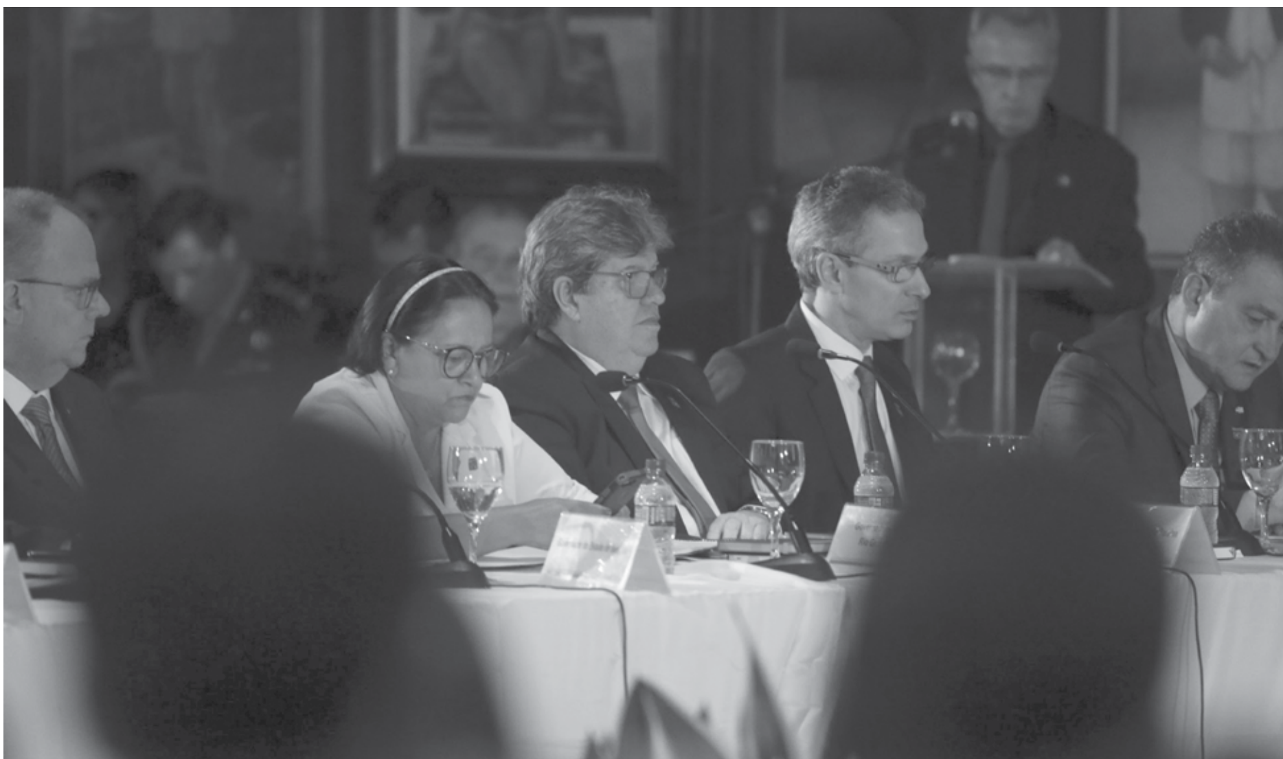
O governador João Azevêdo evidenciou a conquista dos governadores do Nordeste, que conseguiram assegurar 30% dos recursos do Fundo de Desenvolvimento da Região para obras de infraestrutura

O presidente da República, Jair Bolsonaro, falou