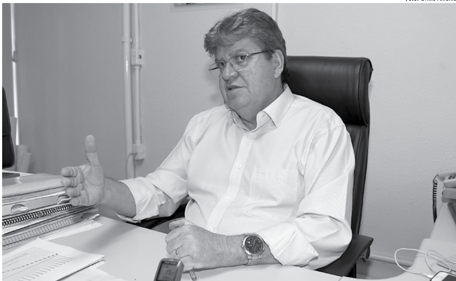
O acordo assinado permitirá, por exemplo, intercâmbio de estudantes, na segurança pública, parceria em obras de infraestrutura e realização de compras conjuntas

Os três pontos seguintes são o intercâmbio estudantil e profissional que possibilitará parcerias e ações entre os estados na área de educação; os projetos conjuntos que vão integrar a infraestrutura dos nove estados para utilizar os recursos públicos da melhor forma possível; e a troca de tecnologia e conhecimento que vai permitir a circulação, troca de informações, conhecimento e tecnologia entre os estados, de forma bem mais rápida.