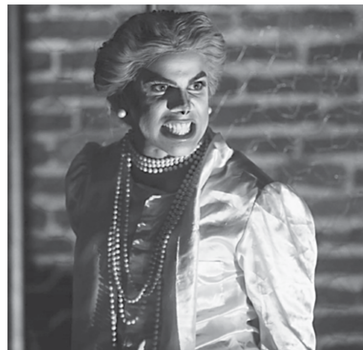
Espetáculo usa declarações de políticos e crítica desrespeito além do preconceito

A evolução do espetáculo é genuinamente viva,