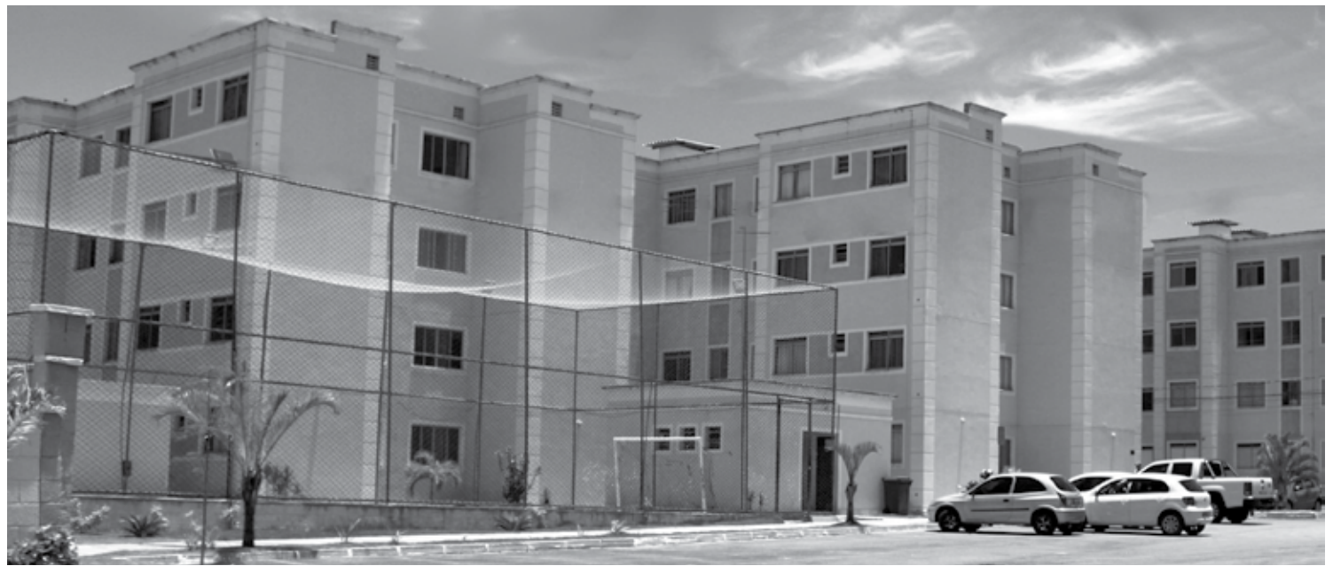
Neste mês de março, foi implantado o serviço de gás natural no maior condomínio residencial do Estado, que fica localizado em Campina Grande

Vantagens do gás canalizado, como a praticidade do fornecimento contínuo, o conforto e a segurança, foram determinantes para o crescimento no número de clientes