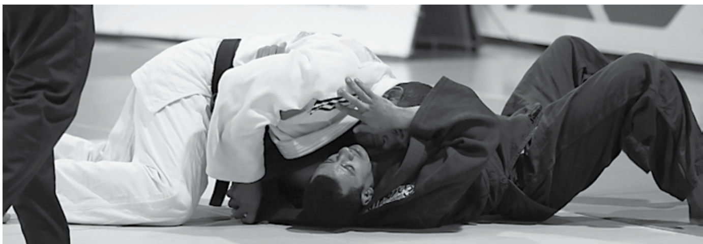
Judô paralímpico será também atração neste final de semana em São Paulo com os principais nomes da modalidade no Grand Prix da CBDV