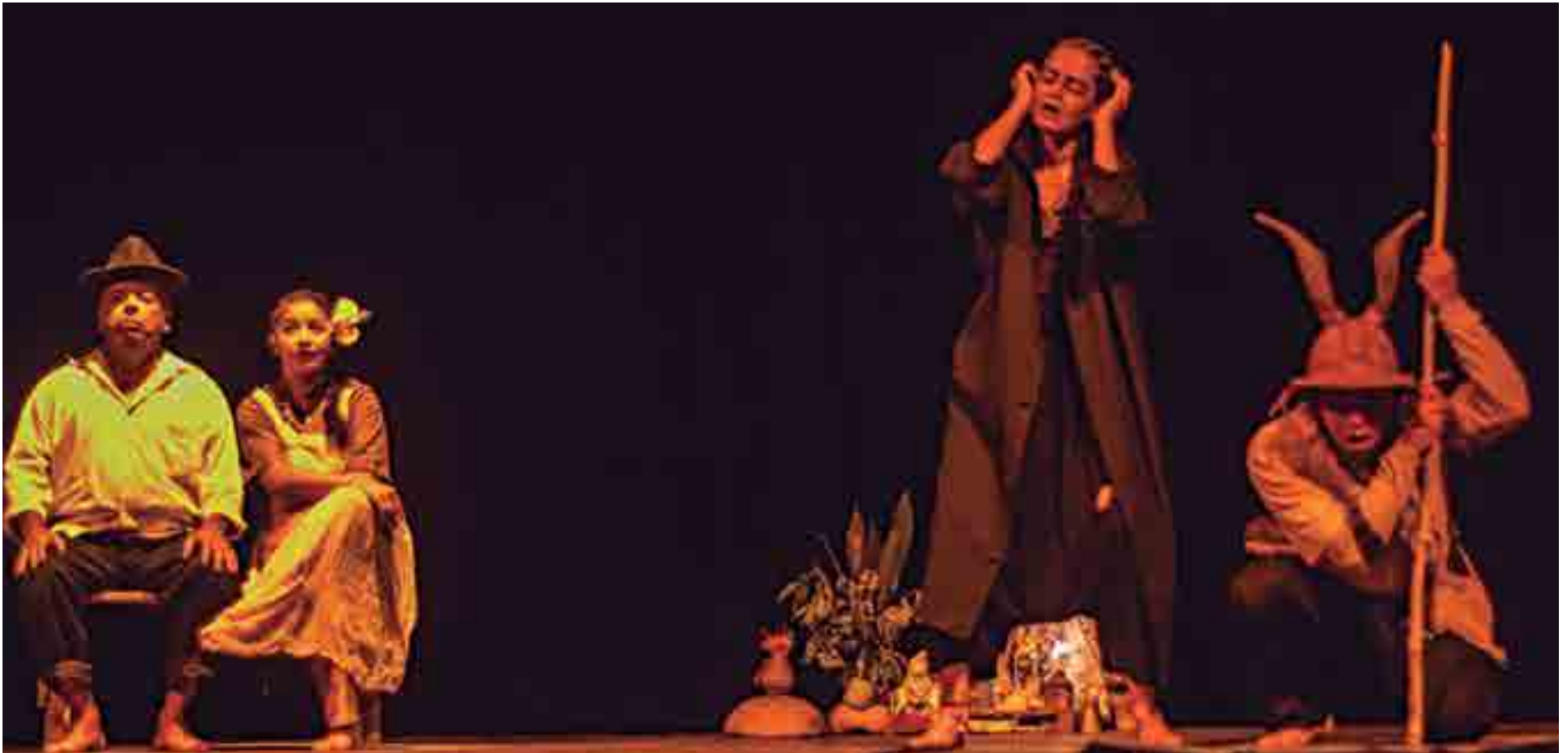
Cena do espetáculo 'Agreste (Malva Rosa)', que poderá ser visto na Sala Preta da UFPB, em João Pessoa, a partir das 19h, com entrada gratuita

Essa apresentação do espetáculo é muito importante porque cada aluno vai colocar em prática tudo aquilo que aprendeu ao longo do curso. Vai estar diante da plateia. //