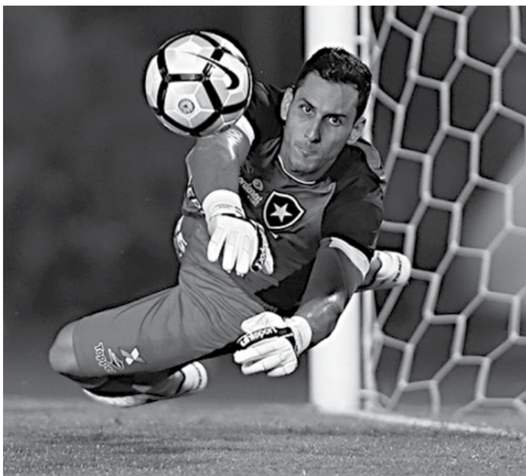
Goleiro, nas cobranças de pênalti, vai poder colocar apenas um pé na marca do cal a partir de junho

As novas regras abrangerá boa parte da atual temporada das competições na América do Sul, figurando na Libertadores, Brasileirão e a Copa do Brasil. Com calendário diferenciado, o futebol europeu só irá incorporar as alterações na próxima temporada (2019/2020).