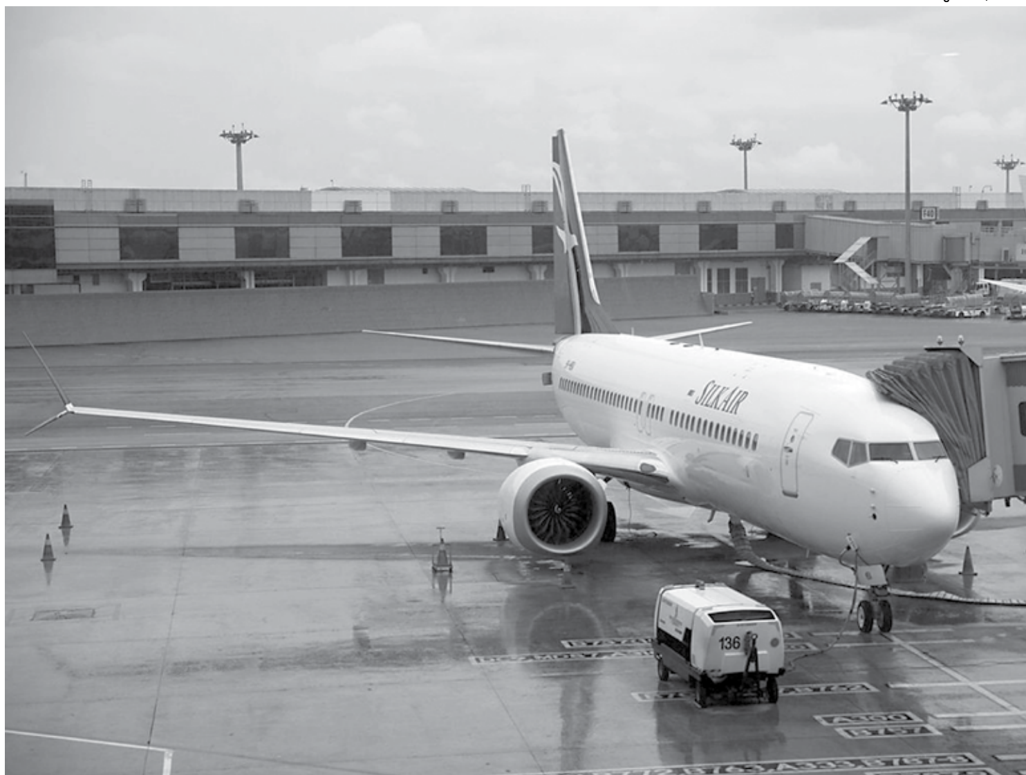
Após o acidente com Boeing 737 MAX da Ethiopian Airlines, que deixou 157 mortos, vários países, a exemplo do Brasil, suspenderam voos da aeronave