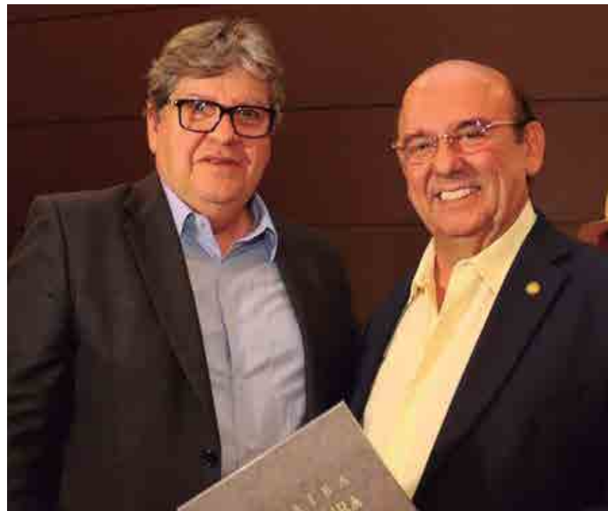
Governador do Estado, João Azevêdo, junto com o secretário de Estado da Cultura, Damião Ramos