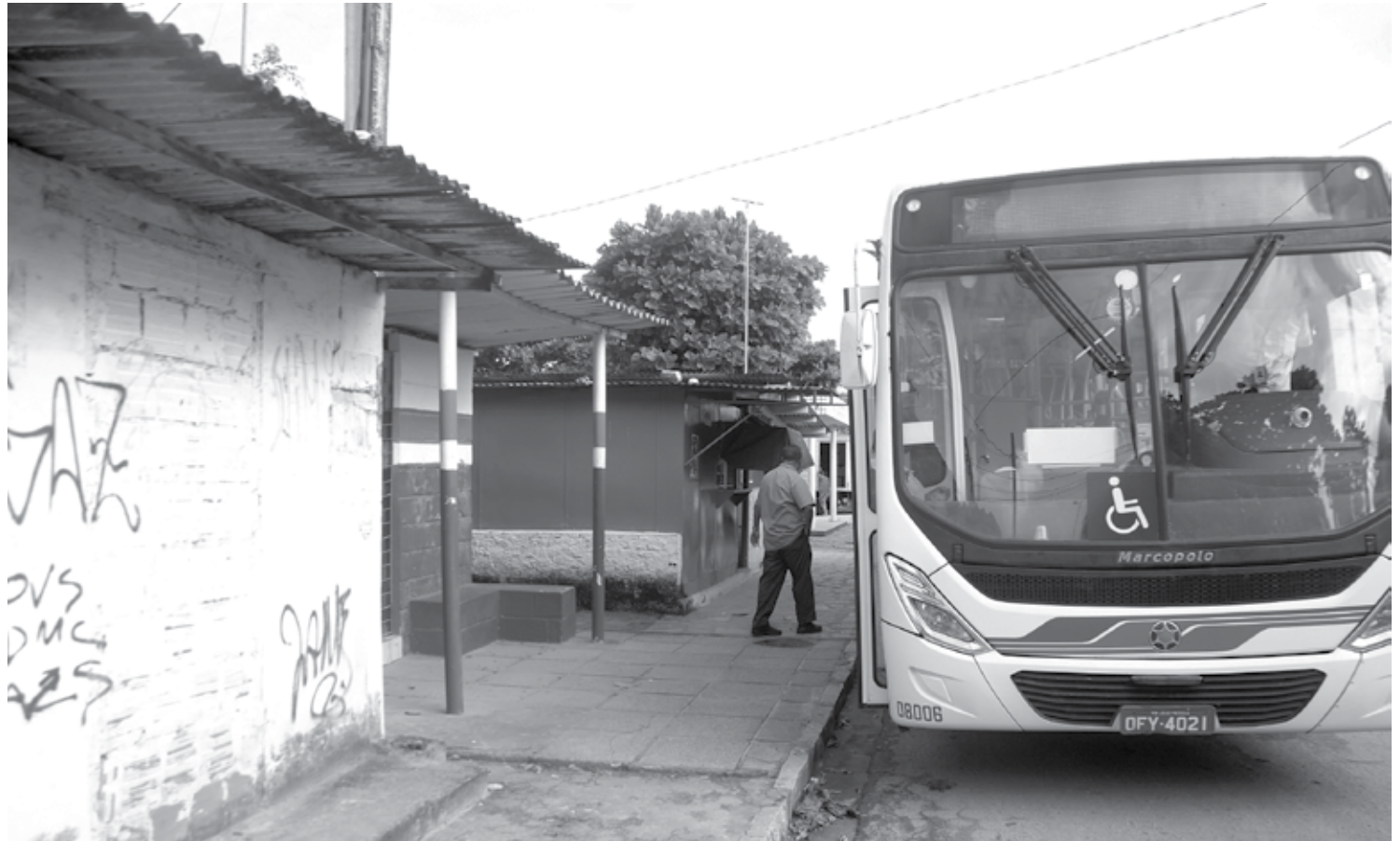
Previsão era que os coletivos voltassem a circular pelas ruas da capital amanhã, mas avaliação da PMJP é que abril é decisivo no combate ao Covid-19

Prefeitura adotará mais medidas sociais para apoiar moradores em situação de rua e ampliar leitos nas unidades de saúde