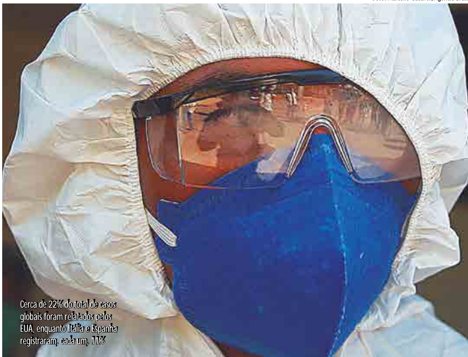
Cerca de 22% do total de casos globais foram relatados pelos EUA, enquanto Itália e Espanha registraram, cada um, 11%

A Europa é responsável por mais da metade dos casos e mais de 70% das mortes relacionadas ao vírus, já que os países do sul da Europa, que tem parcela maior da população com idade avançada, têm sido particularmente atingidos com força.