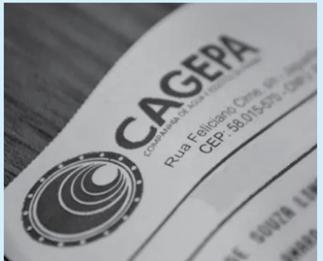
Estado vai arcar com o pagamento dessas contas durante 90 dias e a companhia já está se preparando para este período

O objetivo do Governo do Estado é garantir maior tranquilidade financeira ao orçamento de famílias em toda a Paraíba