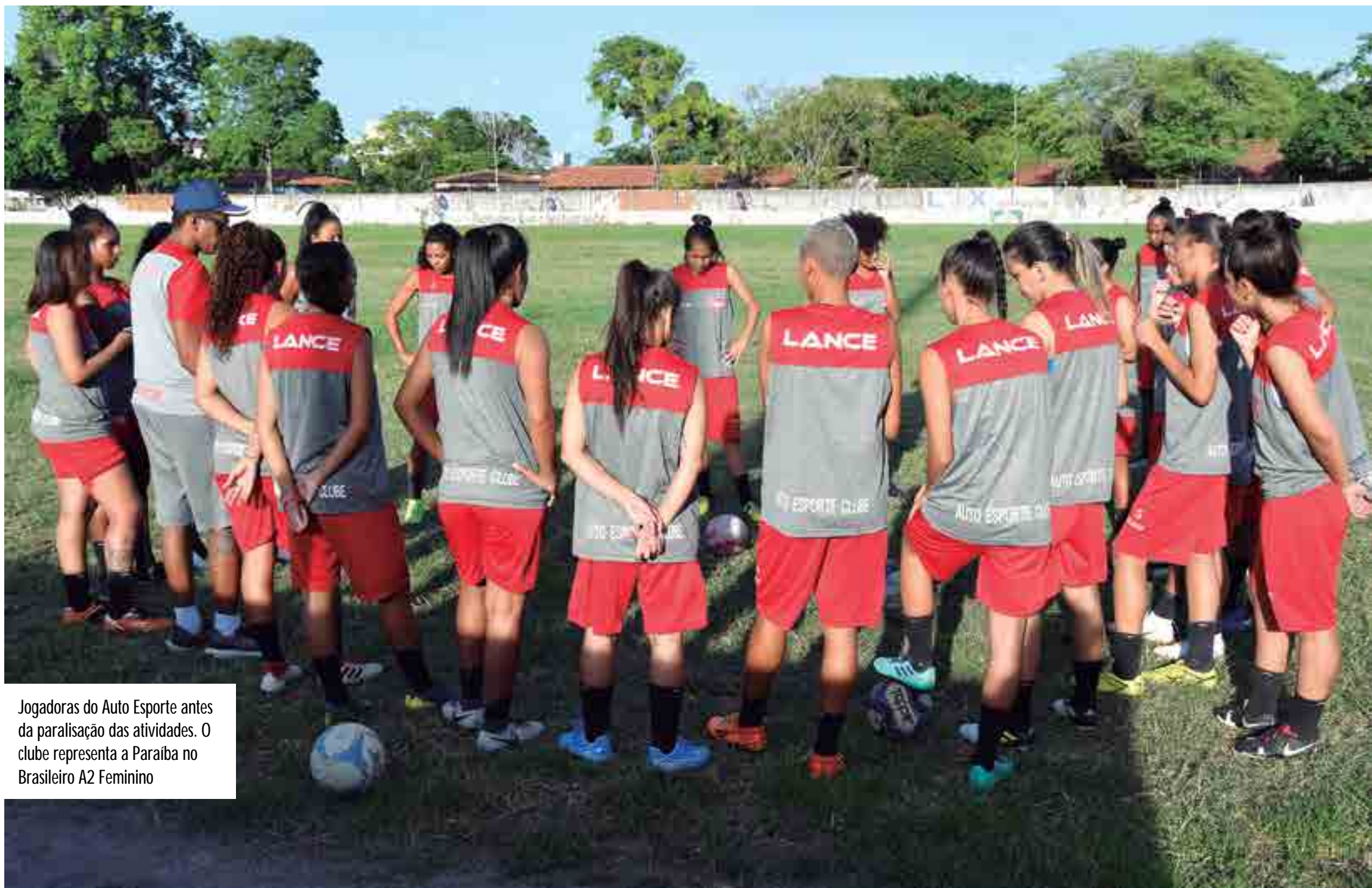
Jogadoras do Auto Esporte antes da paralisação das atividades. O clube representa a Paraíba no Brasileiro A2 Feminino