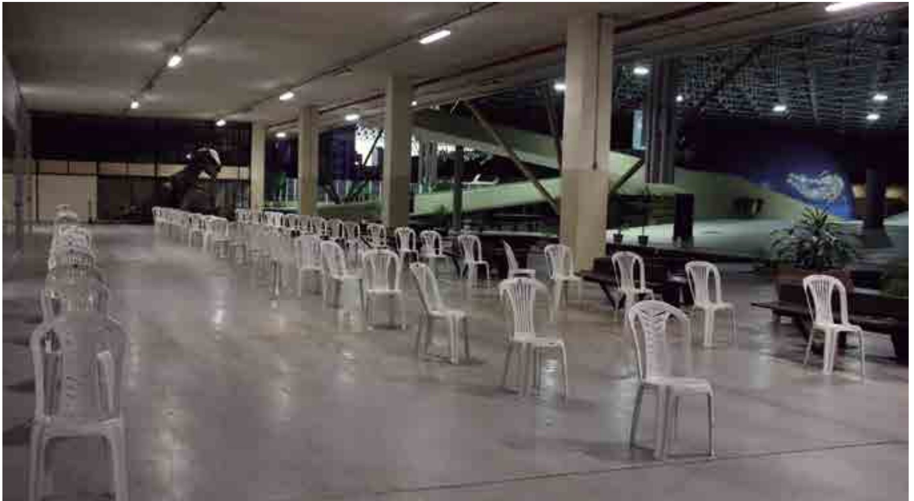
Estrutura no Espaço Cultural José Lins do Rego, em João Pessoa, está sendo montada para realização dos primeiros testes rápidos em pessoas que apresentem sintomas de gripe