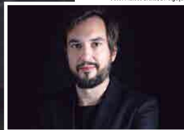
Site foi desenvolvido em conjunto com Leandro Valiati, que é PhD em Economia do Desenvolvimento