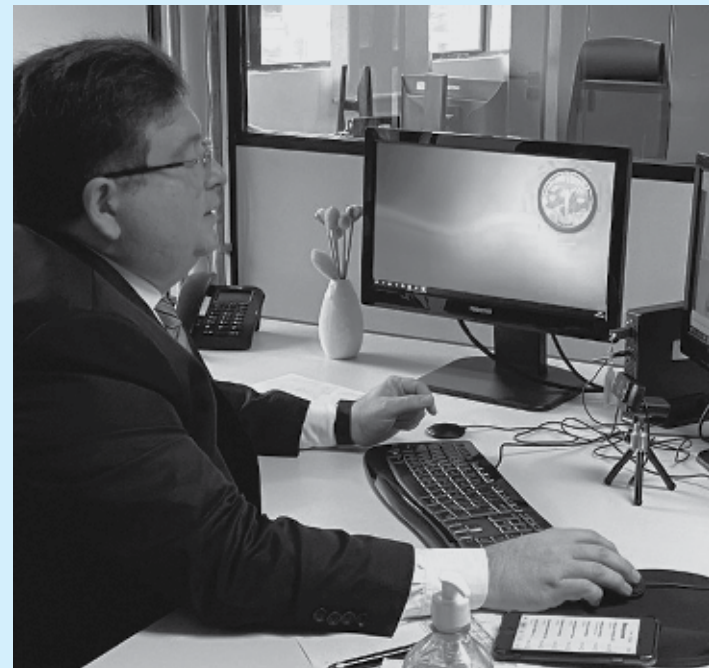
Audiência de conciliação foi realizada por sistema de videoconferência