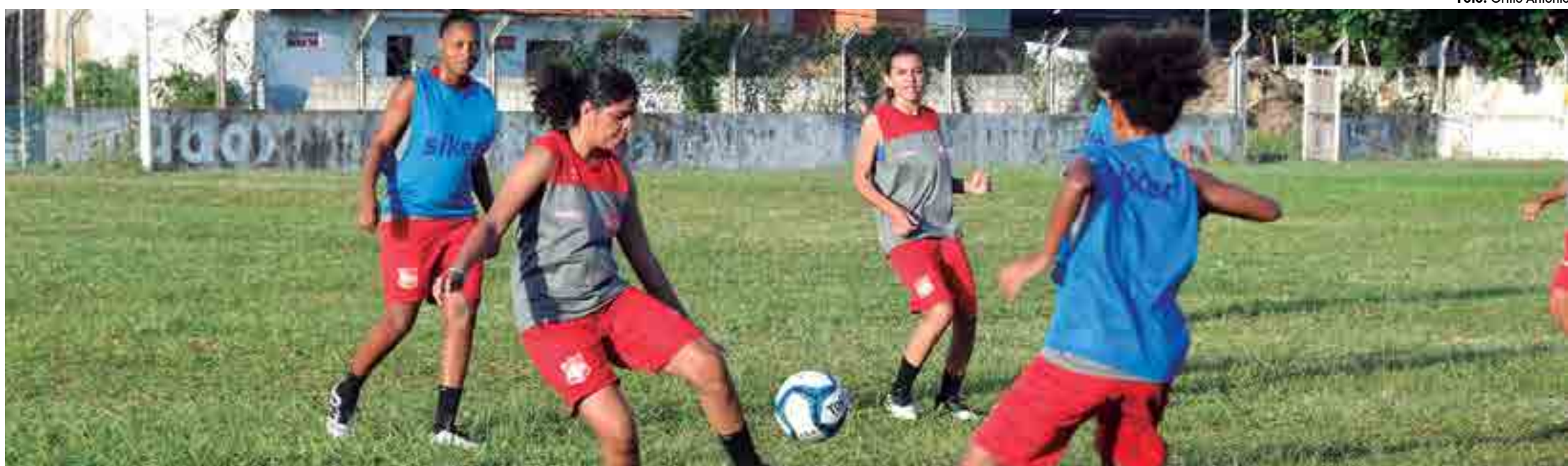
Jogadoras do Auto Esporte em treinamento no Estádio Mangabeirão no mês de fevereiro, antes das medidas de isolamento social para conter a propagação do coronavírus, que paralisaram todas as atividades do futebol no mundo

A partida ocorreu no dia 15 de março e foi um dos últimos confrontos disputados no país antes da paralisação de todos os campeonatos realizados pela entidade máxima do futebol brasileiro. A CBF anunciou a interrupção de suas competições na mesma data da partida que ocorreu no Estádio dos Aflitos, em Recife, marco que completa hoje seu primeiro mês desde que a bola deixou de rolar nos gramados brasileiros.