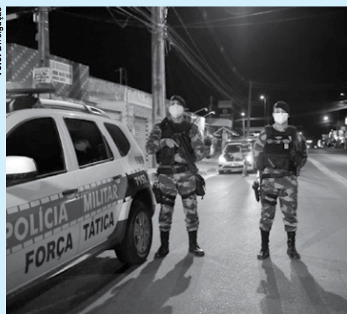
PM também prendeu e apreendeu 136 suspeitos de vários crimes

A Operação Semana Santa atendeu 198 denúncias de aglomerações e descumprimento das medidas de prevenção contra o novo coronavírus, da noite da quarta-feira (8) até o início da madrugada dessa segunda-feira (13). Os dados são da Coordenadoria de Estatística e Avaliação (EM/7) da Polícia Militar e mostram que, além do trabalho de orientação sobre a necessidade do isolamento social, a PM prendeu e apreendeu 136 suspeitos de vários crimes e retirou 32 armas de fogo das ruas.