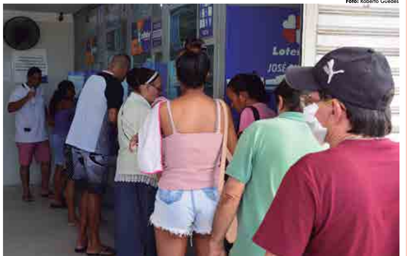
Reunião do governo com representantes de agências bancárias elencou formas para que distanciamento seja cumprido fora de estabelecimentos

para os serviços que não podem ser realizados nos caixas eletrônicos e canais de atendimento remoto foi liberada por meio do decreto 40.141 do dia 26 de março.