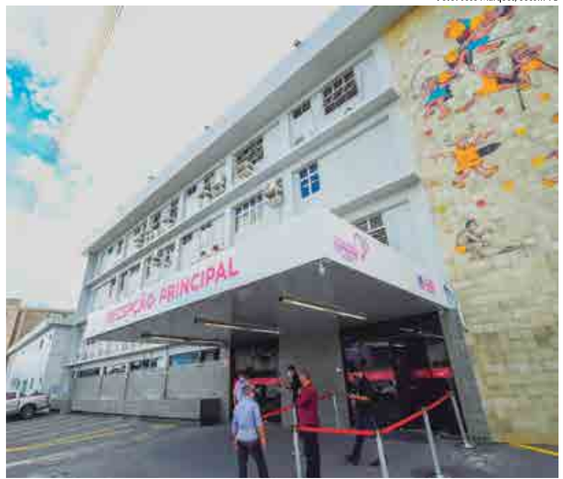
A Maternidade Frei Damião II é um dos hospitais credenciados para atender casos do novo coronavírus no Estado

A Central Estadual de Regulação Hospitalar para o Covid-19 funciona em contato direto com os municípios, para habilitar a internação de pacientes com síndrome gripal, com necessidade de tratamento em rede especializada.