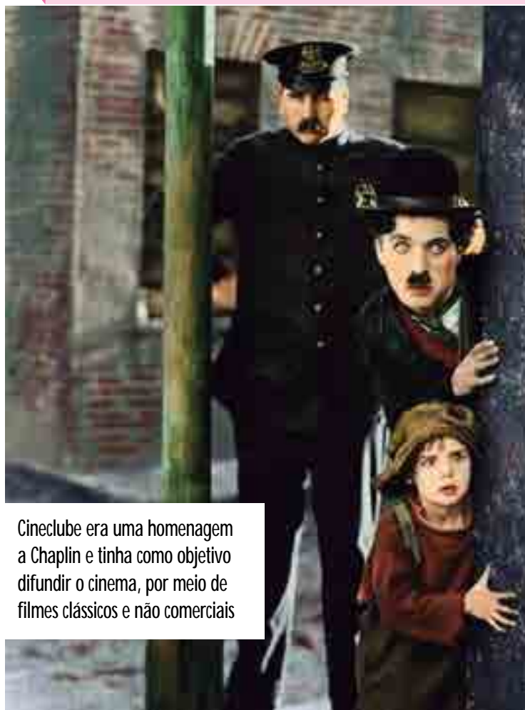
Cineclube era uma homenagem a Chaplin e tinha como objetivo difundir o cinema, por meio de filmes clássicos e não comerciais