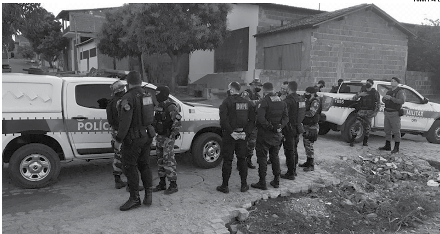
A ação integrada das polícias está agindo em toda região polarizada por Catolé do Rocha para conter a onda de criminalidade que assustou moradores

O delegado disse que o preso era um dos mais procurados do Estado e apontado como chefe do grupo que praticou os homicídios. “Estávamos com 55 dias sem um homicídio, até a ocorrência da semana passada. Mais a polícia está realizando constantes ações para