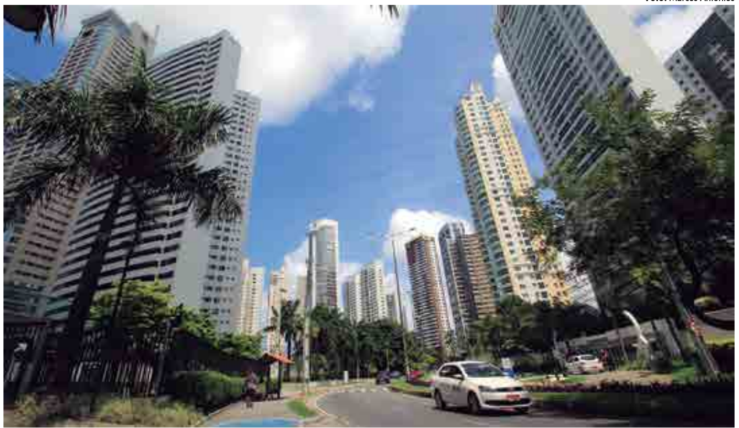
Condomínios mais caros da cidade estão nos bairros de Altiplano (foto), Cabo Branco, Tambaú, Manaíra, Cabo Branco, Tambauzinho e Bairro dos Estados