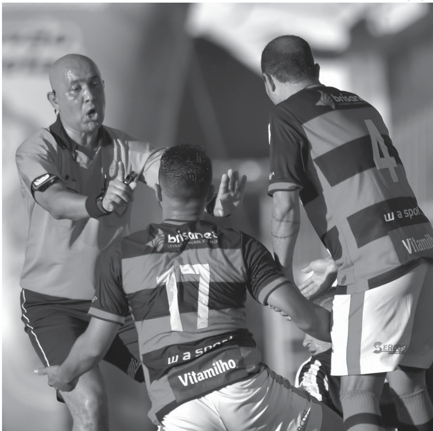
Jogadores do Campinense reclamando da arbitragem no jogo de sábado passado contra o Treze. O time até venceu por 1 a 0, mas o título ficou com o rival

“A expectativa é muito grande e positiva. Estou feliz em voltar a vestir mais uma vez essa camisa onde, na década de 90, eu estive com muito prazer e muita honra. Agora, retorno como treinador para um clube grande com uma imensa e apaixonada torcida. Para a Série D, o objetivo é colocar o Campinense em um patamar melhor em nível nacional, um lugar condizente com o que essa equipe representa. Acredito que com a união de todos com foco nesse projeto, no final de tudo, vamos conseguir o nosso objetivo. De nós, o torcedor pode ter certeza que não vai faltar empenho; se precisar, vamos suar sangue e fazer valer a máxima do Campinense que é a garra e a raça”, afirmou.