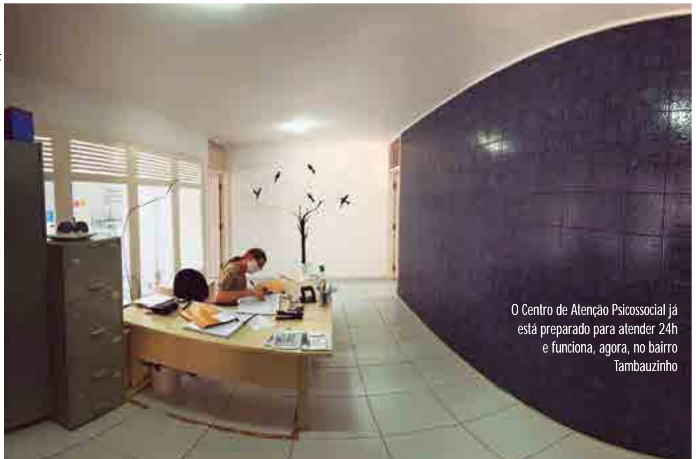
O Centro de Atenção Psicossocial já está preparado para atender 24h e funciona, agora, no bairro Tambauzinho