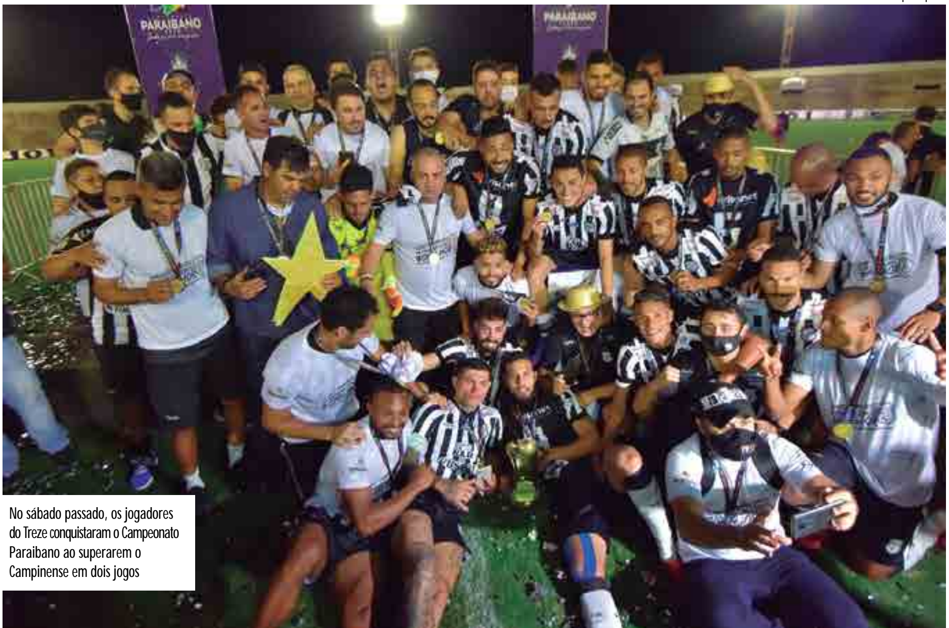
No sábado passado, os jogadores do Treze conquistaram o Campeonato Paraibano ao superarem o Campinense em dois jogos