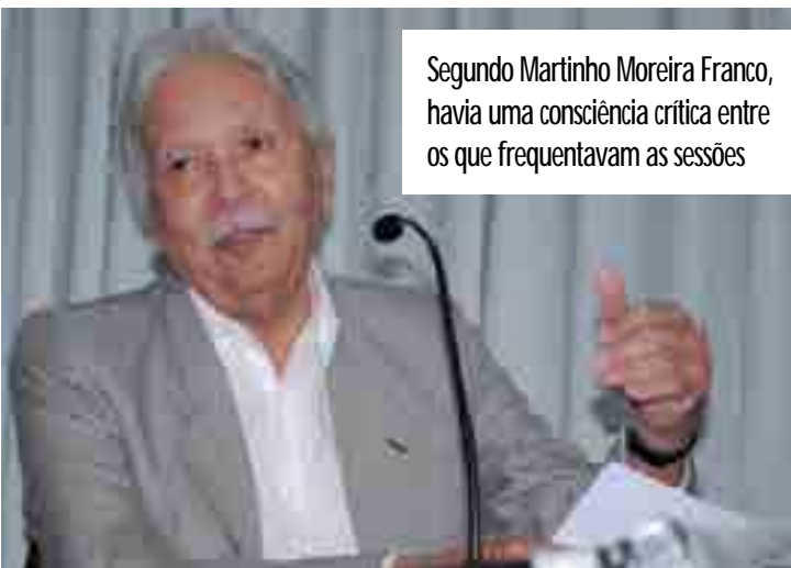
Segundo Martinho Moreira Franco, havia uma consciência crítica entre os que frequentavam as sessões

o cineclubismo exerceu papel didático. Muitos críticos de cinema foram formados nos cineclubes", apontou.