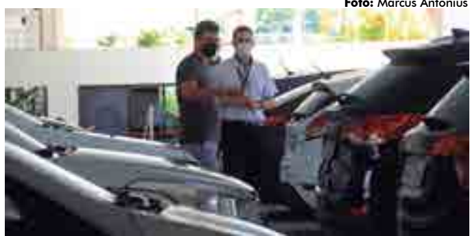
Média de vendas já está quase equivalente à do mesmo período de 2019

Em março, as vendas de automóveis tiveram o pior desempenho em 14 anos, com recuo de 21% sobre igual mês em 2019, segundo a Federação Nacional da Distribuição de Veículos Automotores (Fenabrade). Os meses de maio e abril foram igualmente difíceis para o setor que, na Paraíba, retornou as atividades no mês de junho. Segundo o relatório de distribuição da federação, o setor teve alta no mês de julho em relação aos meses anteriores. No acumulado do ano, entretanto, houve queda de 35,64% nos cinco primeiros meses se comparado ao igual período de 2019.