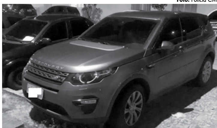
Quadrilha “guardava” veículo roubado em estacionamento de supermercado

Com o trio, os policiais militares da Companhia Especializada em Apoio ao Turista (CEATur) apreenderam uma pistola com numeração raspa-