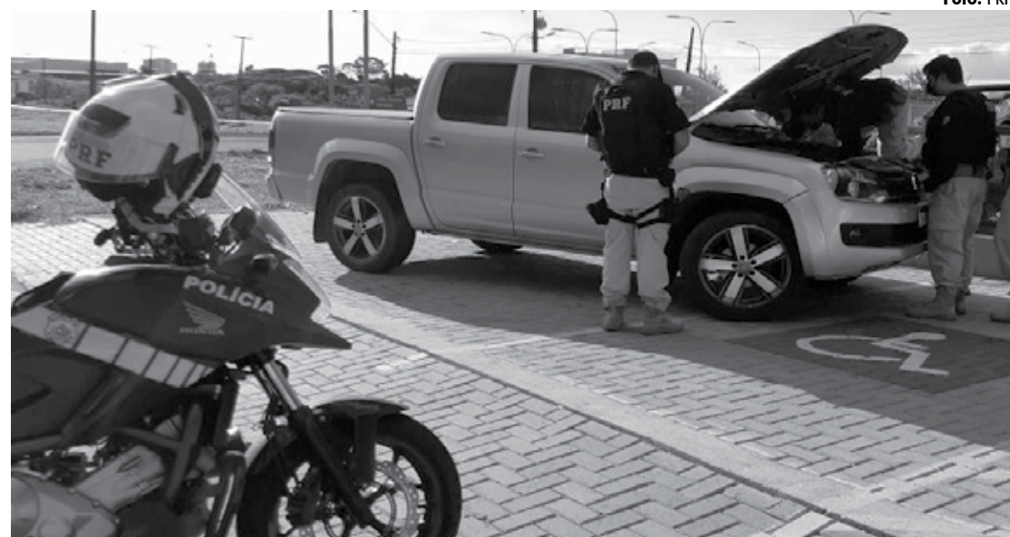
A caminhonete Amarak foi roubada em Goiás e estava circulando com placas de outro veículo de Pernambuco

Em outras ações nas rodovias da Paraíba, a Polícia Rodoviária prendeu um casal com dois quilos de maconha. A ação aconteceu no posto da PRF em Bayeux. A droga estava no porta-malas de um veículo Chevrolet Cobalt tinha como origem o Estado de Pernambuco e seria entregue em Bayeux. A droga estava dentro de uma caixa de papelão. O casal confessou que pegou a droga na cidade de Custódia (PE). O homem de 31 anos e a mulher de 18 anos foram detidos, conduzidos à Polícia Civil e deverão responder pelo crime de tráfico de drogas.