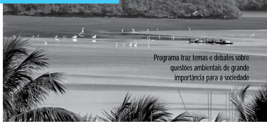
Programa traz temas e debates sobre questões ambientais de grande importância para a sociedade