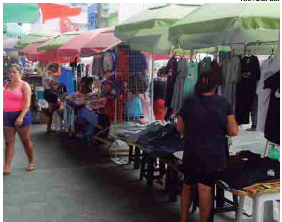
A categoria não tem carga horária fixa, férias, décimo terceiro salário, ou outros benefícios assistenciais

///O número de empregados sem carteira assinada subiu 4% na média anual no Brasil, o que representa mais 446 mil pessoas em 2019 ///