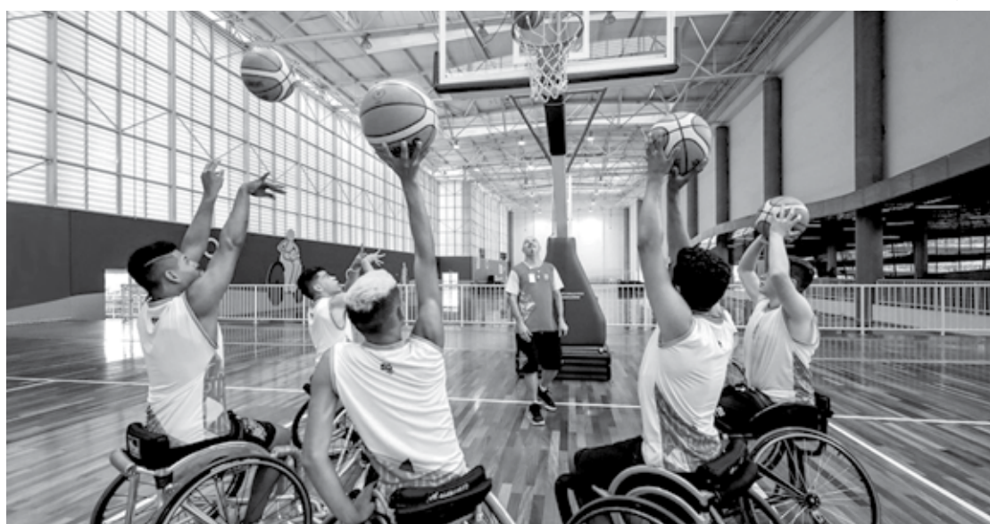
O camping escolar reuniu 112 jovens em idade escolar em diversas modalidades, como o basquete em cadeiras de roda