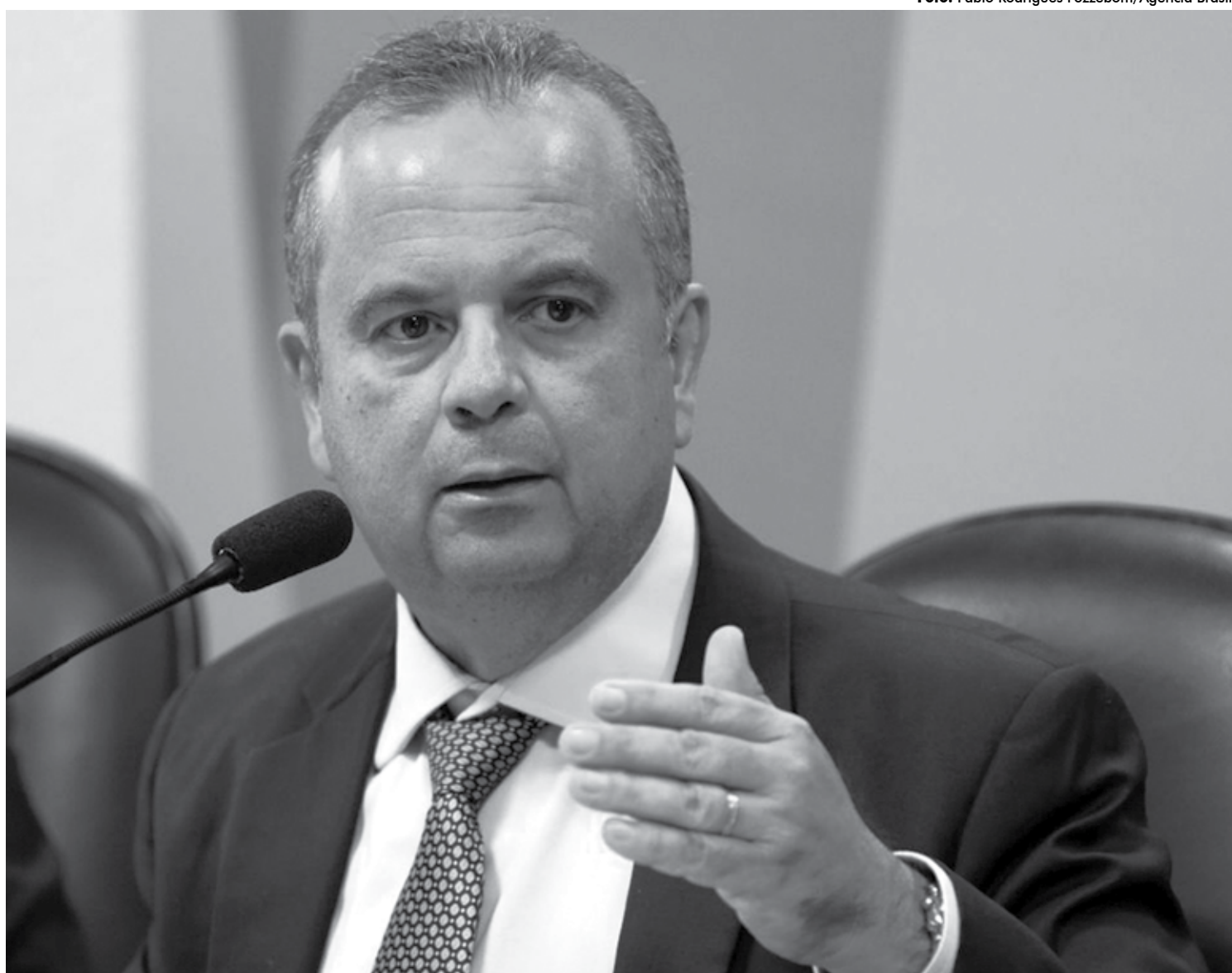
Rogério Marinho, que ocupava a Secretaria Especial de Previdência e Trabalho do Ministério da Economia, será o novo ministro do Desenvolvimento Regional