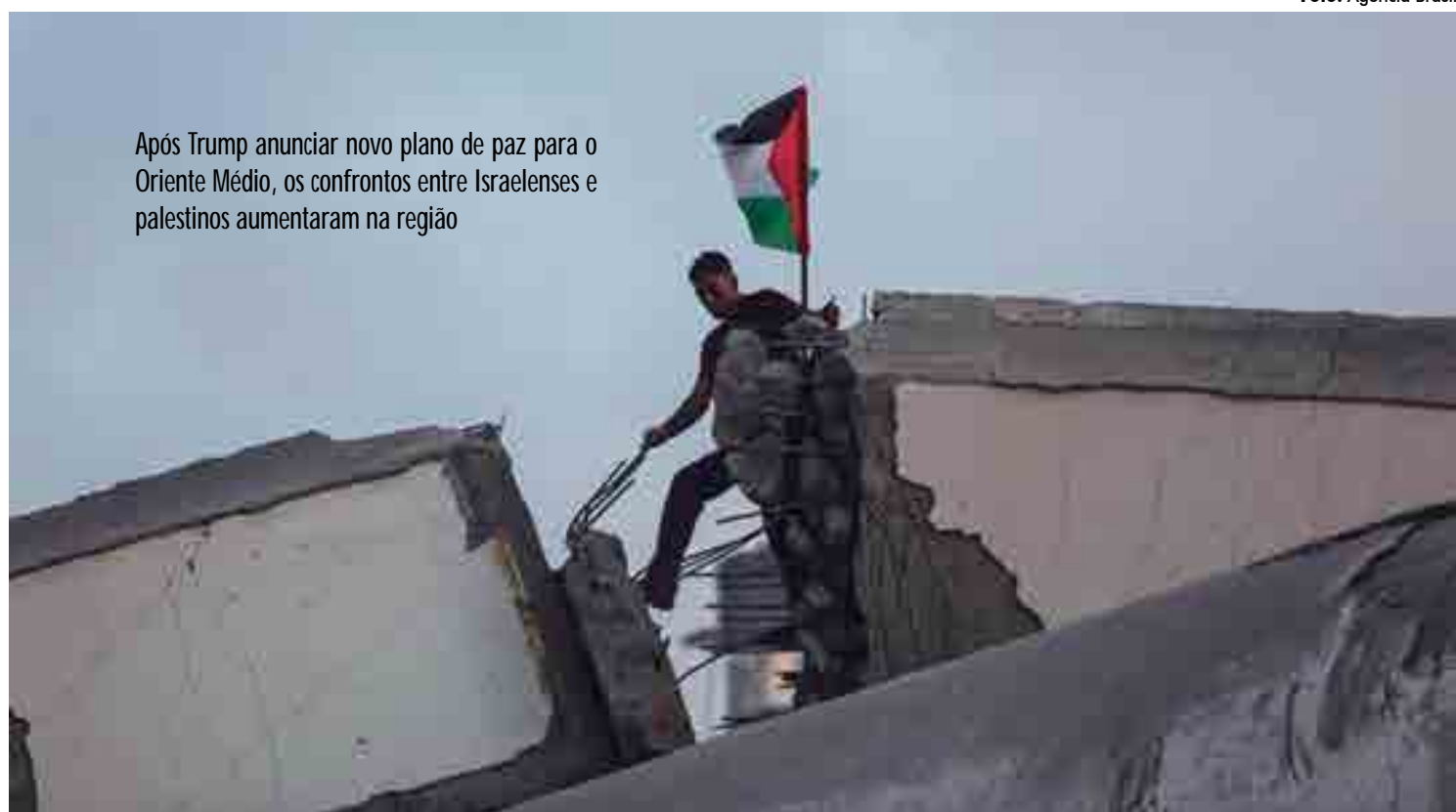
Após Trump anunciar novo plano de paz para o Oriente Médio, os confrontos entre israelenses e palestinos aumentaram na região

Por outro lado, a proposta foi imediatamente elogiada por Israel, já que garante um poder cada vez maior sobre grande parte do Vale do rio