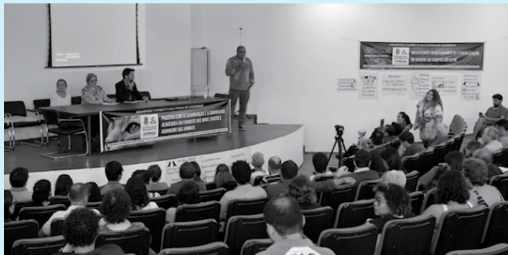
Campanhas de adoção e o reforço de parceria com o Centro de Zoonoses serão algumas das ações