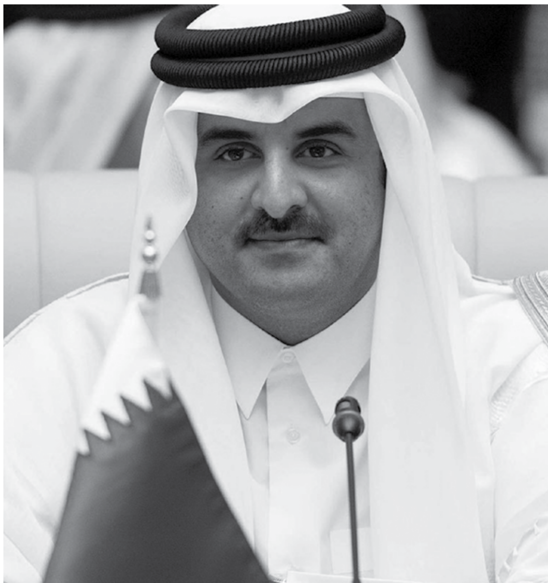
Emir Xeque Tamim Bin Hamad Al Thani é o principal responsável pelo alto investimento do Qatar no futebol