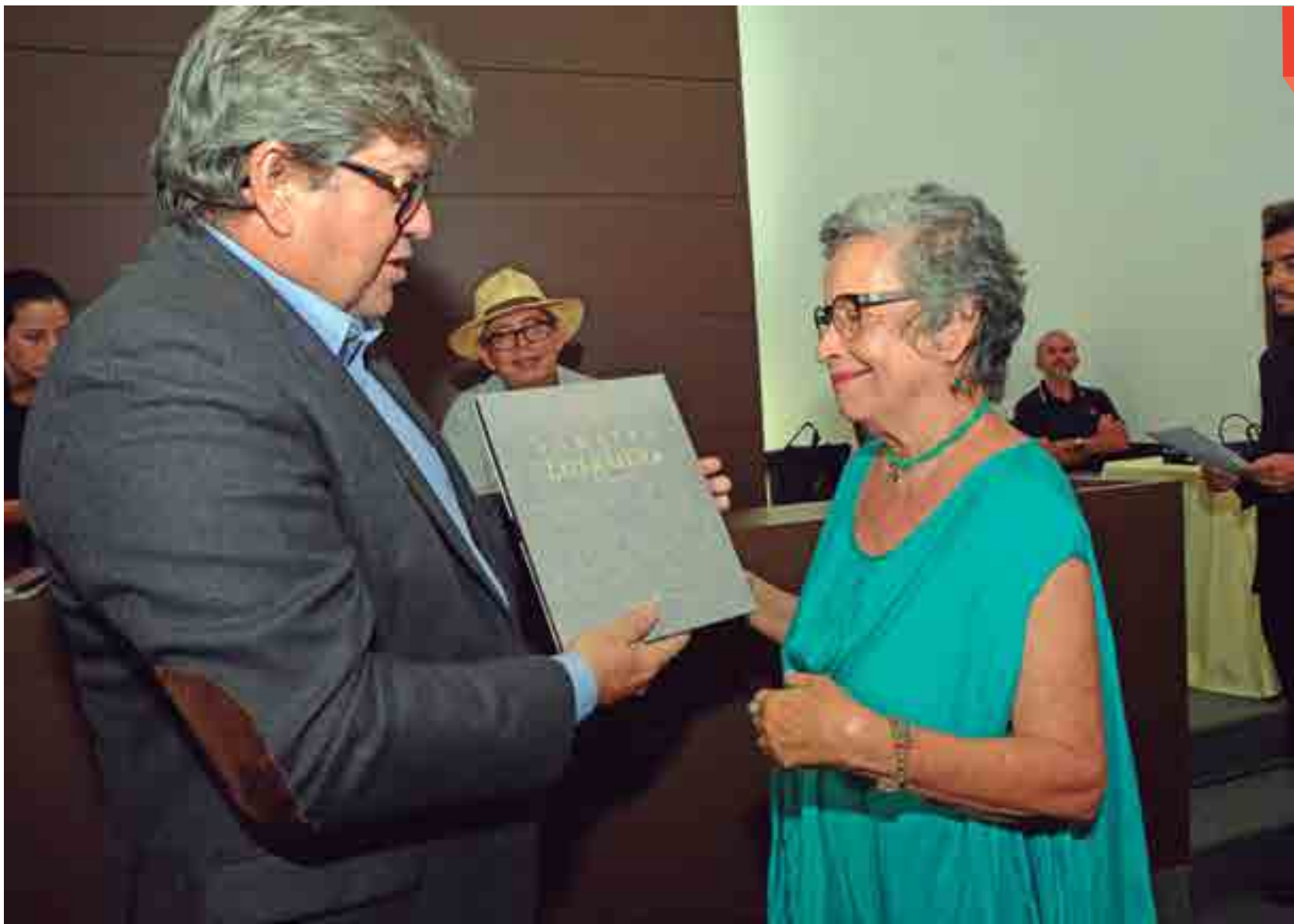
Noite teve ainda o lançamento do livro Paraíba na Literatura e a agenda Paraíba: um estado de arte, com homenagens a escritores e artistas visuais do passado e do presente