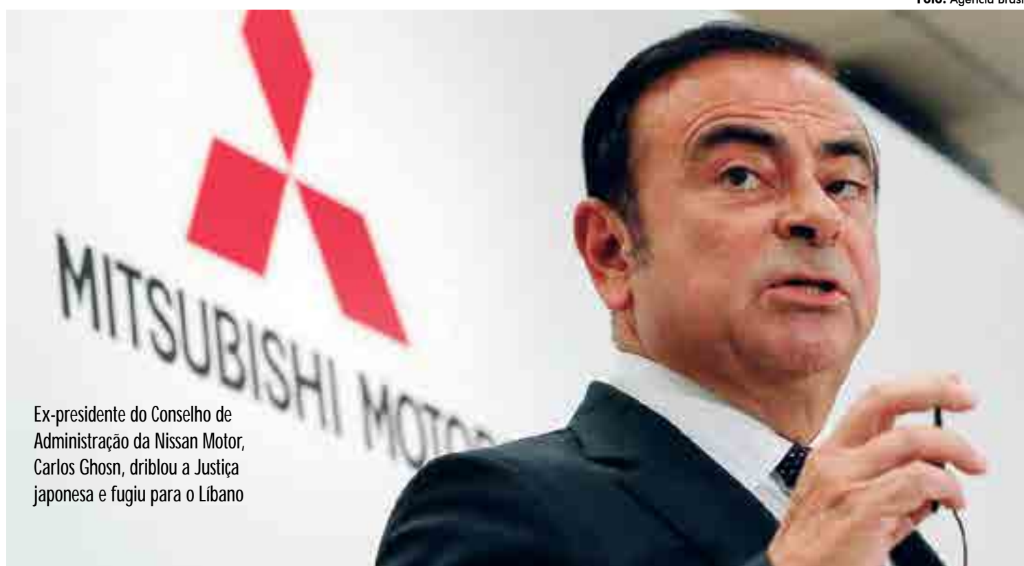
Ex-presidente do Conselho de Administração da Nissan Motor, Carlos Ghosn, driblou a Justiça japonesa e fugiu para o Líbano

O jornal citou fontes que teriam dito que o plano envolveu uma equipe de 10 a 15 pessoas de distintas nacionalidades. Também disse que os membros da equipe fizeram mais de 20 viagens ao Japão, onde visitaram no