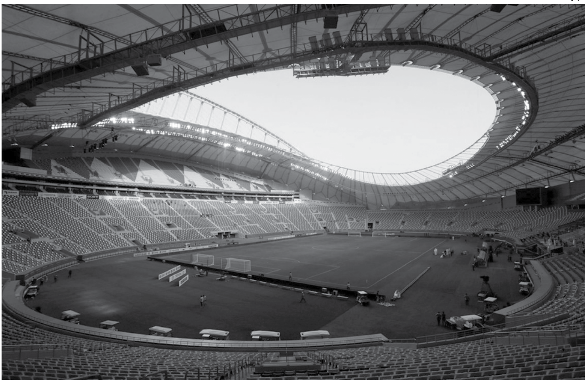
Khalifa Stadium recebeu o nome do ex-emir, Hamed bin Khalifa Al Thani, pai do xeque Tamim; arena já recebeu a final do Mundial de Clubes e será mantida como principal estádio do país após a Copa

O Qatar quer aproveitar a Copa do Mundo de 2022 para melhorar a imagem do país, tido como conservador e que não respeita os direitos humanos