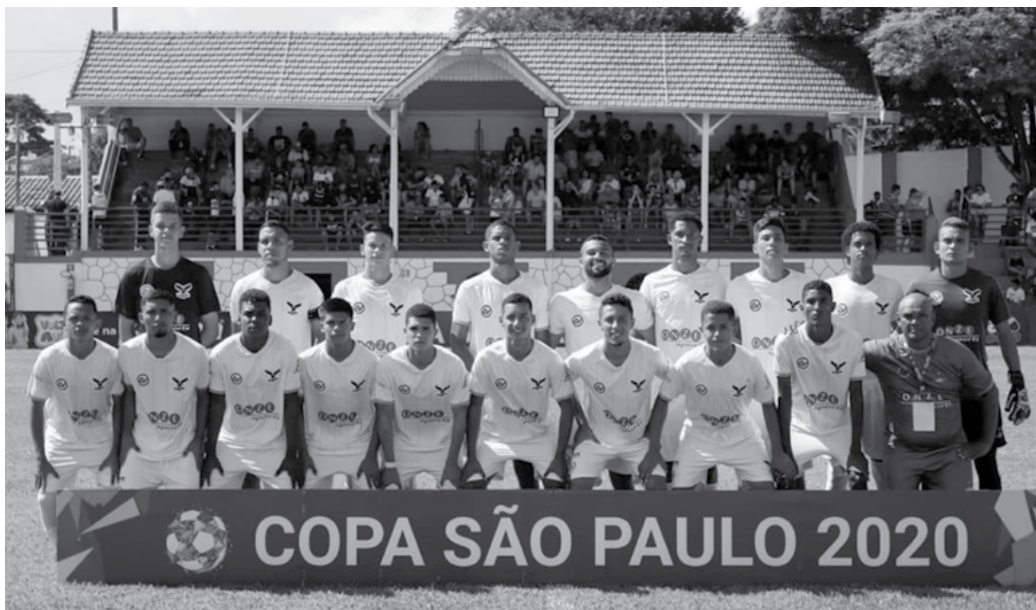
A Perilima depende apenas dela para conseguir se classificar para a próxima fase da Copa São Paulo; precisa só vencer o Cuiabá-MT nesta quinta-feira