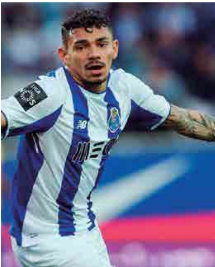
Atacante Soares está em evidência no clube português e interessa a italianos