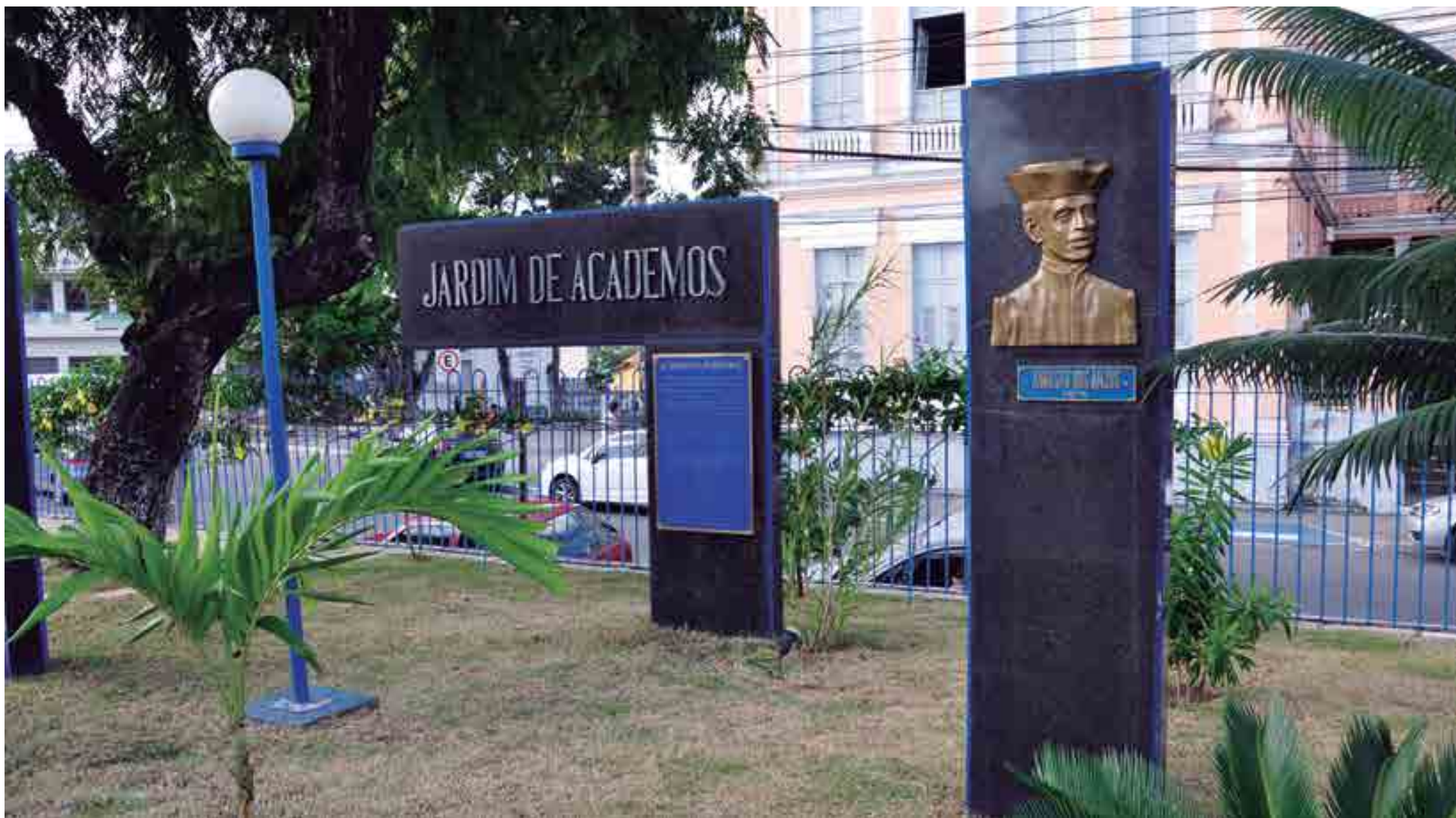
Sede da Academia Paraibana de Letras, na Rua Duque de Caxias, em João Pessoa: entidade realiza, na manhã de hoje, eleição para escolher o novo imortal a ocupar a cadeira de número 40, cujo patrono é Cândido Firmino Mello Leitão