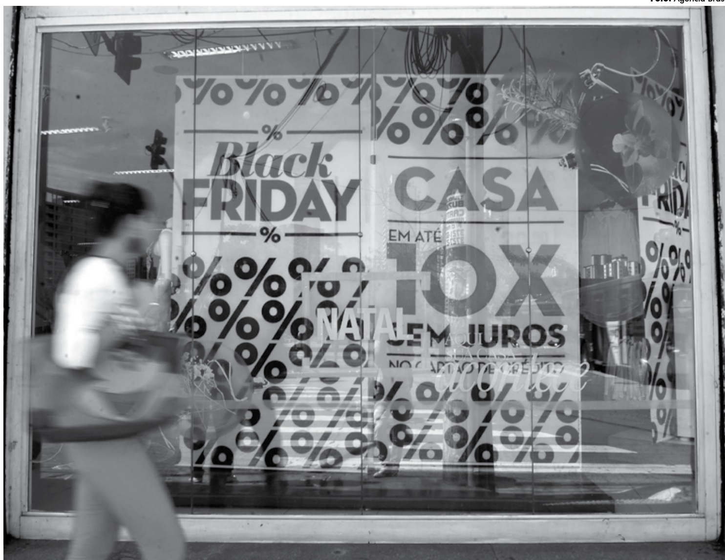
Impulsionadas pela Black Friday, as vendas no varejo subiram 0,6% em novembro sobre outubro. O índice, no entanto, ficou abaixo das expectativas

Houve frustração em relação ao ritmo da recuperação da atividade econômica no último trimestre de 2019, segundo os investidores