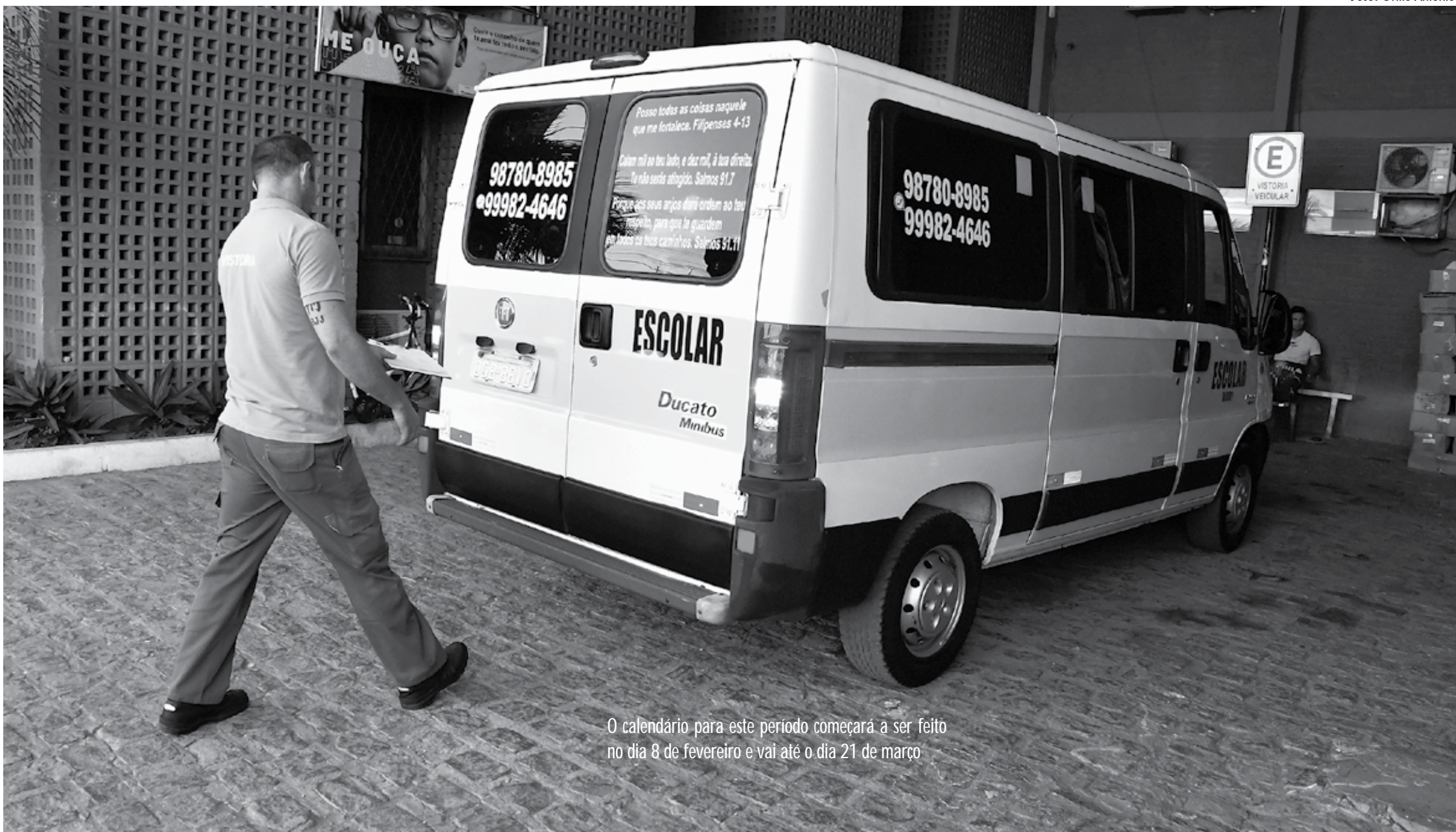
O calendário para este período começará a ser feito no dia 8 de fevereiro e vai até o dia 21 de março