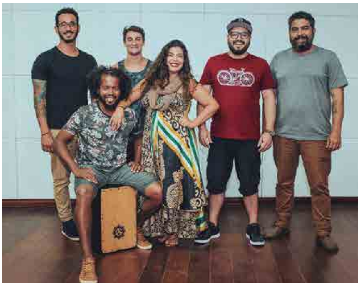
Berimbaobab (acima) abre a noite, amanhã, com show especial que reúne trabalhos solos dos integrantes; em seguida, Os Eloquentes (ao lado) anima o projeto com sua mistura de reggae e música pop