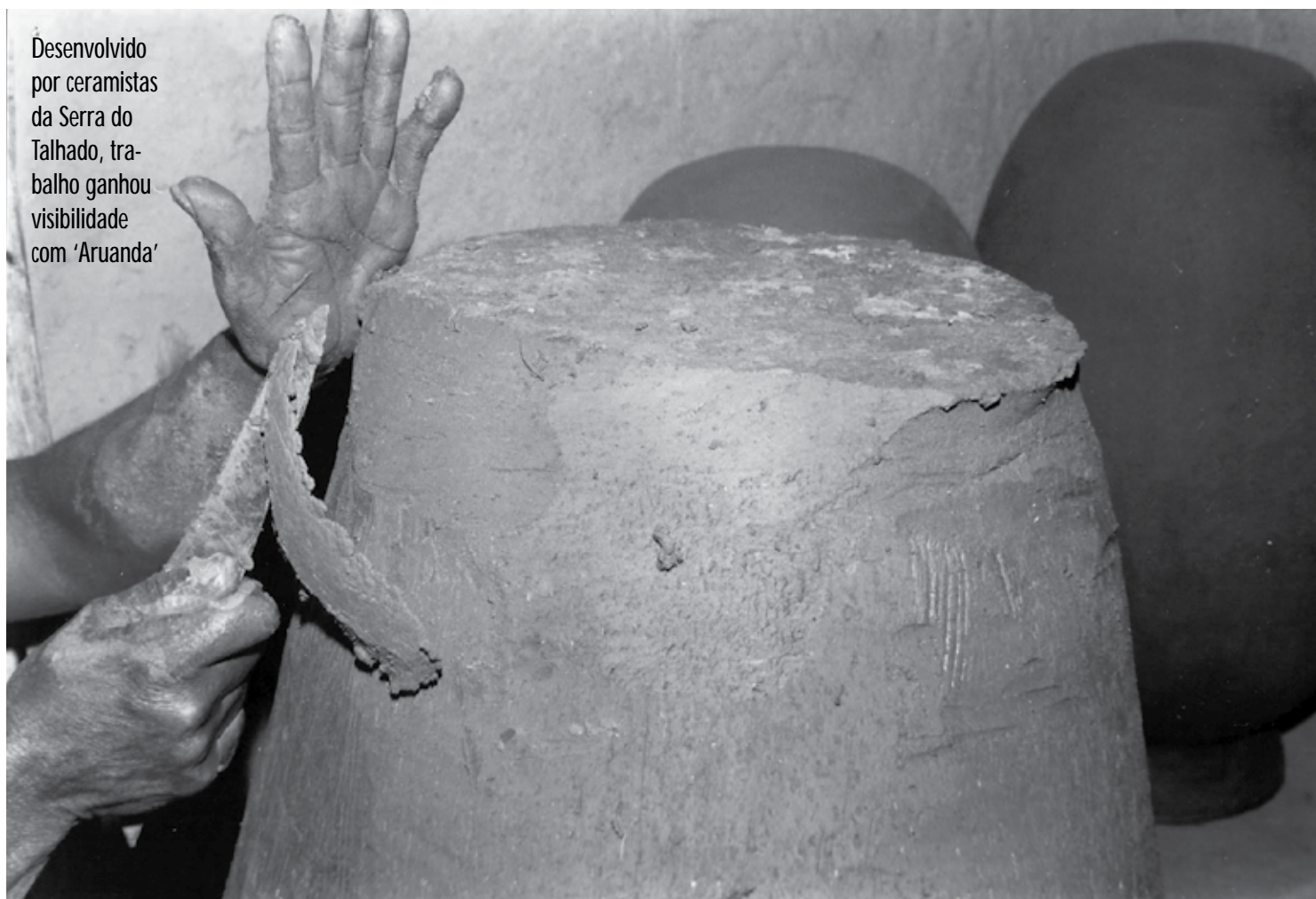
Desenvolvido por ceramistas da Serra do Talhado, trabalho ganhou visibilidade com 'Aruanda'