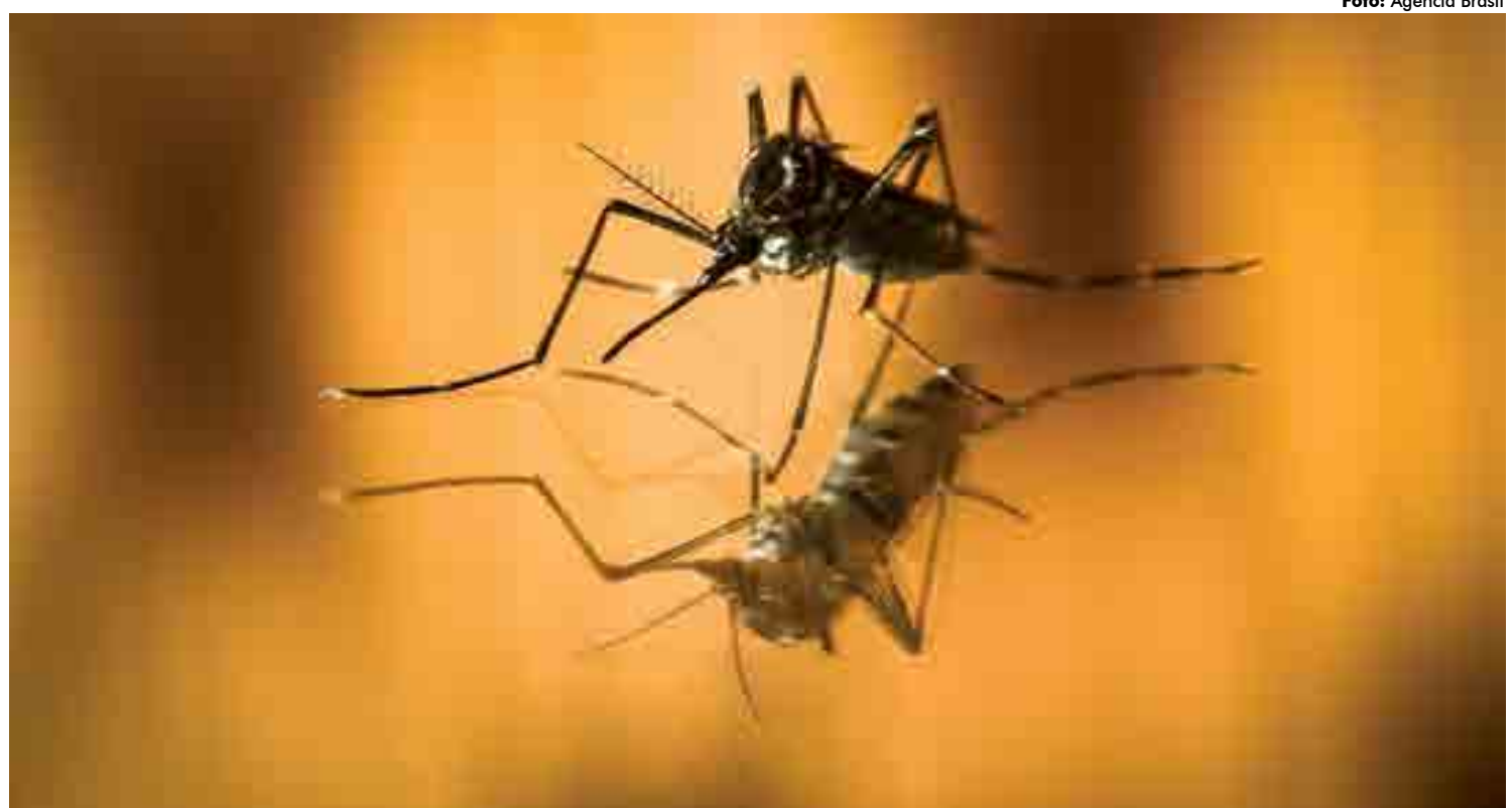
SES vai mapear os casos com a ajuda dos municípios. Em João Pessoa, a Vigilância vai realizar rastreamento em alguns bairros a partir da próxima semana

A Paraíba acompanhou a tendência nacional com o aumento de casos de dengue ano passado em relação ao ano de 2018