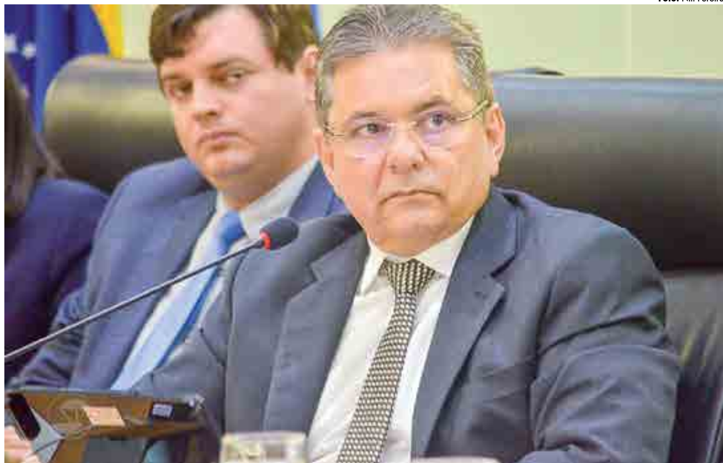
Segundo o presidente da Assembleia Legislativa Adriano Galdino (PSB), a aprovação da Fundação de Saúde é um dos principais temas desse semestre

No que se refere à matéria que trata da criação da Fundação de Saúde, Adriano Galdino afirmou que essa certamente precisará ser a prioridade das prioridades. “Trata-se de uma pauta que permitirá ao Governo transferir, das OS para a nova fundação, o gerenciamento dos hospitais do Estado”, explicou.