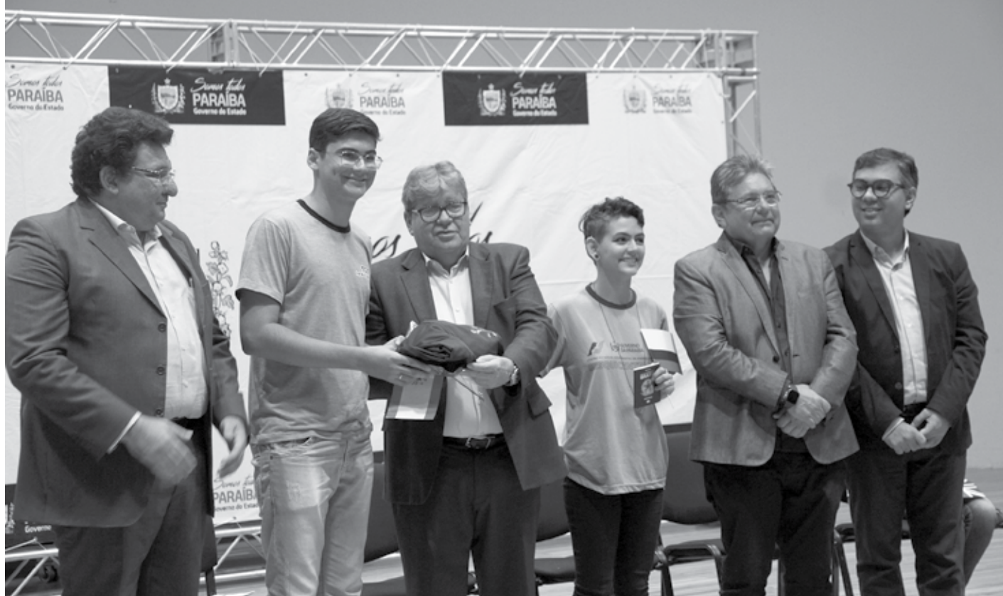
Governador fez a entrega simbólica do passaporte e do kit de viagem e anuncia que 400 estudantes terão a oportunidade de participar do programa