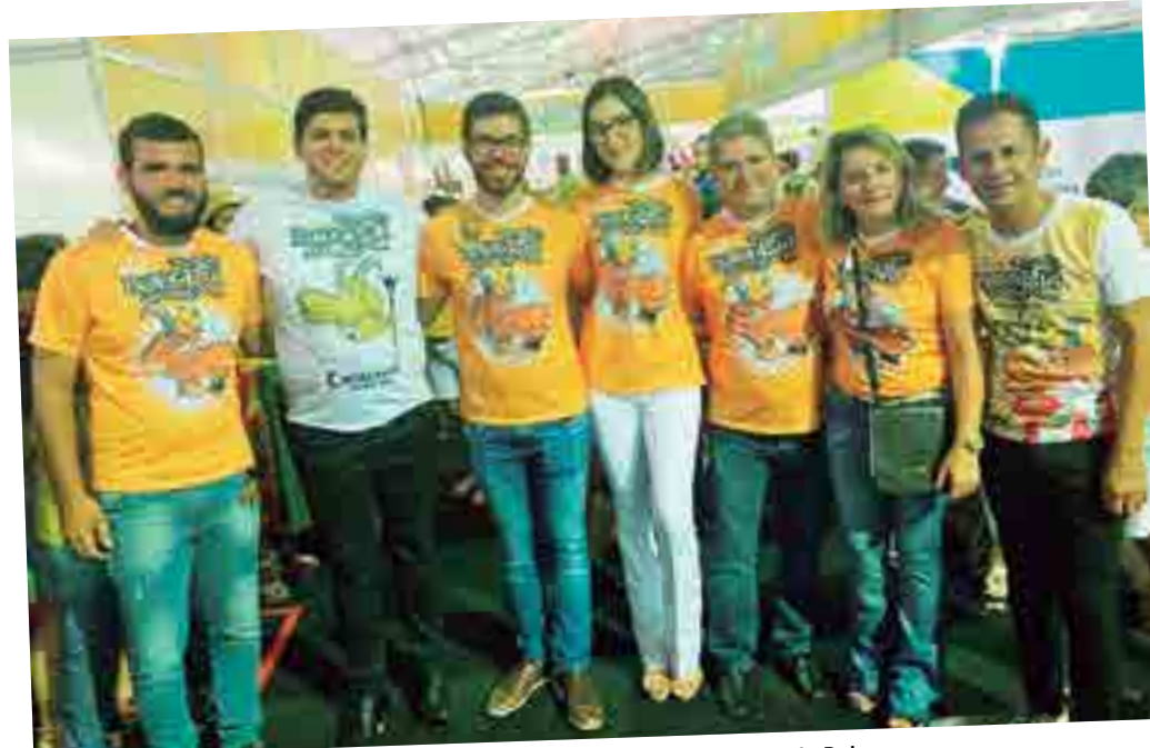
Toda a equipe organizadora da Festa do Bode Rei