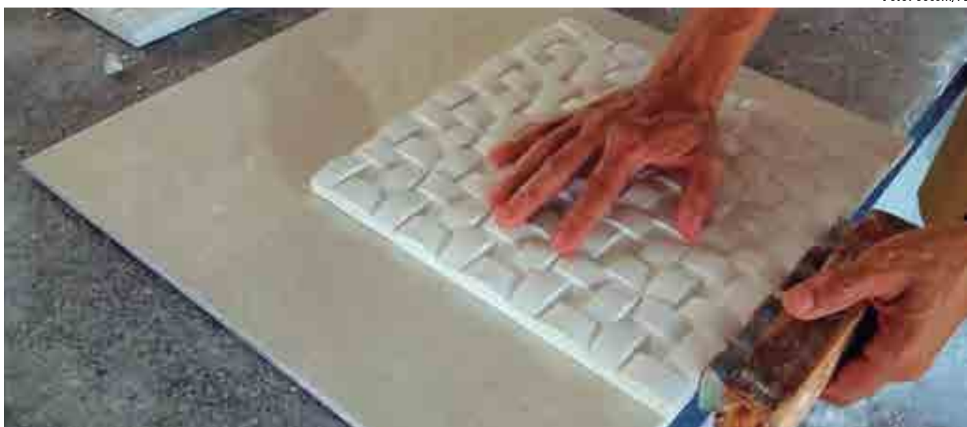
O trabalho, através da implantação de fábricas e oficinas em presídios, é um dos eixos da política do governo para ressocialização de apenados