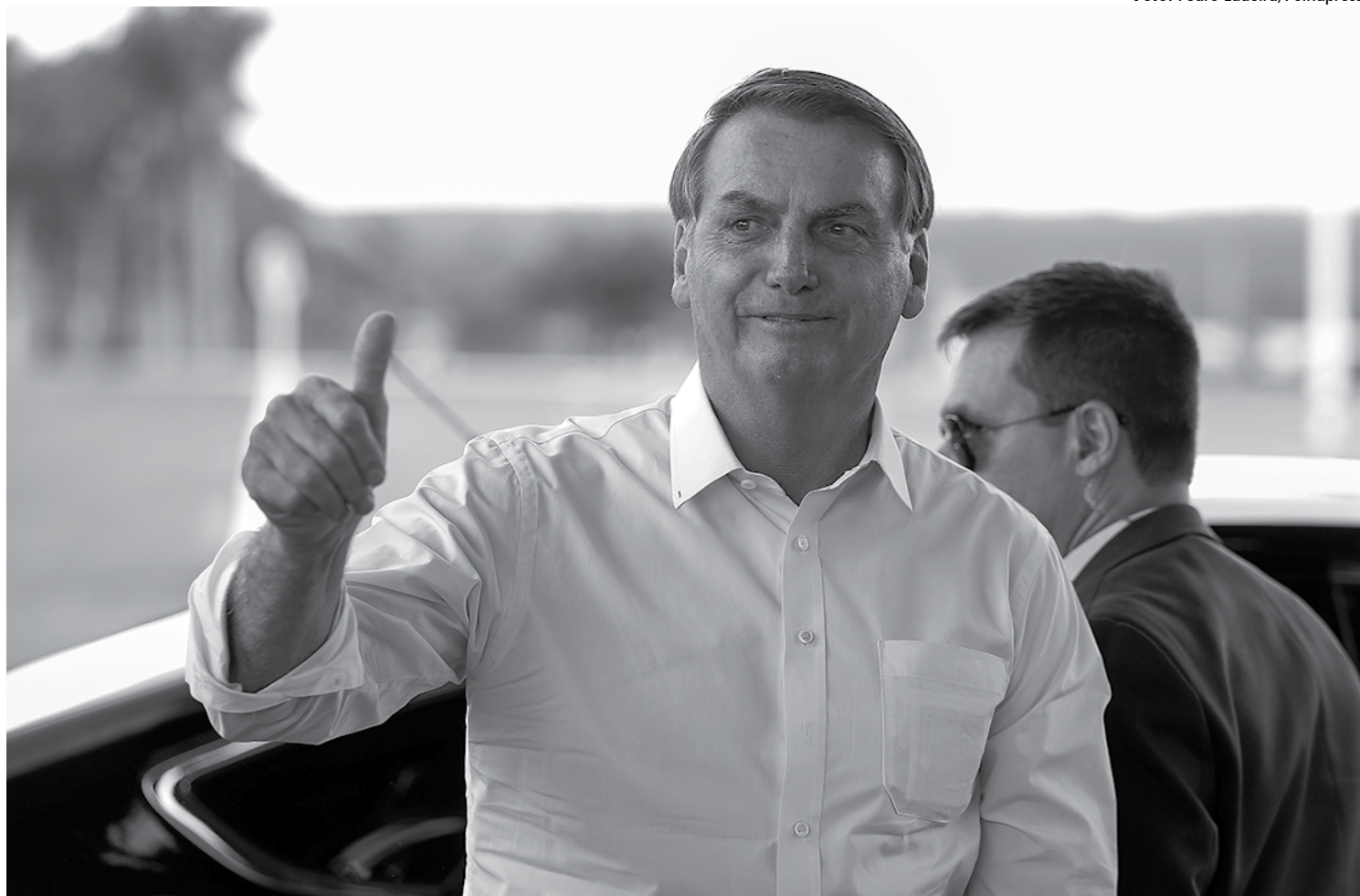
Bolsonaro admitiu que não há chances de viabilizar a Aliança pelo Brasil para disputar as eleições municipais deste ano e prefere ficar de fora do pleito

"Às vezes você elege um cara em uma capital aí, se o cara fizer besteira, você vai apanhar na campanha de 2022 todinha", disse Bolsonaro em dezembro, quando recebeu jornalistas no Palácio do Alvorada.