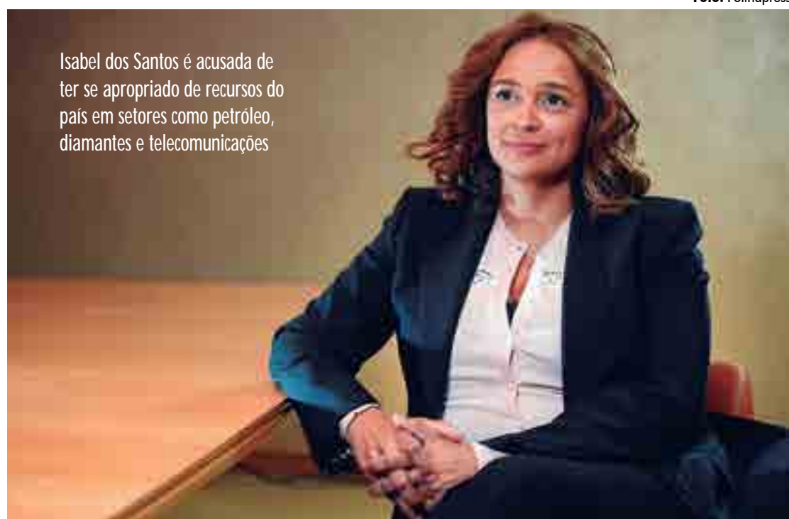
Isabel dos Santos é acusada de ter se apropriado de recursos do país em setores como petróleo, diamantes e telecomunicações