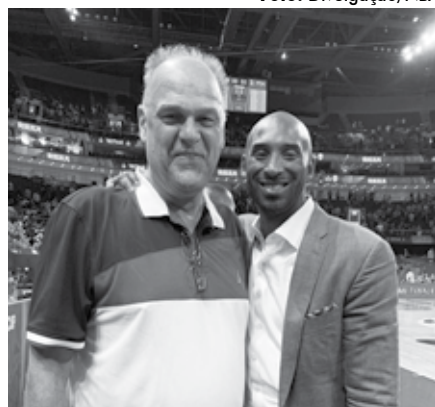
Oscar e Kobe em jogo das estrelas da NBA

///Uma grande perda para o mundo da bola laranja. Kobe nos deixa um grande legado. Um dos maiores da história, que hoje e sempre servirá de inspiração para todos os apaixonados por basquete. R.I.P ///