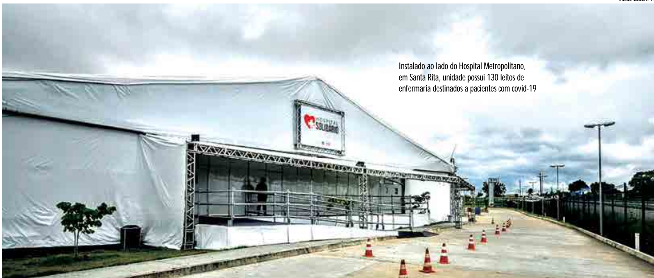
Instalado ao lado do Hospital Metropolitano, em Santa Rita, unidade possui 130 leitos de enfermaria destinados a pacientes com covid-19