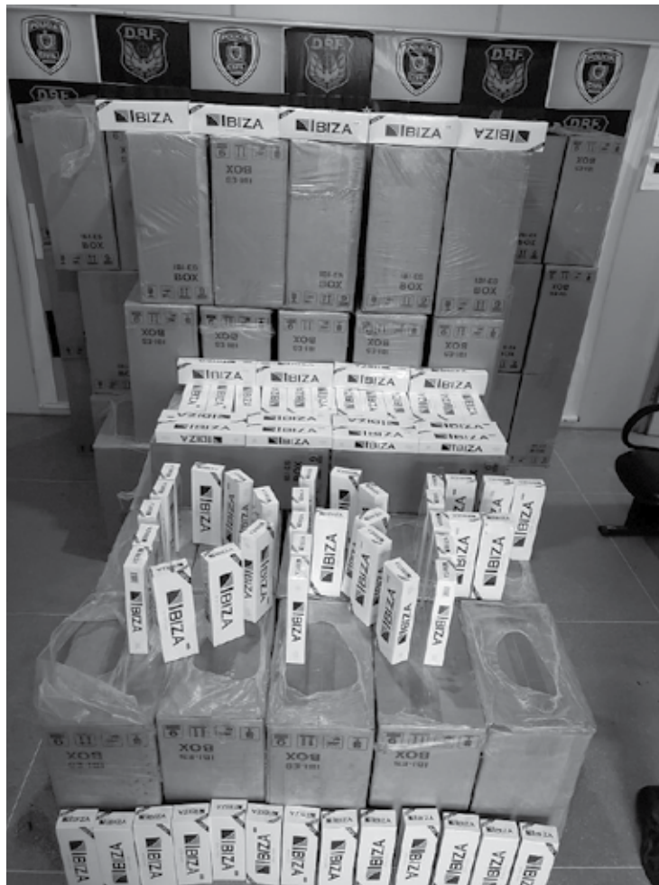
As carteiras de cigarros estavam escondidas em um depósito em Queimadas