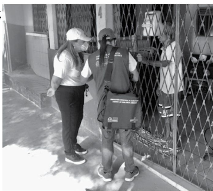
Os profissionais estão divididos em 40 equipes e, em duplas, visitam as casas