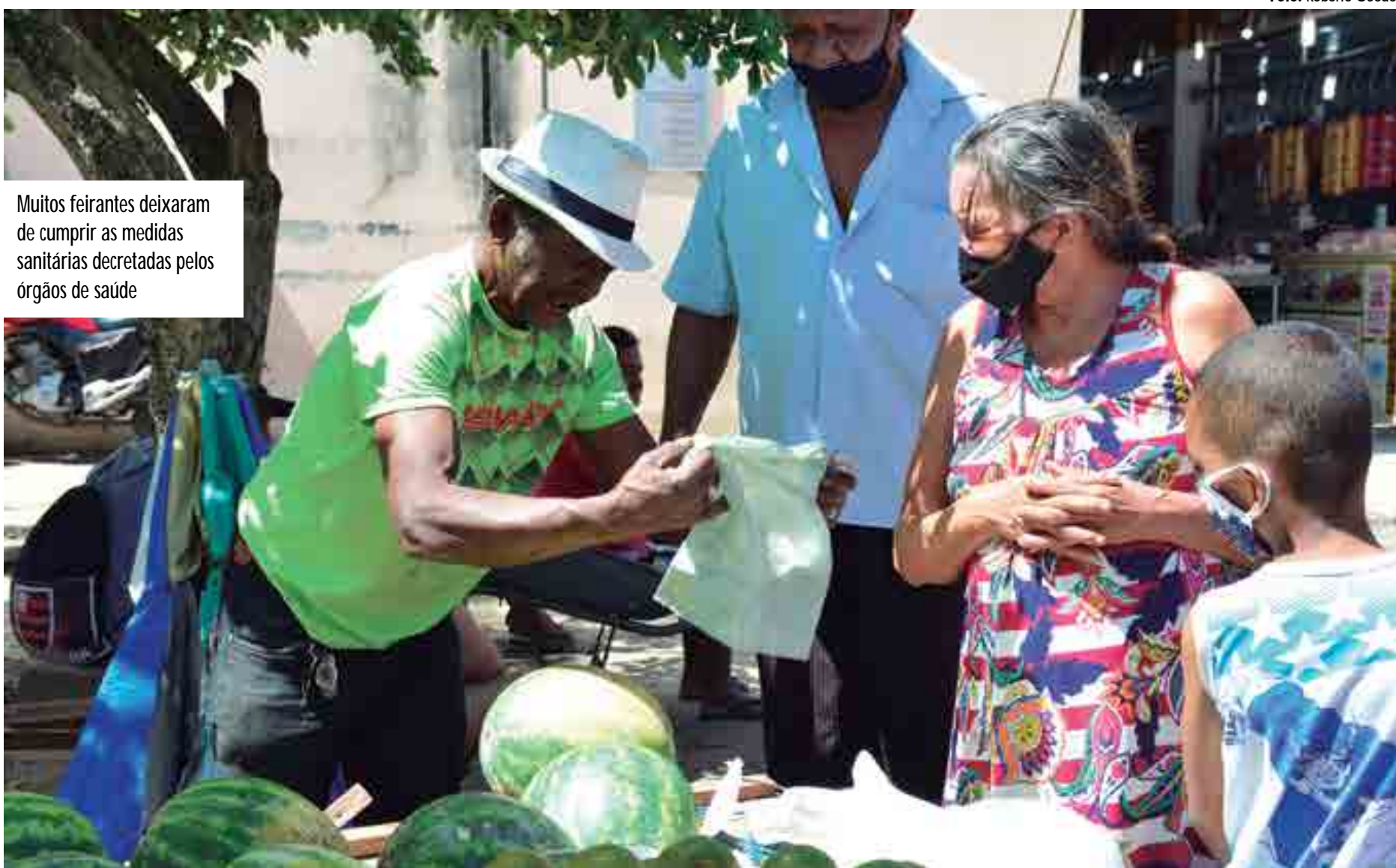
Muitos feirantes deixaram de cumprir as medidas sanitárias decretadas pelos órgãos de saúde

Para os clientes, as novas medidas são essenciais e de-