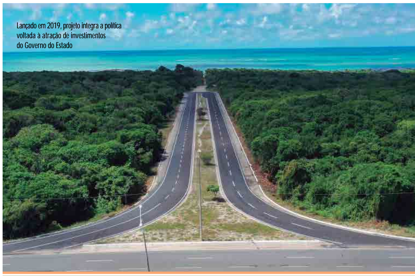
Lançado em 2019, projeto integra a política voltada à atração de investimentos do Governo do Estado

Nesta segunda etapa, estão sendo oferecidos cinco lotes que contemplam, além do setor urbanístico hoteleiro, áreas para comércio, serviços e animação turística. Página 3