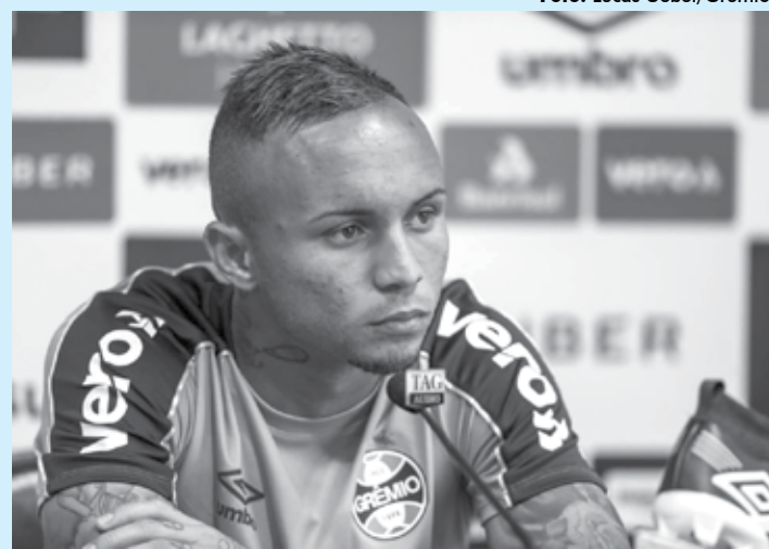
Everton Cebolinha continua sendo o principal jogador do time gaúcho

Além do atacante gremista, Jorge Jesus teria também indicado Gérson, Willian Arão e Bruno Henrique, todos do Flamengo, para o Benfica, que perdeu o título da atual temporada para o Porto.