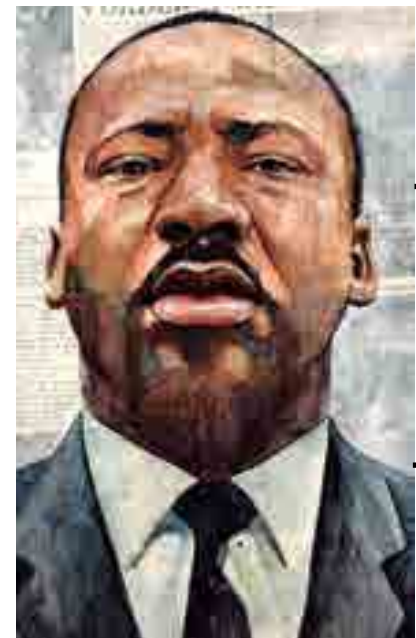
Martin Luther King em abril de 1967, um ano antes de sua morte

Melancolia é uma tristeza causada por um passado perdido, mesmo recente. Nostalgia é o desejo de voltar a esse ou outro passado. Saudade é uma mistura disso tudo e até um tanto mais.