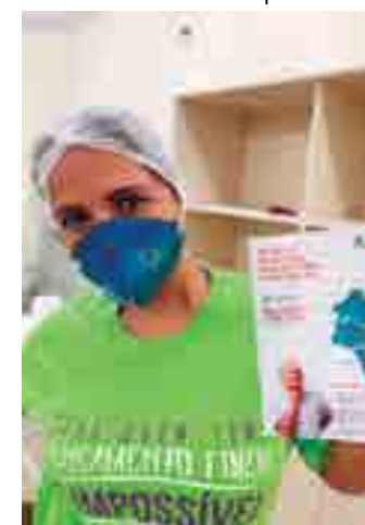
Ação busca informar sobre o tratamento da doença

Segundo dados disponibilizados pelo Instituto Nacional de Câncer, há uma estimativa de 510 casos de câncer de cabeça e pescoço em homens e também 510 casos em mulheres em todo o Estado da Paraíba. Desses números, cerca de 110 casos em homens e 70 em mulheres seriam em João Pessoa. O câncer de cabeça e pescoço se trata de tumores que podem estar localizados na boca, faringe, laringe, glândulas salivares, cavidade nasal, tireóide, dentre outras.