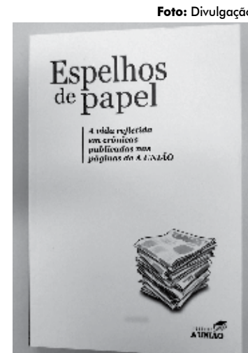
'Espelhos de Papel', obra que reúne 57 textos de cronistas do Jornal 'A União'

O livro Espelhos de Papel dá vida a essas criações literárias adormecidas nas páginas do jornal. Iniciativa louvável.