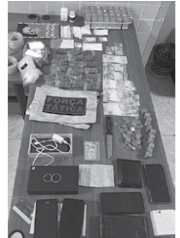
Material recolhido pela polícia